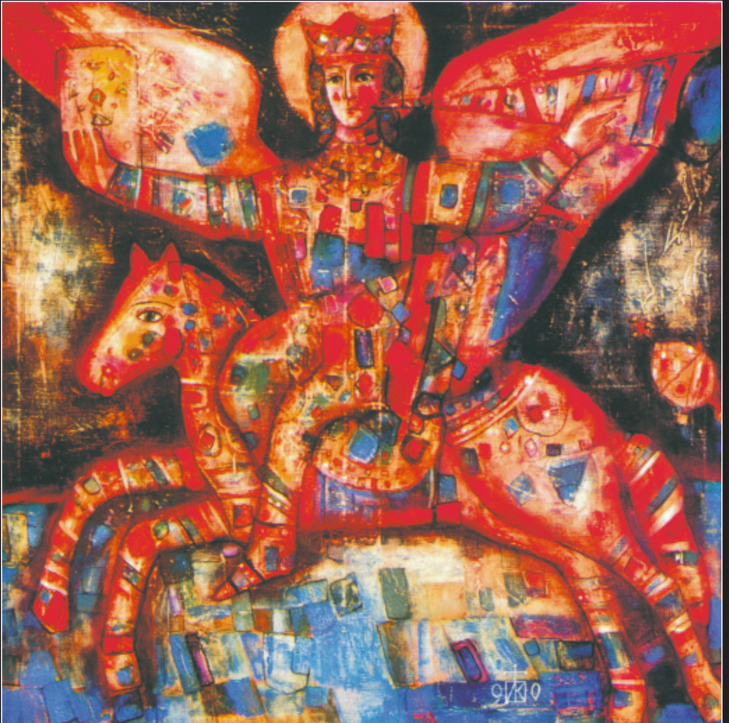
И. Кислицын. Архангел Михаил. 1990