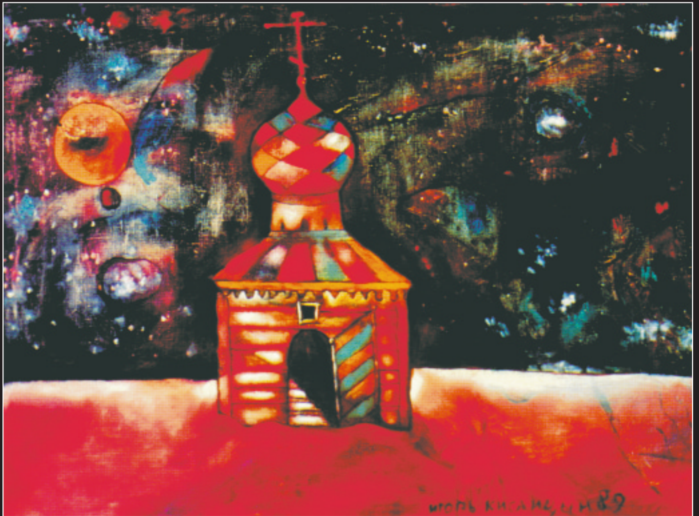
И. Кислицын. Рождественская ночь. 1989