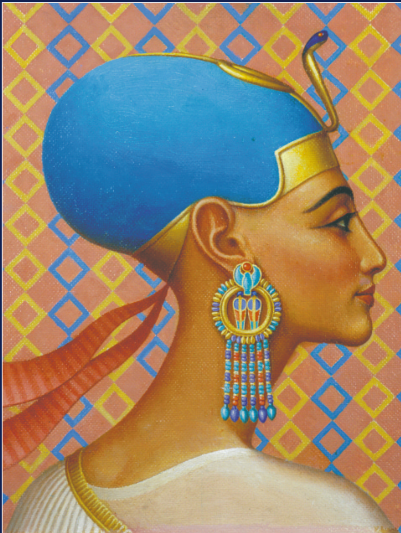
М. Потапов. Портрет Меритатон, старшей дочери Эхнатона. 1987