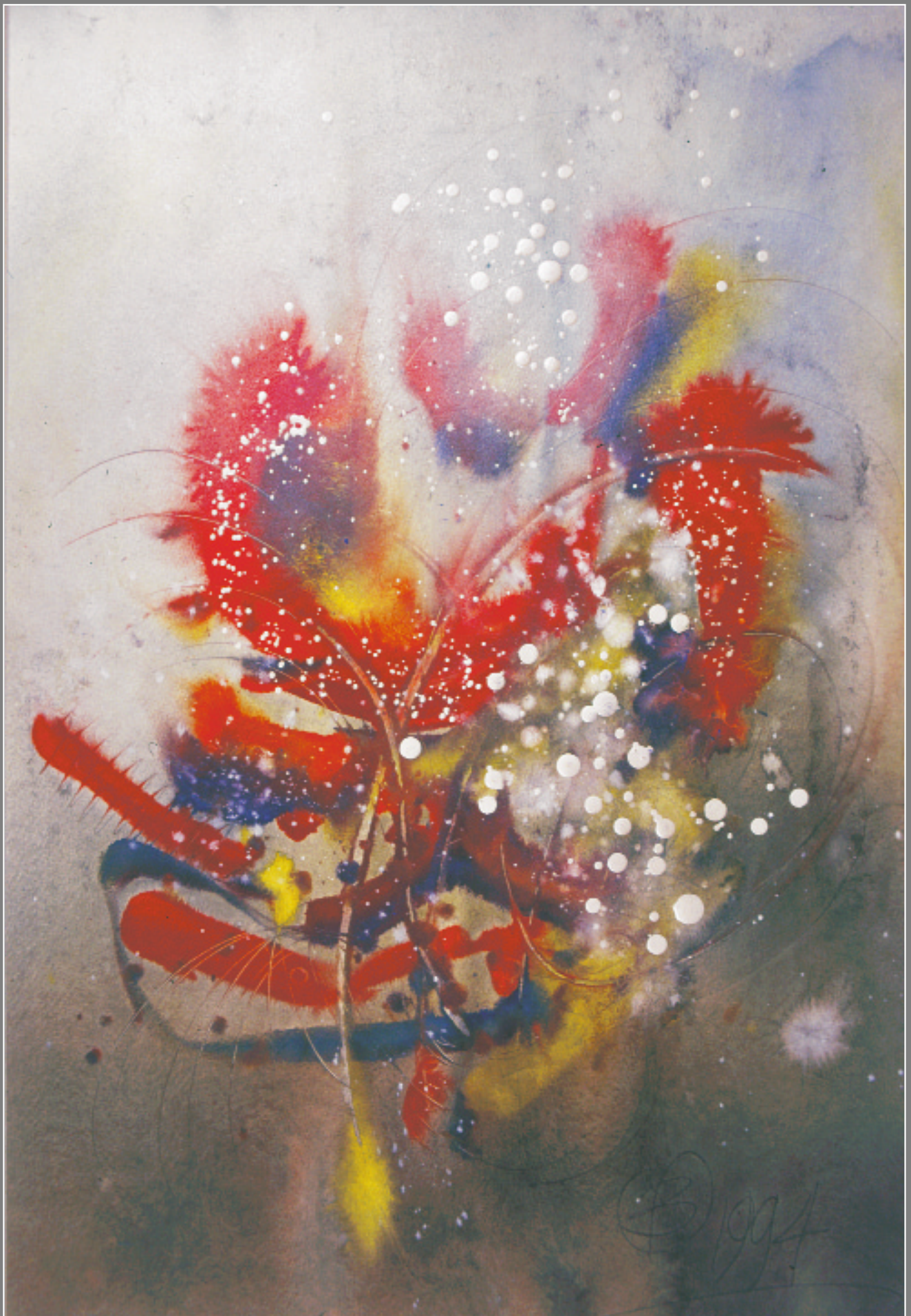
О. Высоцкий. Проявление природы. 1994