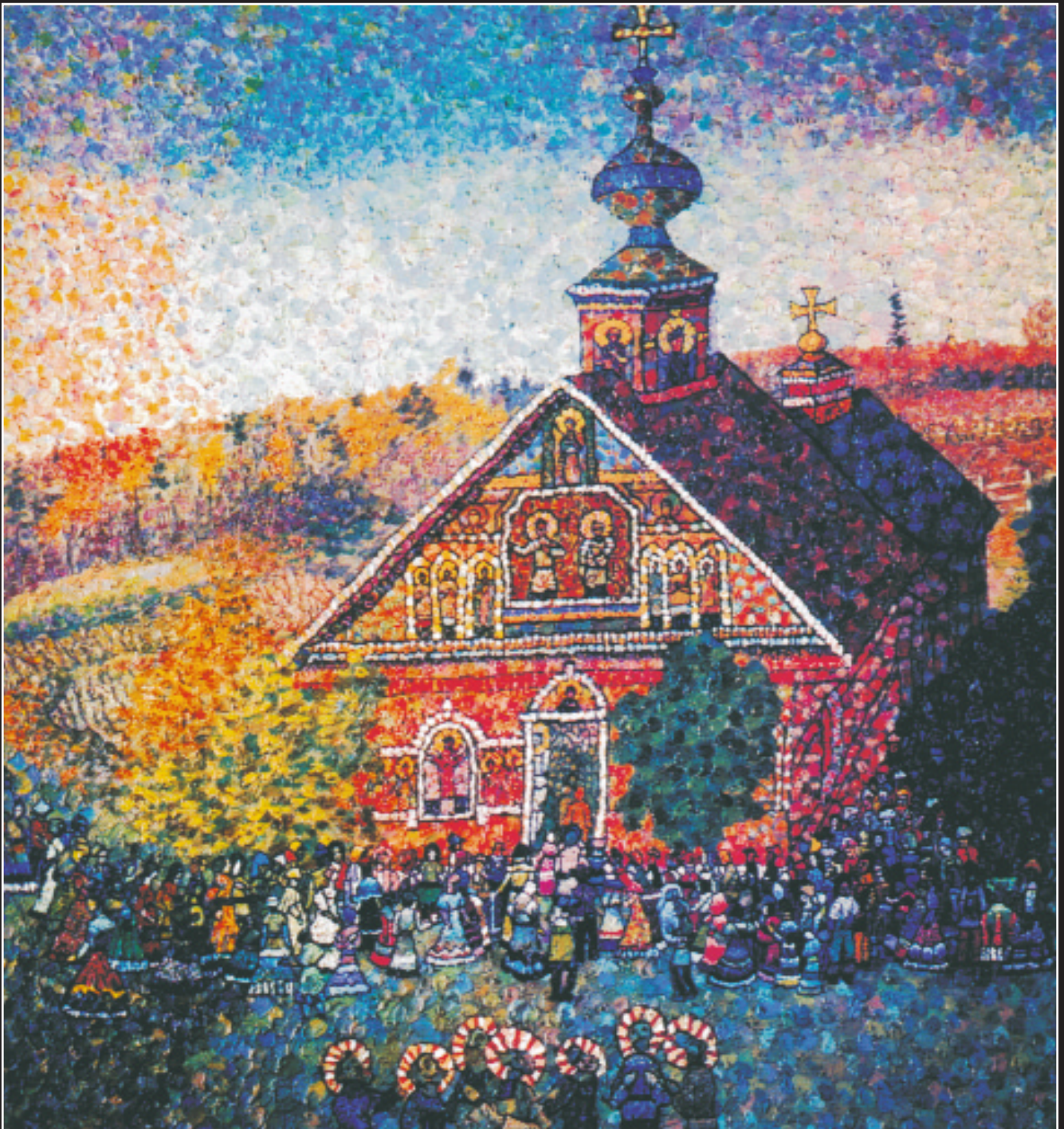
А. Харитонов. Праздник. 1987