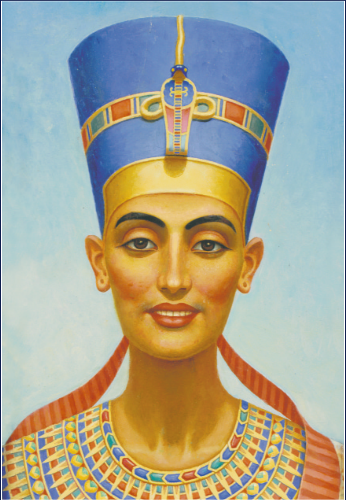
М. Потанов. Портрет царицы Нефертити. 1995