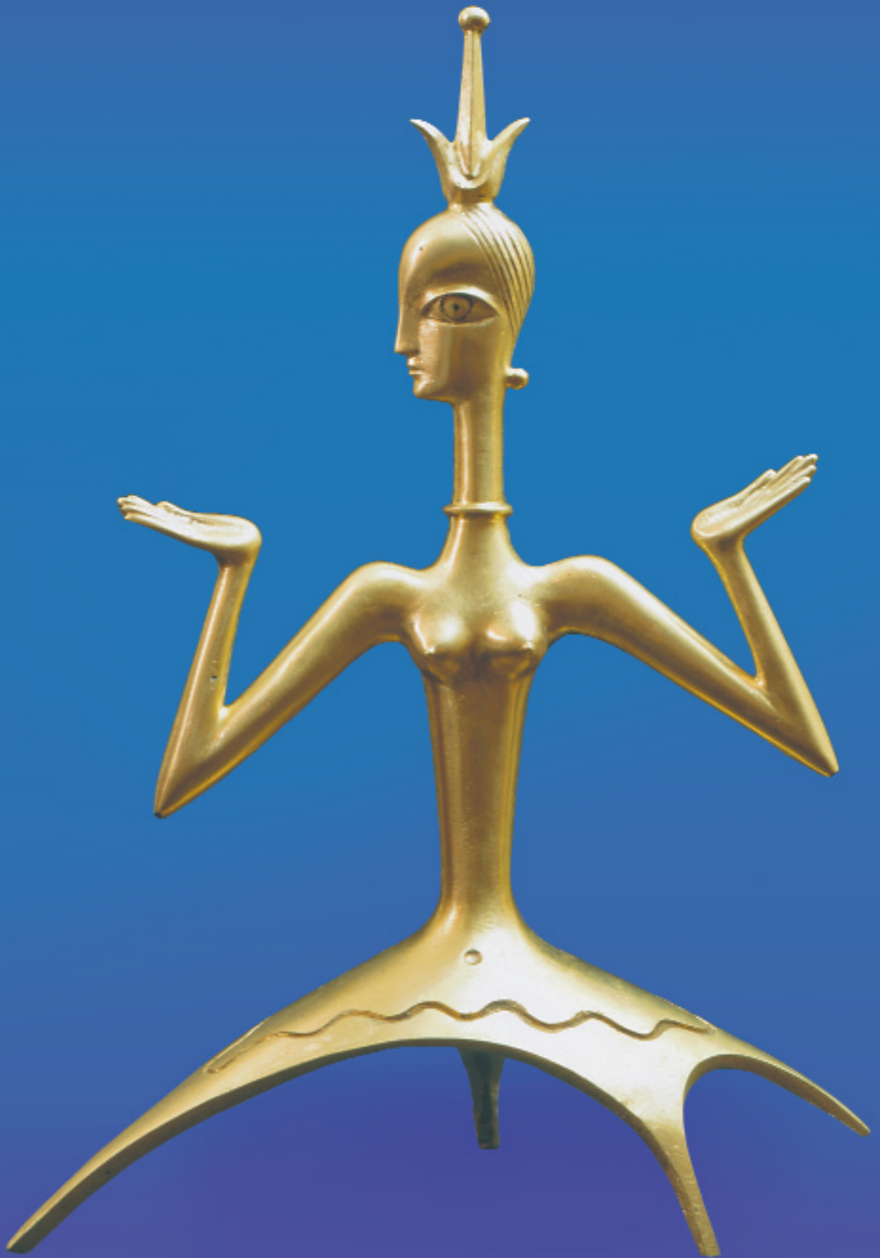
Ю. Ушков. Олирна. 1997