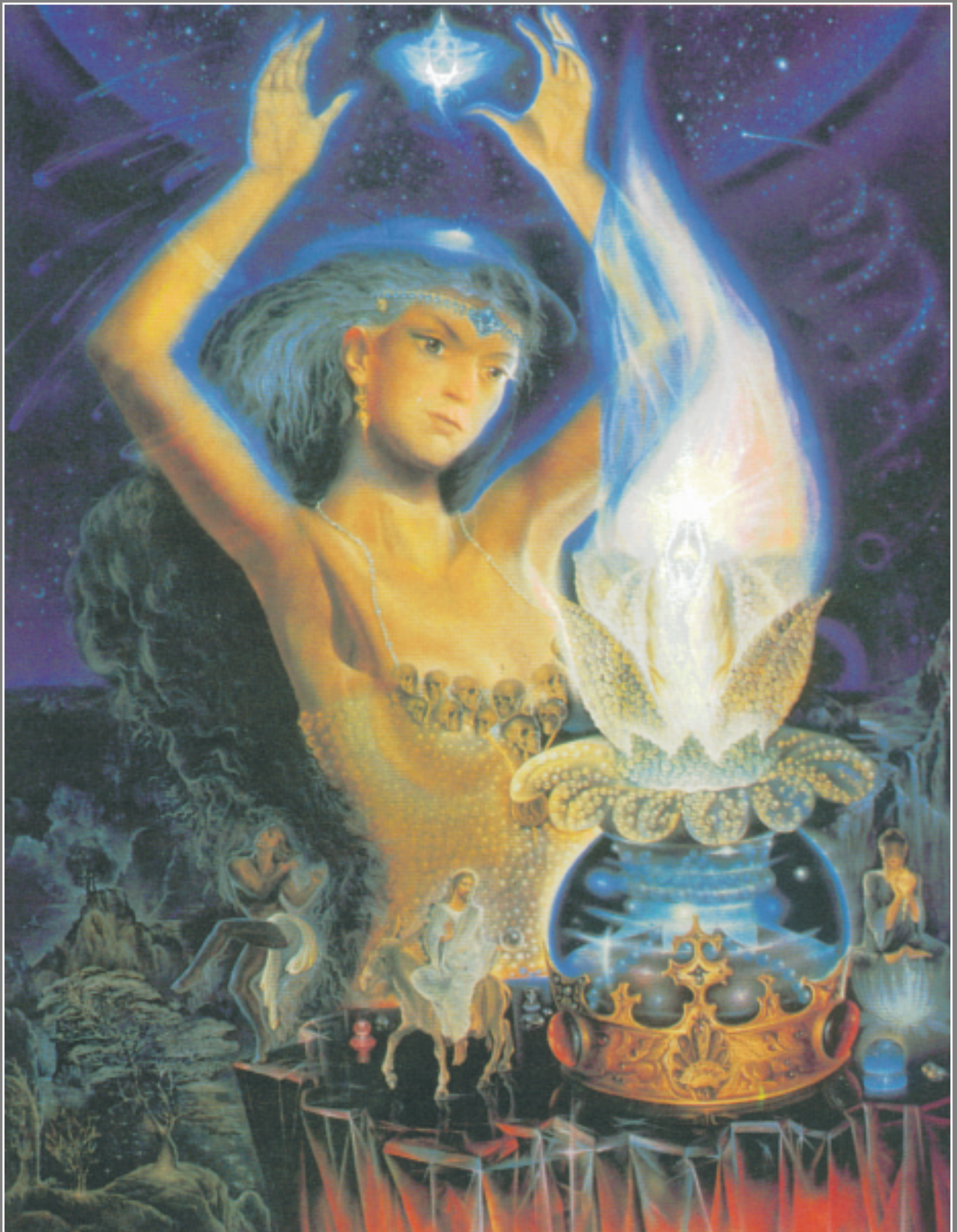
А. Рекуненко. Сотворение души