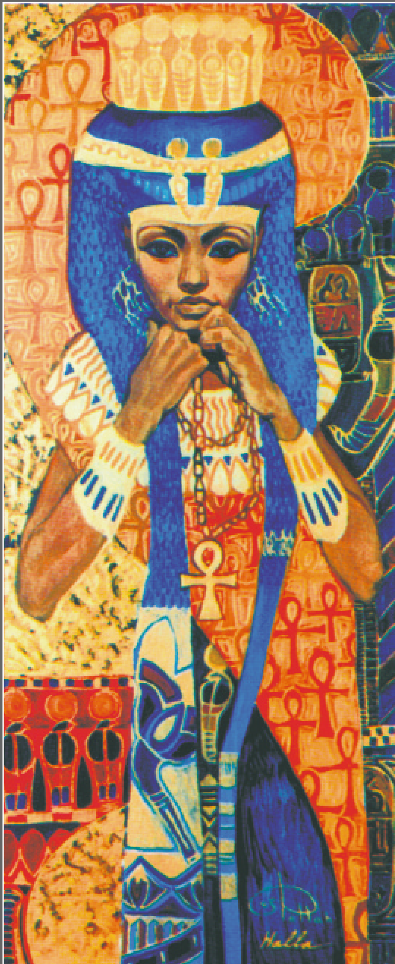
Г. Фаттах. Отражение в зеркале вечности. 1995