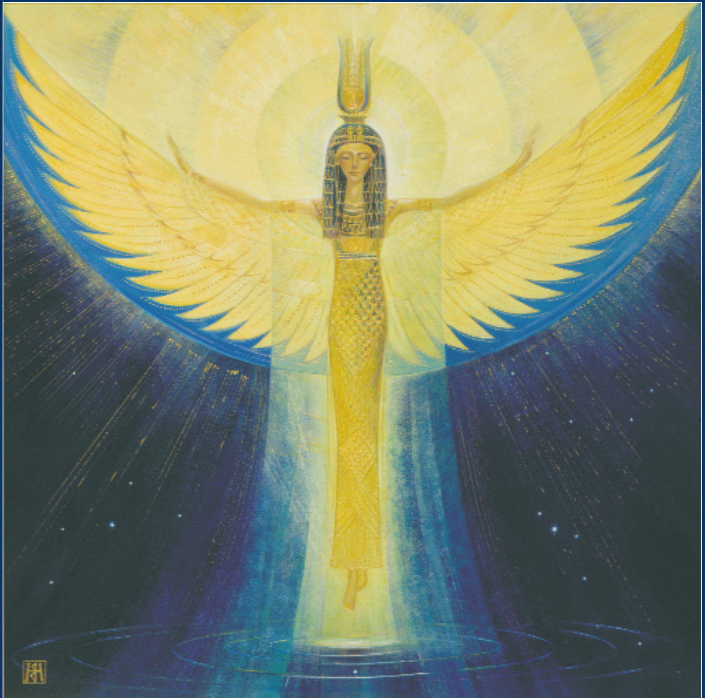
Н. Волкова. Свет, рожденный из вод. 1999