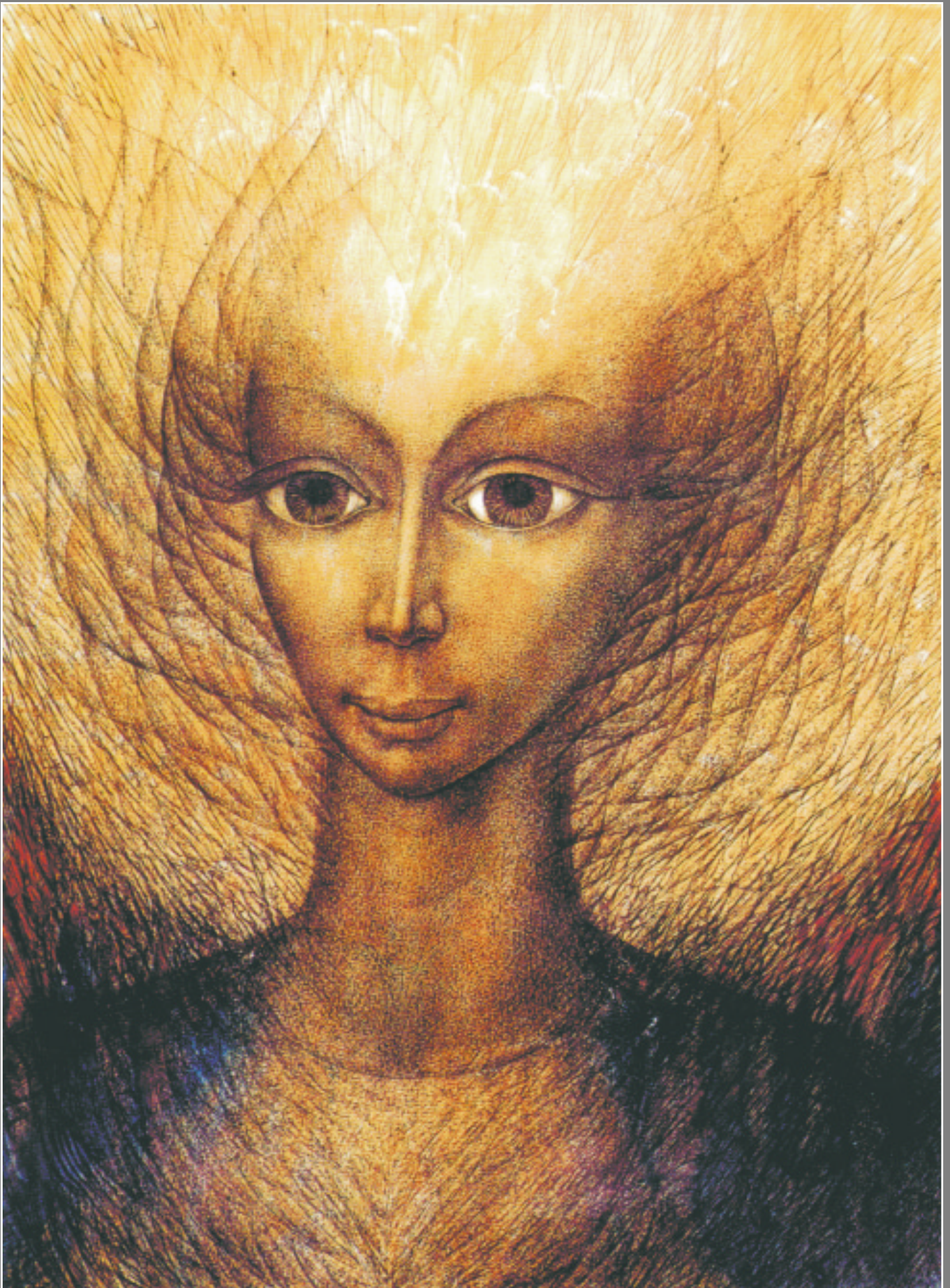
В. Каргаполов. Золотая. Огненная дева. 1994