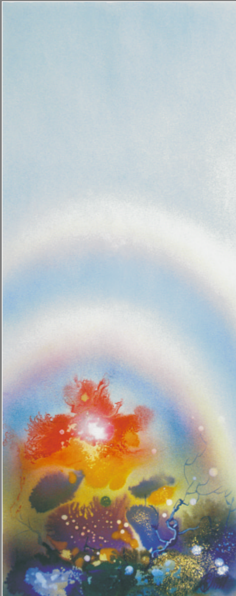
О. Высоцкий. Двойная радуга. 1997