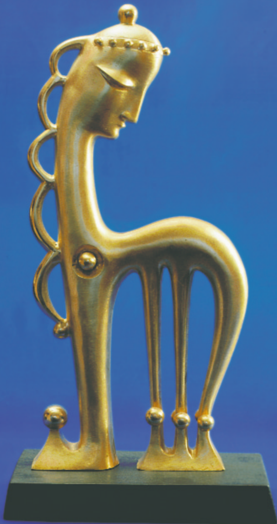
Ю. Ушков. Соната. 2000