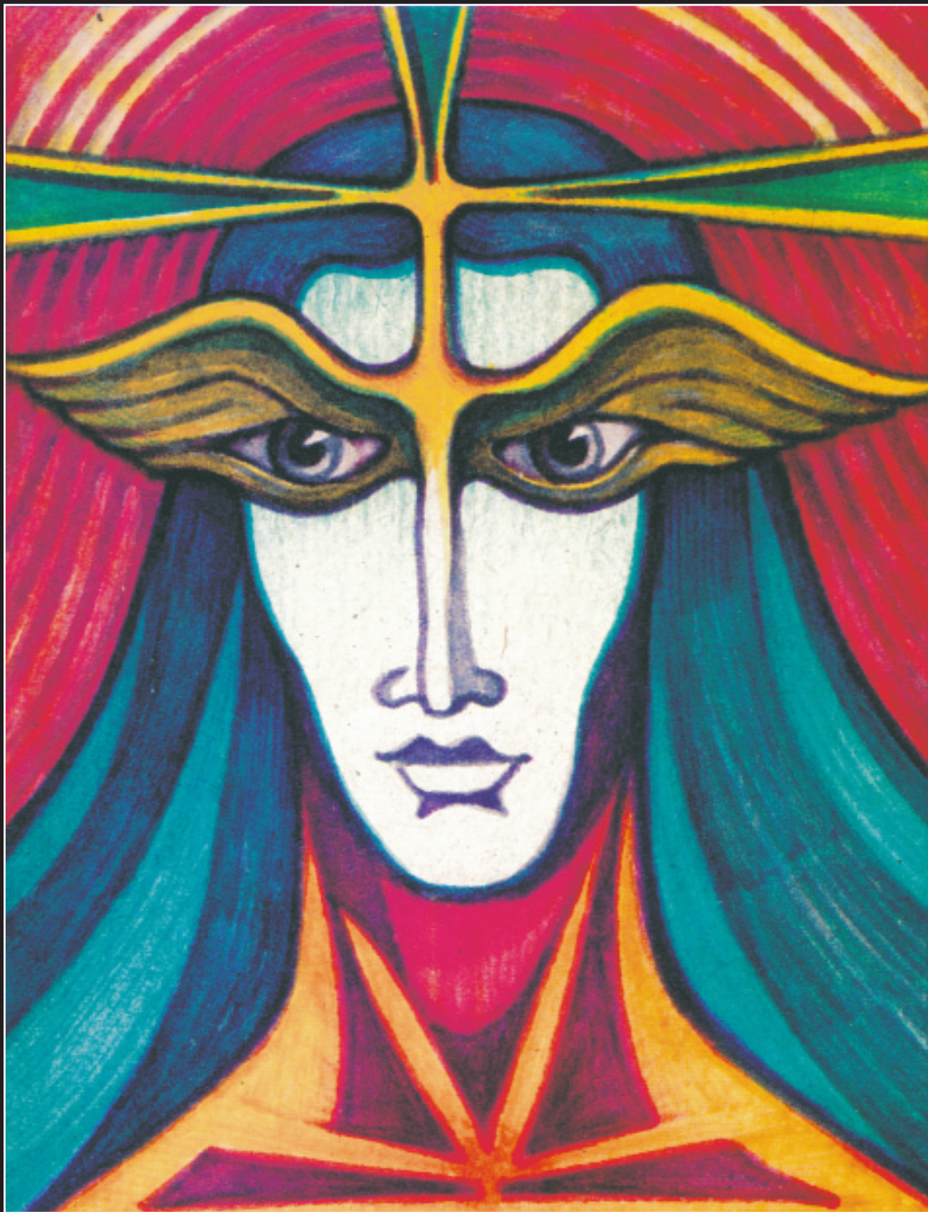
А. Белов. Лики Космоса. Без даты