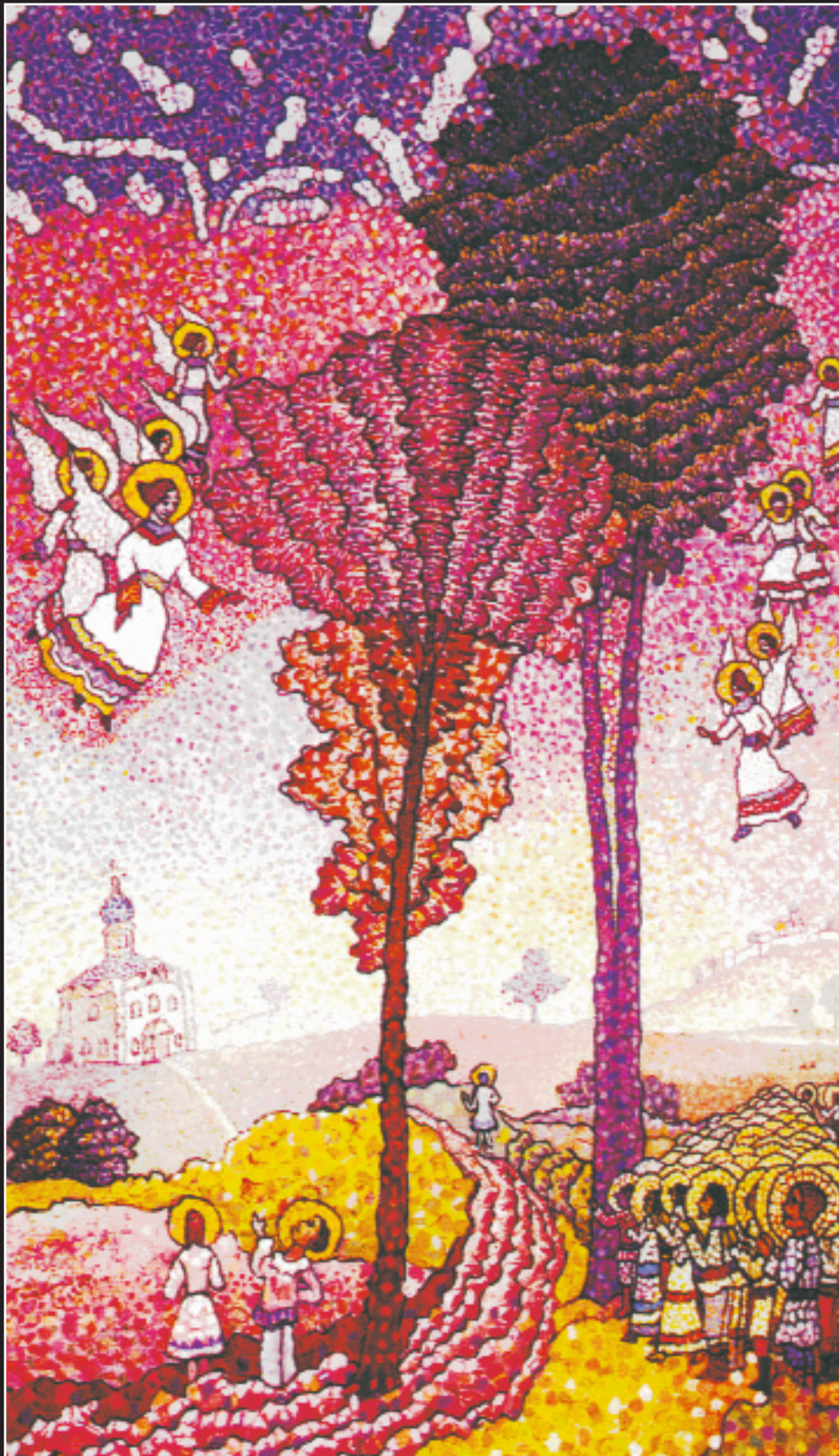
А. Хафитов. Удивление. 1991