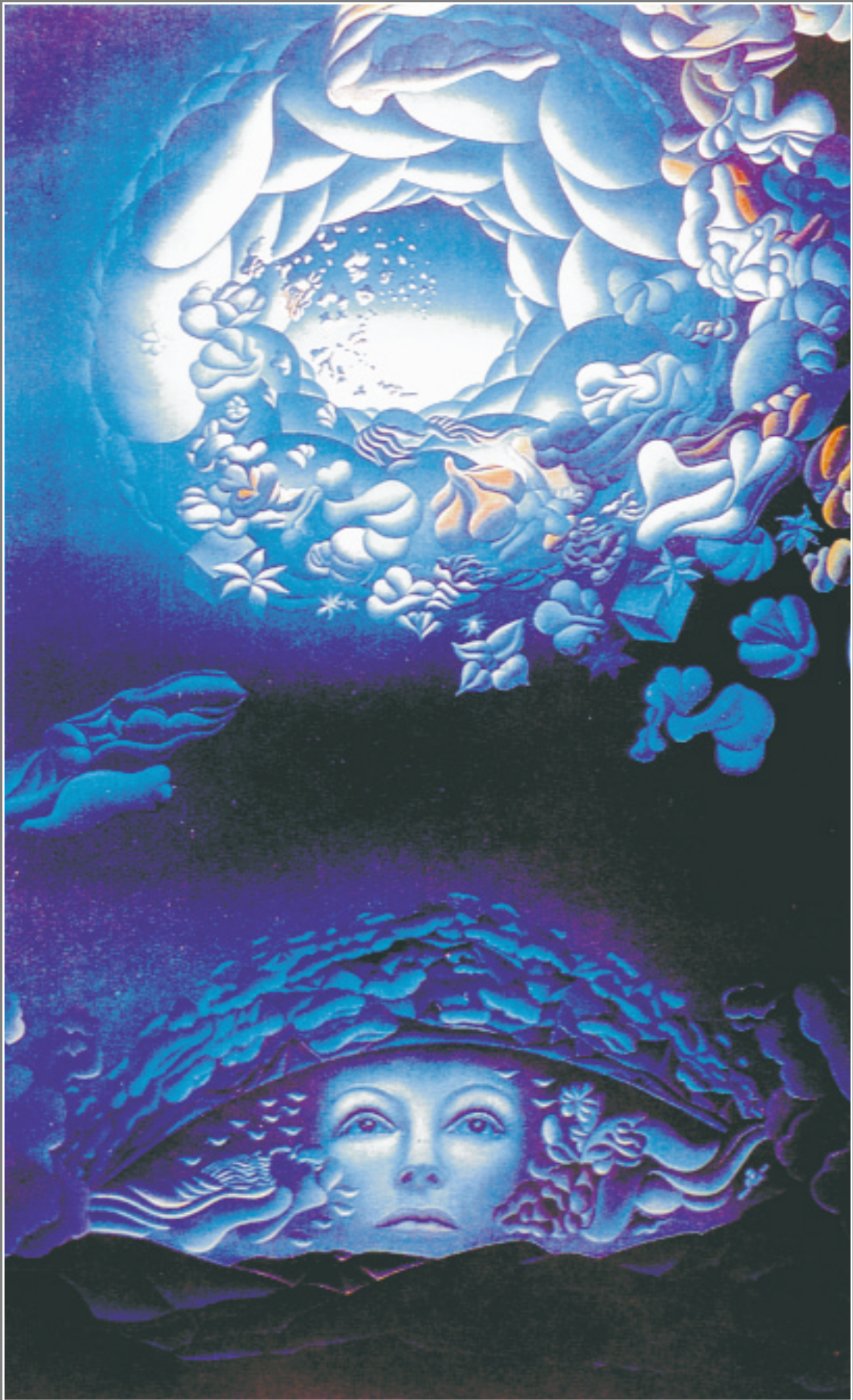
В. Глухов. Глаза Земли