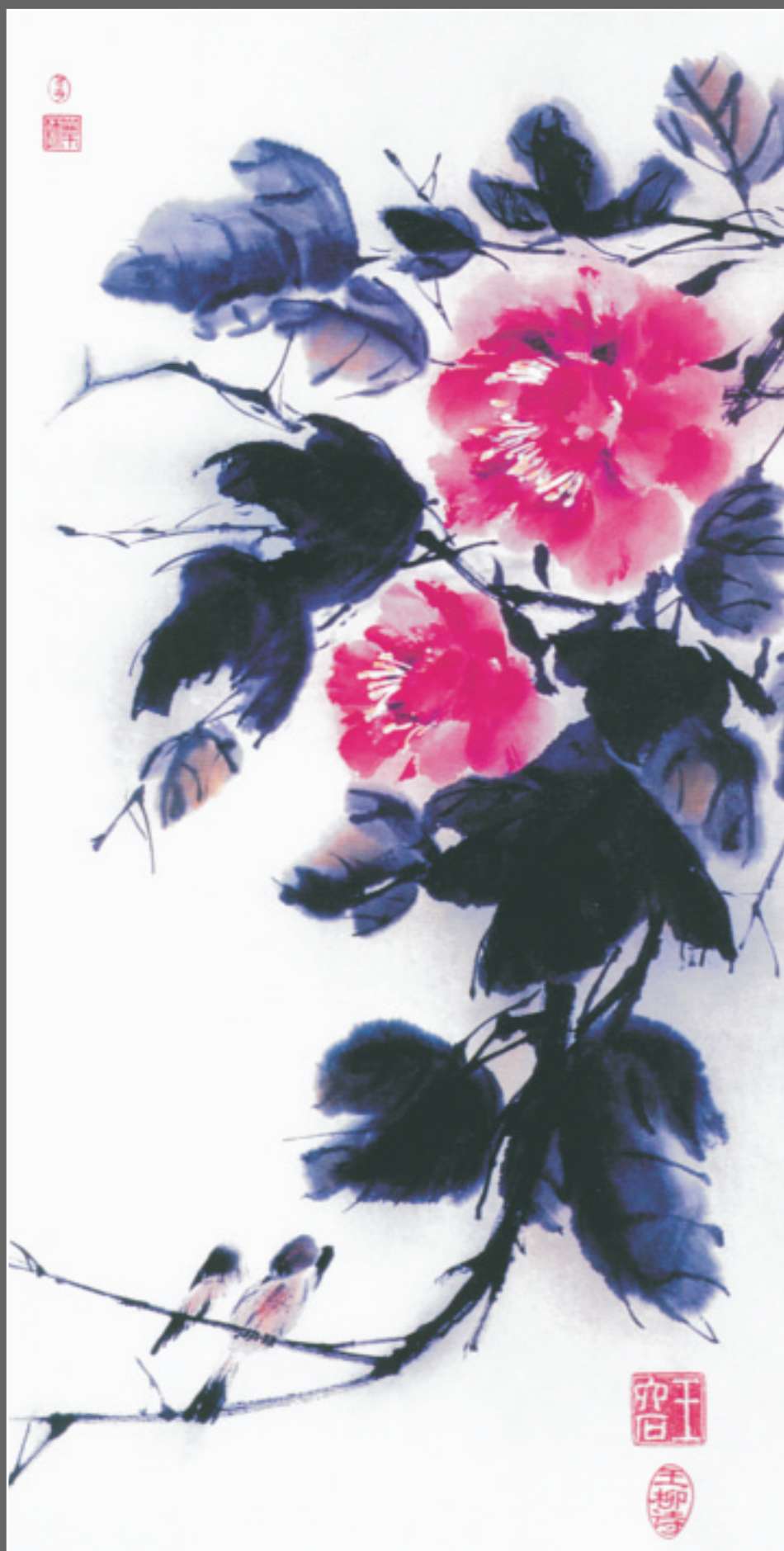
В. Алиева. (Ван Люши). Весенняя песня