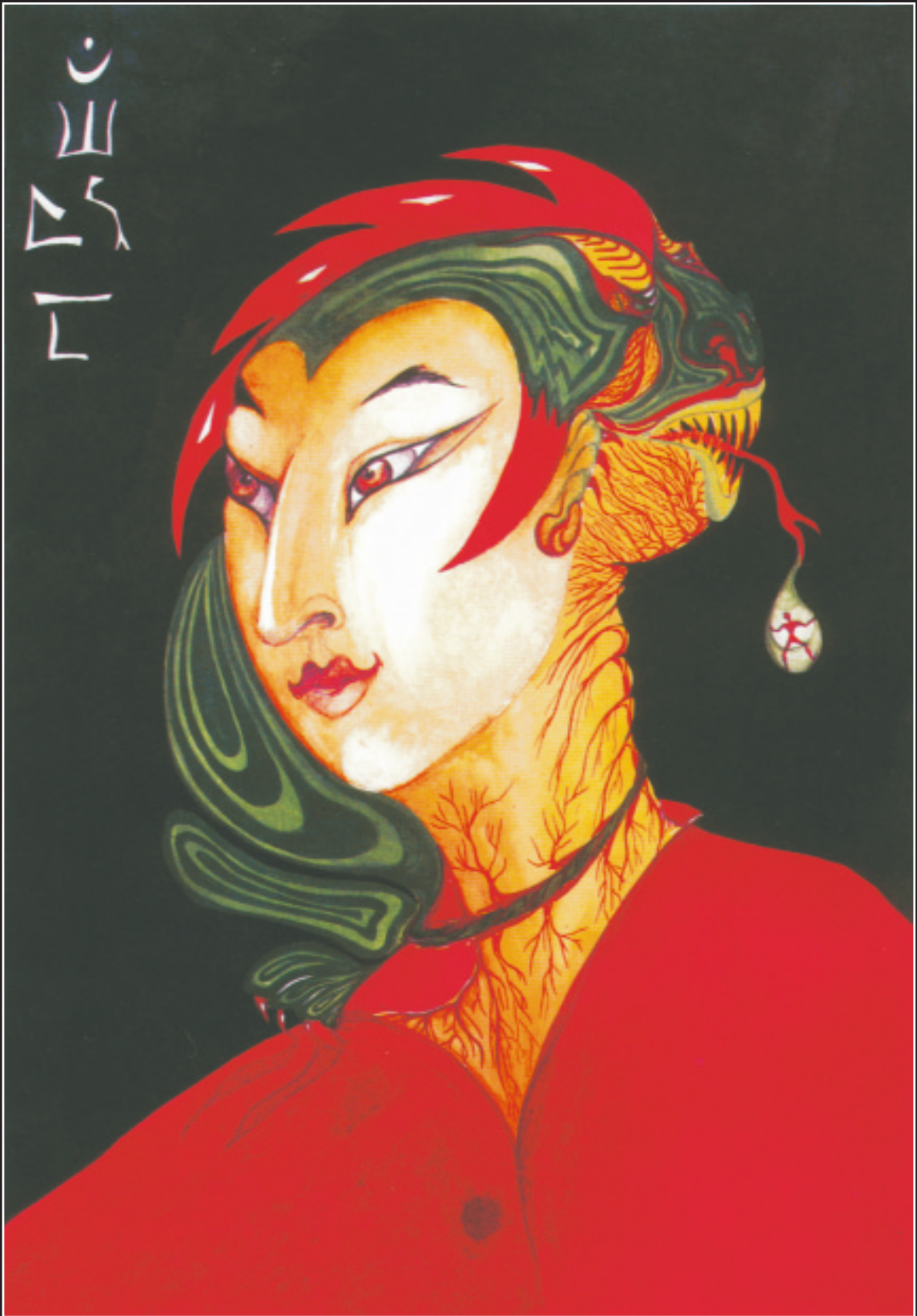
А. Тихонова. «Я был надеждой освещен и временем я был прощен». 1992