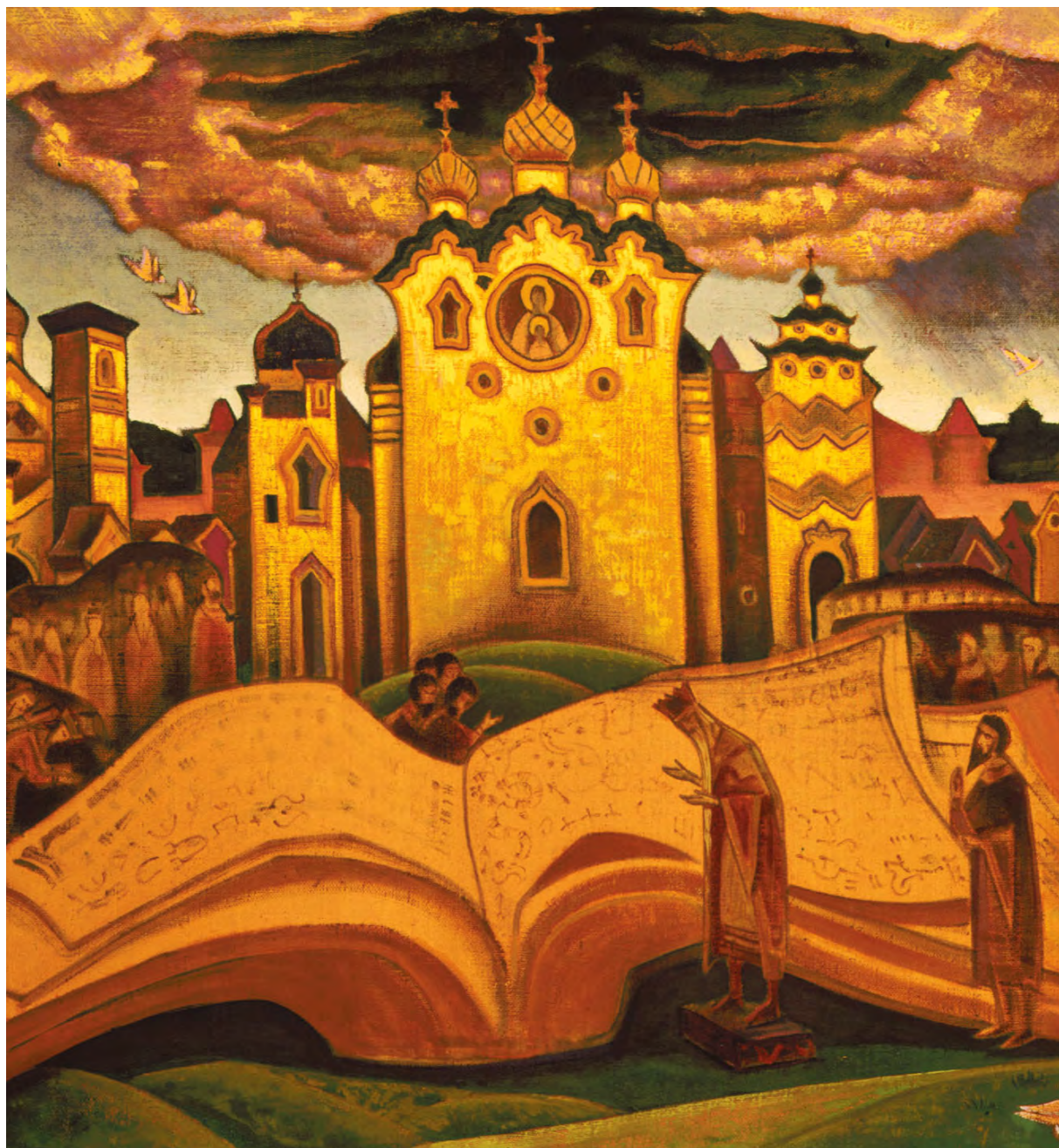
Н. Рерих. Книга Голубиная

во благо в любой час дня и ночи. Подобно сокольскому зову, работник Культуры доброжелательно отвечает: "Всегда готов". Он открыт сердцем ко всему, где опыт