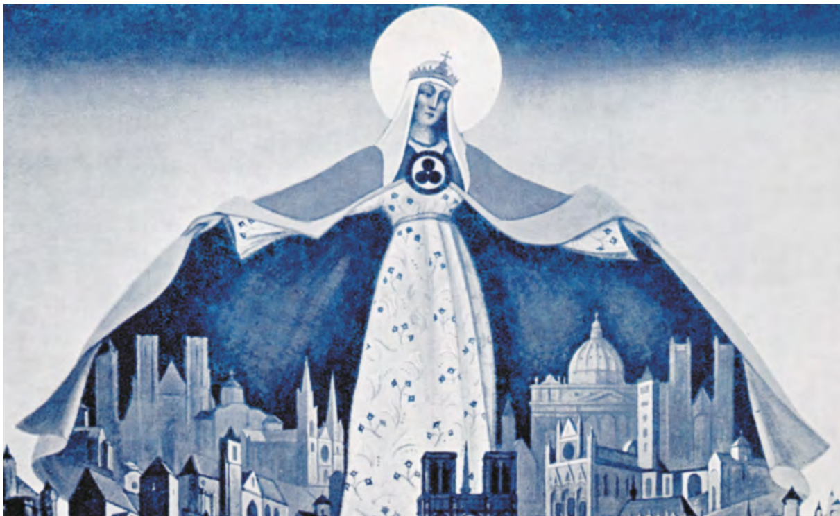
Н. Рерих. Святая Покровительница

фанатизма – уже немало памятников погибло от рук представителей Русской Православной Церкви. Это и фрески эпохи модерна в городе Хабаровске, сбитые со стен за "ересь", и памятники архитектуры, перестраивающиеся под новорусский стиль.