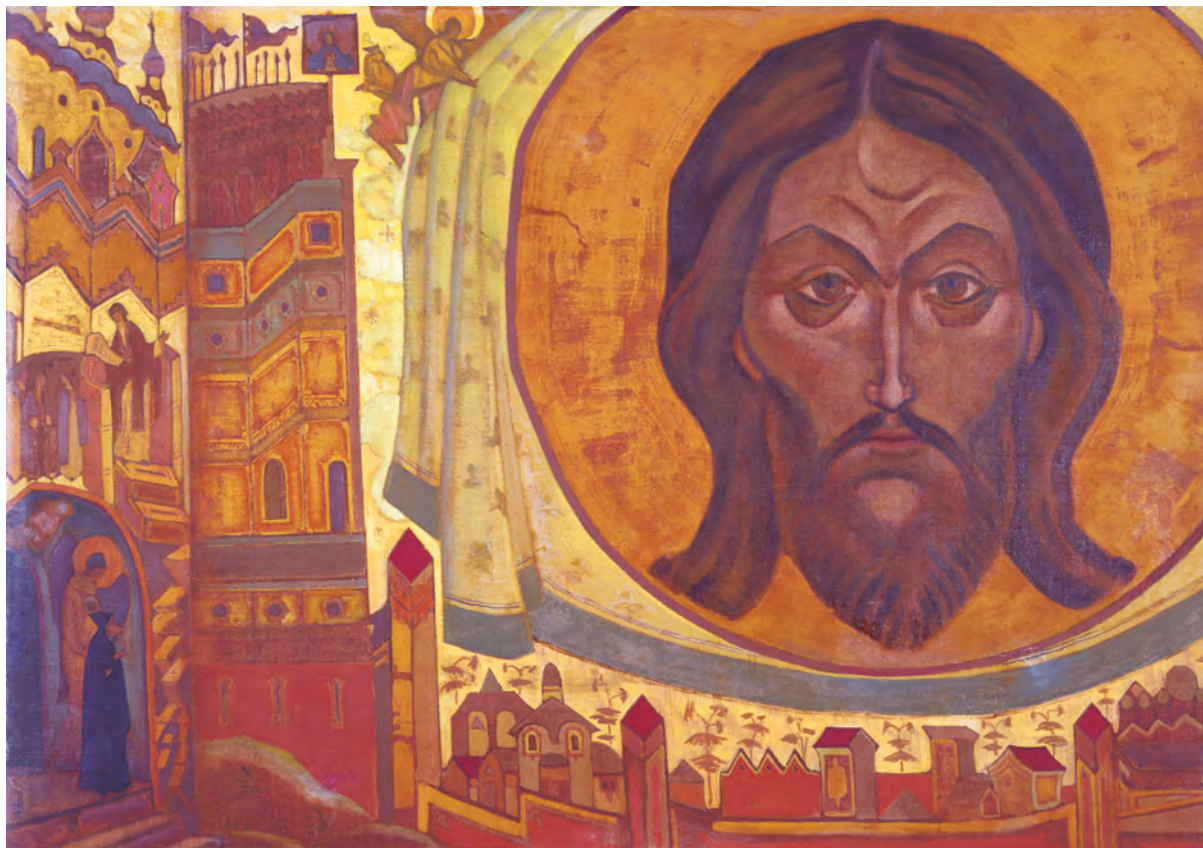
Н. Перих. И мы видим

женное, бесчувственное, бесполезное, как чурбан..." – толковал своим ученикам Будда Шакьямуни за пять веков до н. э. 1 Губительна для человека чрезмерная привязанность к телу, его так называемым естественным потребностям, которые незаметно могут принять противоестественный характер и омертвить душу. Как хорошо, вполне по-христиански сказано основателем буддизма: "Бессмертие может быть достигнуто только непрерывными деяниями доброты; и совершенство достигается состраданием. Самое необходимое – это любящее сердце". 2