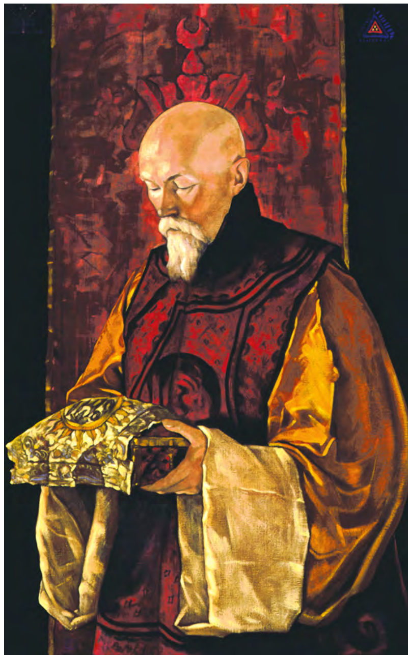
С. Рерих. Портрет Н.К. Рериха со шкатулкой

ется, она есть результат дифференциации культа, разворачивания его содержания в разные стороны. Философская мысль, научное познание, архитектура, живопись, скульптура, музыка, поэзия, мораль – все заклю-