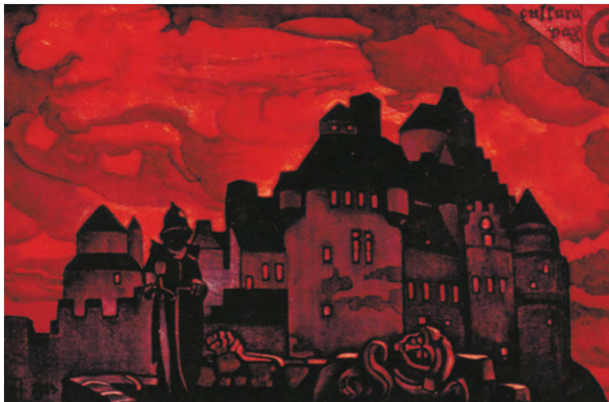
Н. Рерих. Зарево. 1914

ивают памятники культуры, а человечество не только попустительствует, но оно складывает страницу истории. И какая это будет мрачная страница! В ней будут запечатлены озверелые разрушители и мучители, а наряду с ними будет сказано, как огромнейшая часть человечества своим бессердечием потворствовала и способствовала вандализму.