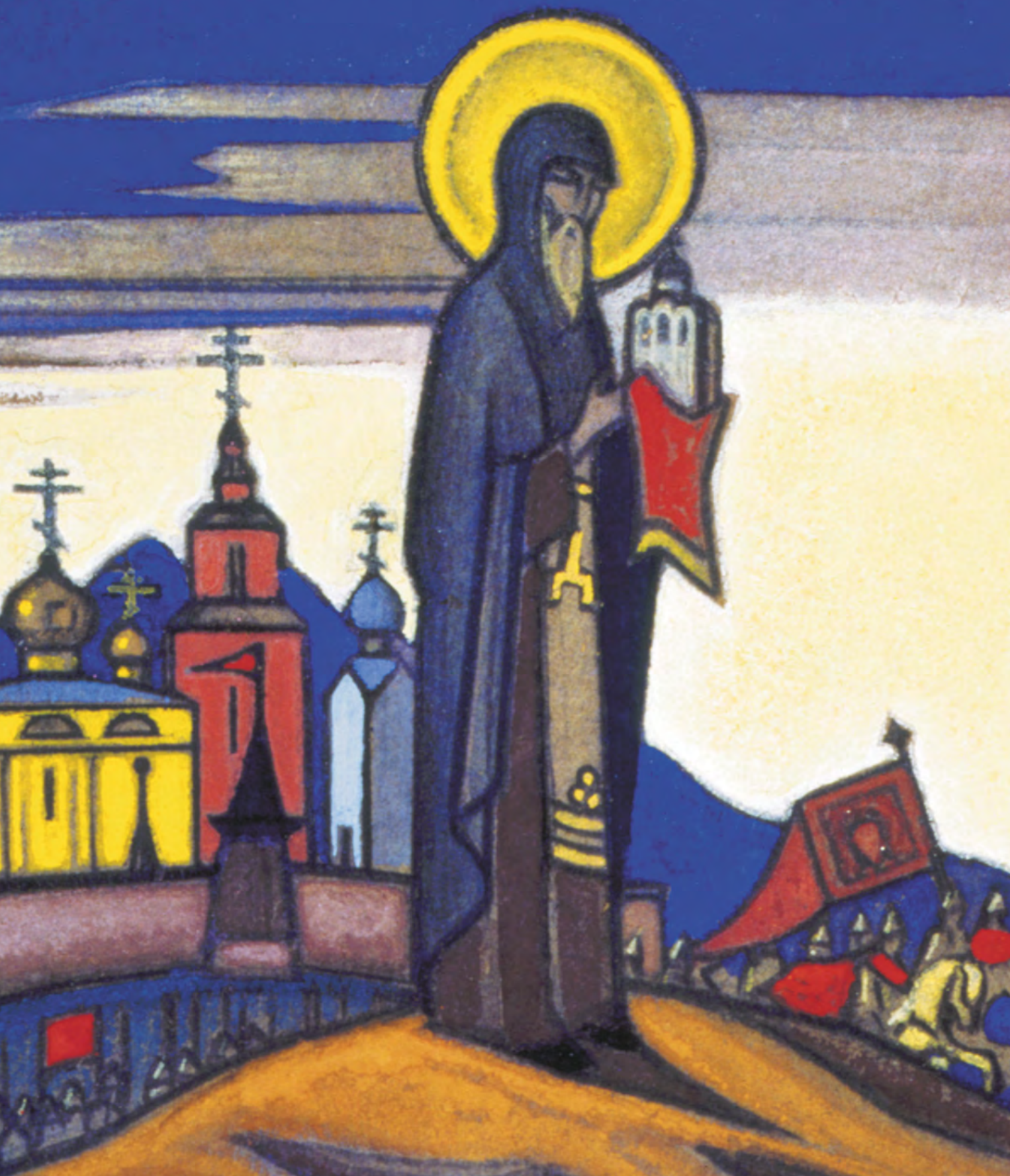
Н. Рерих. Святой Сергий Радонежский. 1931