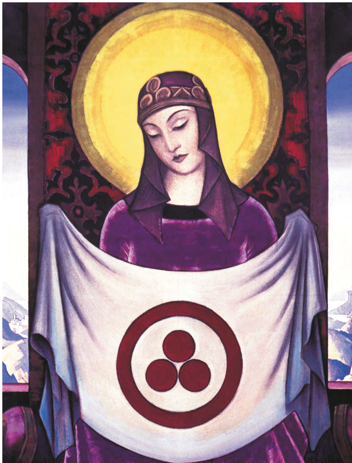
Н. Рерих. Мадонна Орифламма. Фрагмент. 1932