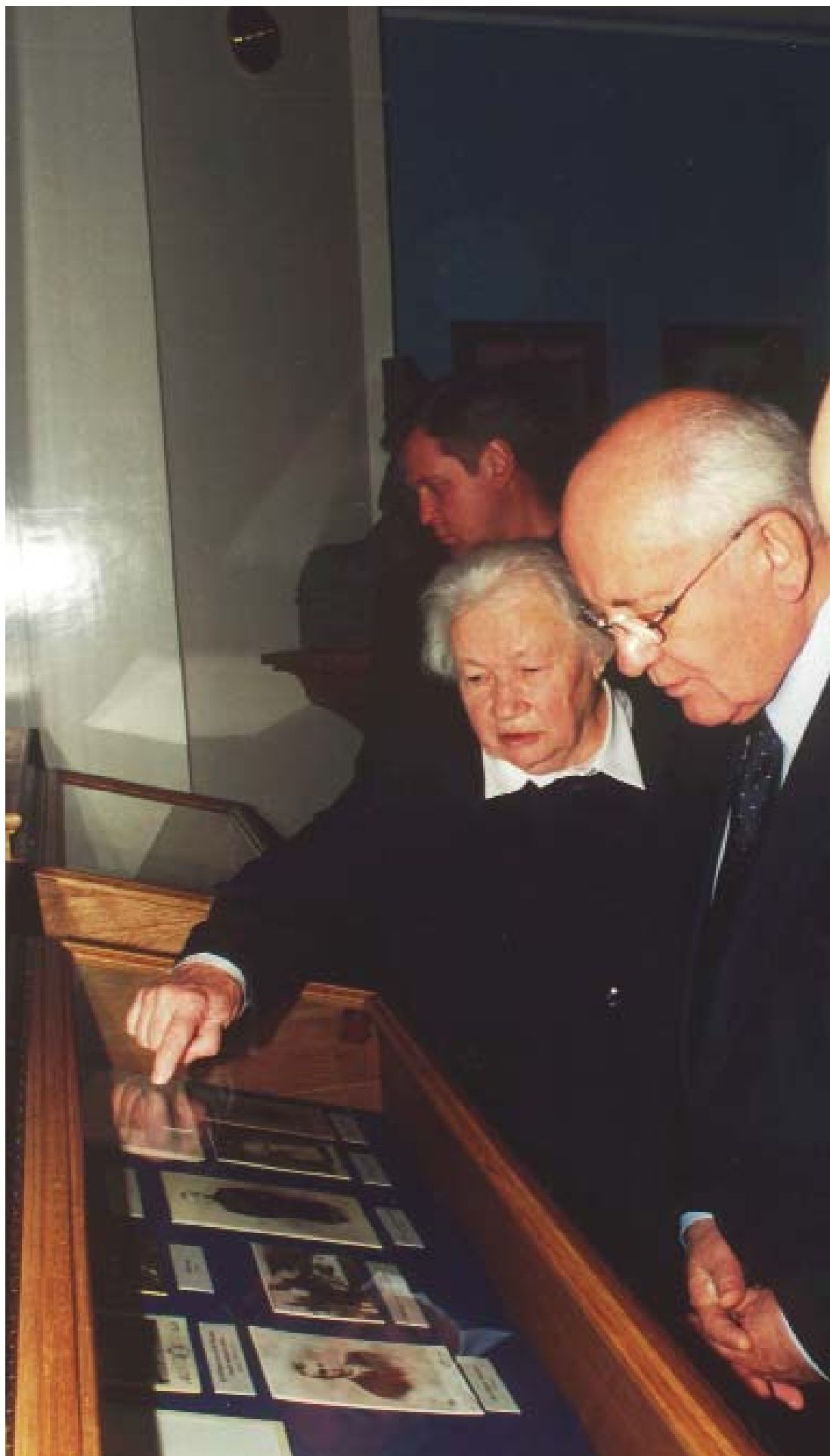
Осмотр экспозиции Музея