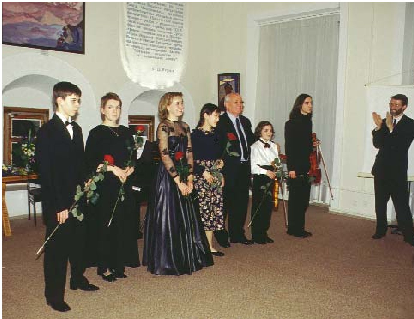
Фотография на память. Юные таланты с М.С. Горбачевым