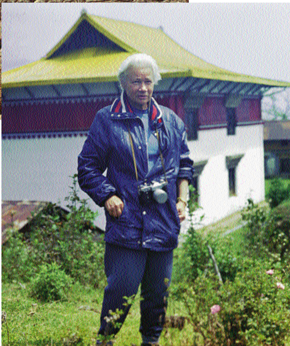
По маршруту Центрально-Азиатской экспедиции Н.К. Рериха