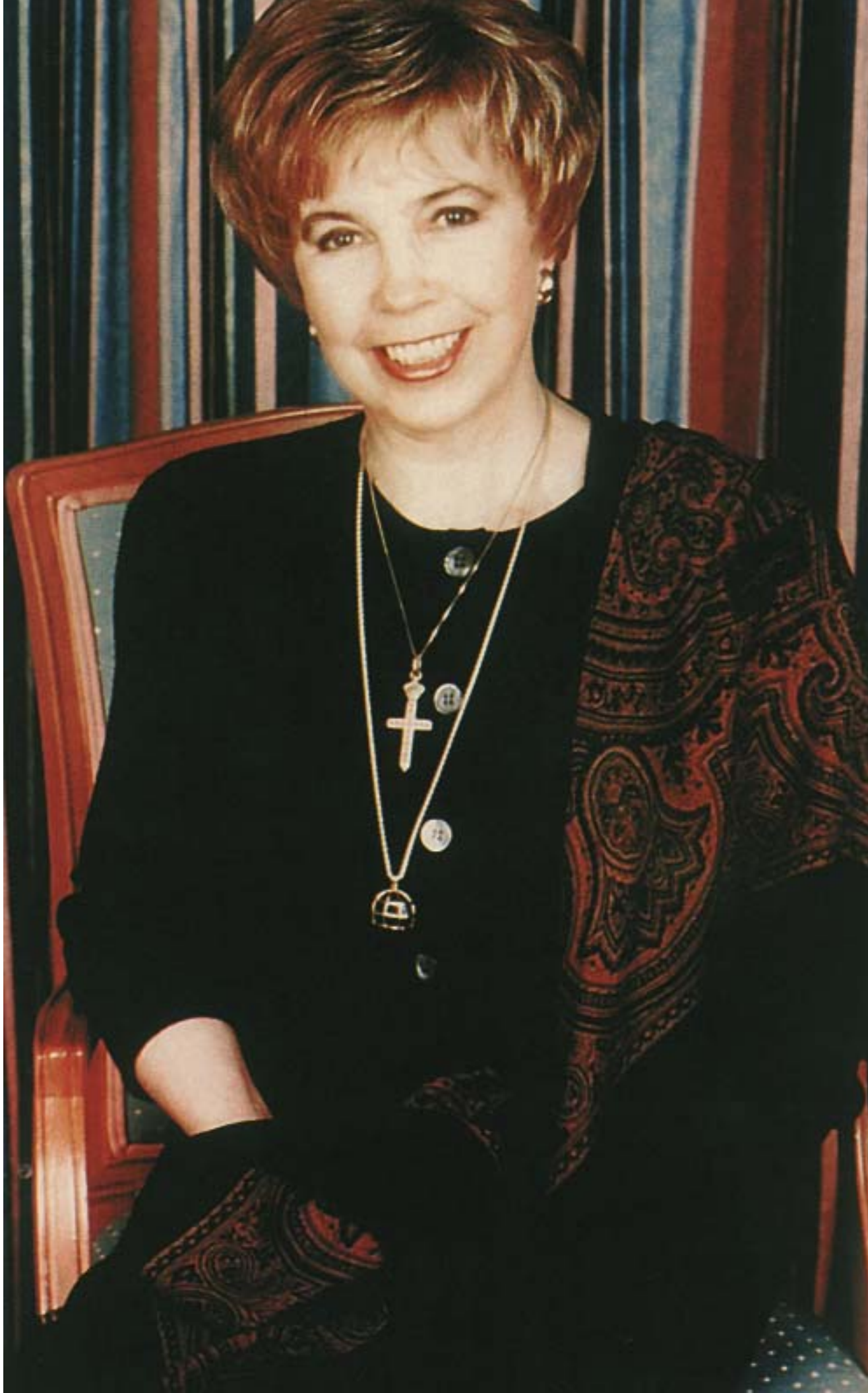
Раиса Максимовна Горбачева