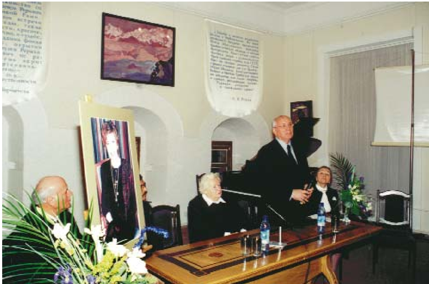
В зале Святослава Николаевича Рериха