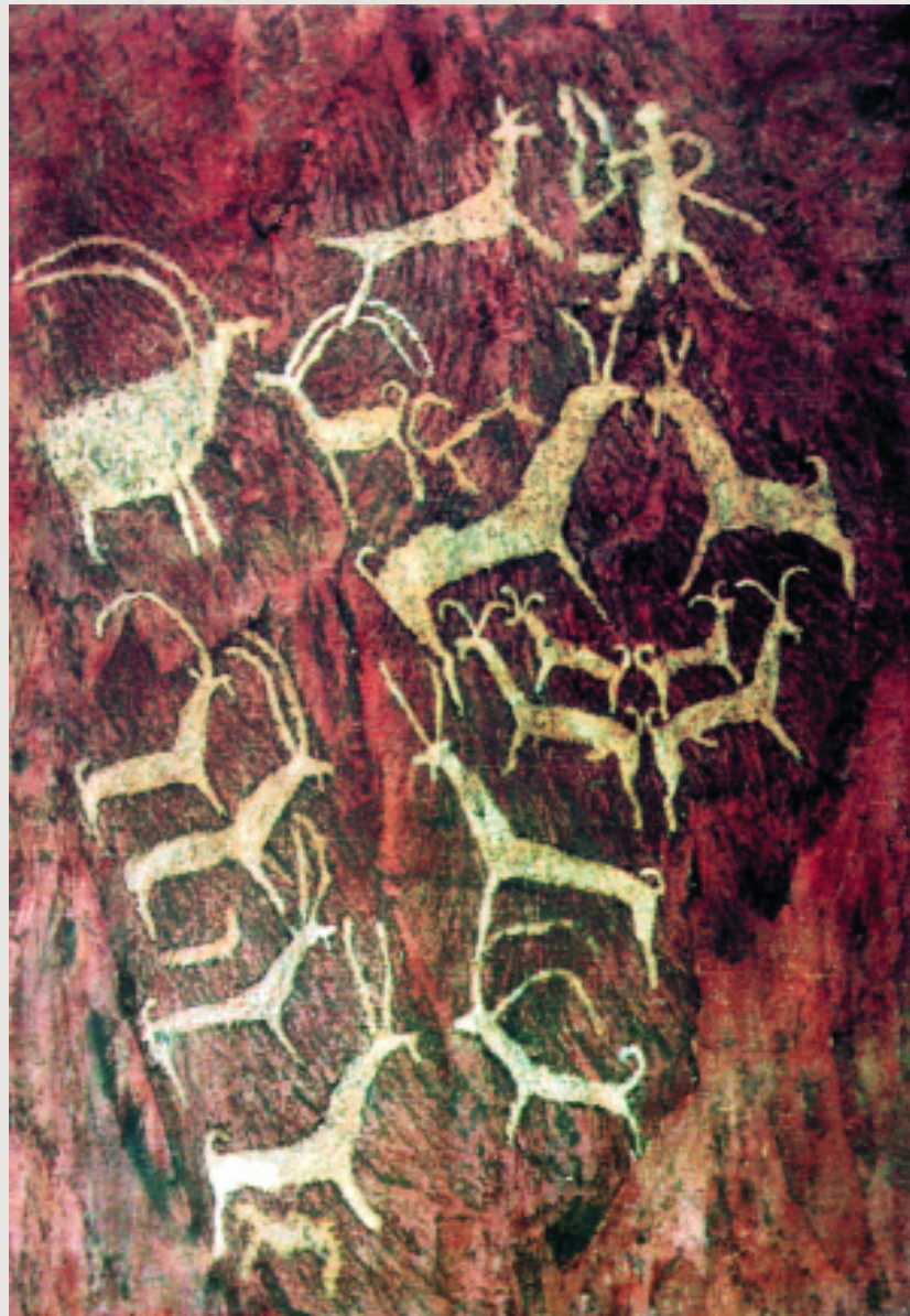
Копии древних петроглифов из экспозиция Музея наскального искусства

Маршрут туристическо-экскурсионной этнографической зоны «Русское сибирское село»