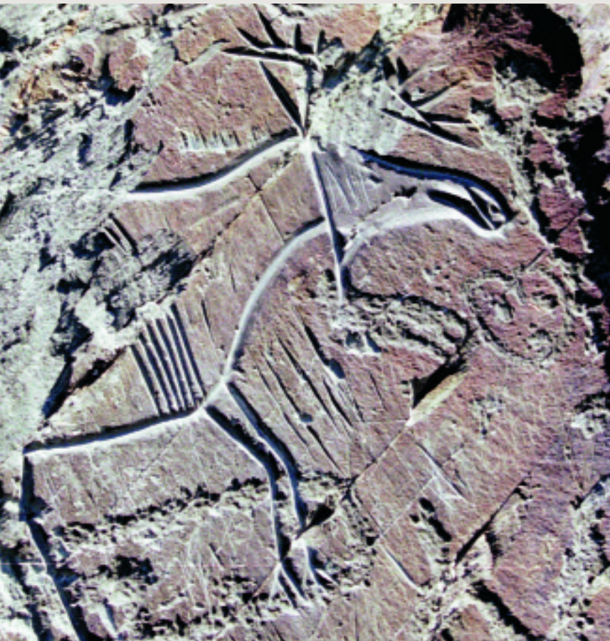
Петроглифы Томской писаницы: лось и личина (справа)

шая бетонная плита. На ней призыв к посетителям: «Пишите здесь!» К счастью, большинство экскурсантов откликается на этот призыв и самовыражается на бетоне, но есть и такие, кто выжидает, когда отвернется наблюдатель, для того чтобы «обесмертить» свое имя, выцарапать его рядом с древними петроглифами.