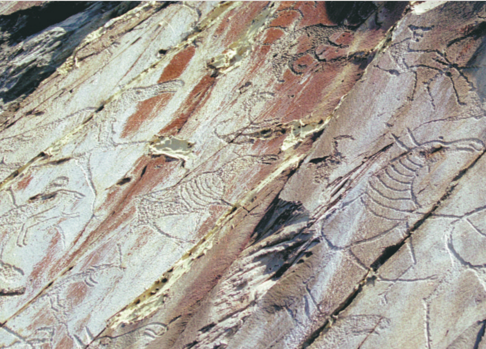
Идущие лоси и мифологическое животное (вверху)

проходит по деревне Писаная, которая, начиная с середины XVII века, расположилась в пойме реки с тем же названием, впадающей в Томь ниже по течению от древнего святилища. В деревне сохранилось несколько исторических построек XVII — начала XX века; усилиями музея-заповедника сюда свозятся памятники народного зодчества из других сел и деревень Притомья, которые обретают здесь новую жизнь.