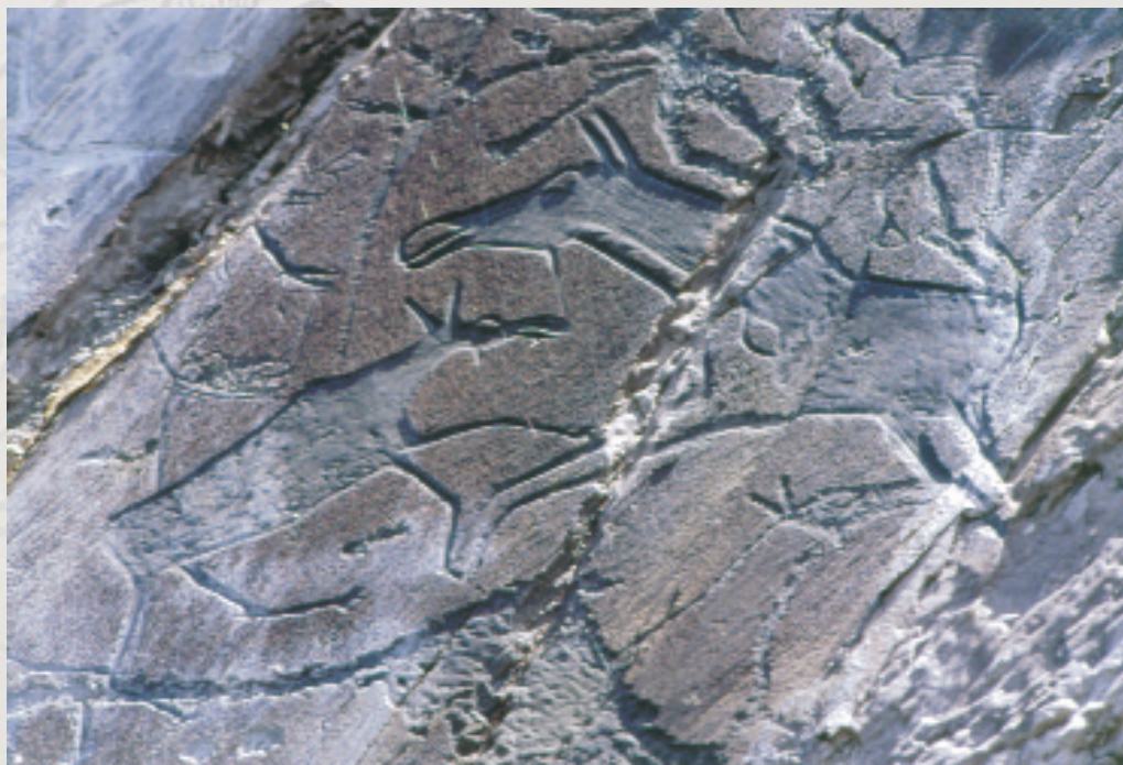
Петроглифы Томской писаницы. Главный герой древнего эпоса — лось

Рядом с лосями выбиты силуэты длинных лодок с людьми. Возможно, это рыбаки, селившиеся по берегам Томи в древности. А может, это графическое воплощение известного мифологического сюжета о переправе душ умерших в страну мертвых в лодках по священной реке.