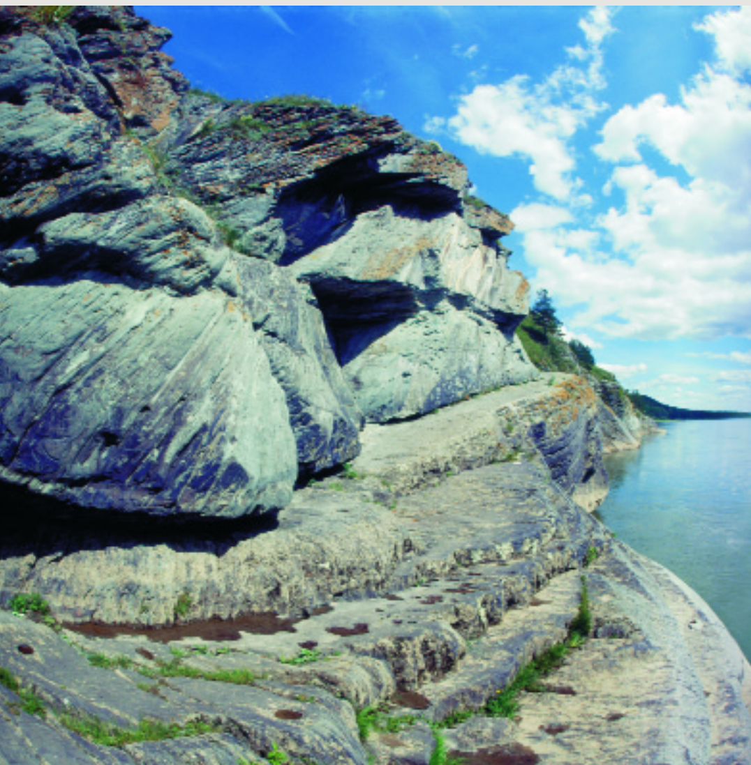
Древнее святилище «Томская писаница»

Усилиями исследователей для сохранения памятника Томской писаницы в его естественной природной среде был организован историко-культурный и природный музей-заповедник,