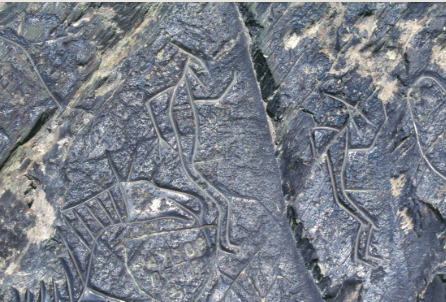
Танцующие «люди-птицы», символизирующие культ плодородия. Эпоха бронзы

Особый интерес у посетителей «Археодрома» вызывает экспозиция «Живая археология». Здесь можно приобщиться к древности в буквальном смысле: научиться стрелять из лука, метнуть в цель копье или дротик, слепить глиняный горшок, попробовать добыть огонь. «Оживить» древние технологии помогли специальные научные исследования и археологические открытия. Тщательно реконструирована древняя технология подготовки глины, изготовления сосудов способами выдавливания и ленточным способом, обжига предметов, сделанных из глины.