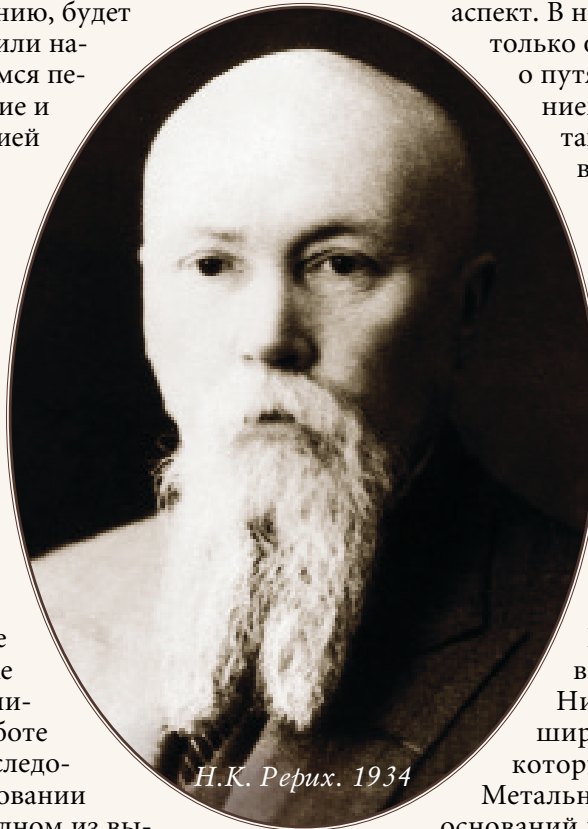
Н.К. Рерих. 1934

В годы фашистской оккупации Франции С.И. Метальников был арестован. Николай Константинович Рерих, с болью в сердце переживавший разрушительные последствия мировой войны, старался узнать о судьбе многих своих друзей и знакомых, оставшихся в Европе. Вести приходили неутешительные: «Сколько смертей и болезней! Чудовищно сведение, что Метальников от пытки сошел с ума! Сколько испытаний, в которых люди показали себя в новом свете!» 14