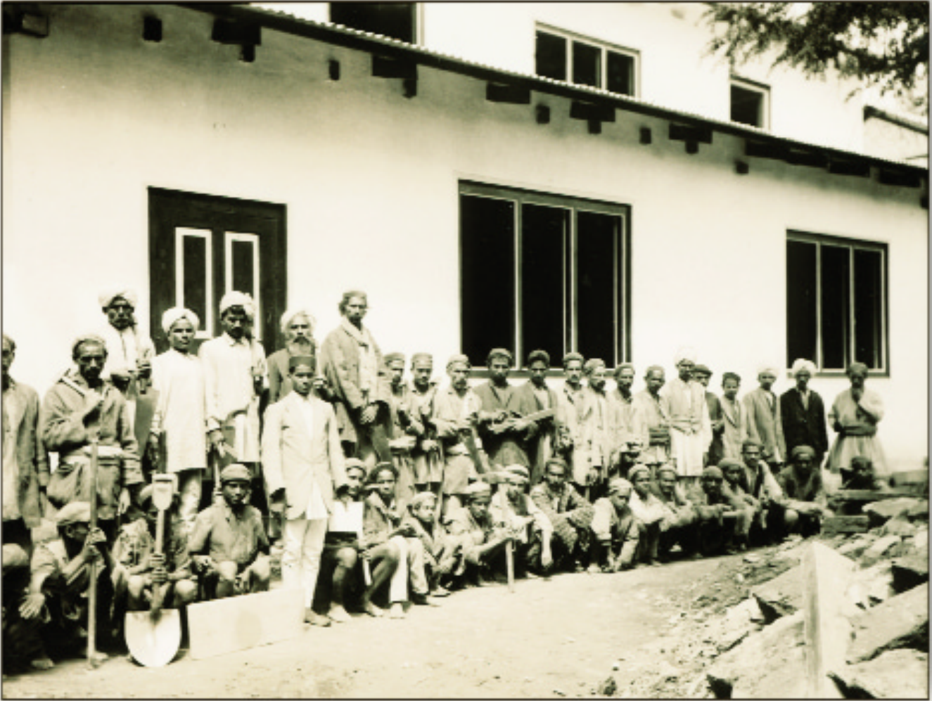
Строители биохимической лаборатории в Кулу. 1932

кусочек земли и небольшой домик на курьих ножках, где я провожу обычно каникулы.