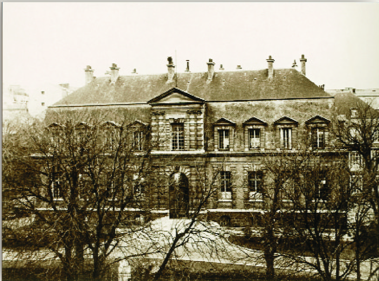
Институт А. Пастера в Париже. 1888