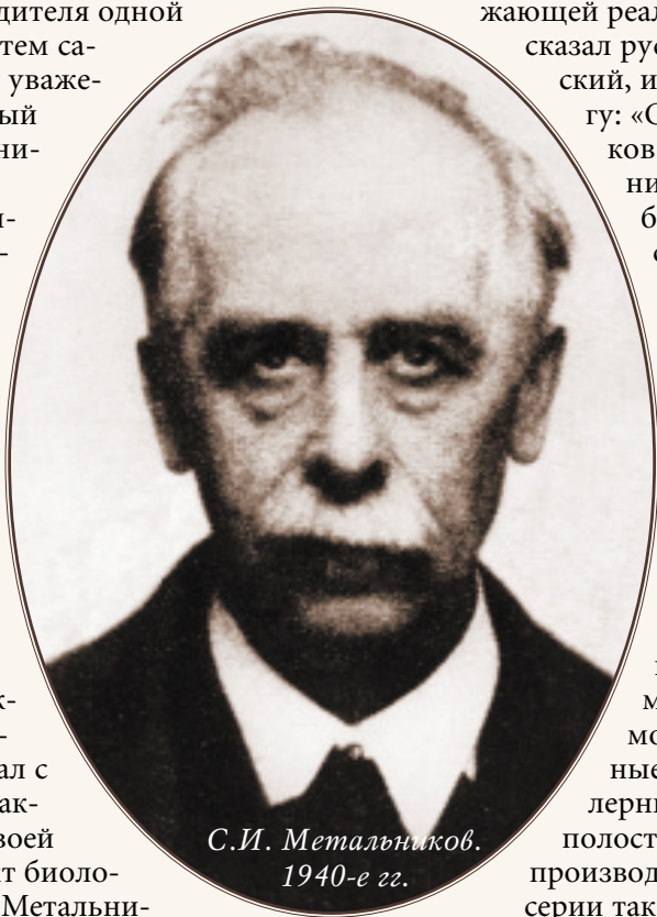
С.И. Метальников. 1940-е гг.