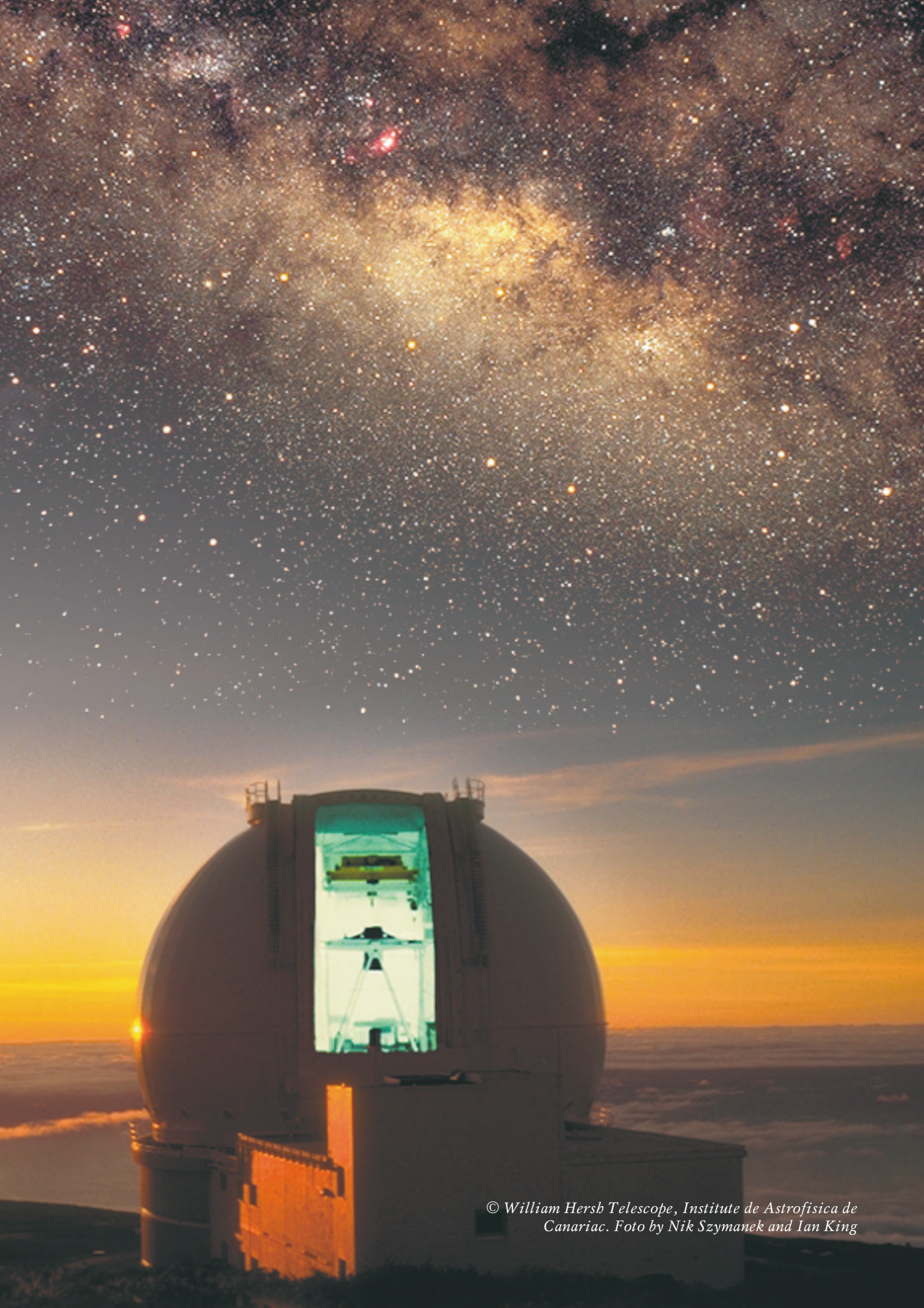
© William Hersb Telescope, Institute de Astrofísica de Canariac. Foto by Nik Szymanek and Ian King