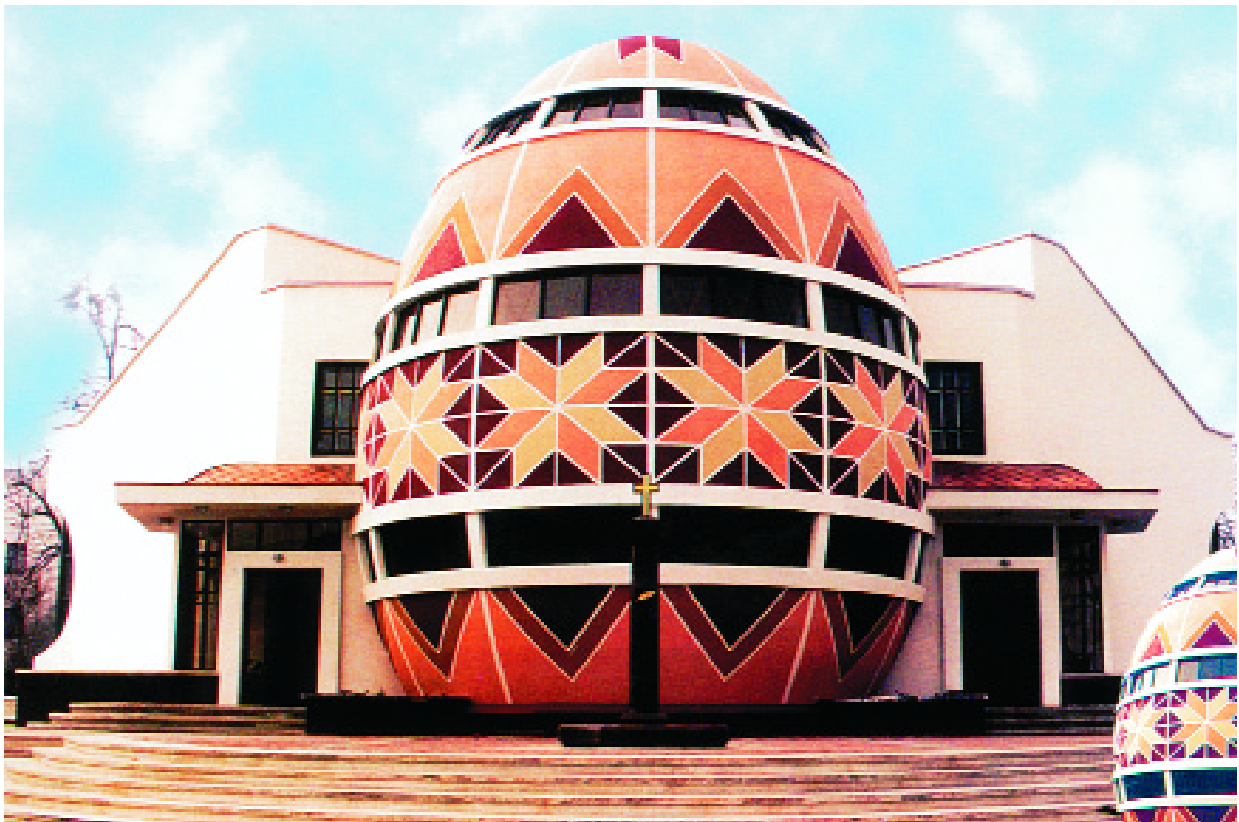
Музей писанки. Коломыя, Украина

Самая большая трудность для наших современников — это чтение сакральных знаков писанок. Искусство росписи очень трудно пересказать словами, поэтому все названия, все словесные обозначения писанок нужно считать условными. Только будущее откроет их истинный непреходящий смысл.