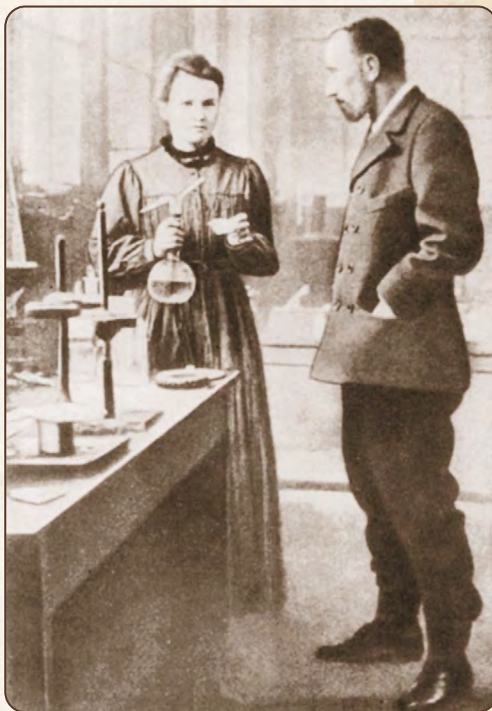
Мари и Пьер Кюри — родители Ирен