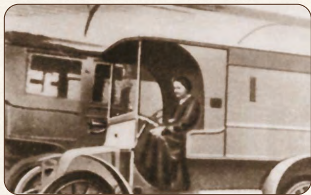
Санитарная машина рентгенологической службы, организованной Мари Кюри

А в каникулы Мари и обе ее дочери проводили время, словно три подруги, увлекаясь с одинаковой страстью самыми разными видами спорта – ходьбой, плаванием, ездой на велосипеде, верховой ездой, лыжами, коньками. Отдых в Ларкуесте, под небом Бретани, среди близких по духу «спортсменов» Сорбонны, блестящих ученых, неистощимых на выдумку в организации активного отдыха, цементирующих отноше-