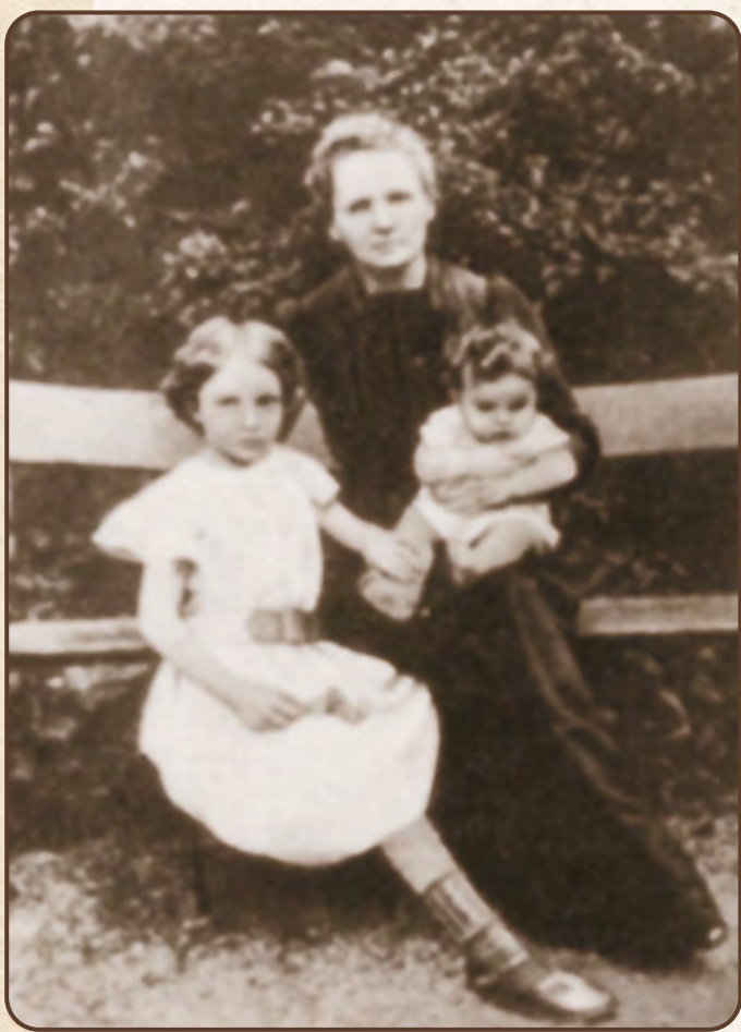
Мари Кюри с дочерьми Ирен и Евой, 1905 г.

Каждый день начинается часом умственной и физической работы, которую Мари старается сделать привлекательной, внимательно следя при этом, чтобы ничто не мешало развиваться пробуждающимся в девочках способностям. Как только кончаются занятия, дети идут гулять. В саду Мари вешает трапецию, кольца и канат для лазания. Она заботится, чтобы дочери привыкали к ходьбе, плаванию, велосипеду, верховой езде.