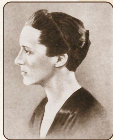
Ева Кюри, младшая сестра Ирен