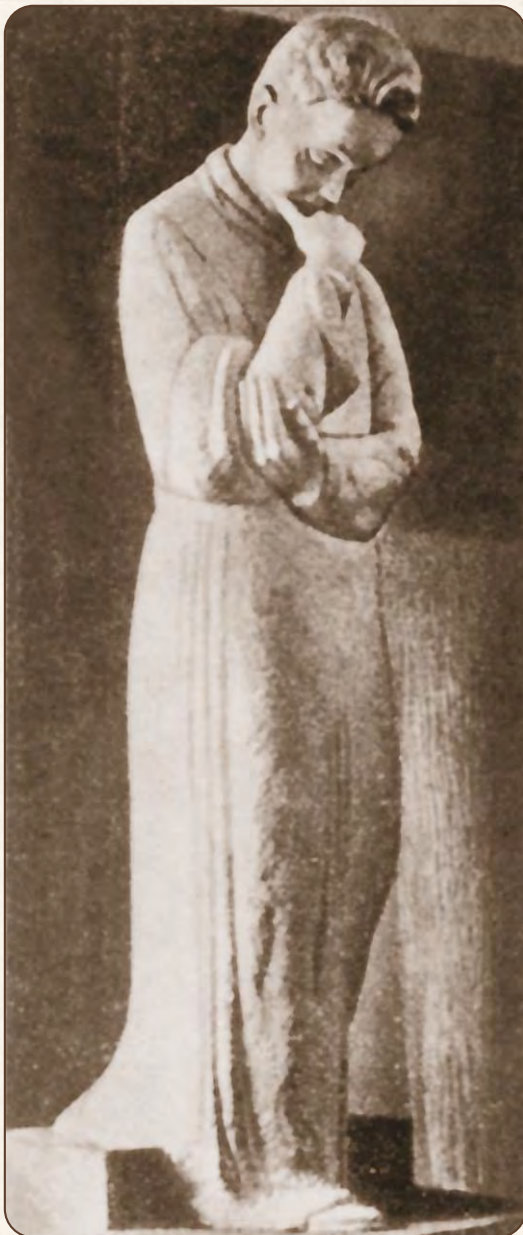
Памятник Мари Склодовской-Кюри перед зданием Института радия в Варшаве

П осле смерти Мари роль лидеров во французской физике легла на плечи второго поколения династии Кюри – Ирен и Фредерика. Как в свое время Мари подготовила труды Пьера и написала его биографию, так и Ирен прежде всего взялась за приведение в порядок рабочих дневников своих родителей. Но этого Ирен показалось мало. Вместе с мужем они сделали редакторскую правку капитального труда Мари «Радиоактивность», которому та отдала много лет жизни. Обе дочери написали биографию Мари. Ева, как профессиональный писатель, главный упор сделала на чисто человеческие качества своей матери, а Ирен написала научную биографию.