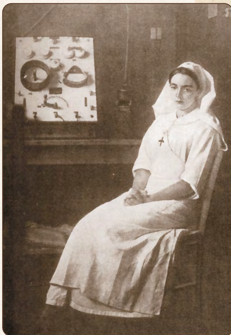
Ирен Кюри — оператор передвижной радиологической лаборатории, 1914 г.

17 июня угрожающее падение кровяного давления вынуждает мадам Кюри прервать