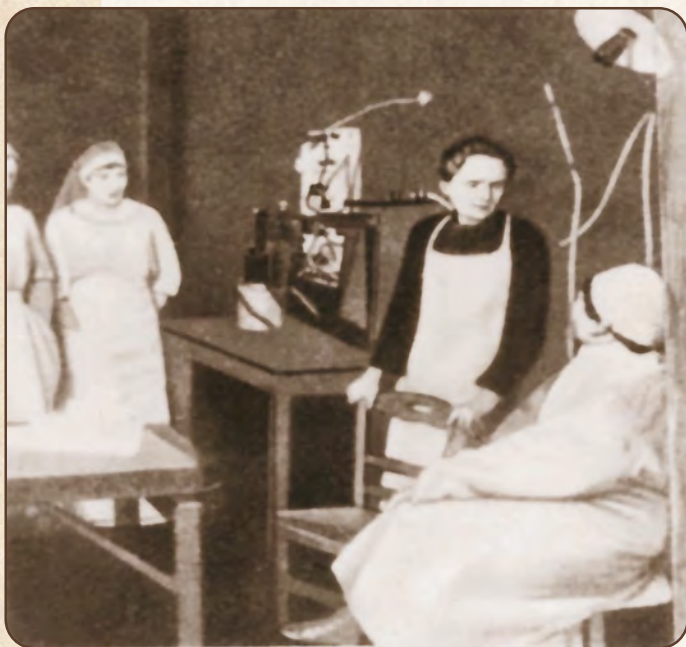
Мари Кюри в передвижной радиологической лаборатории во время первой мировой войны

грузка была трудна и морально, и физически. Насмотревшись на множество молодых людей, оставшихся калеками на всю жизнь, она тяжело переживает чужое горе и испытывает острую ненависть к войне. Как и весь медицинский персонал в те времена плохо защищенная от воздействия рентгеновских лучей, сама Ирен именно там, на фронте, получила первые опасные дозы радиации.