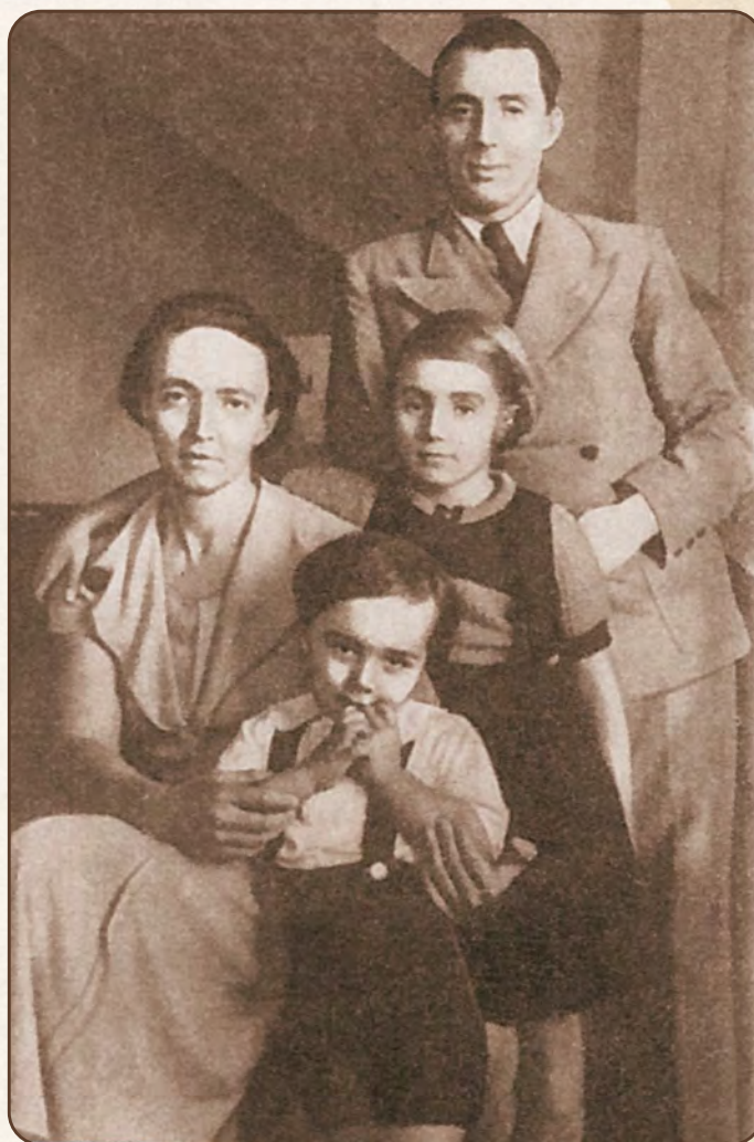
Ирен и Фредерик Жолио-Кюри с детьми

Ирен была потрясена развязыванием новой бойни. Она лучше многих знала, что немцы владели к тому времени ядерными секретами. Кроме того, нападение на Польшу — родину Мари Кюри, где у семьи было много родственников, глубоко ранило Ирен. К тому же она волновалась за Фредерика, который стал активным участником Сопротивления, хранил и готовил оружие для партизан во время