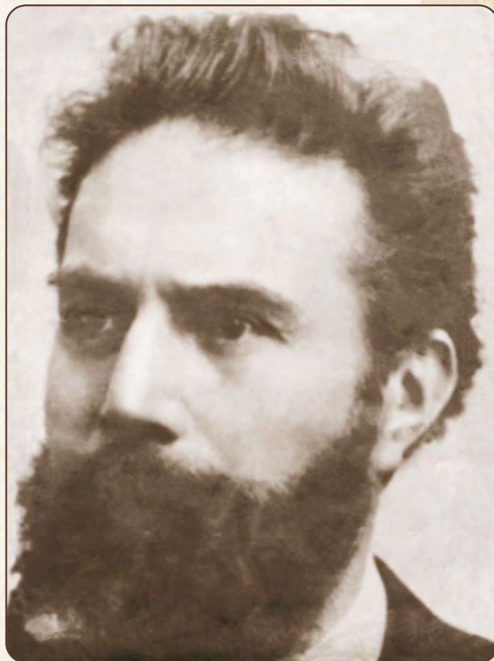
Конрад Рентген, открывший Икс-лучи, названные впоследствии его именем

Получив в распоряжение самые лучшие «снаряды» (высокоактивный полоний с плотностью 200 милликюри на площади 20 квадратных миллиметров), какие только можно было иметь в то время, Жолио-Кюри