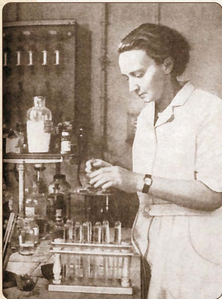
Ирен Жолио-Кюри в лаборатории