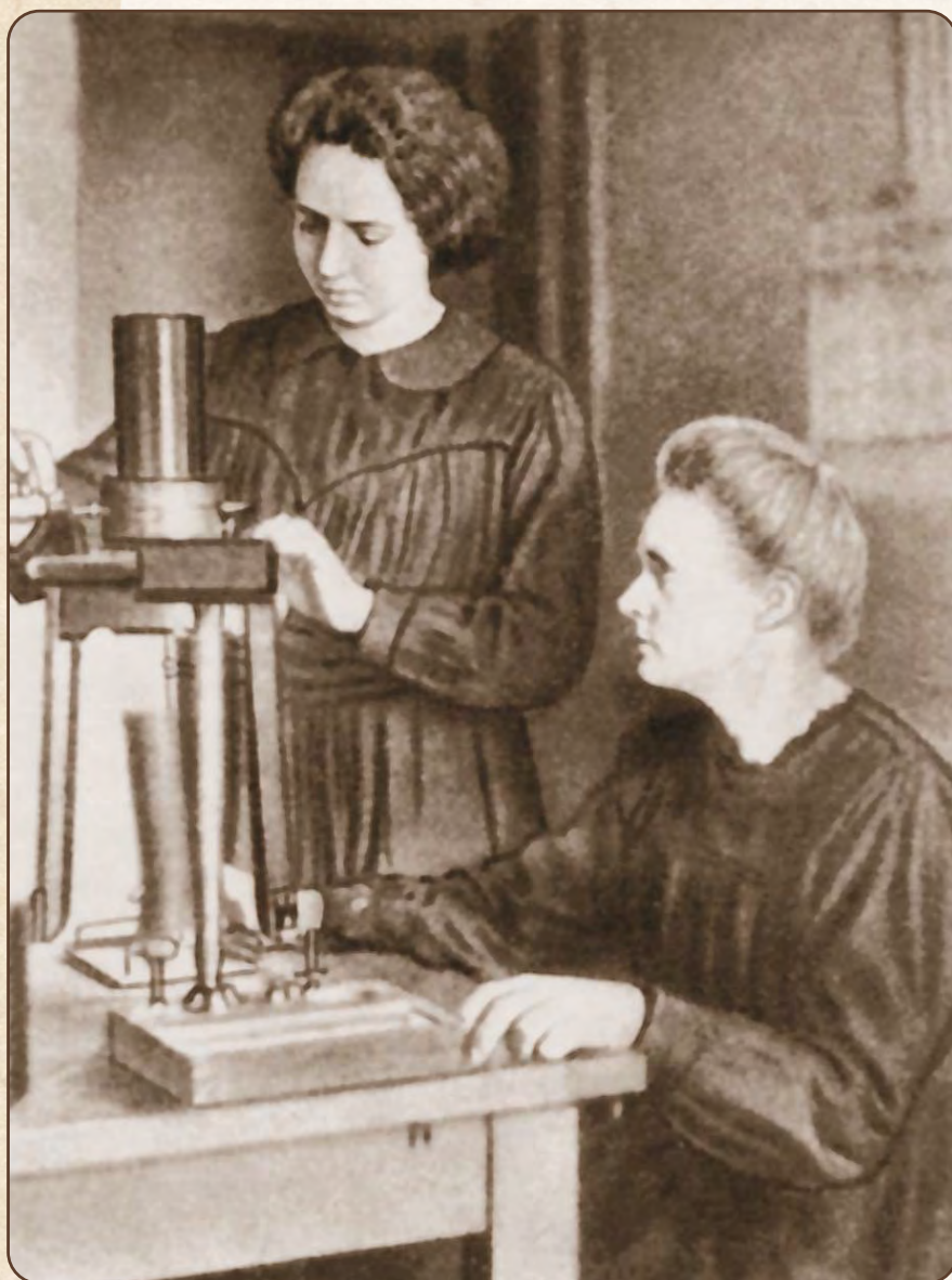
Мари и Ирен Кюри в лаборатории

мь, чтобы ее поняли возможно точнее. Она защищала свои убеждения, формулируя их с полной откровенностью. Страсть к откровенности и ясности была одной из отличительных черт ее ума и характера. Она презирала общеизвестные формулировки, обычно употреблявшиеся в повседневных разговорах и спорах для смягчения резкости суждений. И совершенно не терпела информации, почерпнутой из недоброкачественных источников.