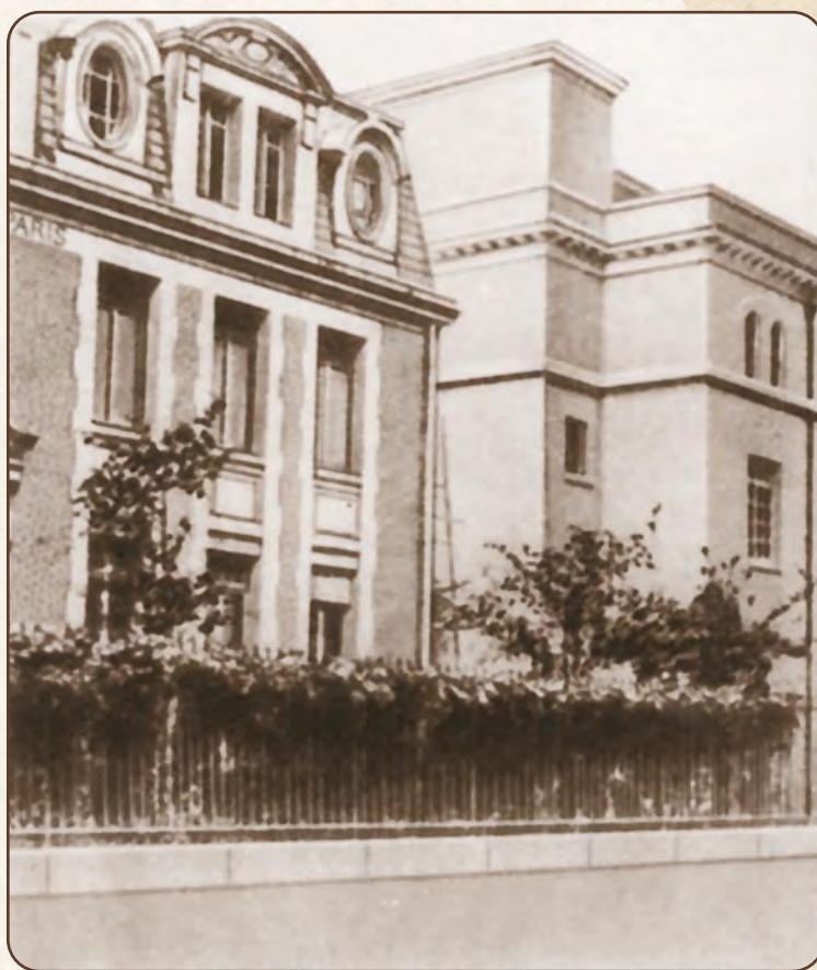
Институт радия в Париже

В 1952 году Ирен заявила: «То, что справедливо для науки, справедливо и для всего остального. Угроза нависла над всей областью культурного обмена. Она подрывает влияние Франции за границей, равным образом она угрожает и французской культуре, которая не может развиваться без влияния культур других народов и без возможностей самой оказывать благотворное влияние за рубежом. Культурные связи являются элементом мира, вне зависимости от того, касаются ли они науч-