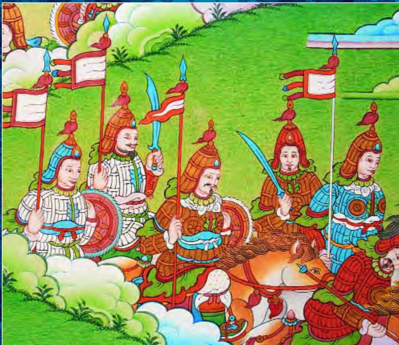
Танка Шамбалы. Фрагмент. Воины Шамбалы