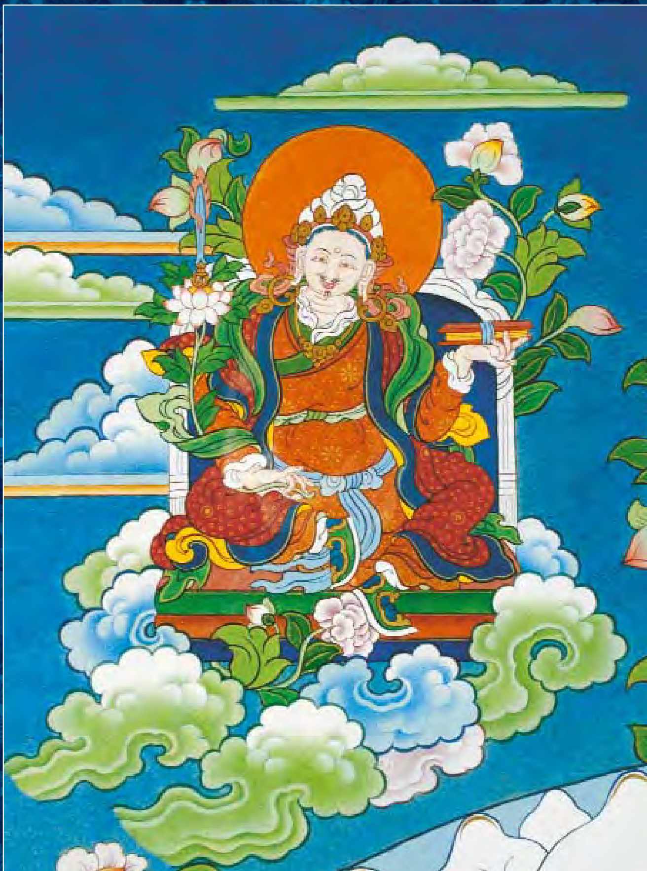
Танка Шамбалы. Фрагмент. Манжушри Кирти, царь Шамбалы