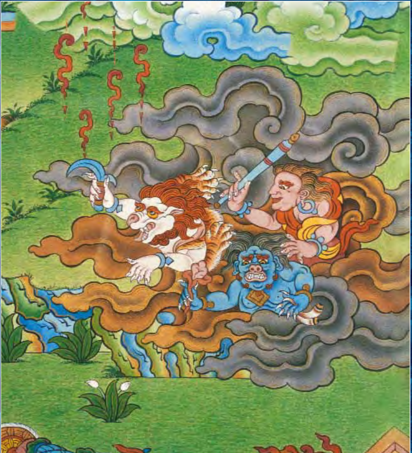
Танка Шамбалы. Фрагмент. Злые духи, которым поклоняются варвары ла-ло