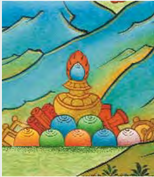
Танка Шамбалы. Фрагмент. Восемь драгоценностей Учения