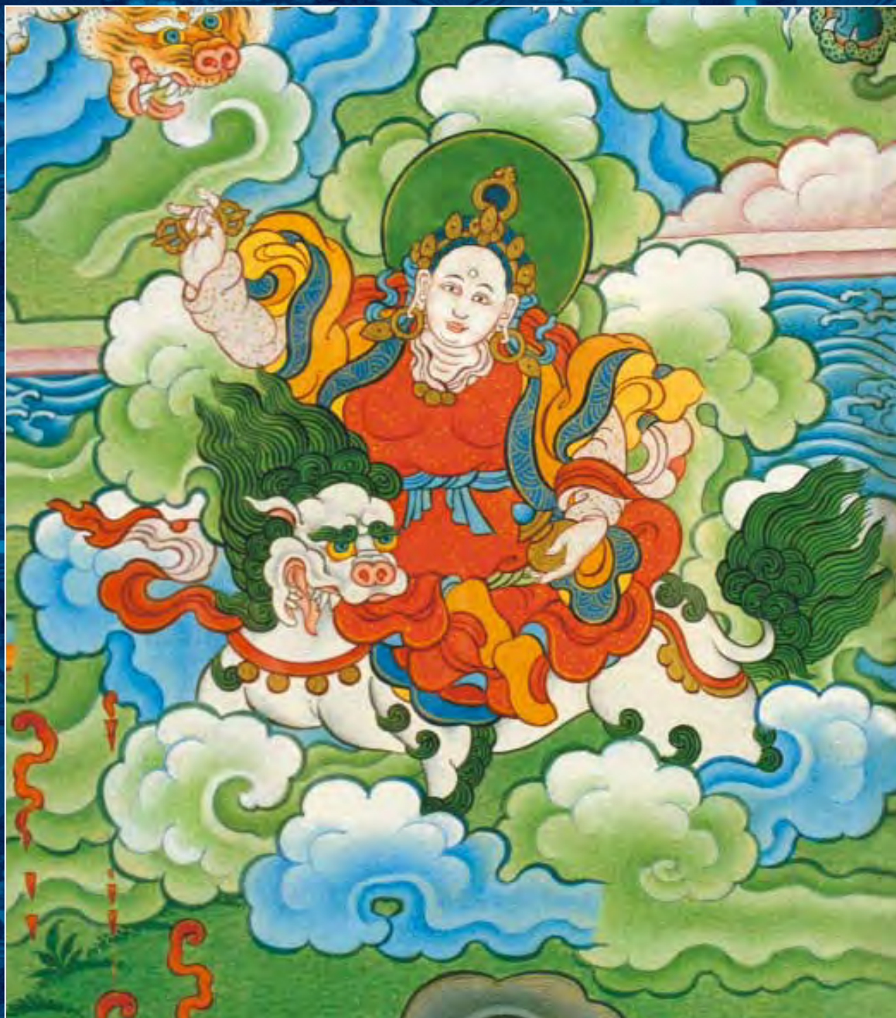
Танка Шамбалы. Фрагмент. Богиня из группы Генма-чуни, охранительница учения Будды