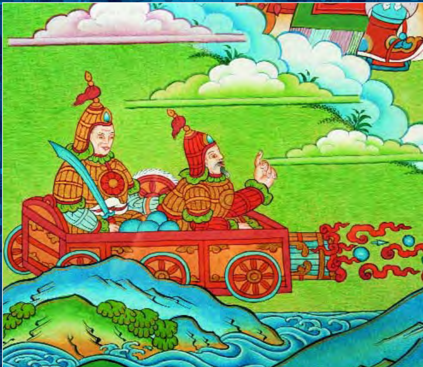
Танка Шамбалы. Фрагмент. Воины Шамбалы