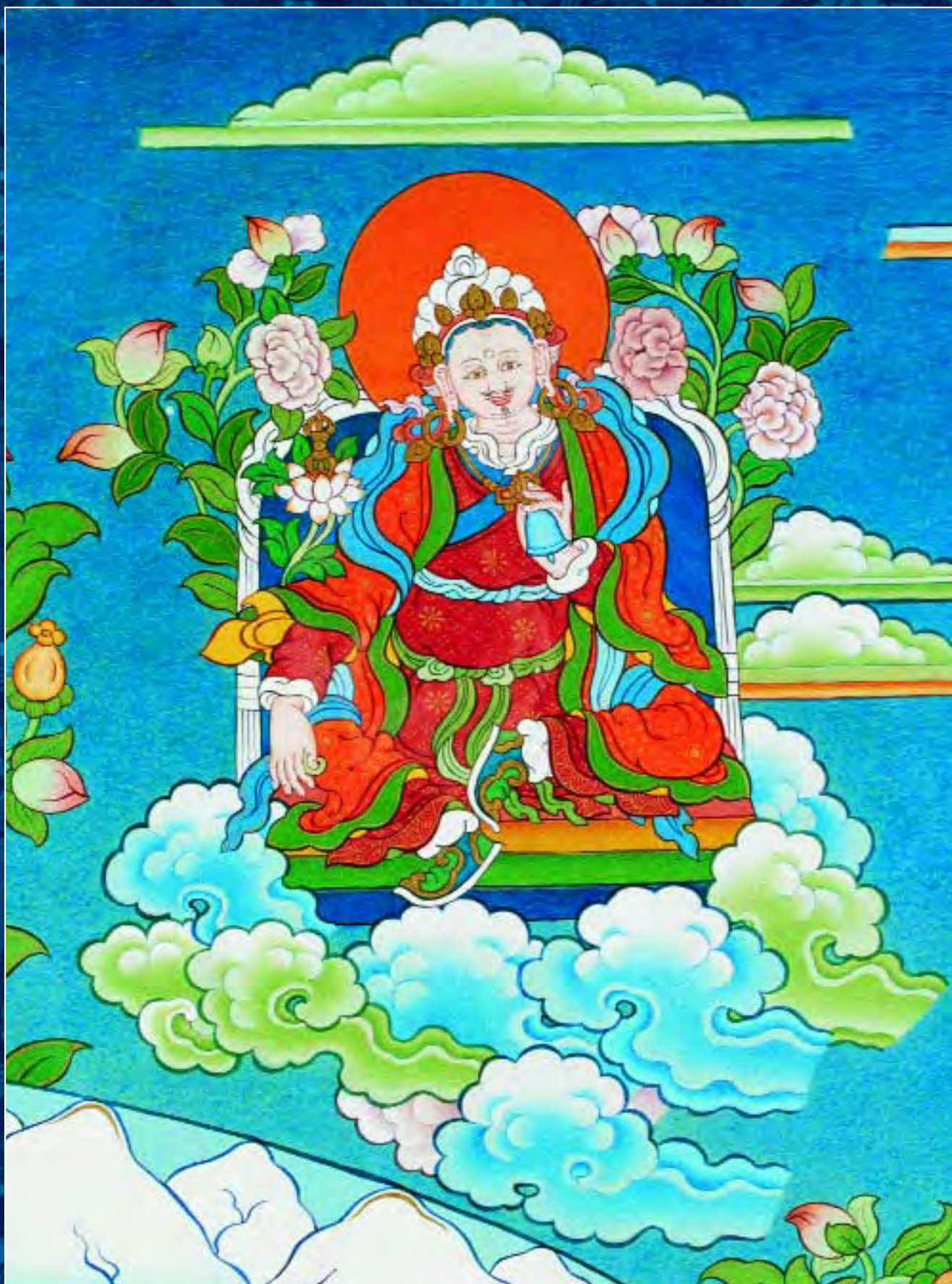
Танка Шамбалы. Фрагмент. Сучандра, царь Шамбалы