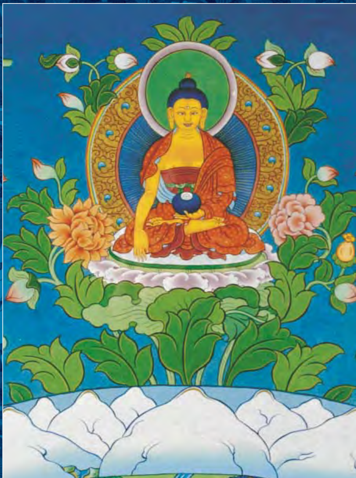
Танка Шамбалы. Фрагмент. Будда Шакьямуни