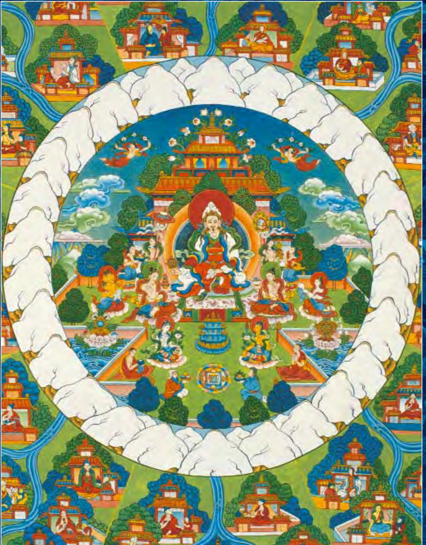
Танка Шамбалы. Фрагмент. Столица Шамбалы Калана