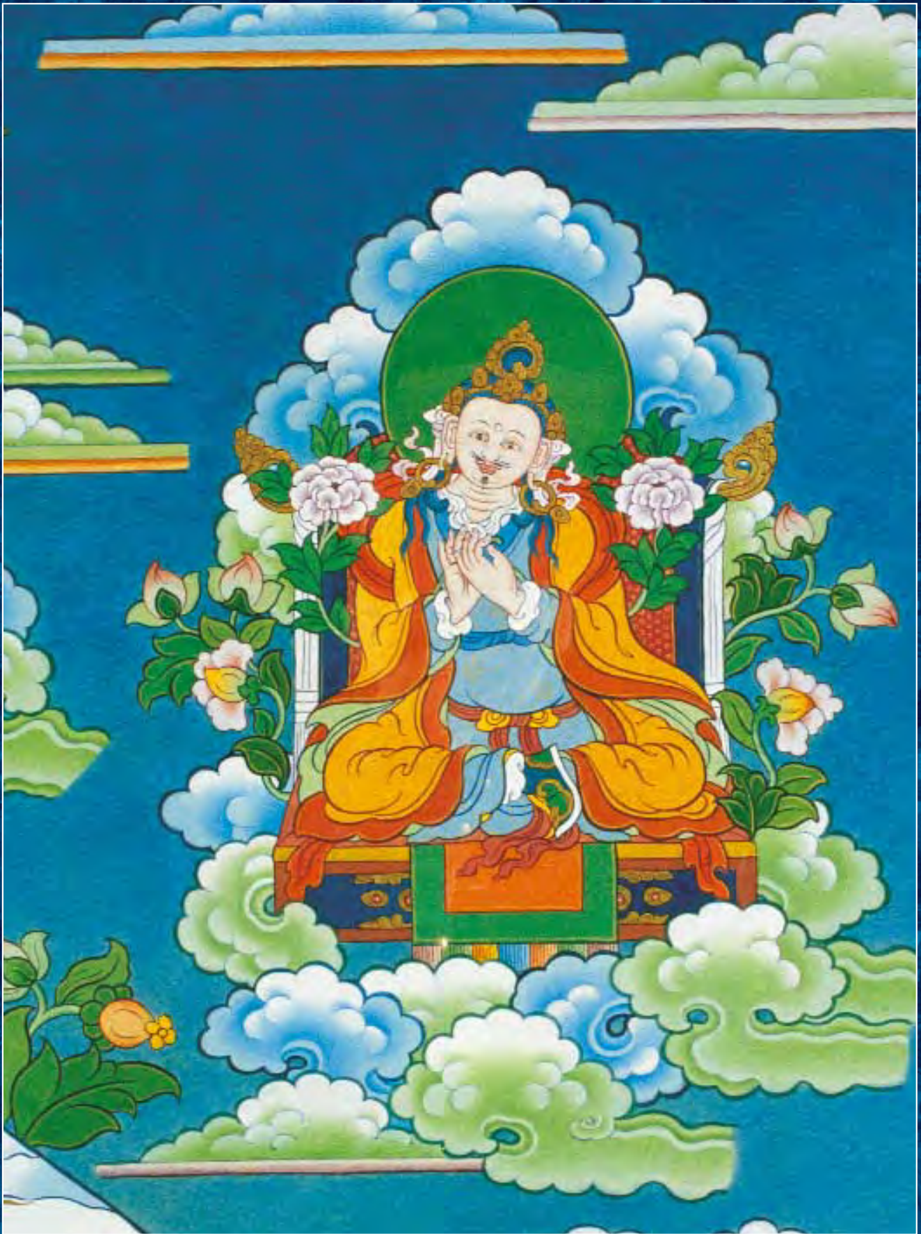
Танка Шамбалы. Фрагмент. Пундарика, царица Шамбалы