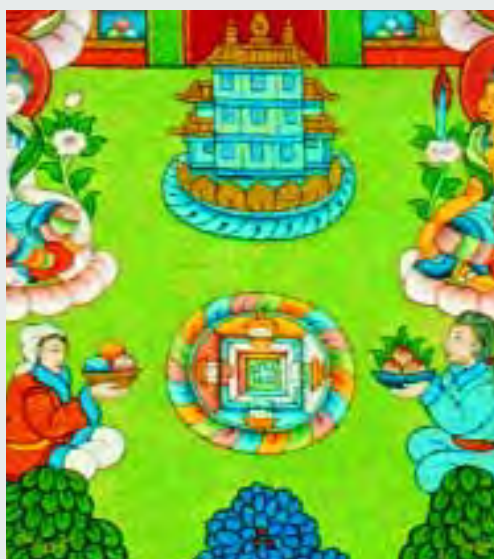
Танка Шамбалы. Фрагмент. Мандала Калачакры

Справа и слева от сада находятся два озера — Прамана и Пундарика, там растут лотосы, на которых изображены подношения. В небе летят две апсары-вестницы, доставляющие указы и вести от царя Шамбалы в другие страны. Апсары несут гирлянды цветов, которые в древней Индии символизировали тонкие энергии. На лепестках написаны специ-