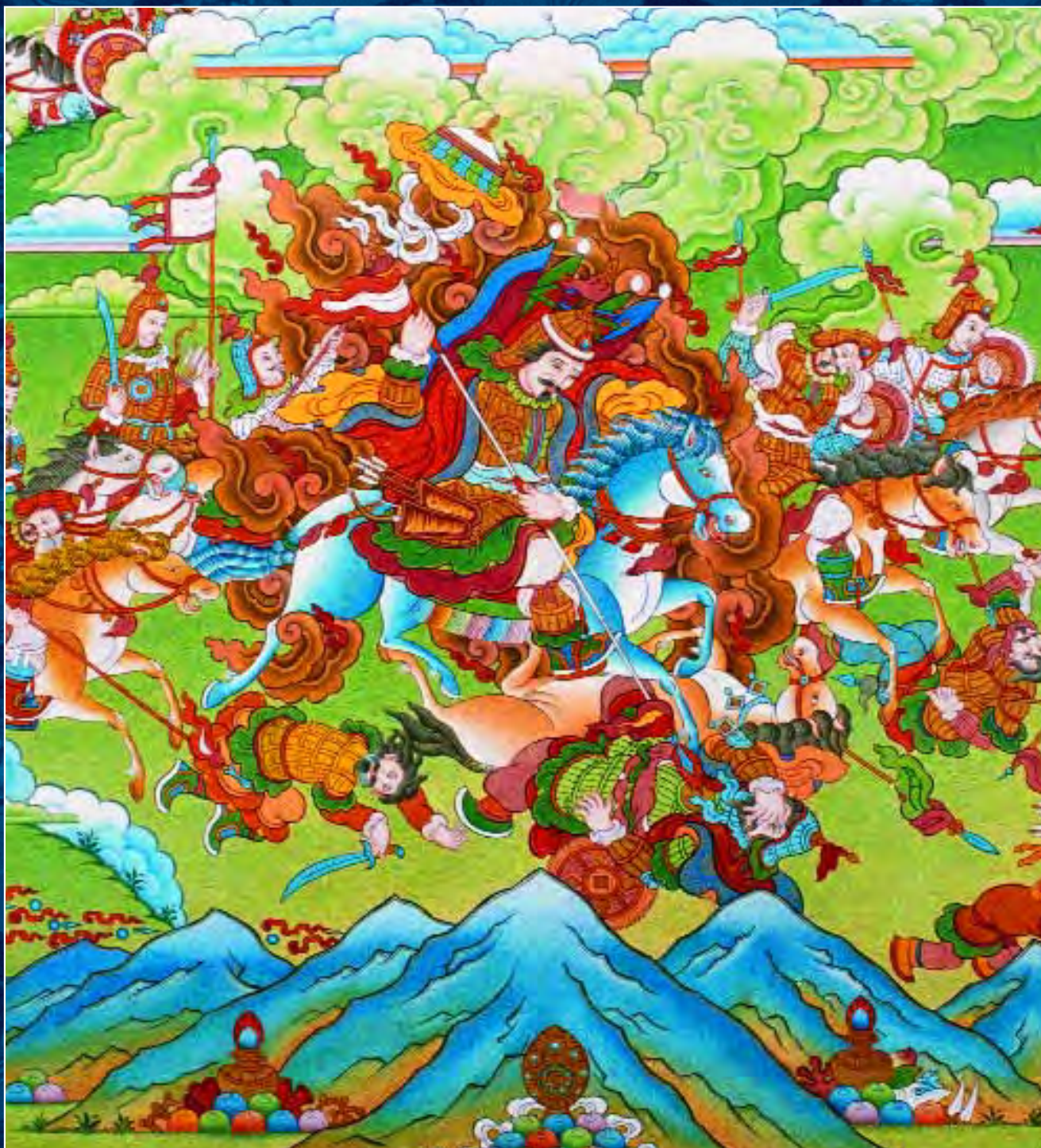
Танка Шамбалы. Фрагмент. Последняя битва Шамбалы