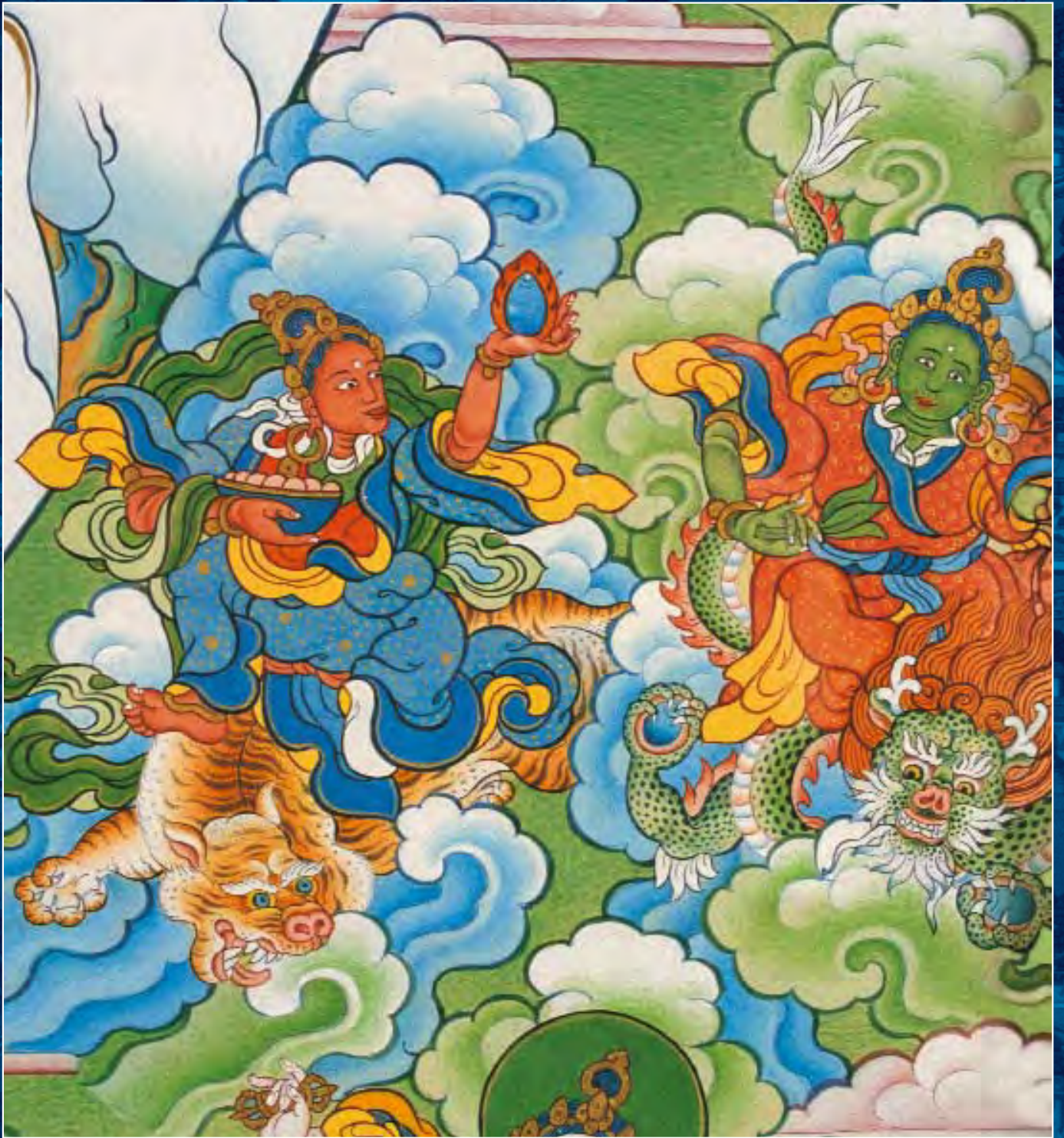
Танка Шамбалы. Фрагмент. Богини из группы Тенма-чуни, охранительницы учения Будды