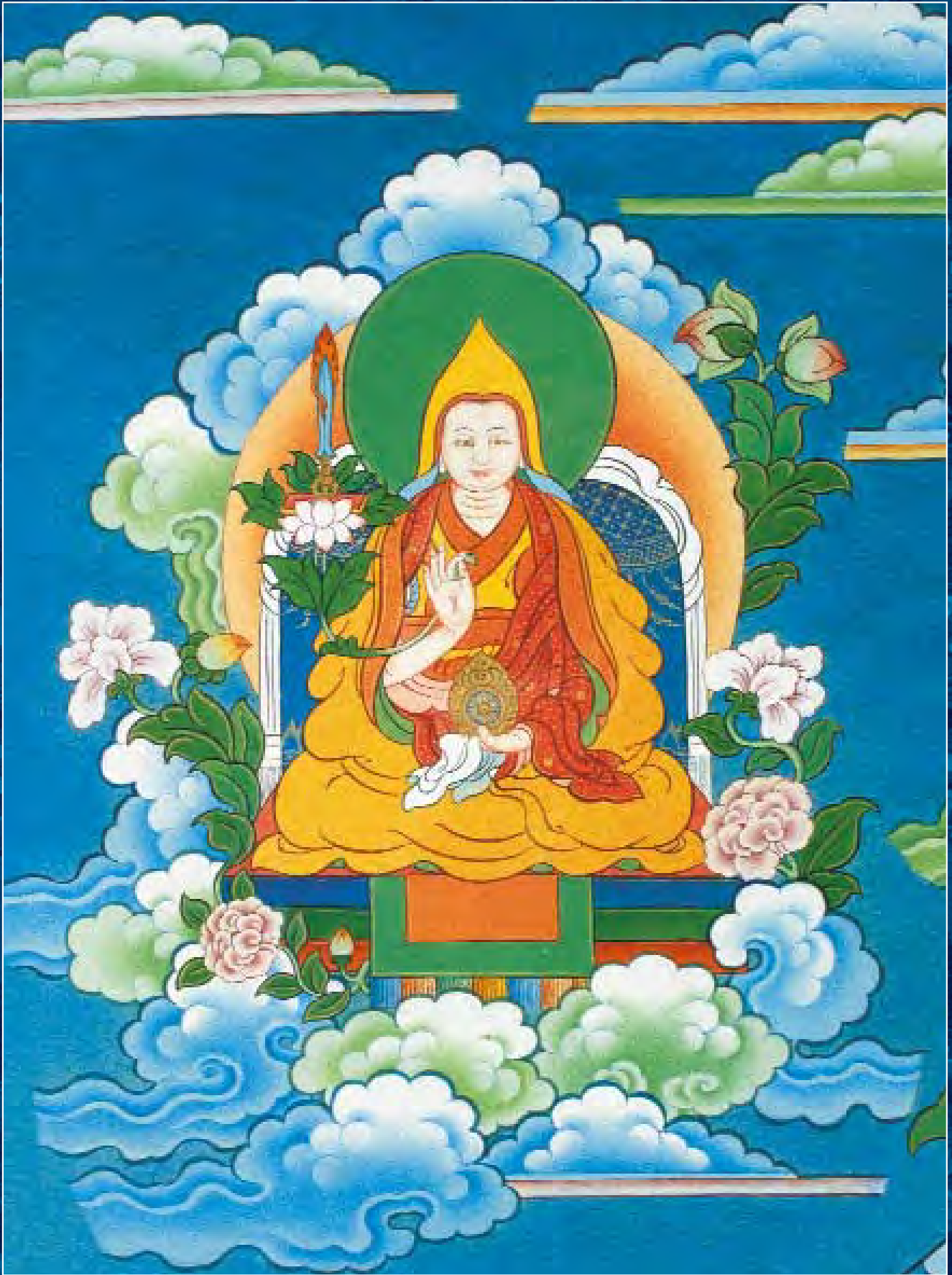
Танка Шамбалы. Фрагмент. Его Святейшество XIV Далай-Лама Тензин-Гяццо