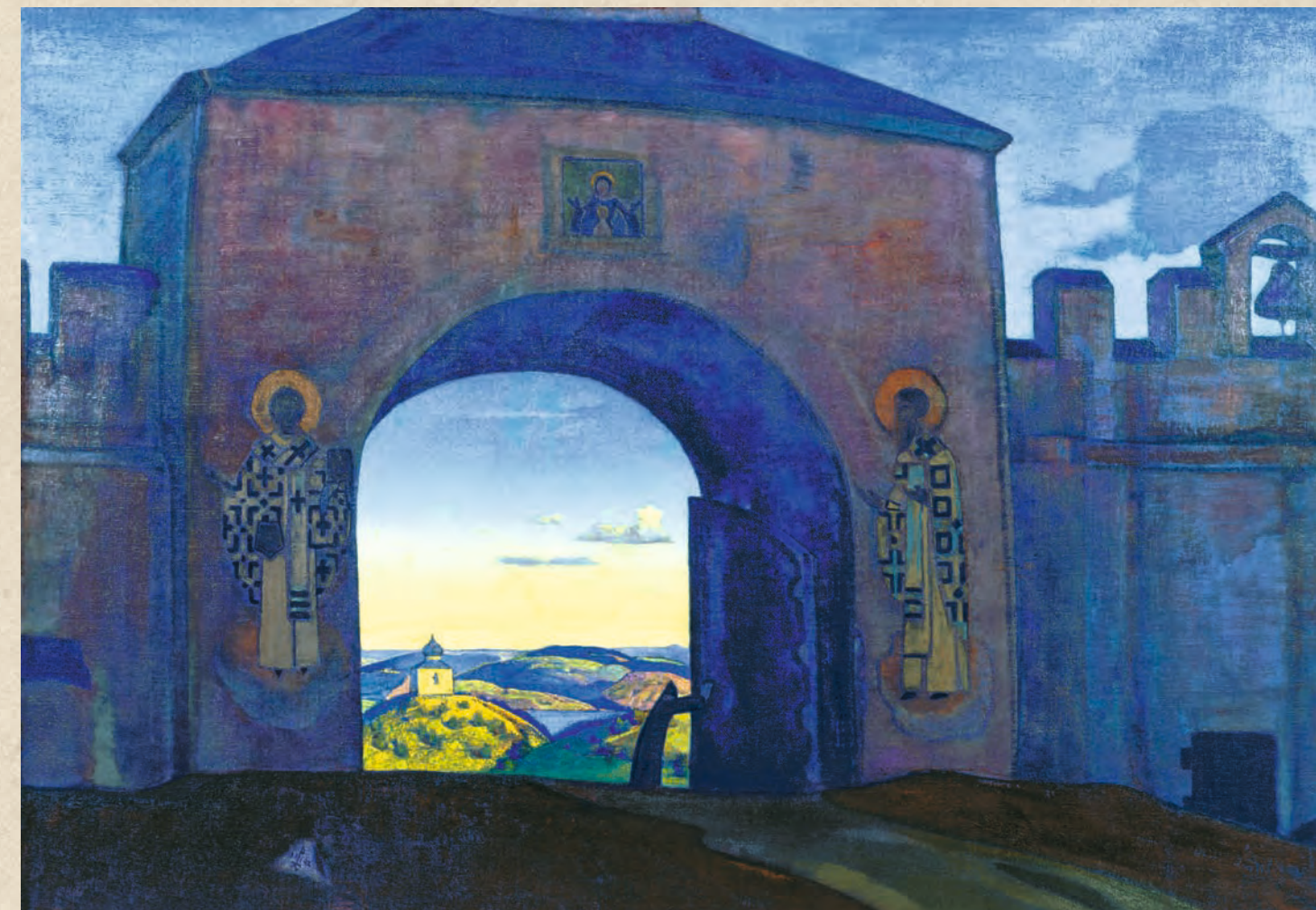
Н.К. Рерих. И мы открываем врата

Рерихи не просто стремились запечатлеть памятники древних времен, но и прилагали усилия возвысить общественный голос в их защиту. «Тогда же впервые оформилась мысль о нужности особого охранения святынь народных», — вспоминал Николай Константинович тридцать лет спустя, в год подписания первого Международного договора об охране культурных ценностей. Есть идеи, которые не стареют и со временем становятся все более актуальными. В новом веке нам всем пред-