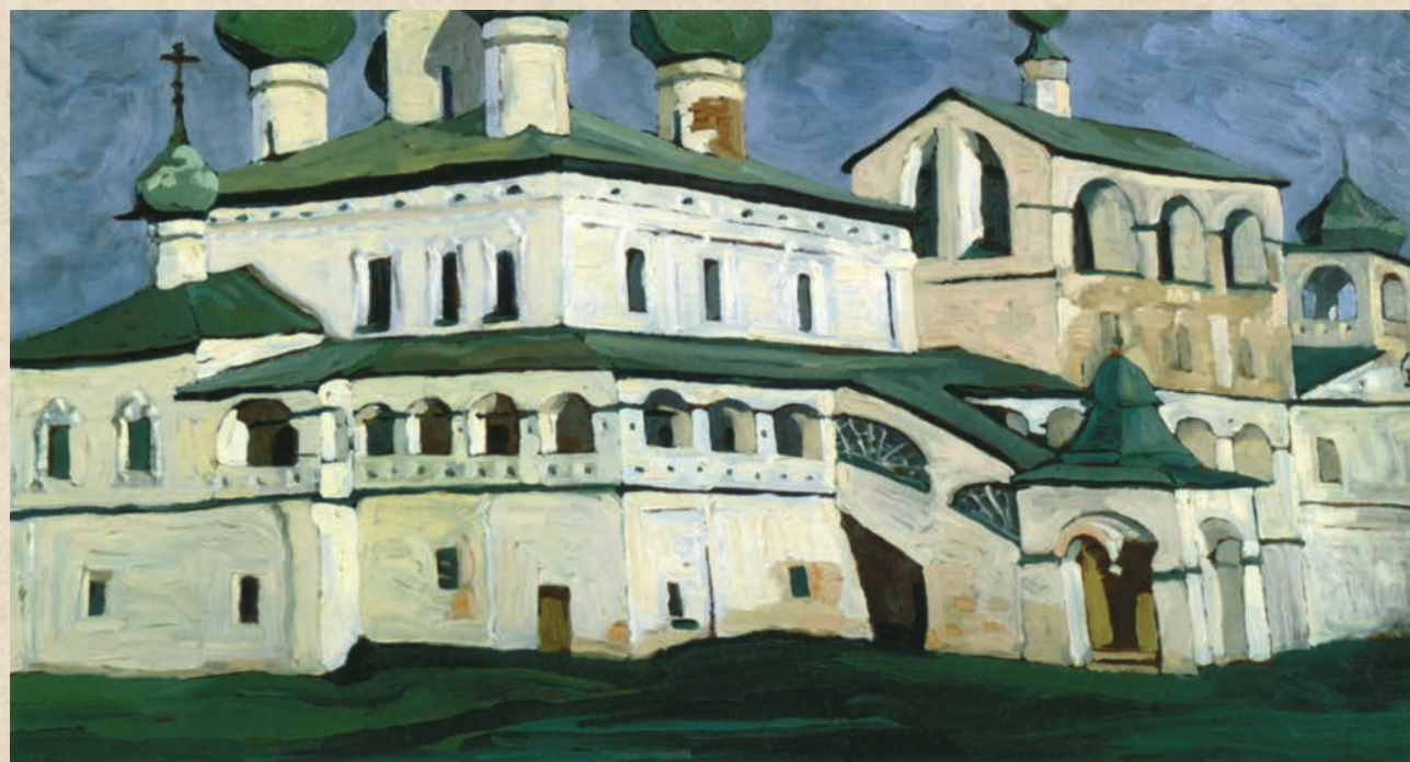
Н.К. Рерих. Углич. Воскресенский монастырь

При всех этих невзгодах, непогоде и бездорожье — всегда поделится с женой своими главными впечатлениями: «Очень красив иконостас собора. Весь убран басмою 16 и темные фигуры свя-