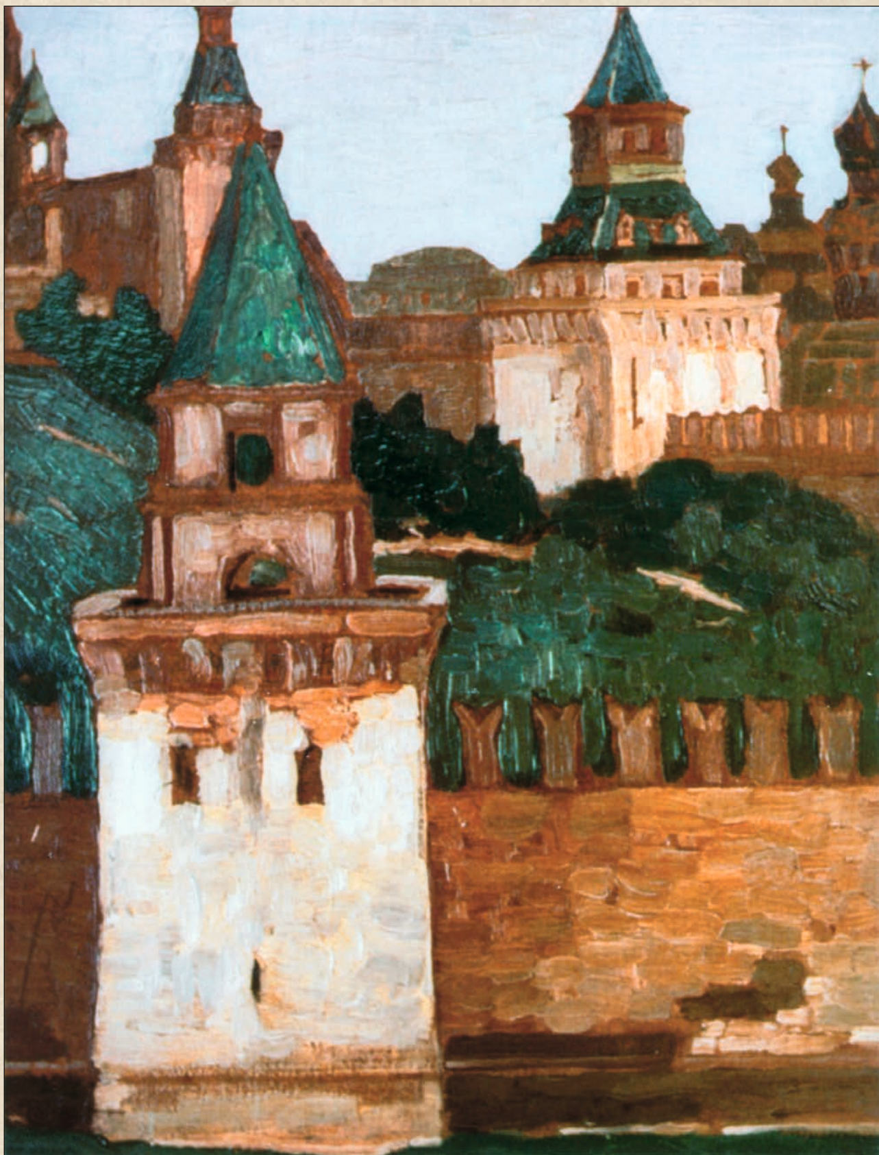
Н.К. Рерих. Замоскворечье

ной культуры, переживают большие трудности, нет денег на содержание и обновление фондов, низкие зарплаты сотрудников и др. Но программа приходила в музей не «пиром во время чумы». Искусство Н.К. Рериха, его конструктивные идеи возрождения и укрепления культуры — все это дает большое воодушевление, «а если является интерес и сознание — находят и средства...» — утверждал Николай Константинович.