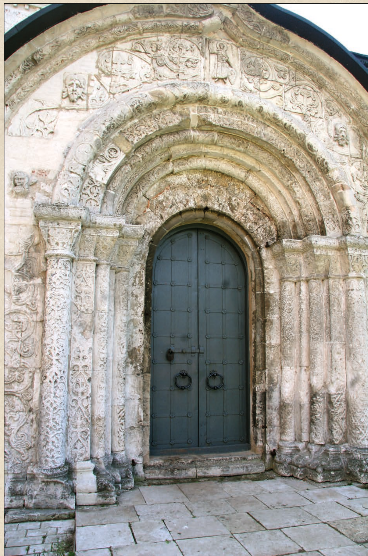
Георгиевский собор. Южный портал. 1234 г. Юрьев-Польский

Впечатления от экспедиции ярко проявились и в театральном творчестве художника. Декорации и костюмы, выполненные по эскизам Н.К. Рериха к операм Н. Римского-Корсакова «Снегурочка»