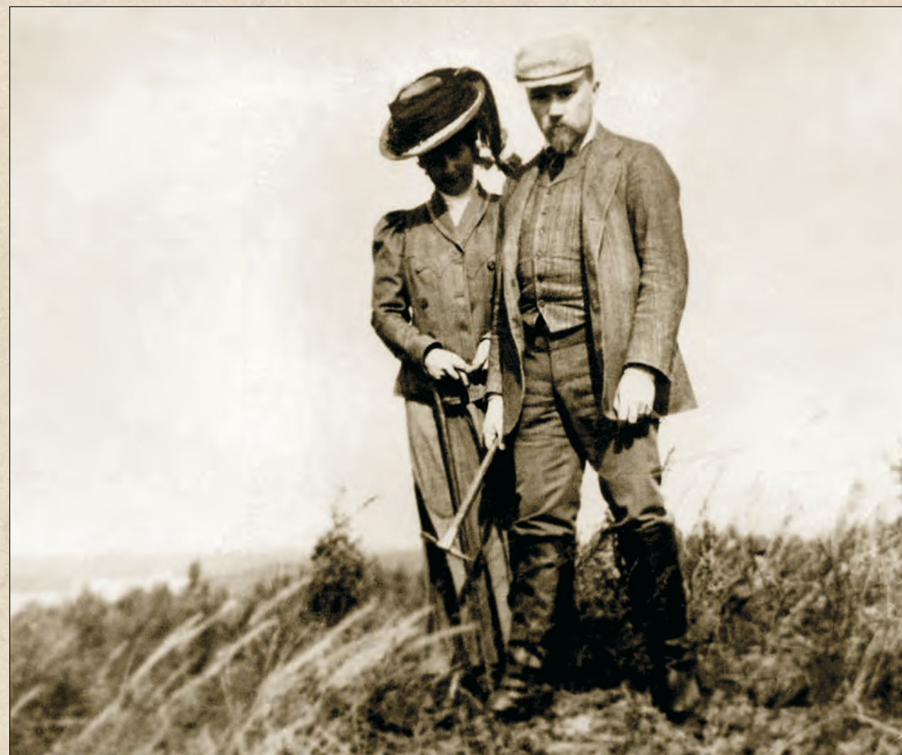
Е.И. и Н.К. Рерихи. 1903

Чтобы не подумалось кому-то, что экспедиция Рерихов была комфортабельным путешествием преуспевающего художника со своей женой, не лишними будут несколько выразительных эпизо-