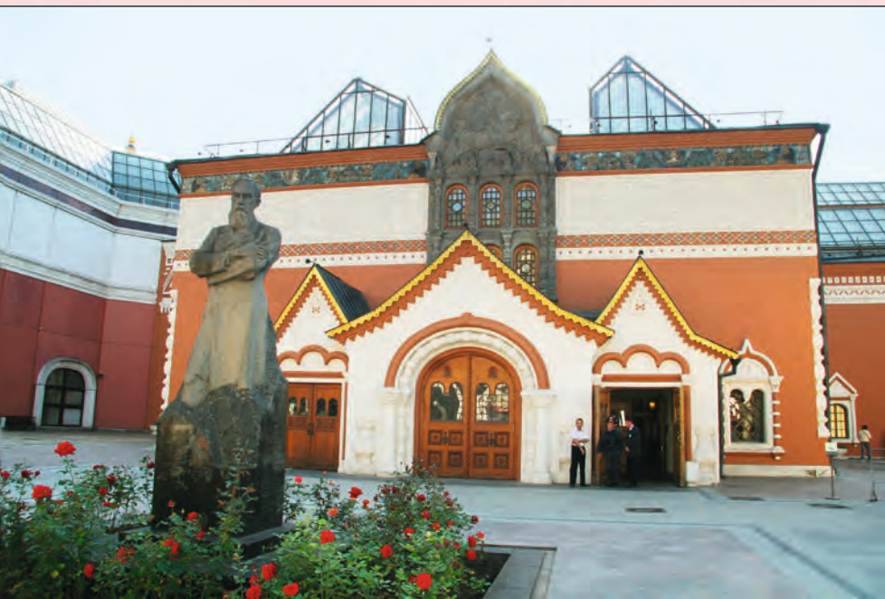
Третьяковская галерея. Москва

В этимологии слова «святыня» скрыт еще один важнейший смысл: святыни есть носители и хранители святости, благодати Духа Святого. Святость есть действованный (от греч. energeia — действие) свет высших слоев бытия, его энергичная претворенность в какой-то подвижнический земной поступок и в реальные земные лики. «Святые суть те, — писал С.Н. Булгаков, — кто подвигом своей действительной веры и деятельной любви осуществили в себе свое богопо-