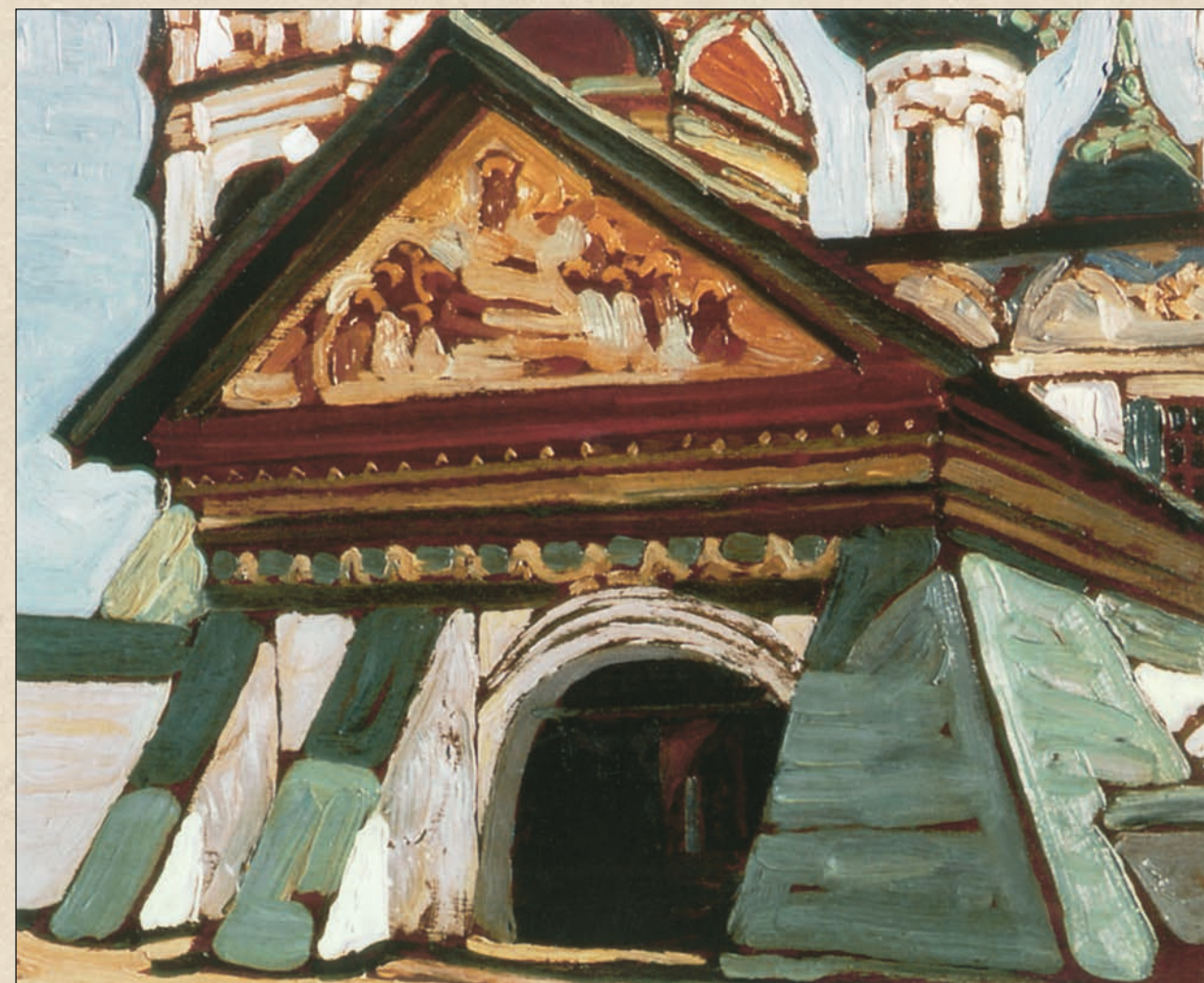
Н.К. Рерих. Ярославль. Вход в церковь Николая Мокрого

За два года работы программы Тверская областная рериховская организация совместно с общественностью города Бологое восстановила разрушенный Памятник Любви, посвященный первой встрече Николая Константиновича и Елены Ивановны Рерихов, восстановила мемориальную пли-