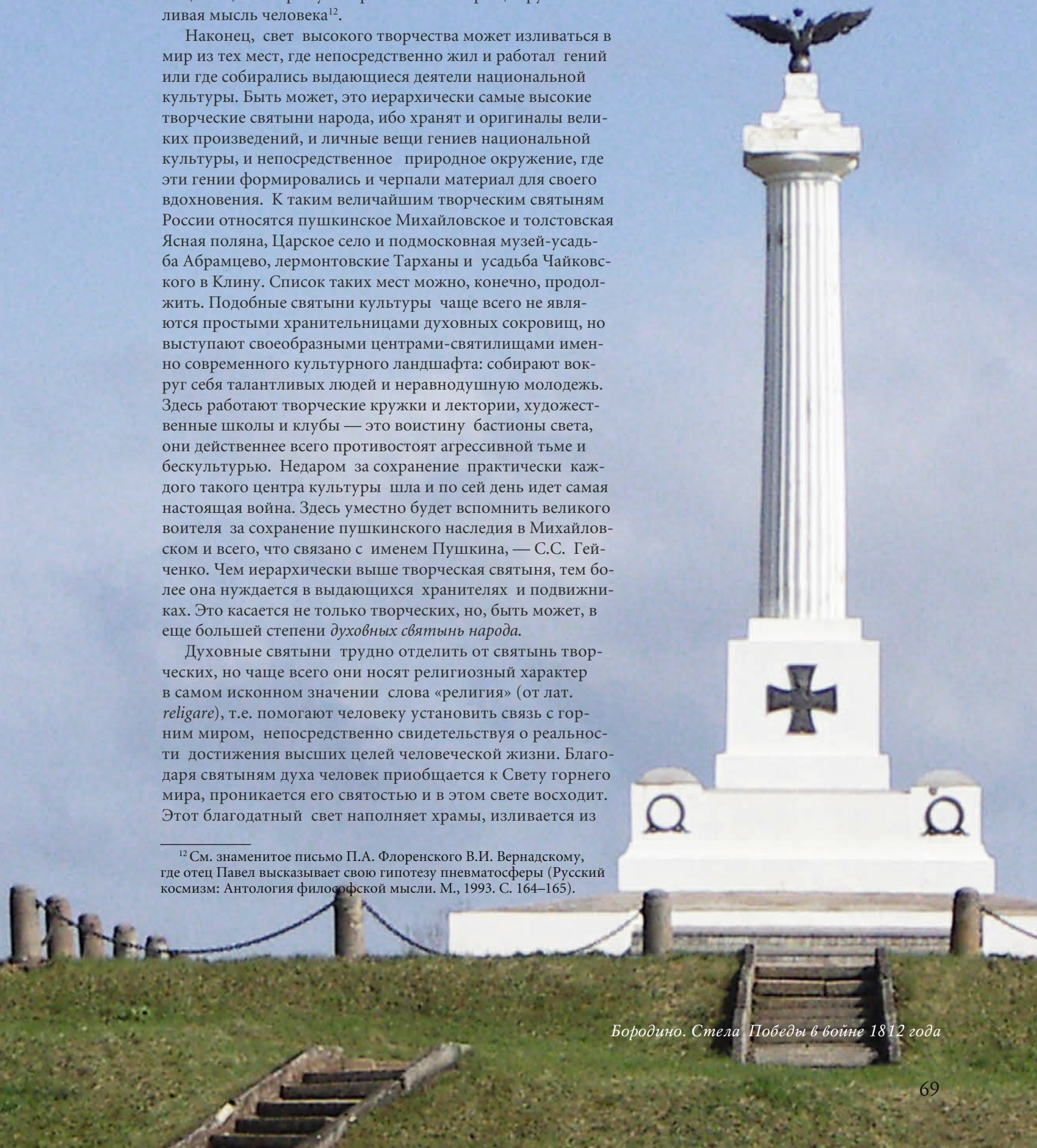
Бородино. Стела Победы в войне 1812 года