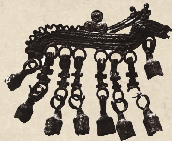
Бронзовые шумящие подвески на пояс. Раскопки графа А.С. Уварова, 1852 г.

Ценность художественных открытых писем и альбомов, о которых идет речь, заключалась не только в доходах в пользу Красного Креста, но и в беспрецедентном широком просветительстве. В 30-е годы на маршруте Маньчжурской экспедиции Н.К. Рерих писал: «Это издательство художественных открыток оставило в течении русского искусства свою прекраснейшую страницу. Оно широко распространяло как русские, так и иностранные художественные произведения. Распространяло сведения об исторических памятниках России и всегда привлекало к ближайшему участию наиболее свежие и широко мыслящие силы. <...> Сколько новых сведений о сокровищах русских общедоступно вливалось в широкие народные массы» 6 . Николай Константинович давал высокую оценку этому культурному явлению не как сторонний наблюдатель — он имел близкое сотрудничество с упомянутым Комитетом. Точнее, с Общиной Святой Евгении, созданной при Комитете в 1893 году. Общине покровительствовала принцесса Евгения Максимилиановна Оль-