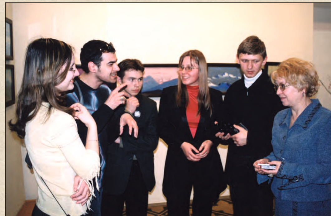
На маршруте программы. Студенты Владимирского государственного университета обсуждают свои впечатления

В какой стране хотели бы жить? Конечно, в стране Культуры.