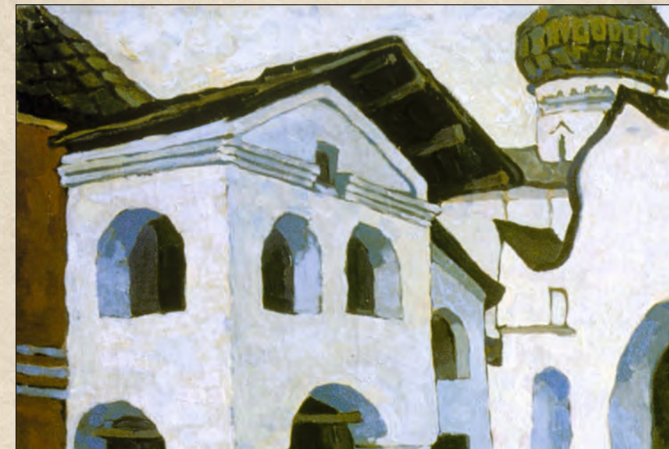
Н.К. Рерих. Псковский погост

В биографии Рерихов была грандиозная Центрально-Азиатская экспедиция, но она не должна затмить в нашем сознании эту первую, осуществленную в начале их совместного пути. Она не была путешествием для развлечения и отдыха, это — именно экспедиция со всем богатым культурно-научным результатом. В ходе ее проводилась художественная и научная работа: был собран богатейший материал об особенностях эпох