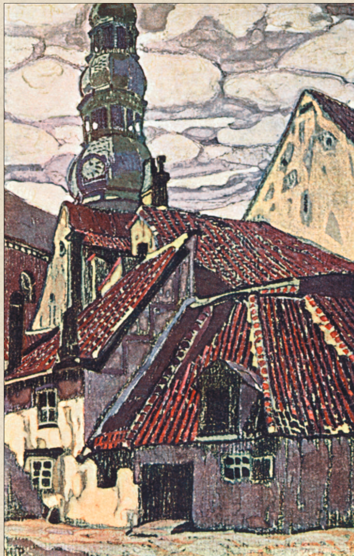
Н.К. Рерих. Старая Рига. Открытка Общины Святой Евгении