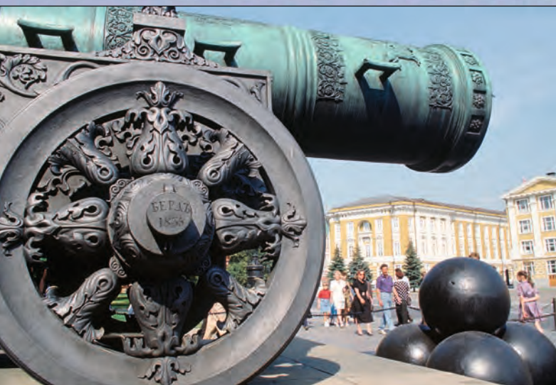
Царь-пушка в Московском Кремле