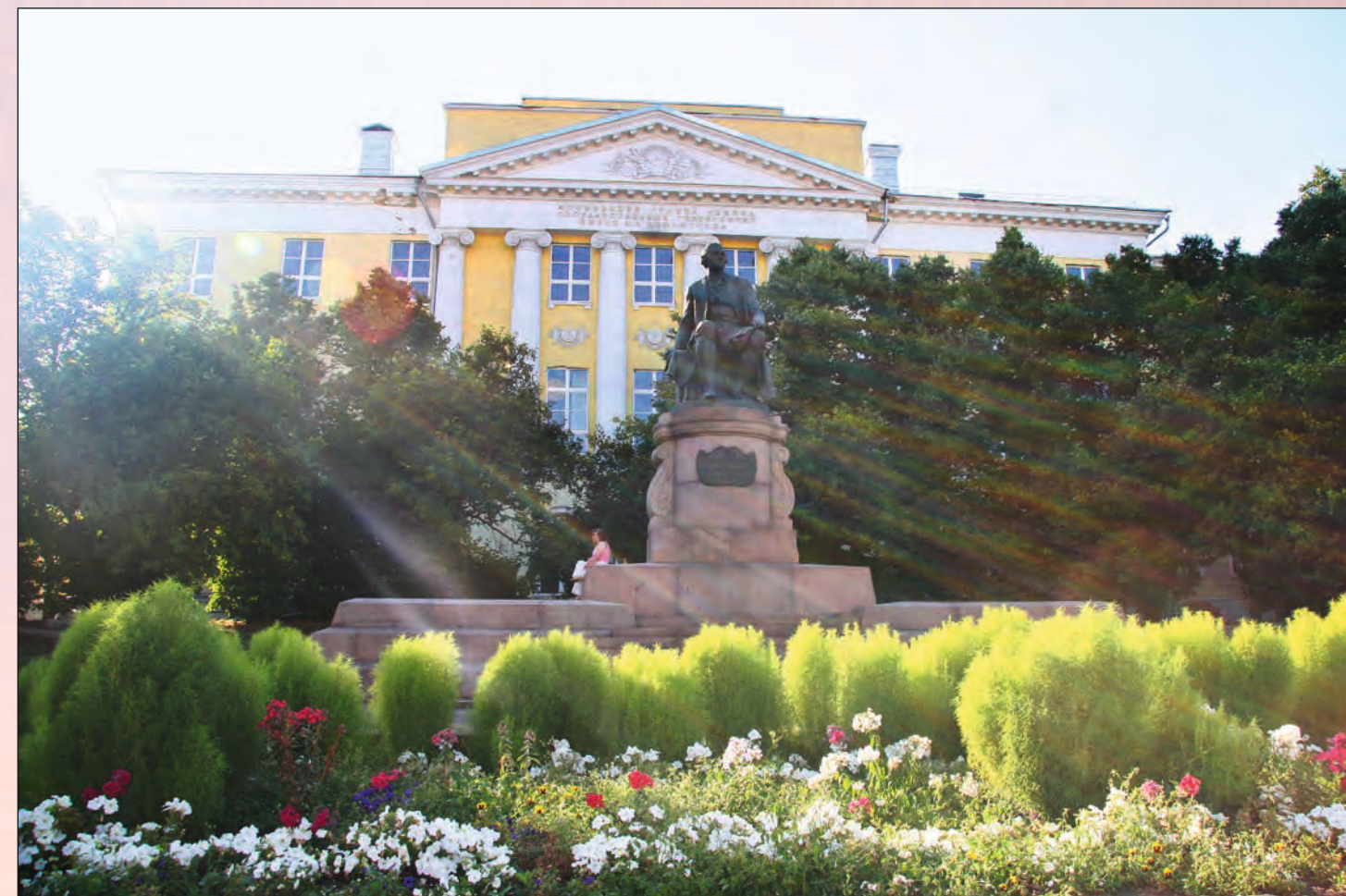
Московский государственный университет им. М.В. Ломоносова. Факультет журналистики.

добие и тем явили в силе Божий образ, чем и привлекли к себе избыточную благодать Божию» 4 . И далее: «...Святым и за гранью смерти дано творить дела любви не в качестве подвига для своего спасения, которое уже совершено, но, действительно, для помощи в спасении других собратьев. И мера силы этого деятельного участия соответствует мере духа и величию его подвига» 5 . Святыни хранят нетленную память о святых подвижниках веры и их святых делах, выступая неоскудевающим источником благодатных энергий для приходящих на поклонение к ним.