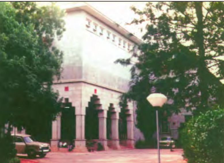
Академия художеств Карнатака Читракала Паришат