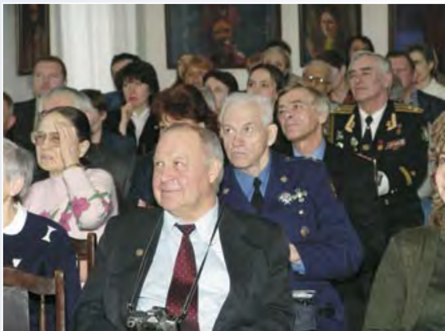
Участники акции «Колокол Мира»