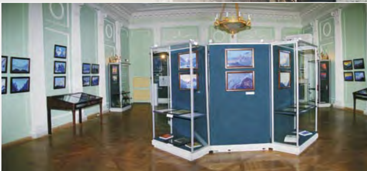
Выставка картин Н.К. Рериха «Весть Красоты» во Всероссийском музее А.С. Пушкина (Санкт-Петербург)