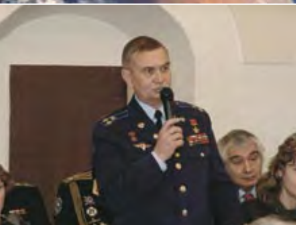
Выступает А.Н. Березовой

Летчик-космонавт, Герой Советского Союза А.Н. Березовой , инициатор и ежегодный организатор акции «Колокол Мира в День Земли», в своем выступлении сказал: «Колокол Мира возвещает землянам о том, что нужно вместе противостоять всем существующим угрозам — и для самого человека, и для нашей красивой и хрупкой Земли. Сегодня Колокол Мира будет звонить по тем, кто погиб от цунами, от террористических актов — они хотели жить, но их жизнь оборвана катастрофами». С 80-х годов прошлого века Колокол Мира ежегодно звонит в штаб-квартире ООН в Нью-Йорке. Он отлит из монет, которые, мечтая о мире, собрали дети из 60 стран. Завершая свою речь, Анатолий Николаевич отметил, что день весеннего равноденствия выбран для праздника астрономически точно. Сотни, тысячи, миллионы лет Земля будет существовать на своей орбите, вращаясь вокруг Солнца, а потому эта акция приобретает большое символическое значение и имеет право на долгую жизнь.