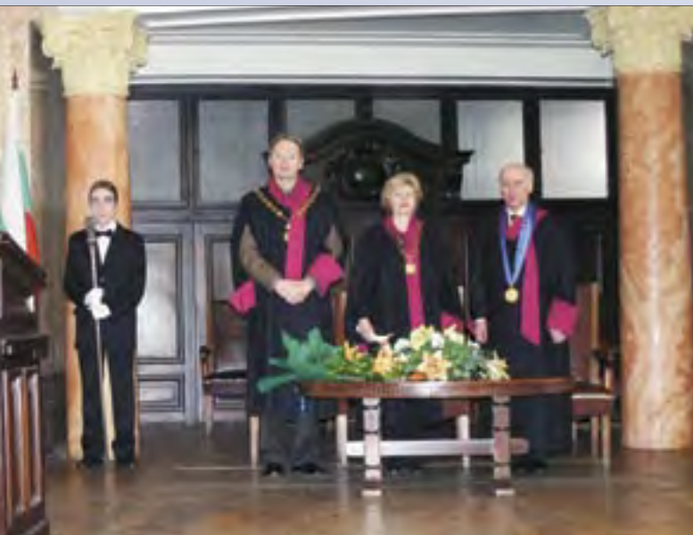
Церемония чествования почетных докторов Софийского университета

во Шалвы Александровича «Гуманно-личностная педагогика: теория и практика». Это было выступление учителя, сердце которого всегда устремлено к ученикам и притягивает их своей искренностью, мудростью и добротой.