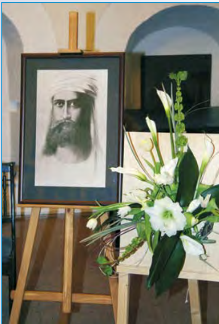
День Учителя в МЦР

Подарком к праздничному вечеру стал новый фильм санкт-петербургского режиссера Луизы Тележки «Сознание: накануне революции». Фильм знакомит с размышлениями и практическими исследованиями ученых разных стран, в него включены фрагменты Международной научной конференции «Космическое мировоззрение — новое мышление XXI века», которая проходила в октябре 2003 года в Международном Центре Рерихов.