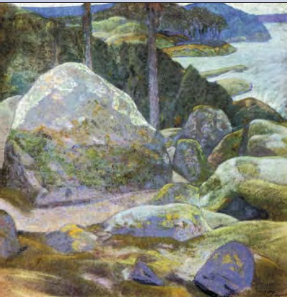
Н.К. Рерих. Седая Финляндия

те крылья, которые через все препятствия несут нас во имя самого благородного и самого творческого? Прекрасное ведет нас через все мосты. Прекрасное открывает наиболее тяжкие затворы. Прекрасное тклет светоносные крылья и объединяет души человеческие в их стремлении к единому Свету» 3 .