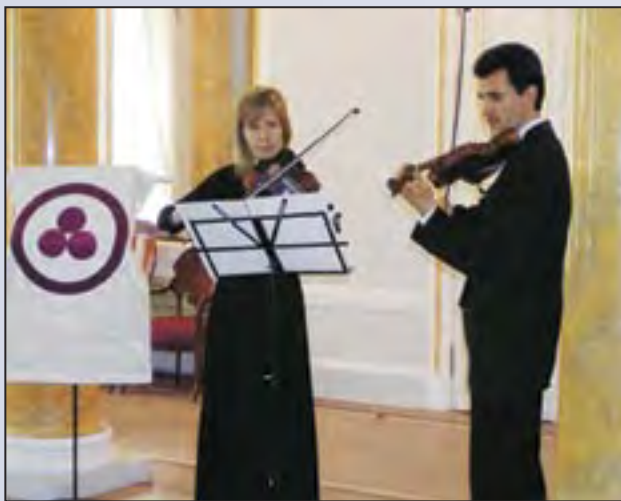
Праздничный концерт в Доме Г.Р. Державина

10 лет назад, они нашли неожиданную форму привлечения внимания к проблеме спасения архитектурных памятников — стали проводить театрализованные действия возле защищаемых объектов.