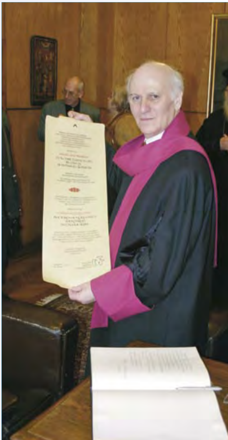
Ш.А. Амонашвили — Почетный доктор Софийского университета имени святого Климента Охридского