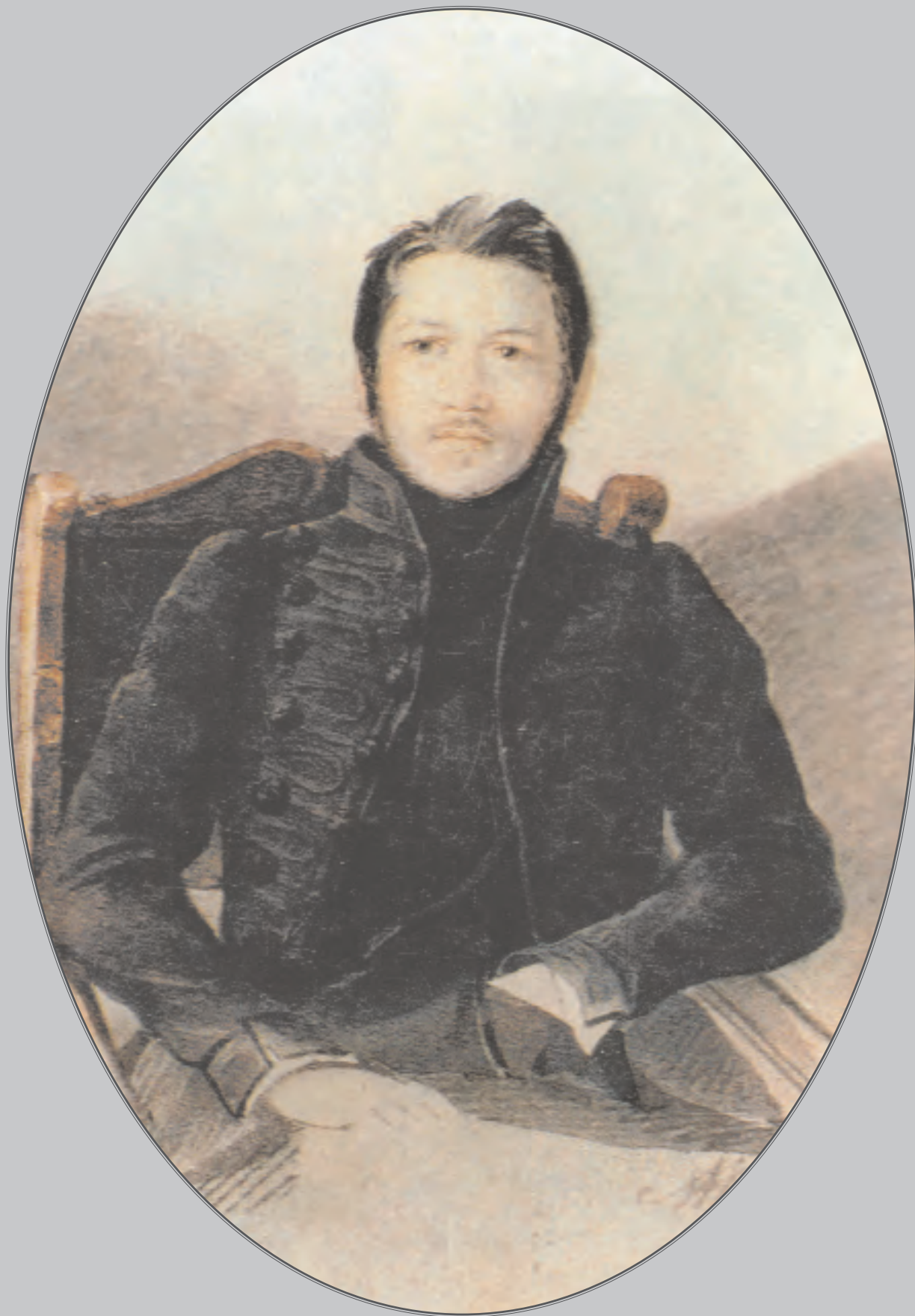
М.И. Глинка. 1834 г. Портрет работы Н. Волкова