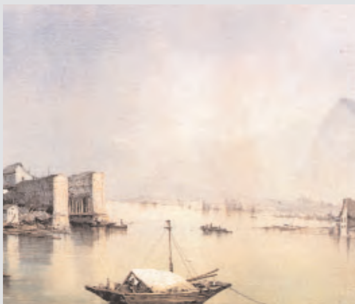
Акварель, привезенная И.А. Гончаровым из путешествия

Рассказывая о дальних землях и странах, писатель отдает должное описанию пышных красот южной природы, но в жизни других народов его интересует не столько экзотика, сколько желание уловить и понять духовные основы нации, философию жизни. Романский триптих Гончарова и его «Фрегат “Паллада”» выявляют неполноту, ограниченность «старых» и «новых» правд, прямолинейных противопоставлений Запада и Востока, общепринятых суждений о ходе исторического процесса и об устройстве мира.