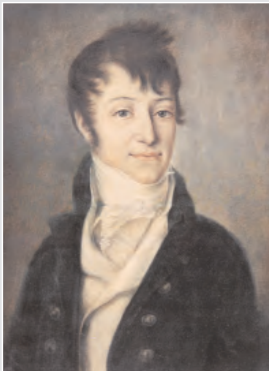
Иван Николаевич Глинка (1777—1834)