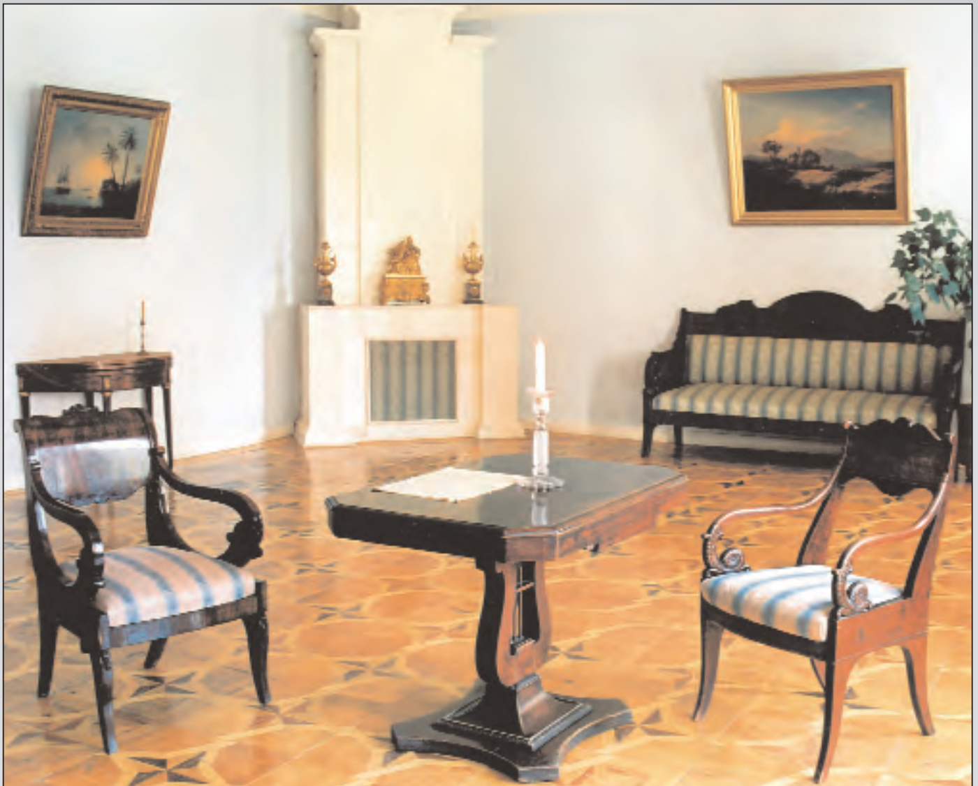
Одна из комнат Музея-усадьбы М.И. Глинки

Смоленщина подготовила к юбилейной дате фестиваль, конференцию, выставку, концерты. Новые документы и источники рассказывают об истории рода Глинок, издано несколько книг, содержащих неизвестные или малоизвестные материалы о композиторе и его смоленском окружении. Многие делается для сохранения первоначального облика усадьбы, ремонтируется дом. В Новоспасском и в Ельне будут установлены бюсты М.И. Глинки. Состоятся торжества в Москве, Санкт-Петербурге, других городах России — праздник, посвященный двухсотлетию со дня рождения Михаила Ивановича Глинки, — праздник поистине всероссийский, всенародный.