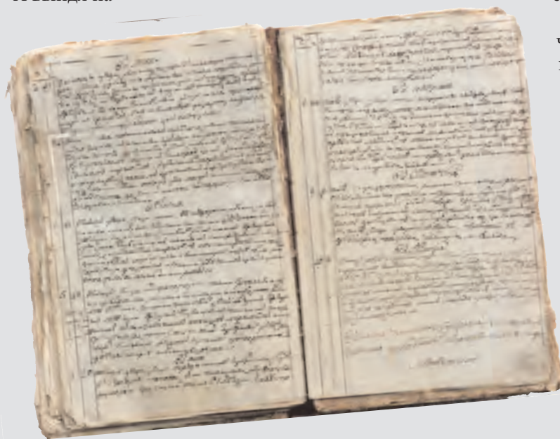
Запись в метрической книге о рождении М.И. Глинки