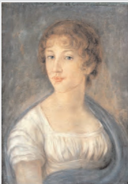
Евгения Андреевна Глинка (1783—1851)

тему итальянского романа «Благословенна буди мать». Это произведение стало первым из напечатанных. В том же 1826 году Глинка создал «Пролог». Он считал эту кантату своим первым удачным вокальным произведением крупной формы. На смоленской земле также были написаны романсы «Бедный певец» и «Утешение».