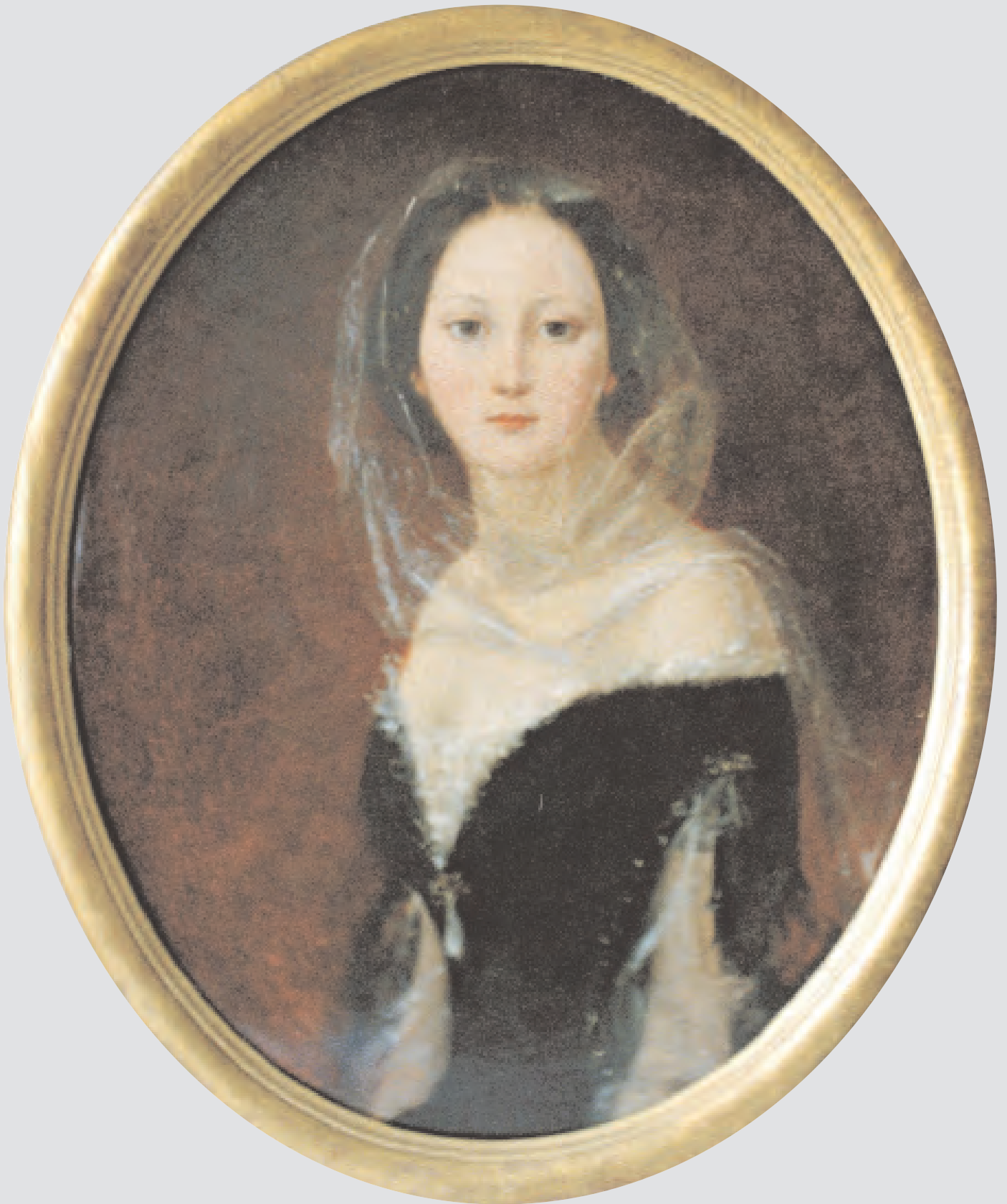
Н.А. Майков. Портрет Елизаветы Васильевны Муслиной-Пушкиной (урожд. Толстой). 1856