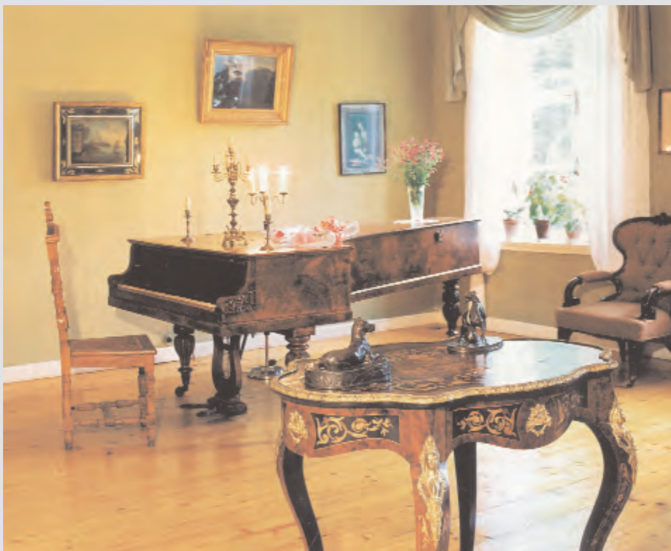
Кабинет М.И. Глинки

малое число гостей. Да и родственники подолгу жили в Новоспасском. Круг родных, соседей и знакомых Глинок был широк. Они находились в родстве с Повало-Швейковскими, князьями Друцкими-Соколинскими, Родзянками, Булгаками, Нахимовыми, Гедеоновыми, Соболевскими, В.К. Кюхельбекером (в смоленском имении Закуп жила его сестра), узами долголетней дружбы были связаны с Энгельгардтами, Римскими-Корсаковыми и другими.