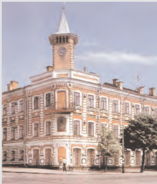
Дом, где родился И.А. Гончаров

Для создания музея были основания и возможности. Сохранилось, хотя и в несколько перестроенном виде, здание, где родился писатель. В нем размещались разные учреждения, но улья-