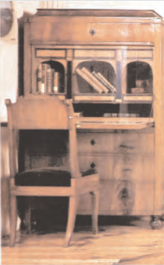
Каюта морского офицера. Фрагмент экспозиции музея