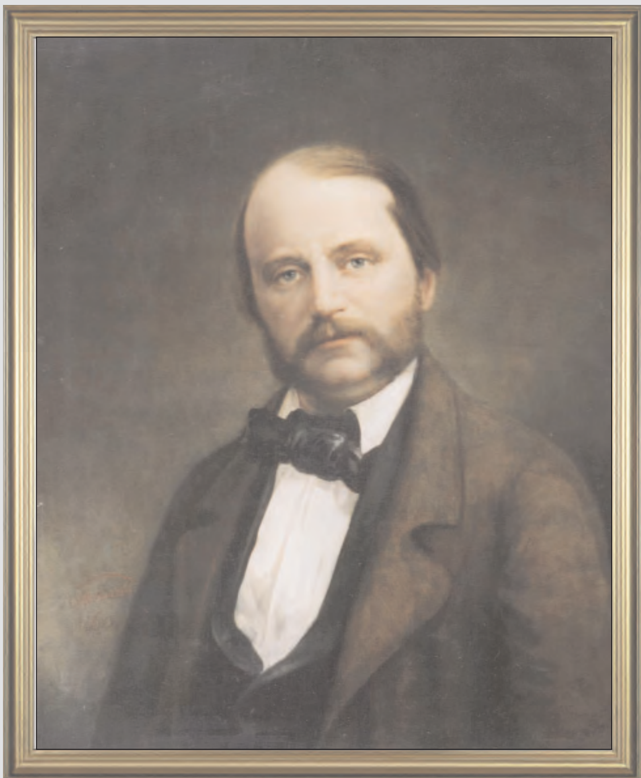
Н.А. Майков. Портрет И.А. Гончарова. 1860