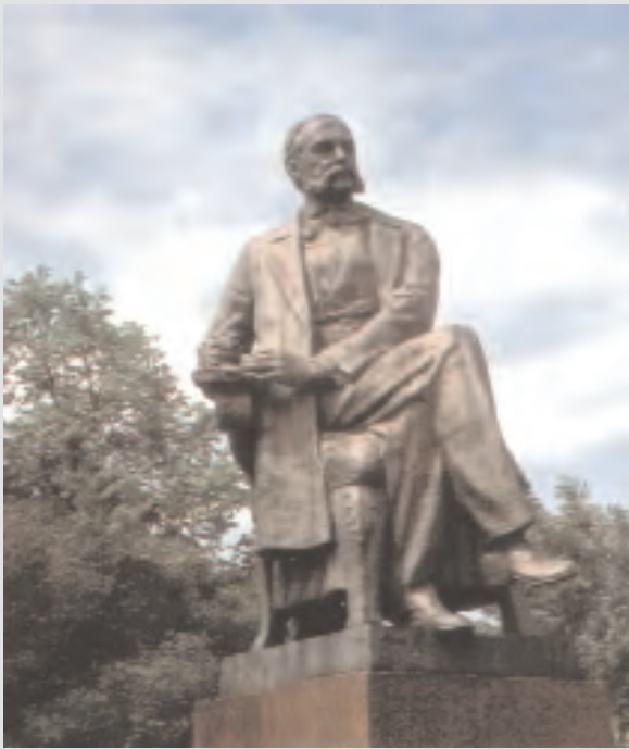
Памятник И.А. Гончарову в Ульяновске. Скульптор А. Писаревский