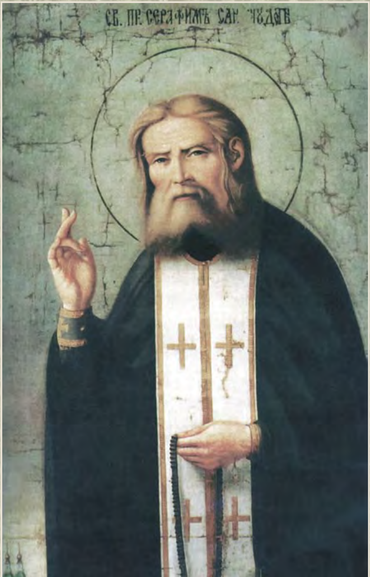
Святой Преподобный Серафим Саровский Чудотворец