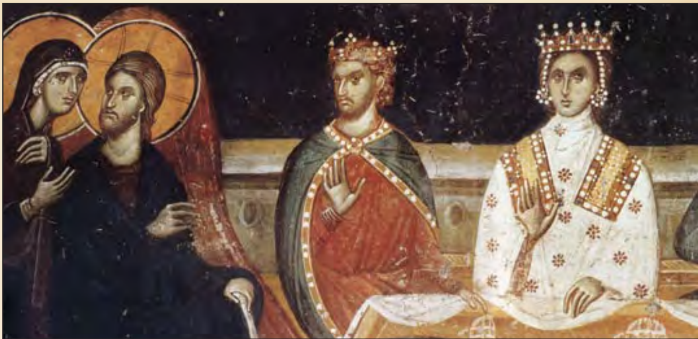
Брак в Кане. Церковь Николо Орфамус. Солоники, XIV век