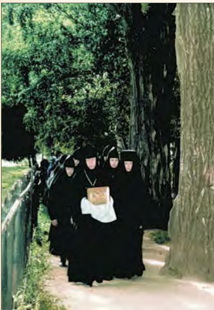
Крестный ход на Святой Канавке

венным своим собеседником. В годы подвижничества о. Серафим носил одну и ту же одежду: белый полотняный балахон, кожаные рукавицы, кожаные бахилы, на которые он надевал лапти, и поношенную камилавку. Поверх балахона на груди его всегда висел крест, которым когда-то благословила его мать, за плечами висела сумка, в которой он носил при себе Евангелие. Таким он и запечатлен на одном из самых известных своих образов. Летом возделывал небольшой огород, питаясь только тем, что давал его небольшой надел, — картофелем, свеклой, луком и травой сныть. Приходя на воскресные богослужения в обитель, отшельник брал себе хлеба на неделю. Есть сказание, что покой и тепло исходившей от него благодати примагнивали к нему зверей, часть этой порции он непременно уделял животным и птицам, которые часто приходили к нему в пустынь. На одной из литографий Серафимо-Дивеевского монастыря начала XX века о. Серафим так и изображен — кормящим с рук огромного медведя.