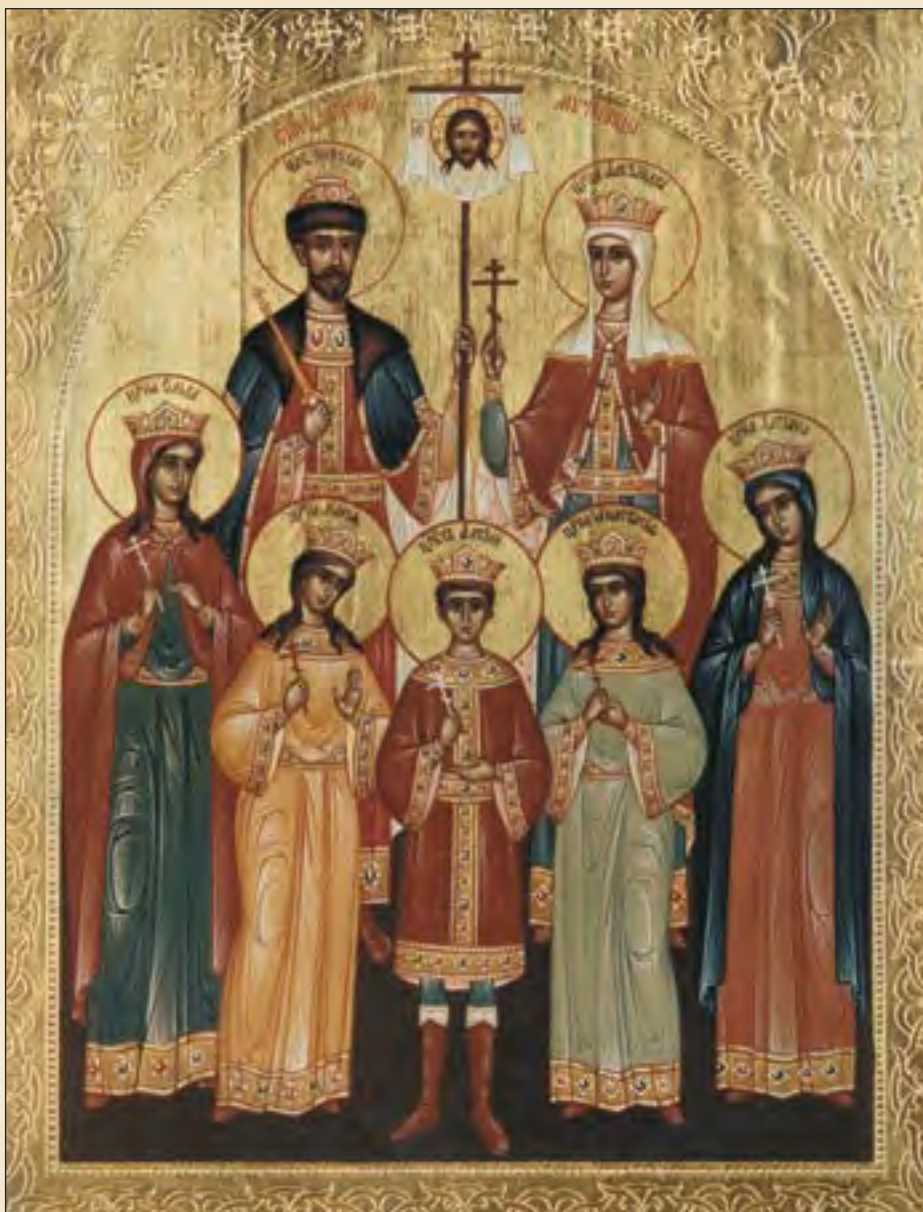
Икона Царственных мучеников

— Да, это так, но посмотрим, почему совершил Свое первое чудо Иисус Христос? Святое семейство отправилось в Кану на свадьбу родственника, на свадебном пиру не хватило вина, и тогда Богородица попросила Сына помочь родне. Не время еще, говорил Спаситель, но Мать настаивала, и тогда Он велел принести сосуды с водой, где вода и обратилась в вино. Так что чудо Он явил по просьбе Матери и на радость новой семьи, для блага людей, давая понять этим чудом и другими, совершенными в Его земной ипостаси, что спастись можно только добром, творя добрые дела во имя любви. Так что чудо не доказывает, но свидетельствует, а вера — это свободный выбор человека, не зависящий от количества чудес. Сказал же Спаситель апостолу Фоме: «Блажен, кто не видел чуда, но уверовал».