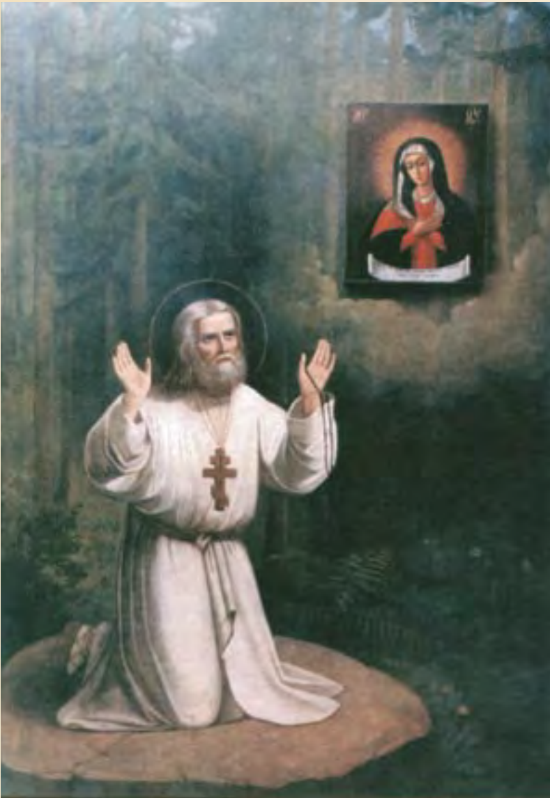
Преподобный Серафим, молящийся в лесу на камне