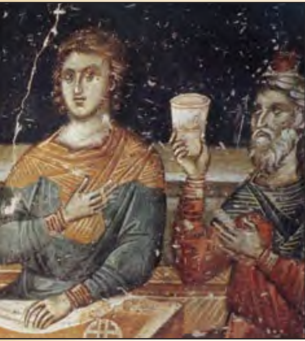
Икона Святого Великомученика Пантелеимона русского Свято-Пантелеимонового монастыря на Святой горе Афон (вверху справа)