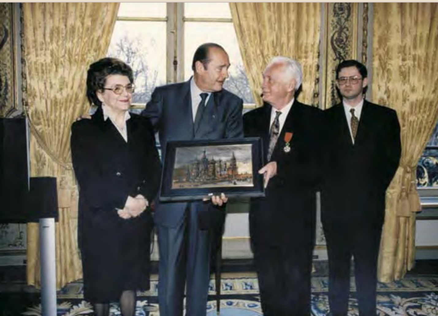
Прием в кабинете президента Франции Жака Ширака по случаю вручения Ю.А. Рыжову ордена Почетного Легиона. Слева – Р.И. Рыжова. Париж. Елисейский дворец, 1999

— Юрий Алексеевич, Вы являетесь председателем Российского Пагуошского комитета. Какова история этого движения? На Ваш взгляд, подобные общественные организации оказывают сколько-нибудь заметное влияние на ход событий в мире, на формирование общественного мнения у нас в России?