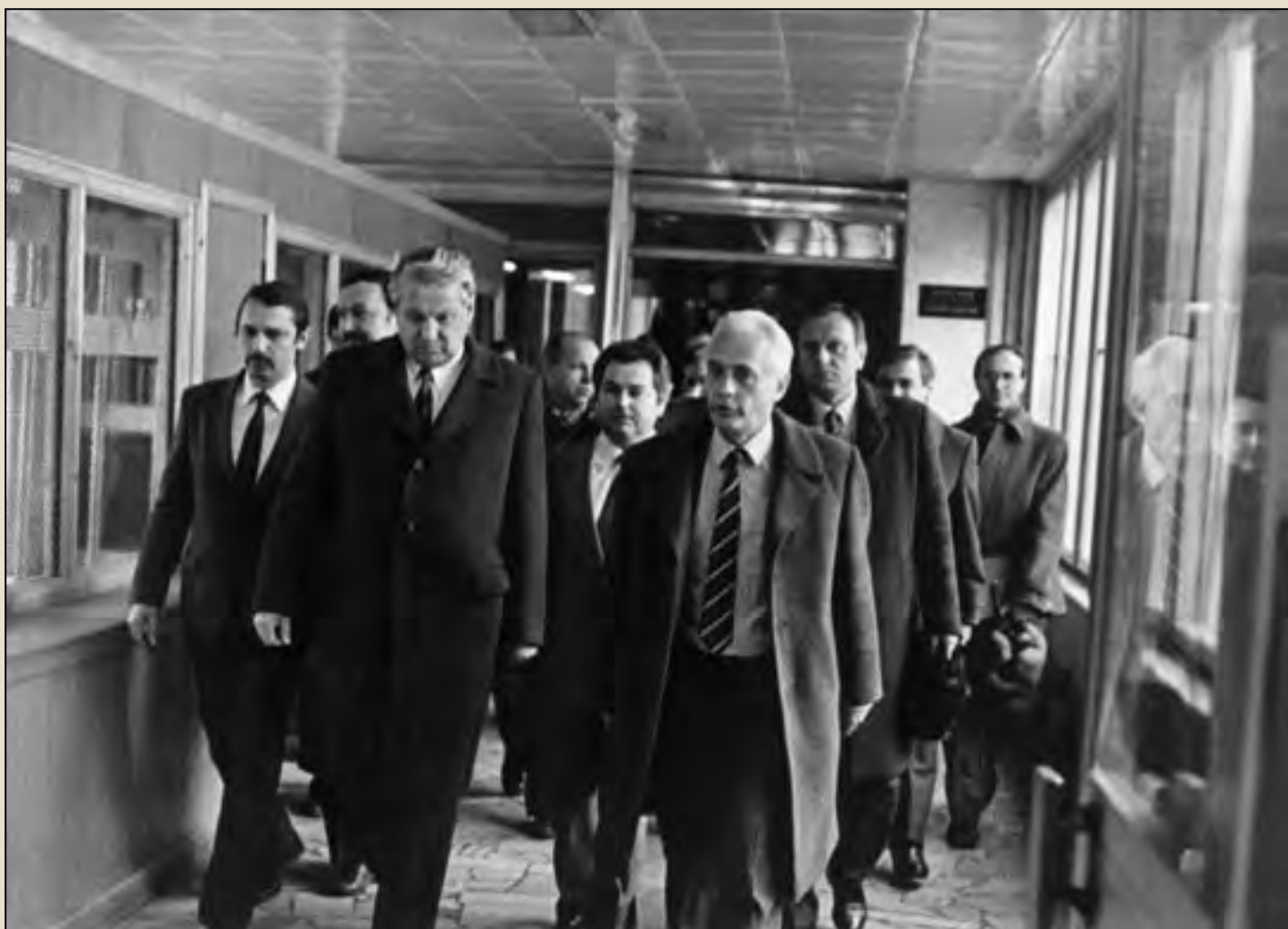
Б.Н. Ельцин и Ю.А. Рыжов в Московском авиационном институте. 1987

Давосский экономический форум?» 2 Я ответил — знаю, государственные деятели и воротилы финансовых кругов обсуждают там экономические проблемы при открытых и закрытых дверях. «А я хочу создать международный политический форум. Давай поедем в Турин». И мы поехали. Это было интересно. От России на Форуме—2003 нас было немного: Михаил Сергеевич, академик А.Д. Некипелов, В.Т. Третьяков, А.С. Грачев, ближайший сотрудник М.С. Горбачева в последние годы его президентства, и я. Там было очень широкое международное сообщество из «бывших», включая бывшего президента СССР, который возглавлял этот круглый стол. За столом сидели Войцех Ярузельский, Андреотти, Беназир Бхутто, всего несколько десятков недавних руководителей государств, министров. Одних только бывших министров иностранных дел Франции