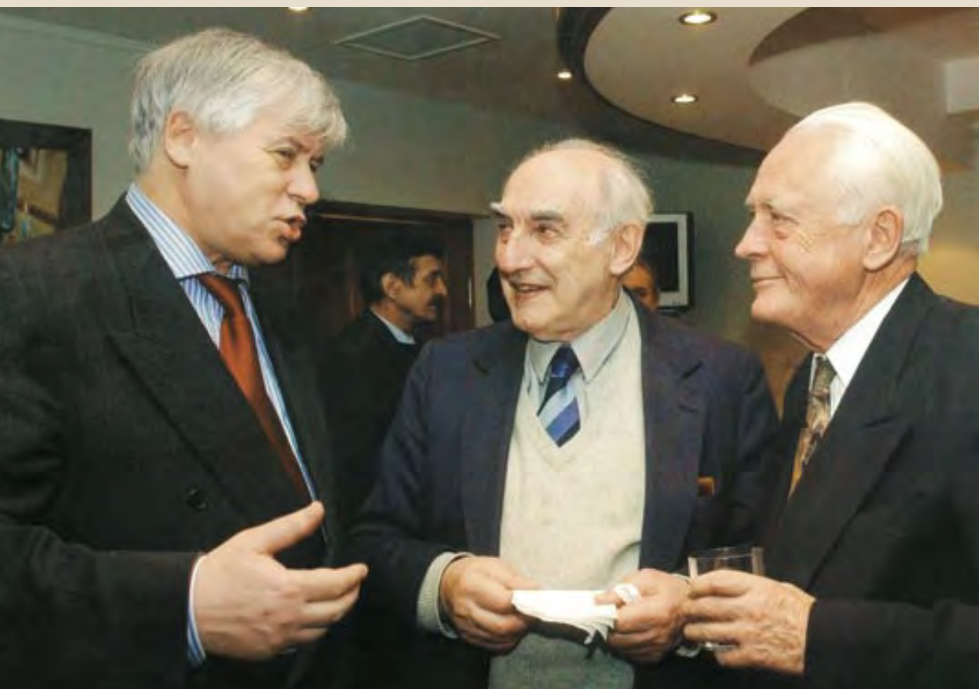
Министр правительства Москвы А.И. Музыкантский, академик В.А. Гинзбург, Ю.А. Рыжов. 2002

смогут столько навредить стране, что уже некому будет выбирать путь. Пока же Россия теряет место в международном сообществе. Раньше это место было обусловлено военной мощью, нашими размерами, противостоянием двух систем, сегодня мировое сообщество демонстрирует достаточно безразличное к нам отношение. Нет безразличия у таких гигантов, как Америка. Раньше это было вызвано ядерной угрозой, а теперь — угрозой распада России, не дай Бог, кровавого, но, очевидно, непредсказуемого по сценарию и последствиям. Речь идет и о степени вовлеченности западного мира в наши проблемы. Распад угрожает ему во всех отношениях — и физически, и геополитически, и материально, особенно если учесть наши энергозапасы, от которых он пока зависит.