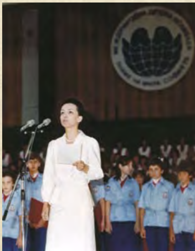
Выступление Людмилы Живковой на Международной детской ассамблее «Знамя Мира» в Софии. 1978

Мы надеемся, что созданный в Болгарском Центральном государственном архиве фонд