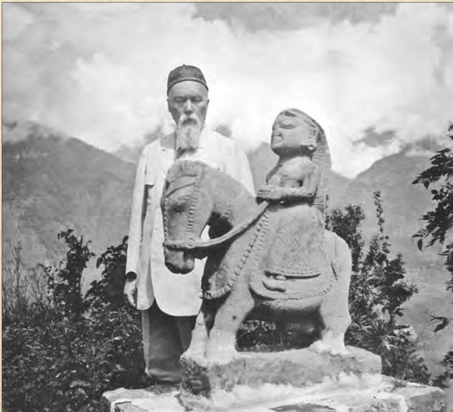
Н.К. Рерих в Кулу. 1930-е гг.