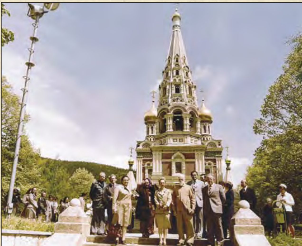
Девика Рани Рерих, Людмила Живкова, Святослав Рерих у храма Шипка. 1978

Апрель — май 1978 г. — целый комплекс мероприятий в Вене. На выставке в болгарском культурном центре «Витгенштейн» — 57 картин Николая и Святослава Рерихов. Здесь состоялась дискуссия о проблемах гармонического развития личности с участием известных австрийских и болгарских ученых. В анализе программы «Н.К. Рерих» отмечается активный интерес участников эстетического общества «Вельтшпирале» из Линца со следующим комментарием: «Принимая во внимание, что Общество не разделяет наши идейные позиции, предлагаем более внимательно изучить его политическую характеристику и с осторожностью привлекать его к деятельности отдела культуры в посольстве». Дискуссия «О папке Рериха и об охране культурных ценностей» прошла при участии болгарских и австрийских заместителей министров внешних дел, образования и искусства, науки и исследований и других высокопоставленных австрийских государственных чиновников и вызвала огромный интерес в Вене.