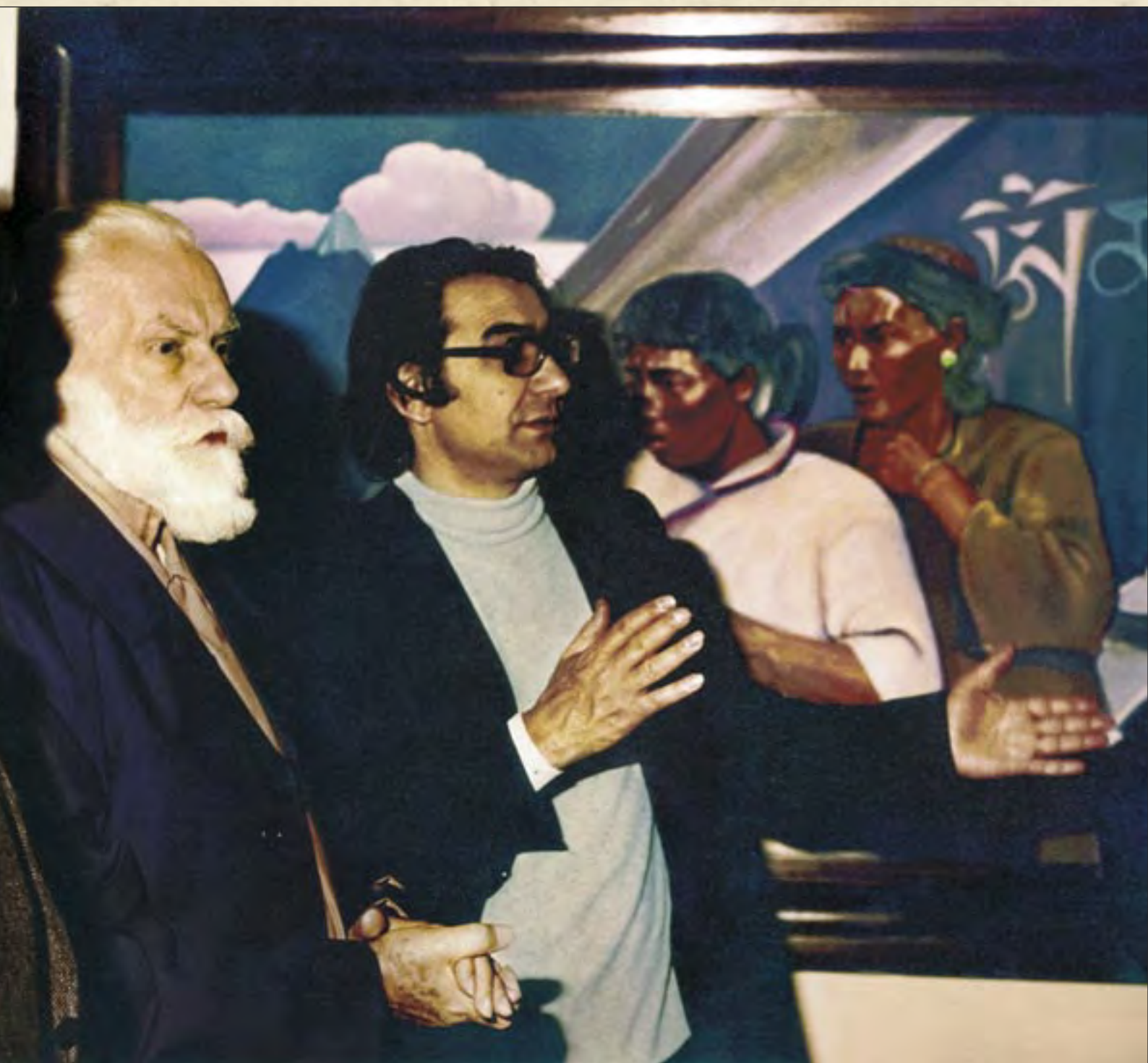
Святослав Рерих и выдающийся болгарский художник, заместитель председателя Комитета культуры Болгарии Светлин Русев. 1978

исполнения программы было готово, из Индии уже прислали материалы для выставки Николая Рериха». После дипломатических переговоров на разных уровнях благодаря доброжелательному отношению советского посла в Болгарии Владимира Базовского советская сторона дала свое принципиальное согласие, но с существенными оговорками — «не выдвигать на первый план вещи, кото-