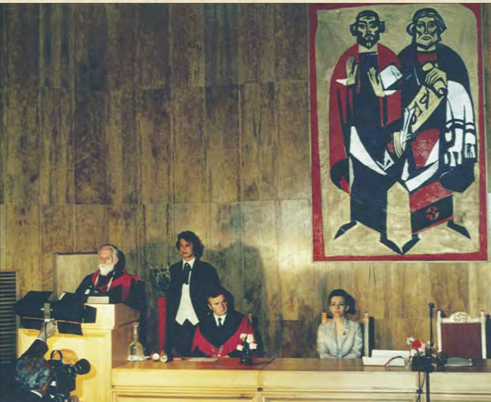
Церемония вручения С.Н. Рериху диплома Почетного доктора Великотърновского университета. 1978