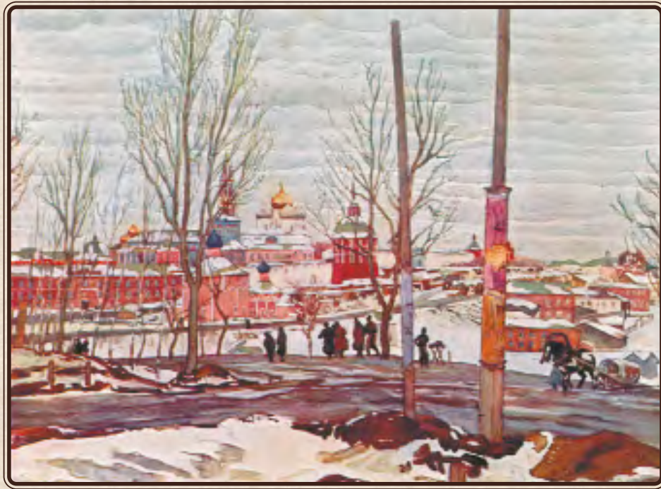
К.Ф. Юон. Троицкая лавра. Открытка. Нач. XX в.

P.S. надо бежать на нар[одное] чтение: за мной пришли, ждут.