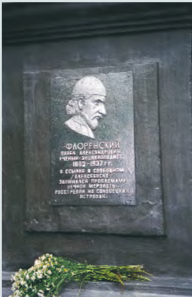
Мемориальная доска, открытая в июле 2003 года в городе Свободный

возмездие хотя бы в памяти потомков? Но ведь и недавние каратели приняли в адском круге удары дамоклова меча. Ведь сказано было: «...им не хватает ночей: палачи казнят палачей...» Как отделить зерна от плевел, кому ставить памятники, а чью гибель обходить молчанием? Какими мерками мерять то суровое время? Ключевский, лекции которого слушал в Московском университете студент Павел Флоренский, писал, что можно и нужно применять современные критерии к событиям прошлого, чтобы понять, как далеко с той поры ушел нравственный прогресс общества. А далеко ли он ушел? Так ли уж необратимы перемены?