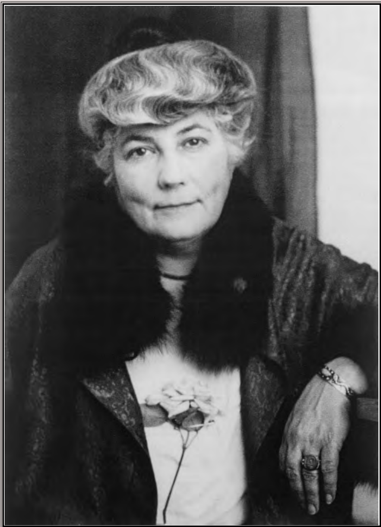
Елена Ивановна Рерих