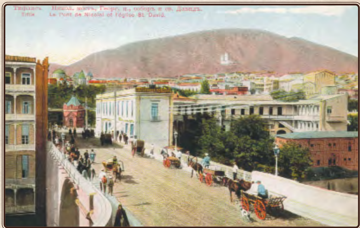
Николаевский монастырь, Георгиевская церковь, собор св. Давида. Тифлис. Открытка. Нач. XX в.

ты сам? Все теперь ли по-старому безстрашно относишься к текущим вопросам? От Люси и тети имеем известия довольно хорошие.