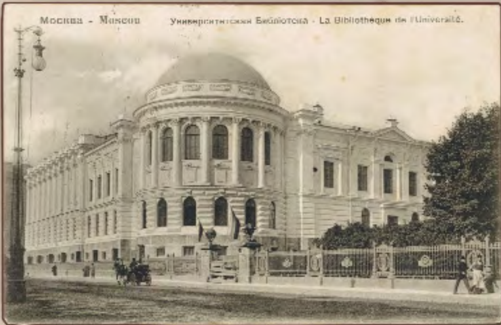
Университетская Библиотека - La Bibliothèque de l'Université.