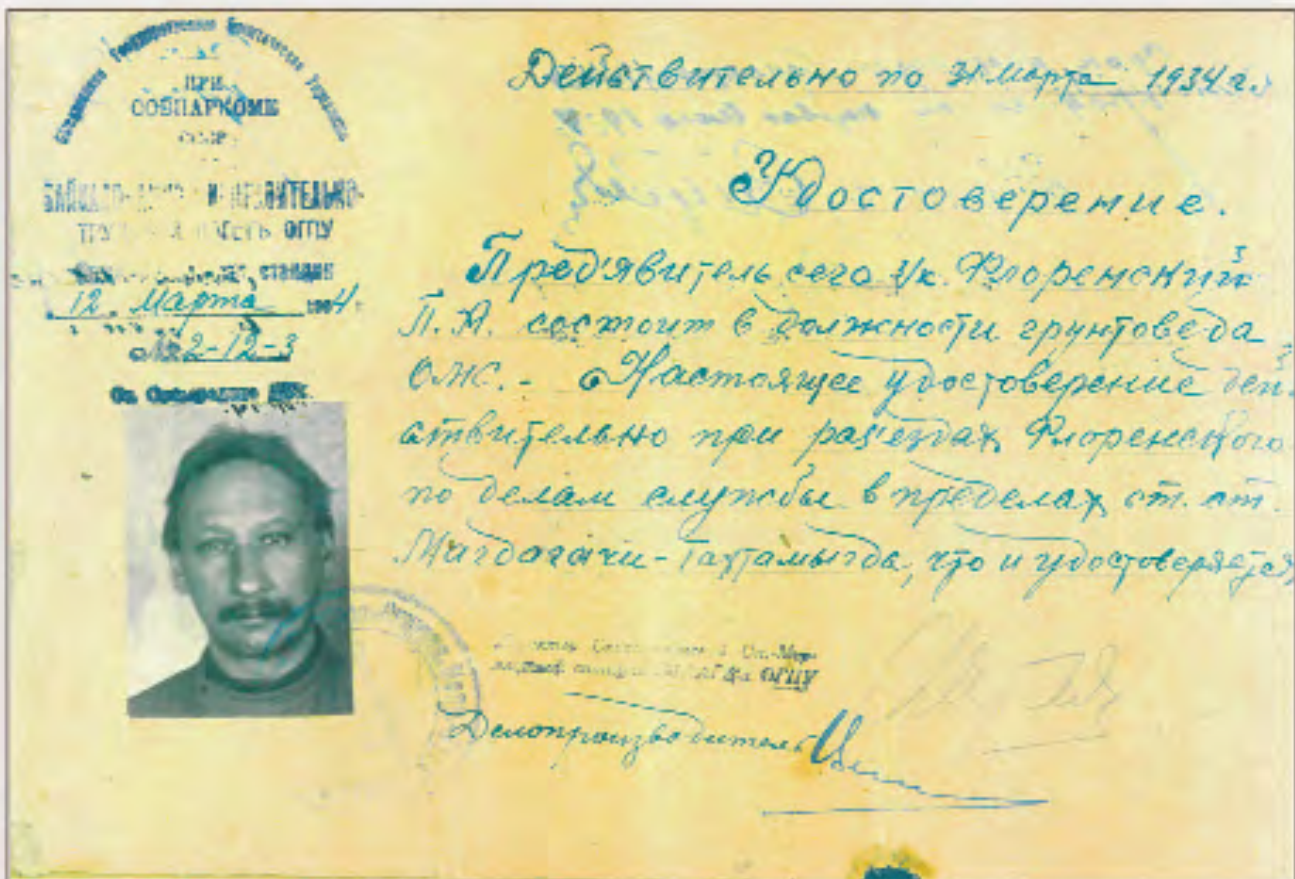
Удостоверение з/к БАМЛага П.А. Флоренского. Публикуется впервые