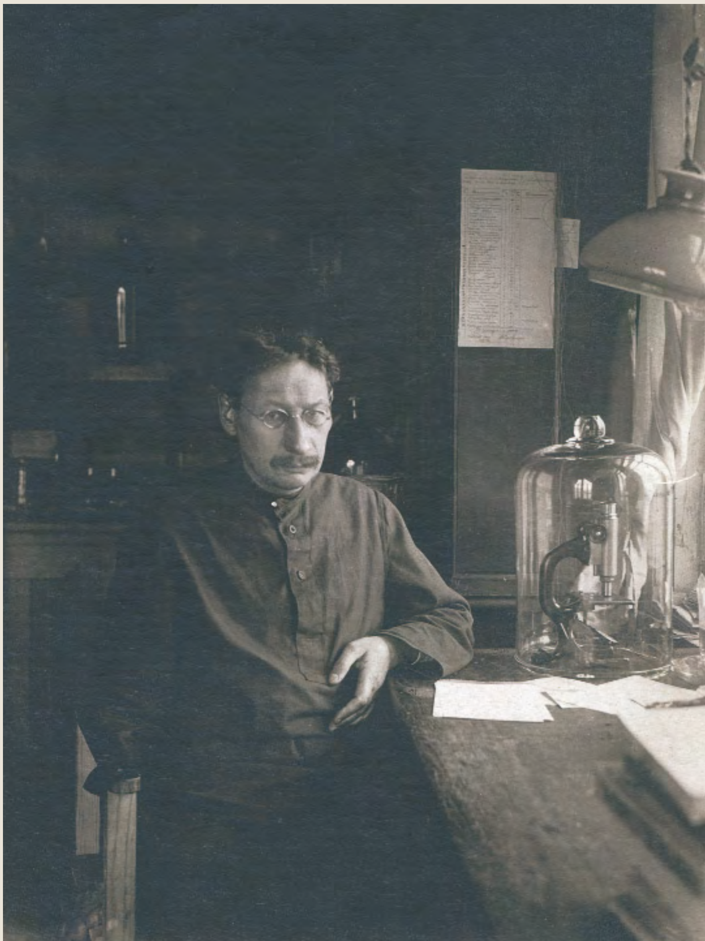
П.А. Флоренский в Сквородине. БАМЛаз, 1934. Публикуется впервые