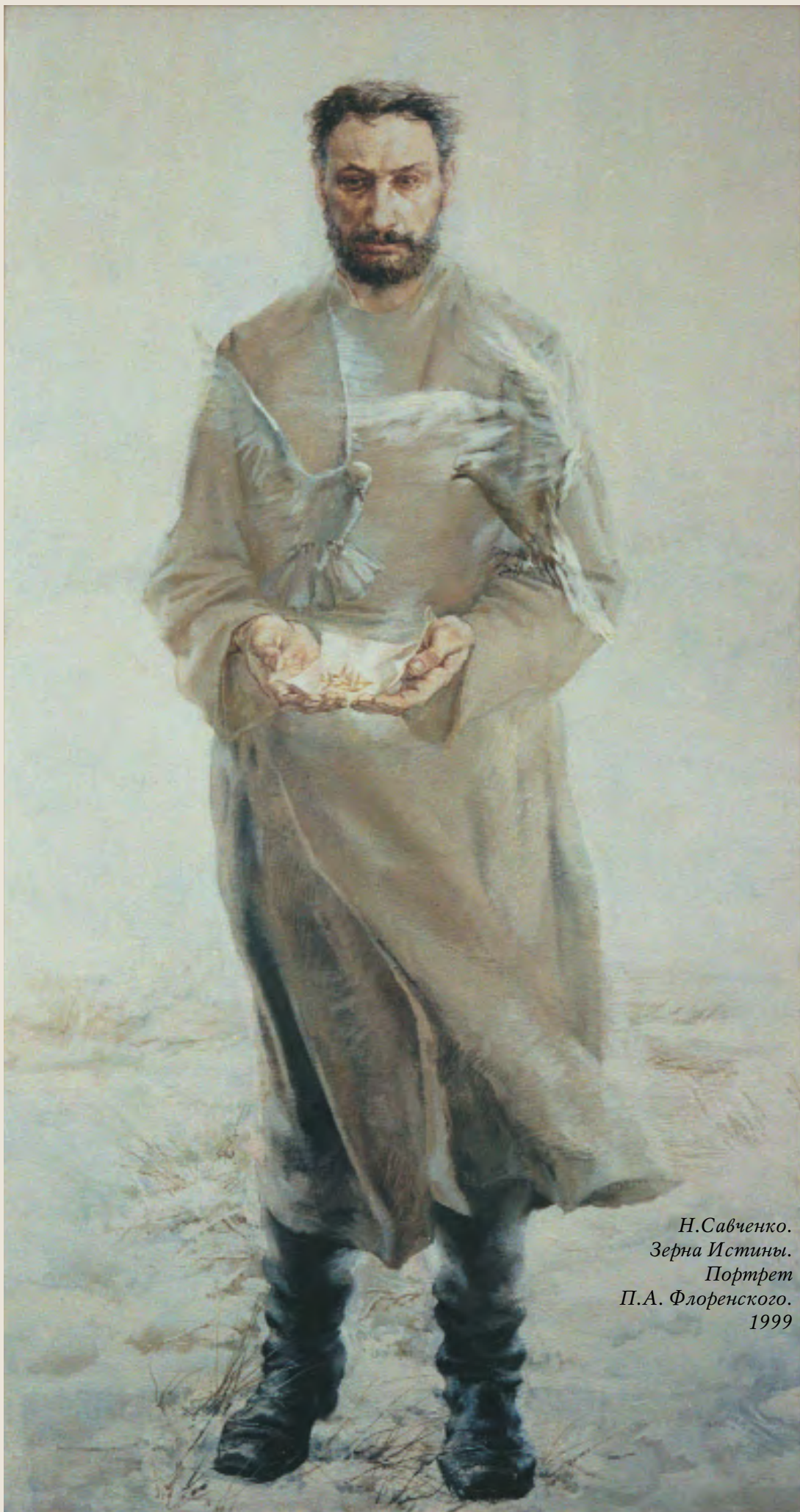
Н.Савченко. Зерна Истины. Портрет П.А. Флоренского. 1999