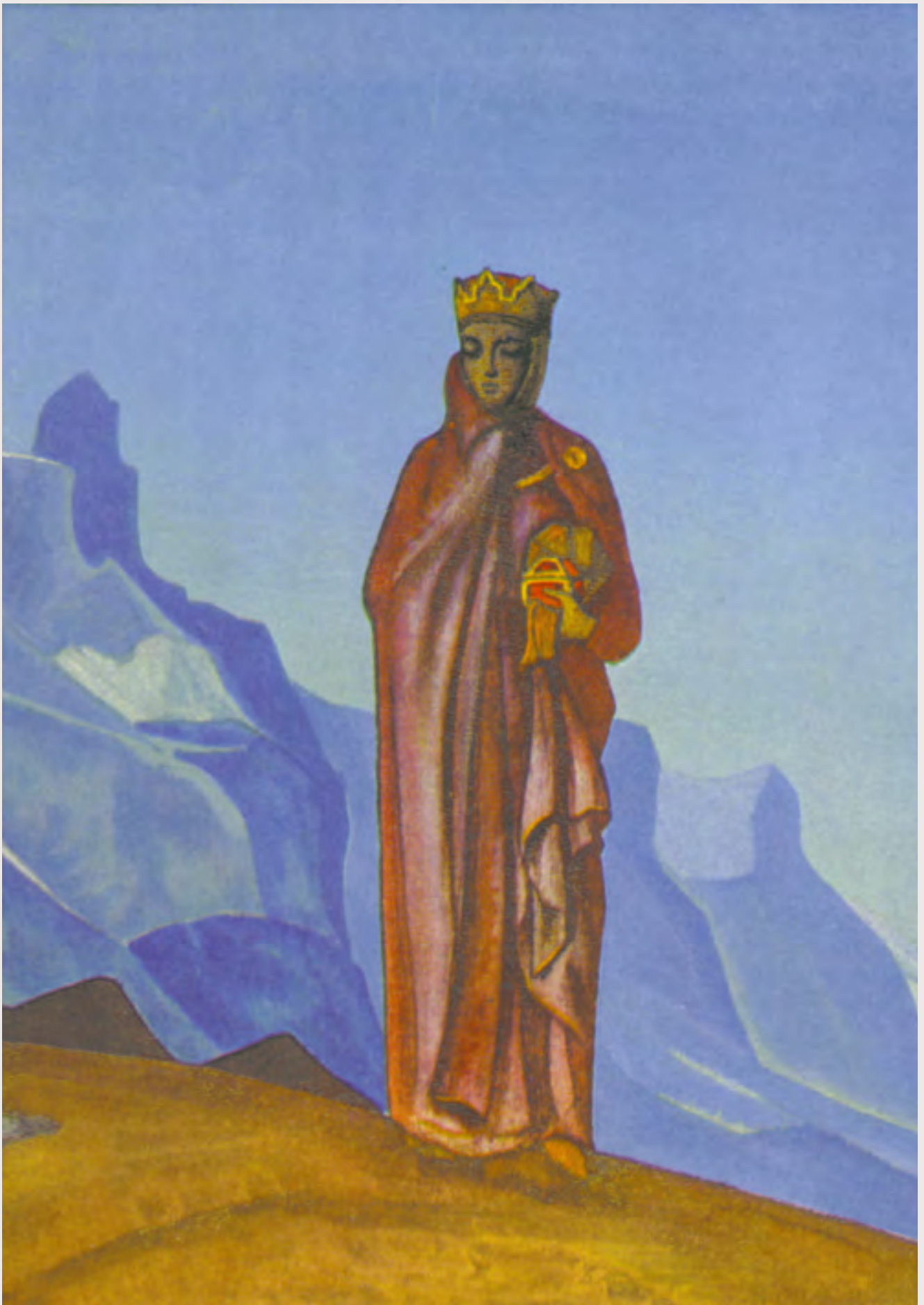
Н.К. Рерих. Держательница Мира. Фрагмент. 1933