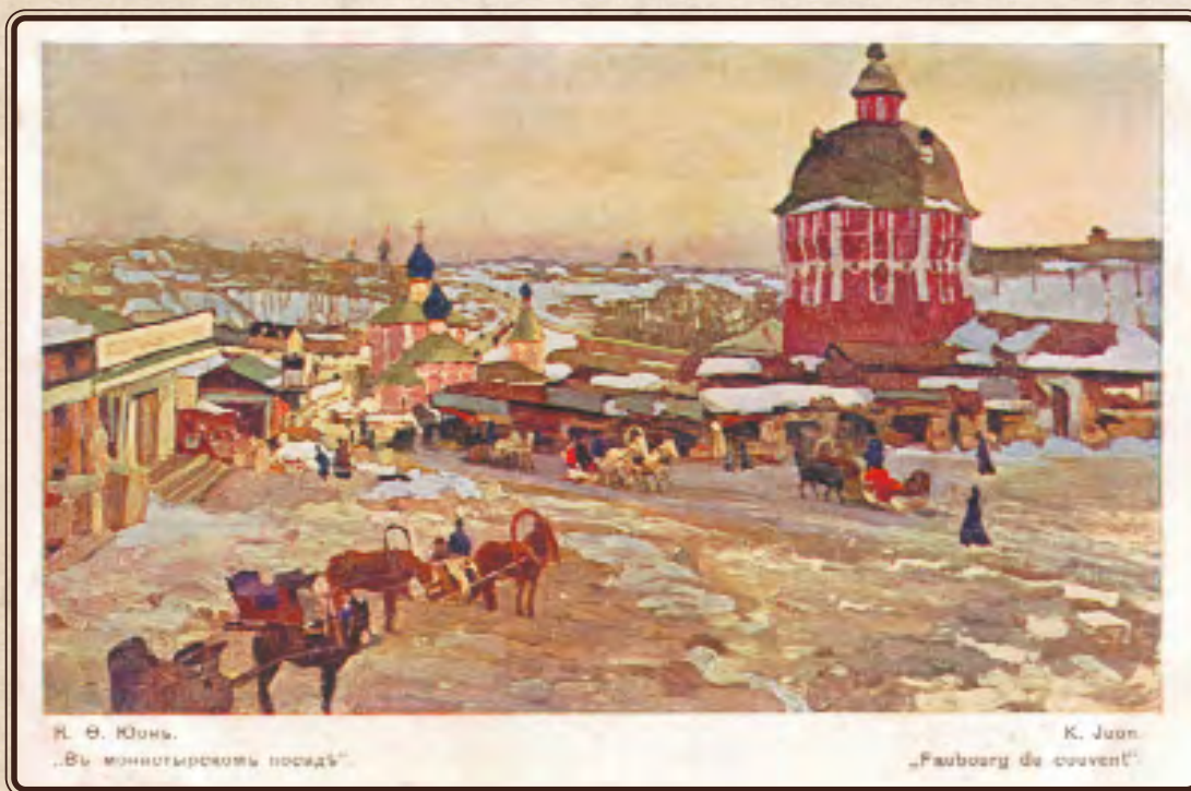
К.Ф. Юон. В монастырском посаде. Открытка. Нач. XX в.

это не то. Боюсь, что ты идешь по неверному пути, и сильно пожалеешь об этом. Неужели же от того, что благожелание к тебе представителей науки не удовлетворяет твоим идеалам, ты разочаровываешься и в самой науке?