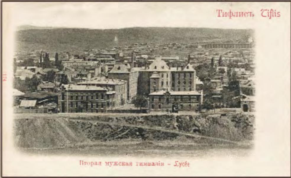
Вторая мужская гимназия - Тифлис