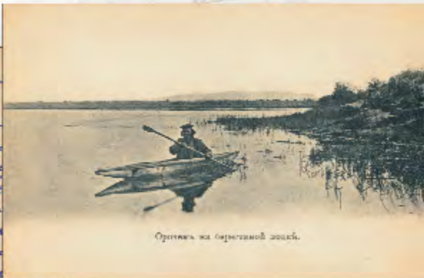
Орнитика на береговой лодке.