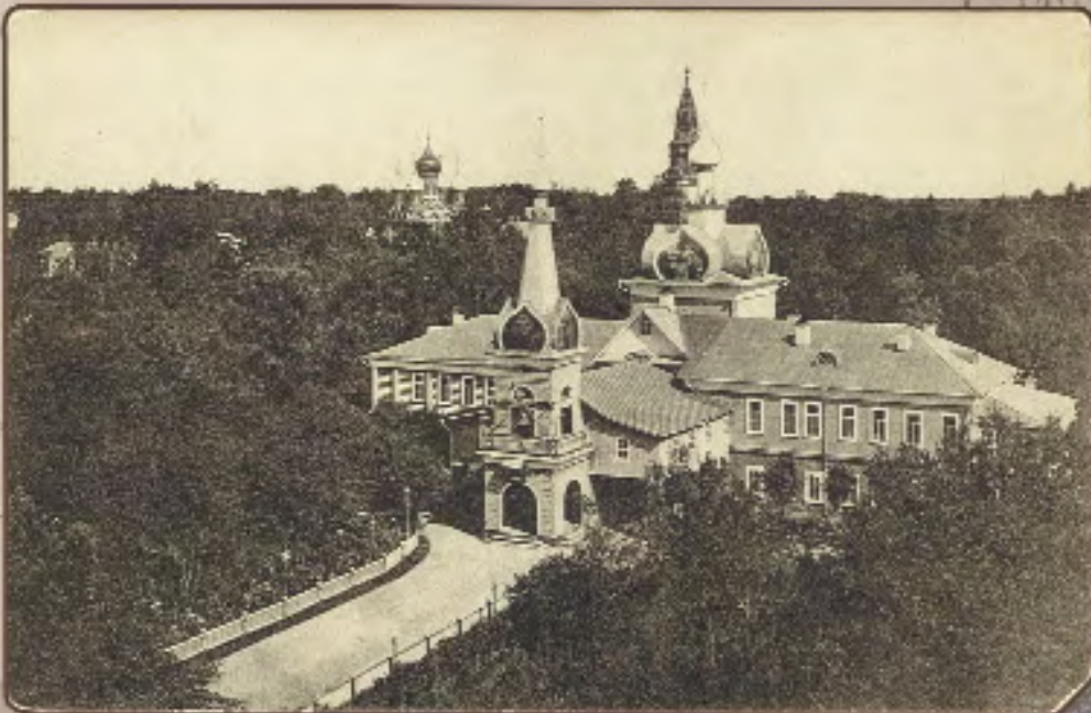
Окрестности св. Сергиево-Троицкой лавры. Церковь в скиту Успения Богородицы, построена преп. Дионисием