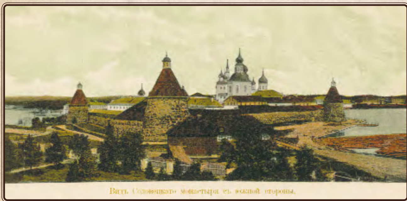
Вид Соловецкого монастыря с южной стороны.

Вид Соловецкого монастыря с южной стороны. Открытка. Нач. XX в.