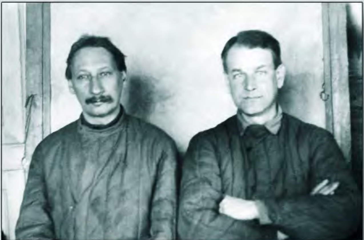
Сотрудники Сковородинской мерзлотной станции П.А. Флоренский и П.Н. Каптерев