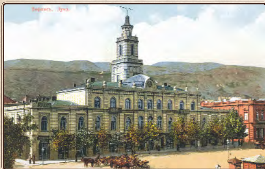
Дума. Тифлис. Открытка. Нач. XX в.

Спокойно ли у вас. Я слышал разные разности, но не знаю, насколько им можно верить. Тут все спокойно и все в напряженном несколько ожидании войны. Говорят еще, что будет голод, т.к. снег не выпадал вовремя.