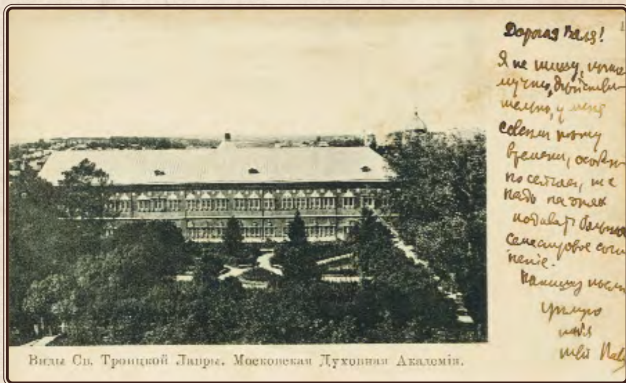
Виды Св. Троицкой лавры. Открытка с автографом П.А. Флоренского

щины», из-за одной буквы, это о том, что мы, православные — католики, а сторонники западной Церкви — католики. Посылал он также книжки Гладстону 54 и Бисмарку 55 , портреты которых красуются в его келье, и при книжках письма; в них он указывал, что мы, православные, любим протестантов и католиков, в чем они сами могут убедиться из церковных служебников. — Но главное, что меня привлекает в нем, это его понимание многих мистических идей, и очень тонкое, хотя образное, а не в понятиях. — Целую тебя, дорогая мамочка, и всех вас. Папе напишу как-нибудь на днях. Сейчас не могу: надо скоро идти к ректору читать реферат.