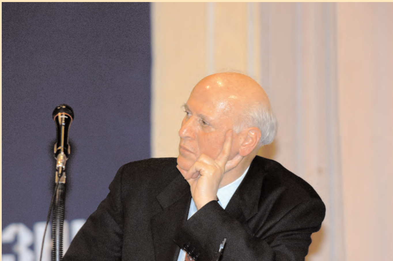
Председатель оргкомитета Международных чтений по гуманной педагогике академик РАО Шалва Александрович Амонашвили