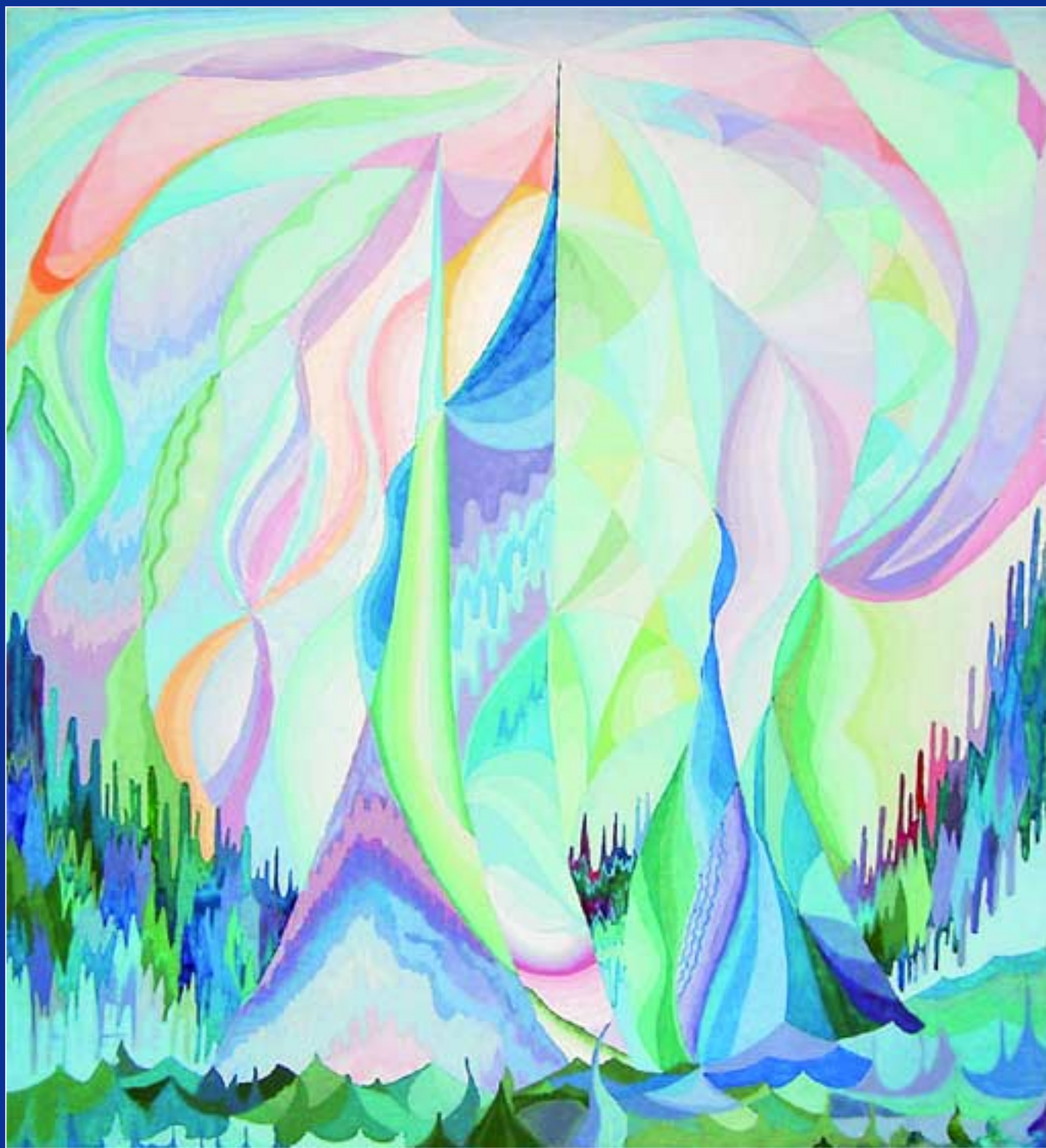
Алла Лысякова, 13 лет. Музыка Я. Сибелиуса