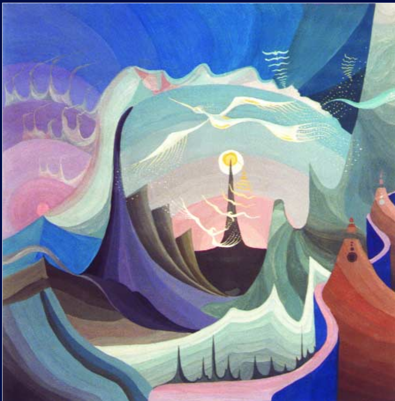
Алеша Чижов, 13 лет. Музыка Баха