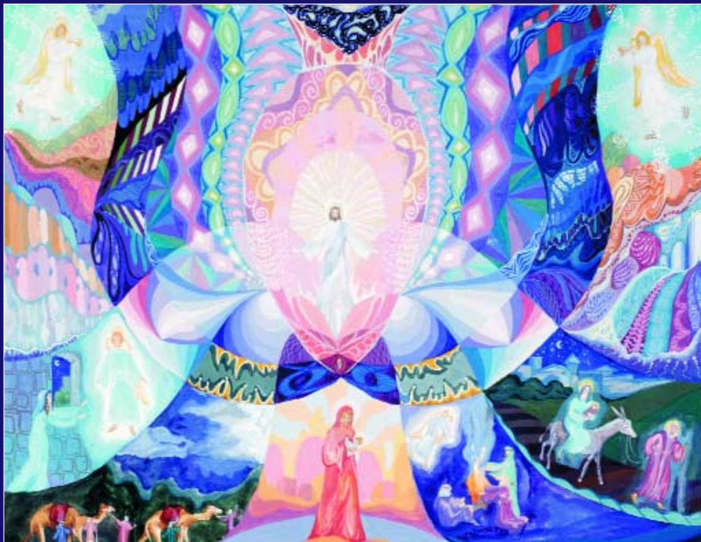
Таня Егорова, 14 лет. Свет Рождества