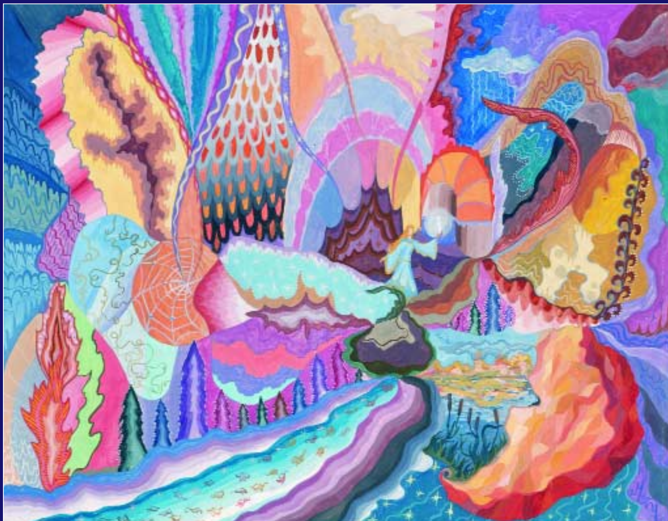
Таня Егорова, 13 лет. Музыка осени