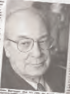
Юлий Воронцов, президент Института Рерихов

Юлий Воронцов, президент Института Рерихов, выразил протест чиновникам, считает директор Института и общественный деятель. Он заявил, что ситуация с наследием Рерихов в России является возмутительной.