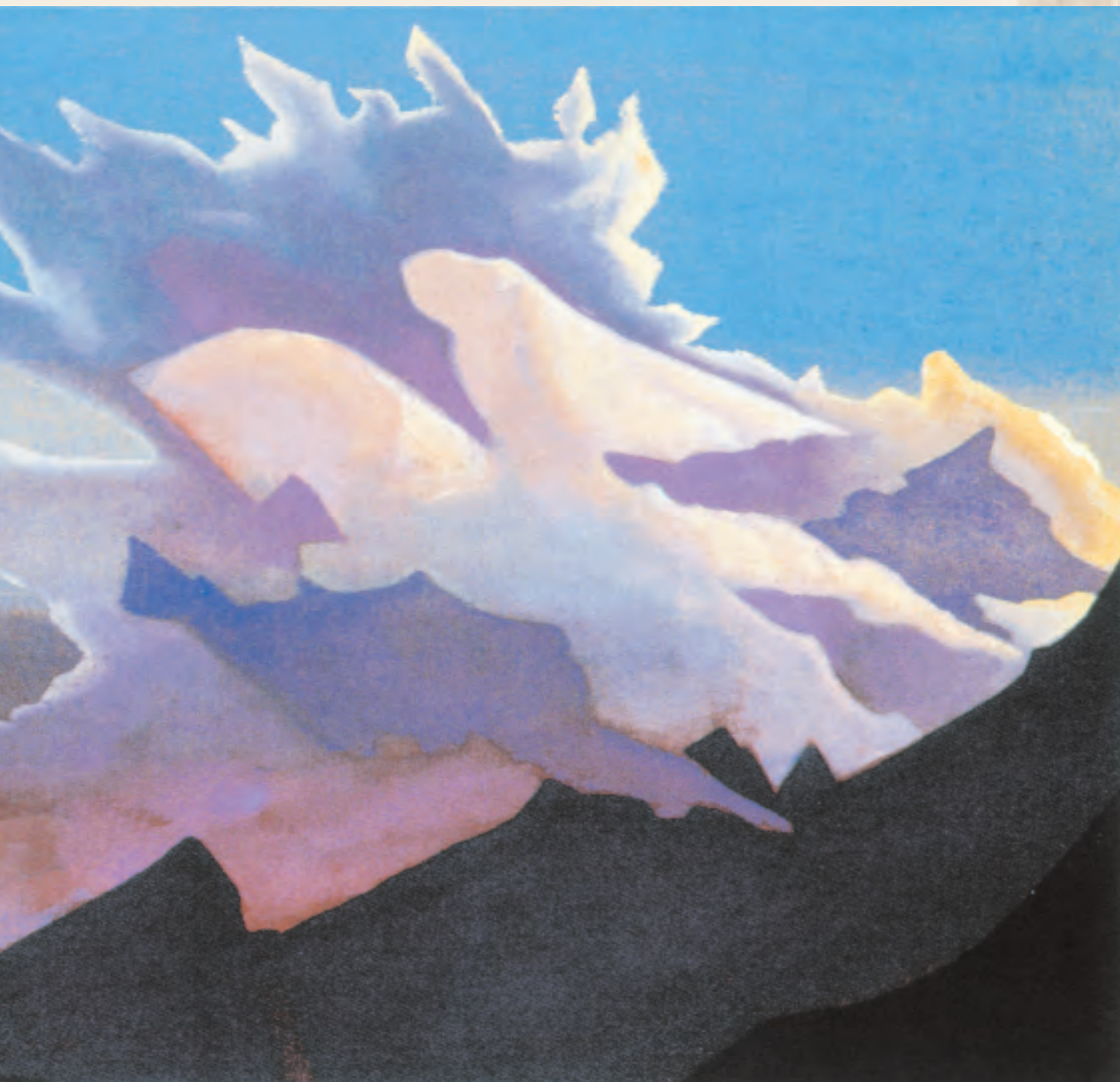
Н.К. Рерих. Воин Света. 1933. Из коллекции Музея Николая Рериха в Нью-Йорке