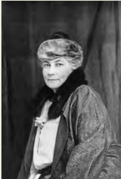
Е.И. Рерих. [1937 г.]