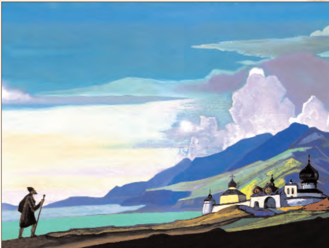
Н.К. Рерих. Странник Светлого Града. 1933. Из коллекции Музея Николая Рериха в Нью-Йорке