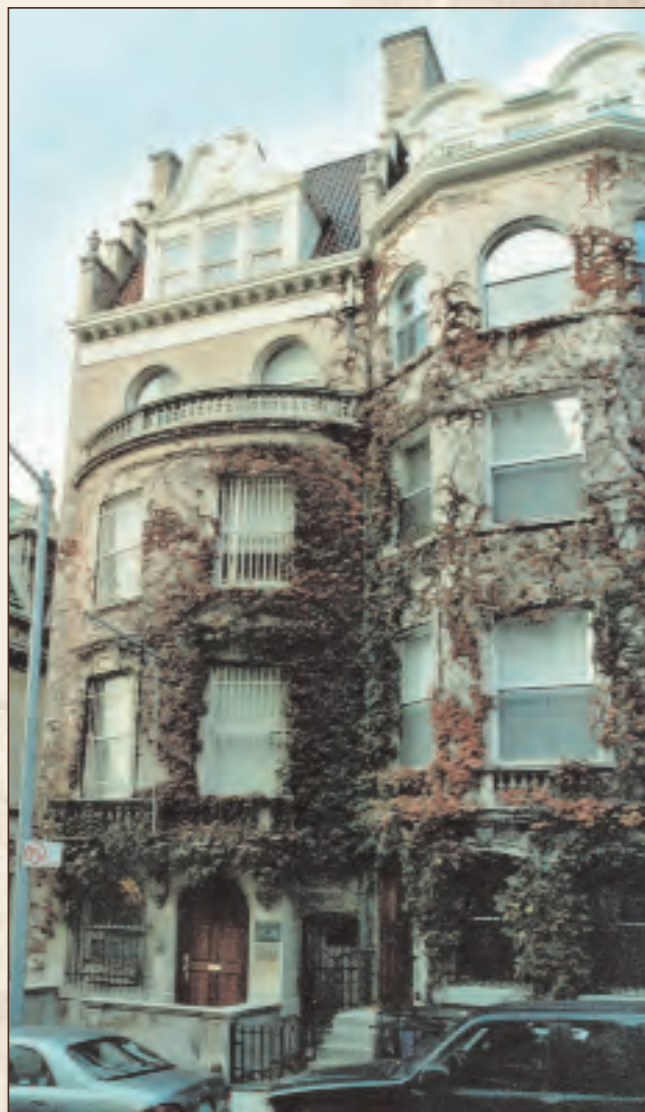
Современный Музей Николая Рериха в Нью-Йорке