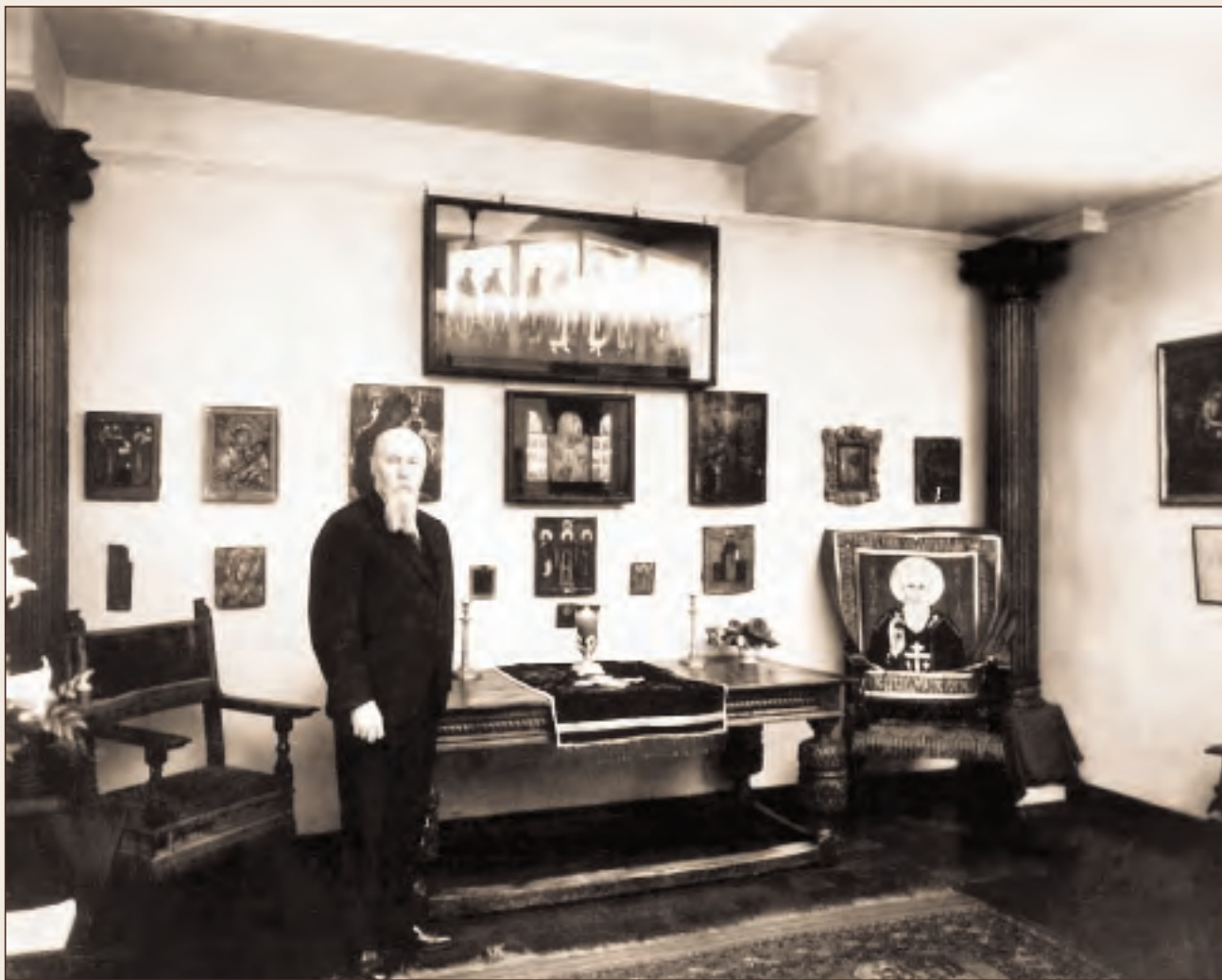
Н.К. Рерих в часовне Св. Сергия в Музее Николая Рериха в Нью-Йорке