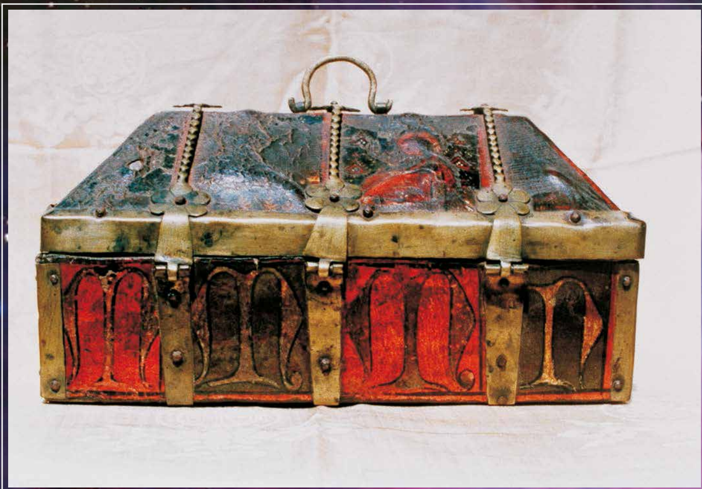
Шкатулка, в которой хранился Камень