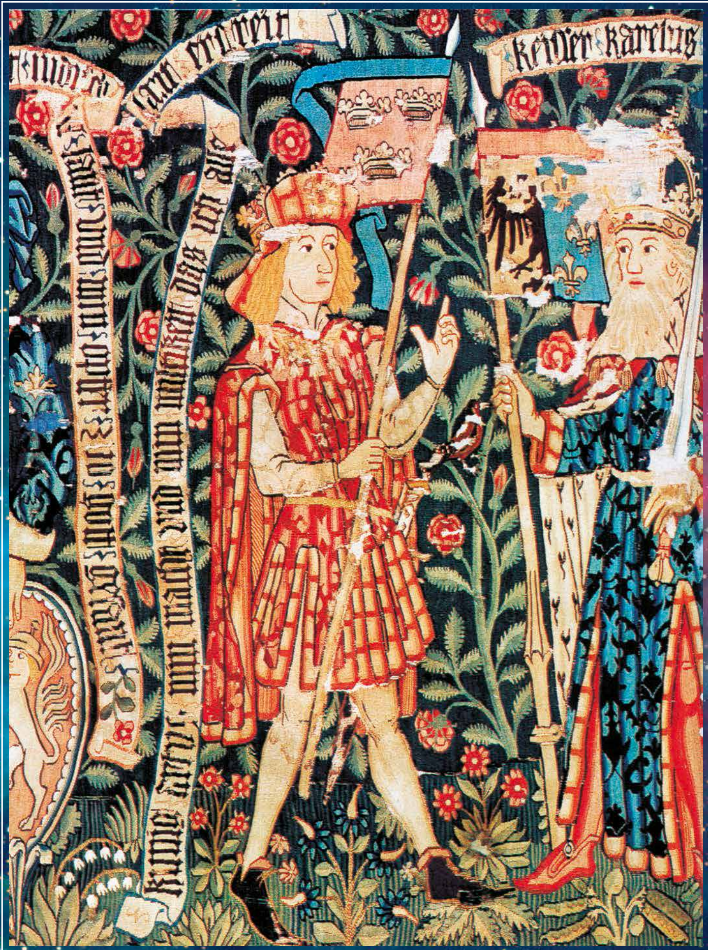
Король Артур. Фрагмент гобелена. XV в.