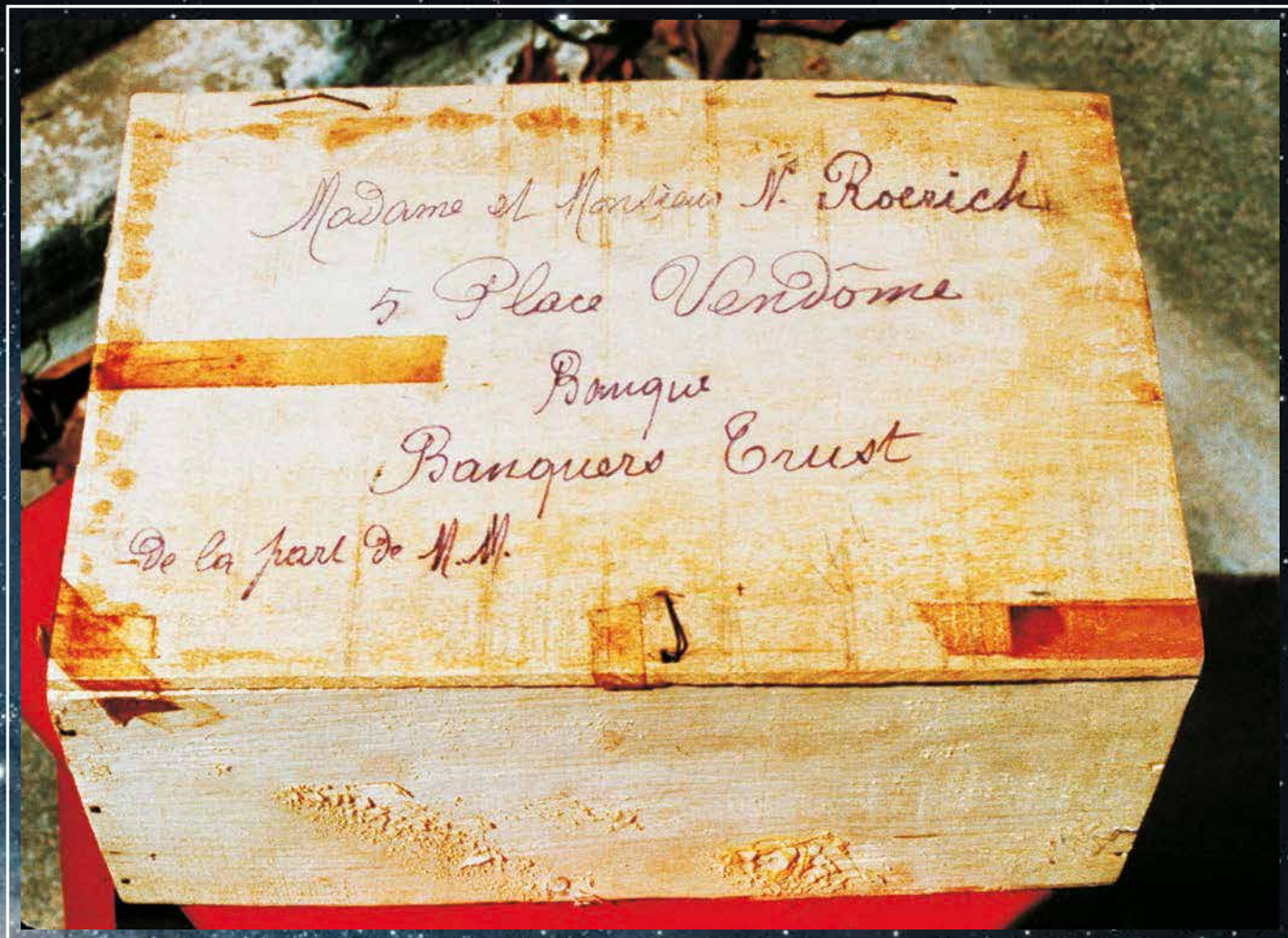
Почтовый ящик, в котором была прислана шкатулка с Камнем в Париж в 1923 году