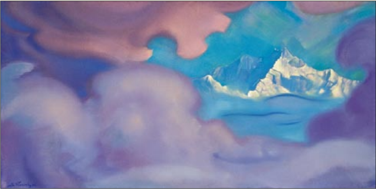
С.Н. Рерих. Канченджанга. Цитадель

ститута гималайских исследований «Урусвати» и Святославом Николаевичем лично. С.Н. Рерих прожил богатую жизнь и много рассказывал о прошлом, слушать его было чрезвычайно интересно, он был замечательным рассказчиком, высокоинтеллектуальным человеком. У него был своеобразный старый петербургский язык, красивый, образный, более сложный, чем тот, на котором мы сейчас общаемся.