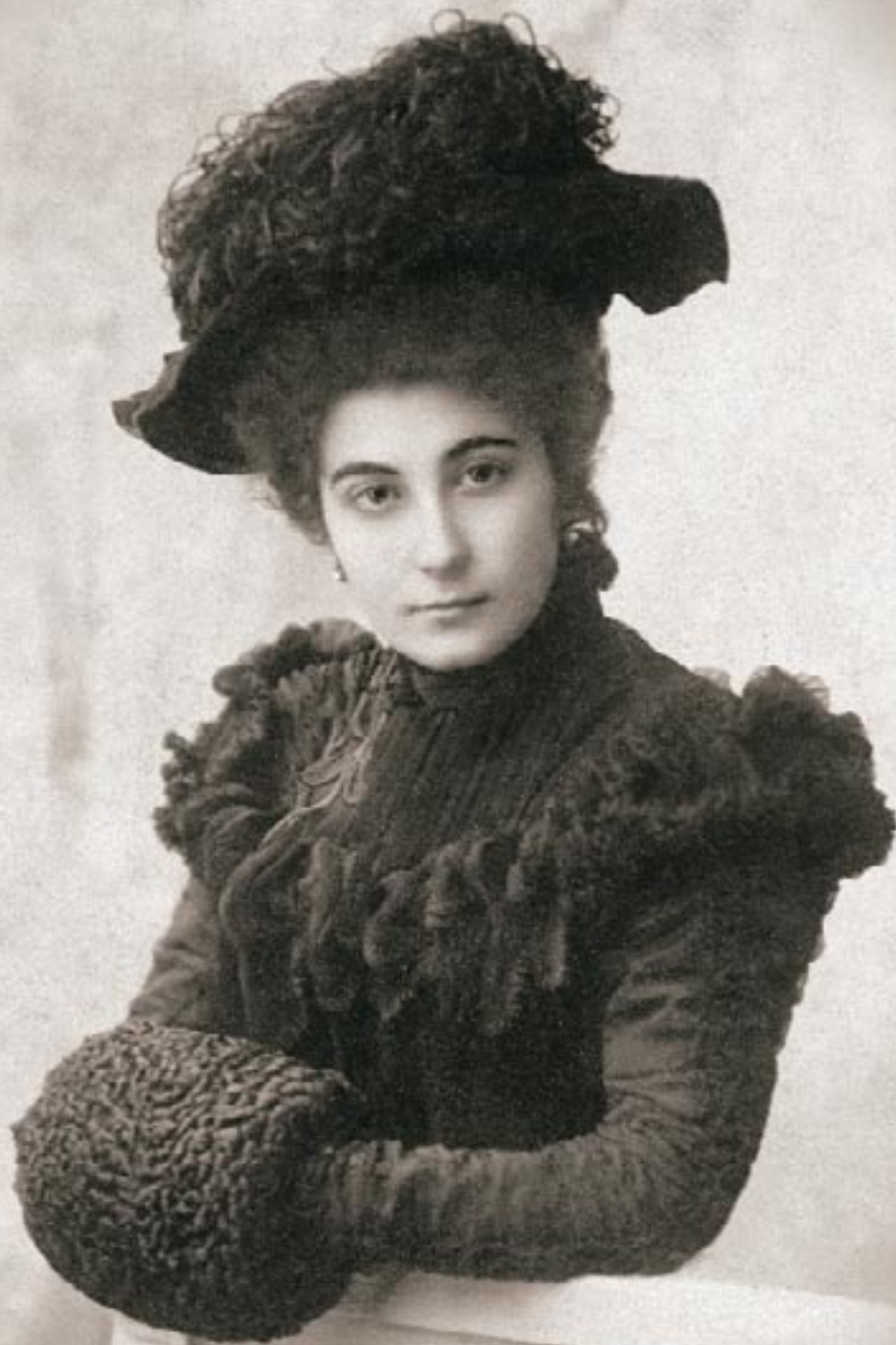
Е.И. Рерих. 1900-е гг.