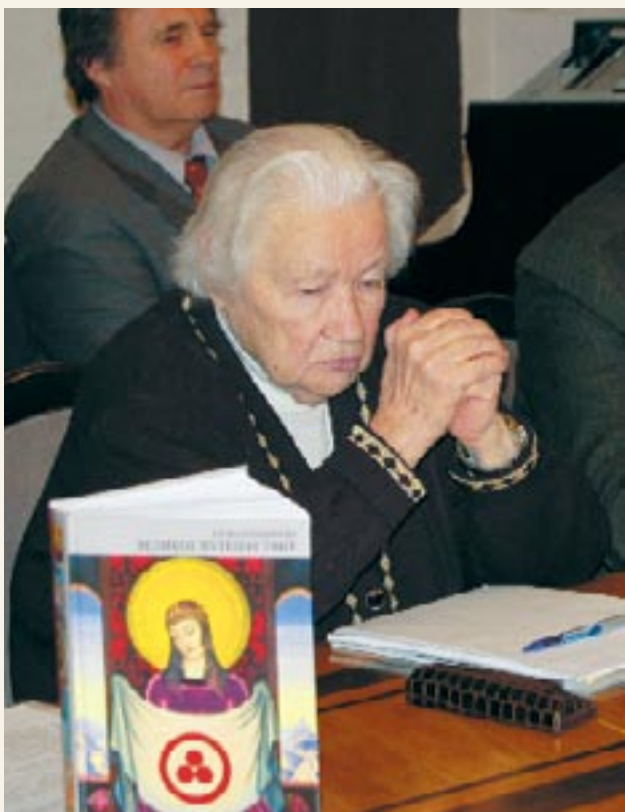
Л.В. Шапошникова на презентации книги «Вселенная Мастера»

искусства. Людмила Васильевна смогла перевернуть систему познания с головы на ноги, показав путь ее развития от мифологического и религиозного к научному и метанаучному способу познания. Эпоха homo sapiens уходит, грядет эпоха человека духовного, который соединит в себе Небо и Землю. В книге показан путь науки, которая прошла через искушения эмпиризма и теперь понимает, что человек должен выйти к полноте своего сознания. Очень интересен «Пролог» книги, который рассказывает, как знаменитый русский хирург Пирогов, задолго до появления Живой Этики, осознал, что его личная гармония созвучна океану мирового «Я». И далее эта тема развивается в понятии Шамбалы как пространства внутри человека — состояния чистого духа. Автор ведет читателя шаг за шагом к пониманию того, как земное знание раскрывается, восходя к небесному знанию. Большое внимание в книге уделено вестникам нового мышления — мыслителям-космистам Серебряного века. Путь сверхчеловека Ницше, который представляет собой удвоенное эго, противопоставляется пути богочеловека. Как писал В.С. Соловьев — всеединство есть индивидуализация любви. Л.В. Шапошникова, обобщая накопленное знание, раскрывает читателям законы космоса. Эти законы начинает открывать для себя и современная наука синергетика. Людмила Василь-