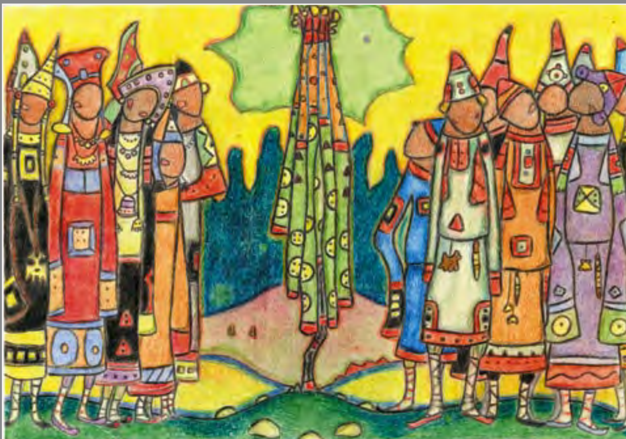
Древо жизни Великое