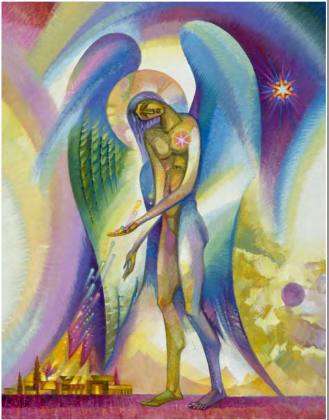
Скорбящий ангел Беслана