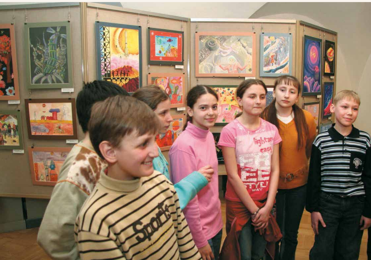
Юные художники на открытии выставки

«Valid» на английском языке означает «действительный, имеющий силу, веский, эффективный, надежный», соответственно «invalid» помимо своего сходного с русским значения «больной, нетрудоспособный» означает также «недействительный, безосновательный, непродуктивный». Более печального определения трудно представить, но так ли оно правомерно по отношению к детям, о рисунках которых зрители говорят «замечательные, жизнеутверждающие, яркие и уникальные»? Выставка «Объединенные Космосом» доказывает обратное: быть социально адаптированным – значит чувствовать себя частью общества, осознавать свою нужность и востребованность. Для этих детей творчество является одной из немногих возможностей стать таковыми.