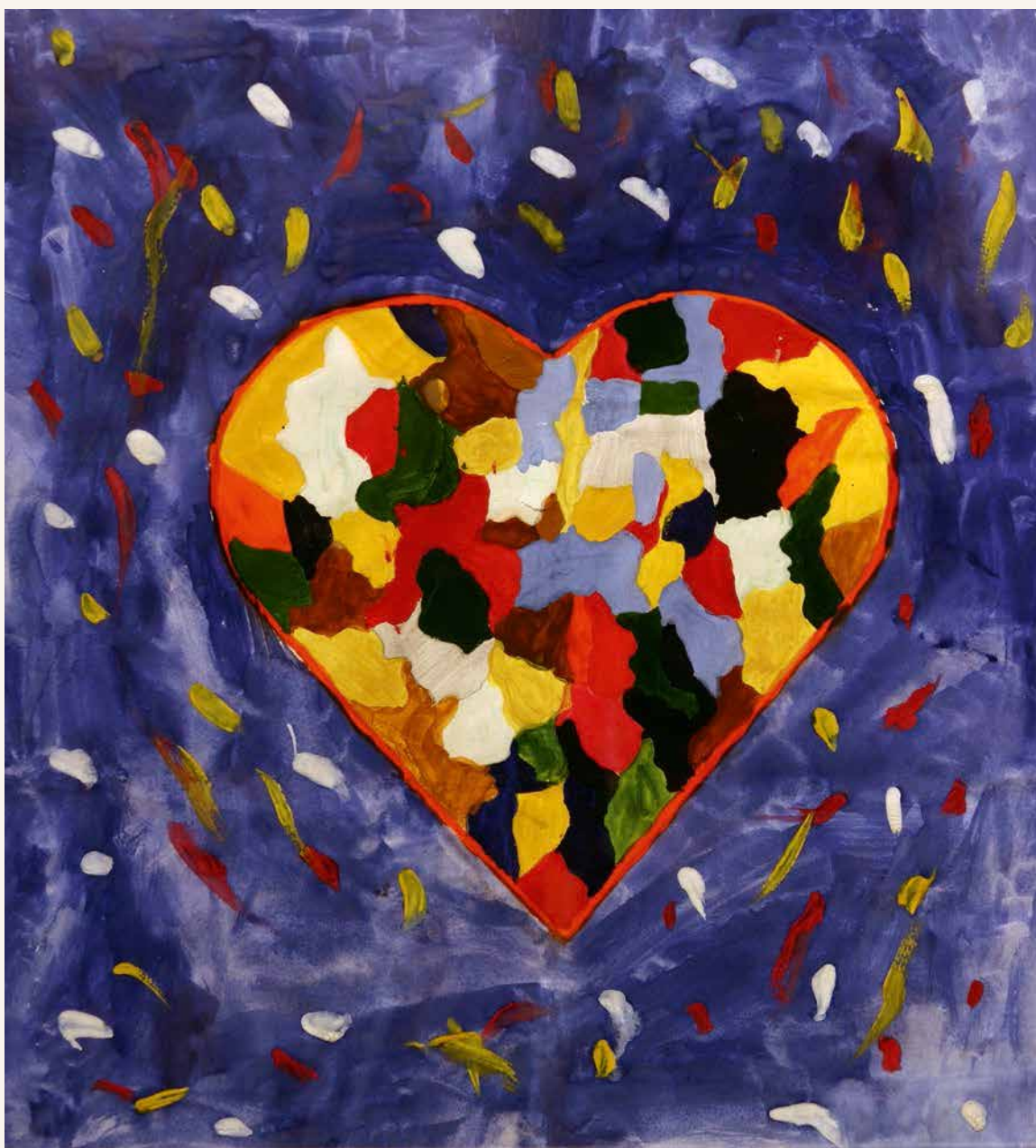
Саша Матвеев. Планета как сердце больного ребенка

предельности!» 13 . Хочется продолжить: когда мы поймем красоту Беспредельности, мы увидим истинную ценность бытия. А пока именно «через творчество нам открываются законы, на которых построен весь мир» 14 .