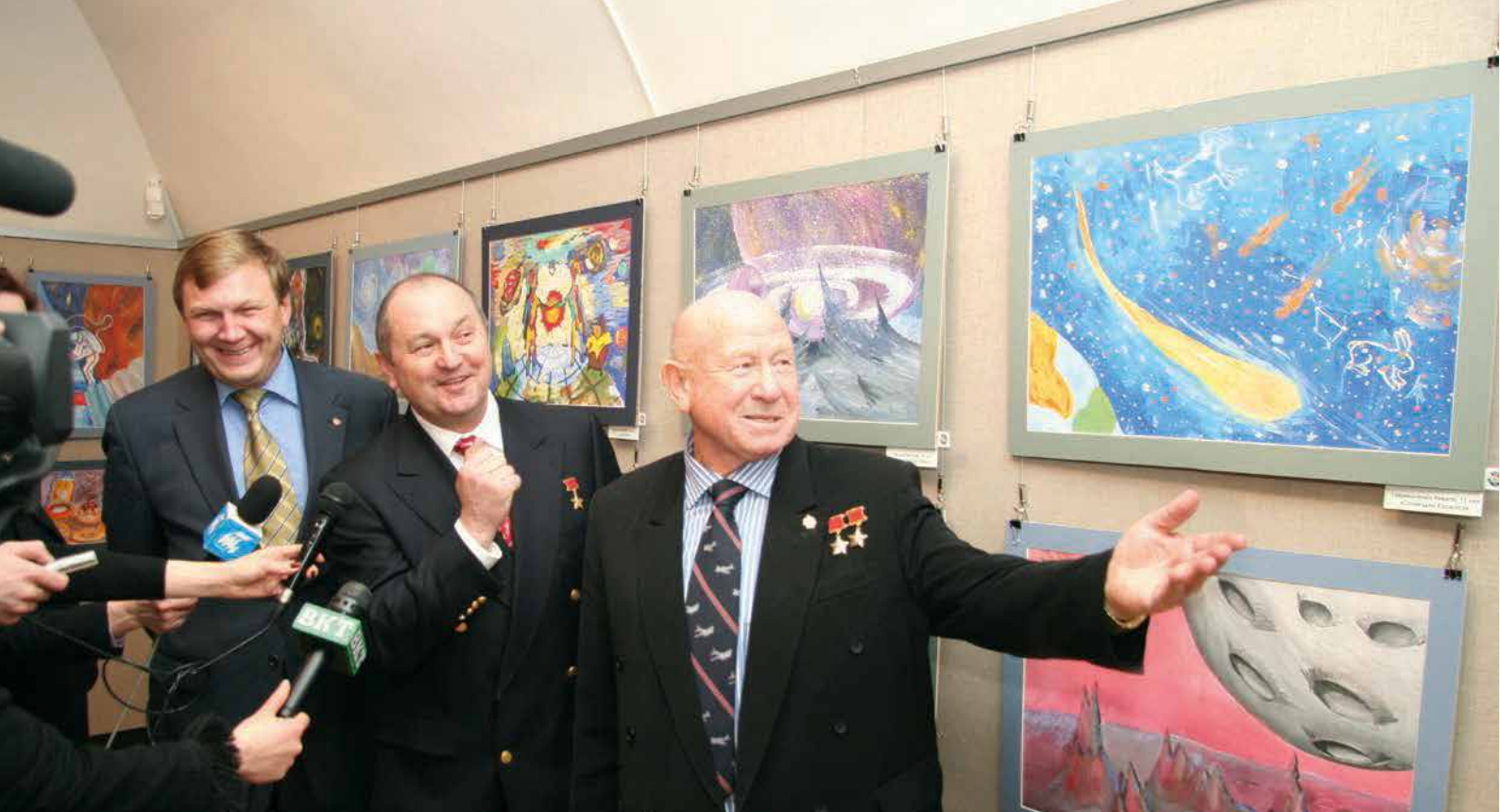
Гости выставки – начальник управления пилотируемых программ Роскосмоса А.Б. Краснов и летчик-космонавт, Герой Советского Союза В.Г. Титов. Летчик-космонавт СССР, дважды Герой Советского Союза А.А. Леонов комментирует экспозицию

ла существовать открыто и находиться при этом в безопасности.