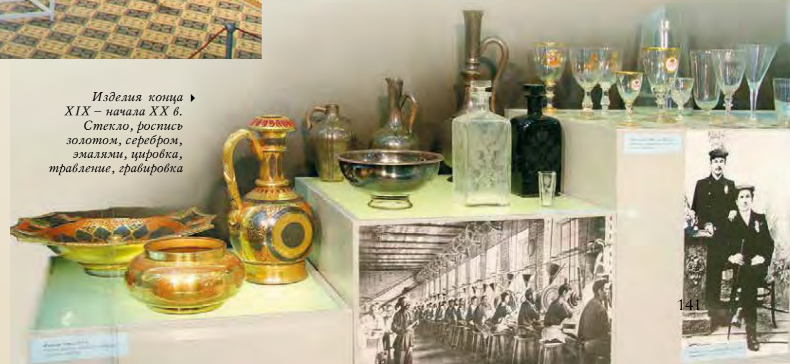
Изделия конца XIX – начала XX в. Стекло, роспись золотом, серебром, эмалью, цифровка, травление, гравировка

В галереях собора представлено свыше трех с половиной тысяч экспонатов. Нам представлялось логичным делать не рафинированную