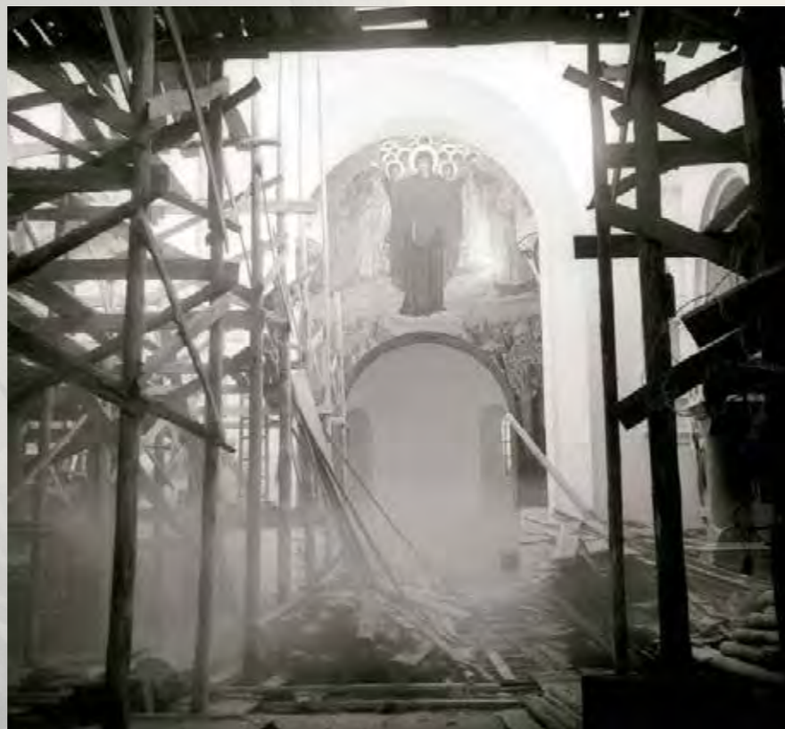
Интерьер Георгиевского собора, снятие строительных лесов. 1981

Стоимость реставрации достигала 220 тысяч рублей, – для музея-заповедника это была почти астрономическая цифра, превышающая его годовой бюджет. Но проект поддержал тогдашний