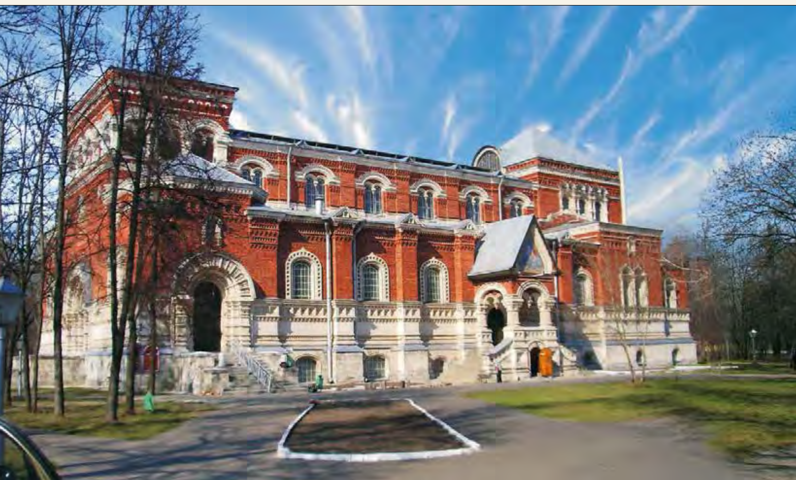
Георгиевский собор сегодня. Здесь располагается Музей хрусталя им. Мальцовых