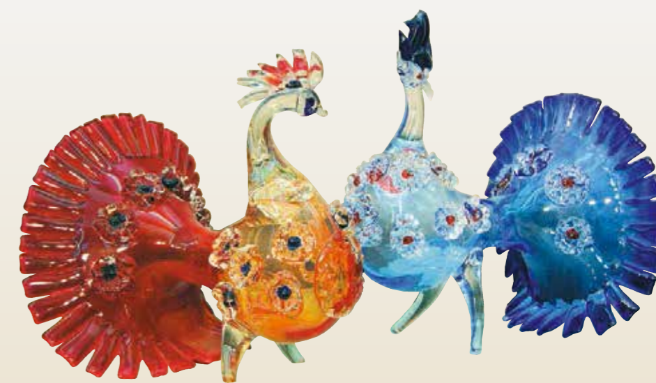
В.С. Муратов. Птицы. Хрусталь цветной. Гутная техника. 1970-е гг.