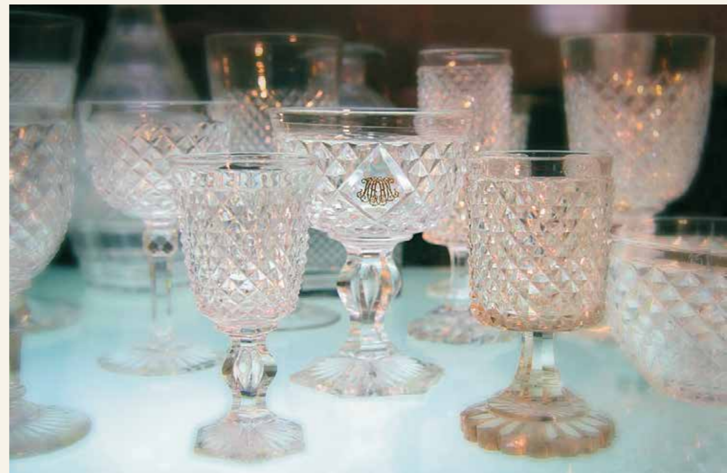
Рюмки. Первая половина XIX в. Хрусталь, алмазная грань «бриллиант»

Дмитриевского собора XII века. Расцвет стекольного оборвало монголо-татарское нашествие.