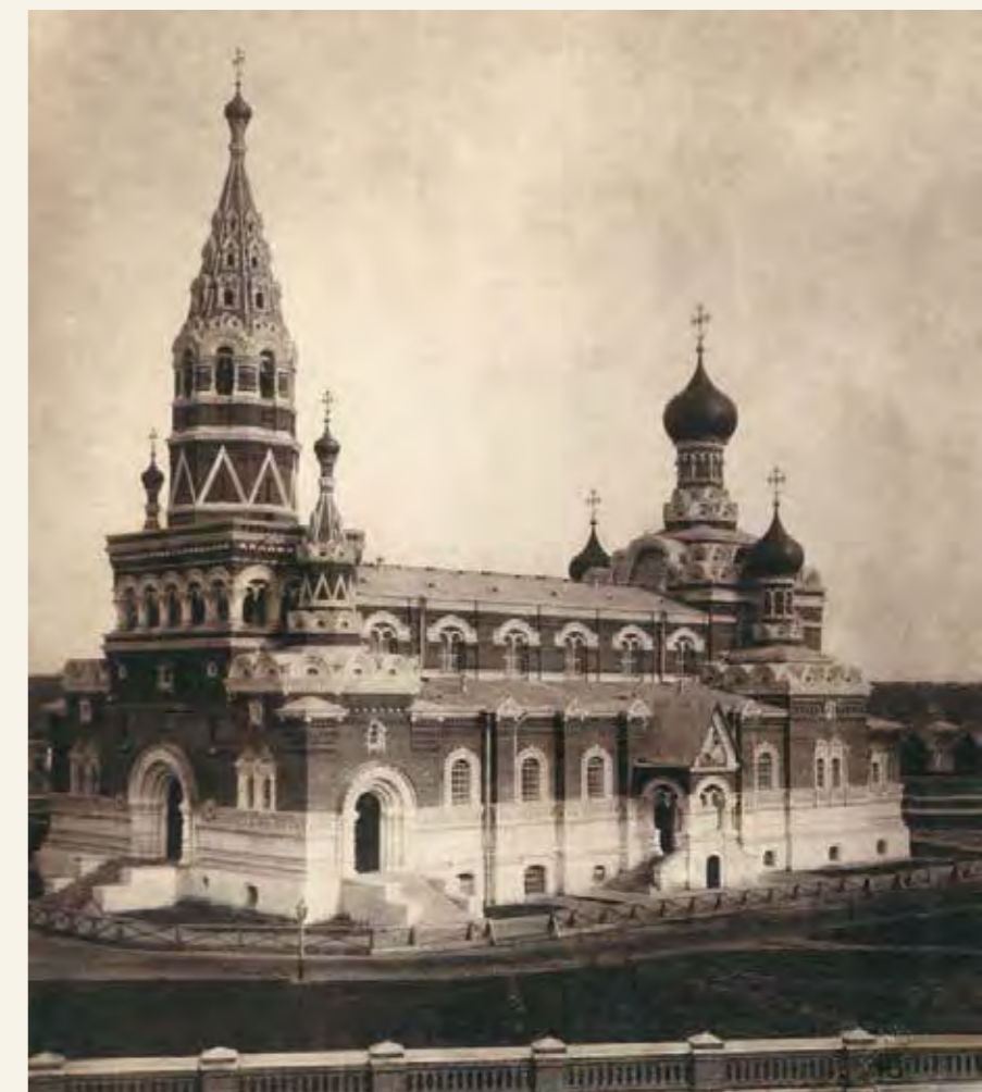
Георгиевский собор. 1892–1903. Архитектор Л.Н. Бенуа. Фотография нач. XX в.