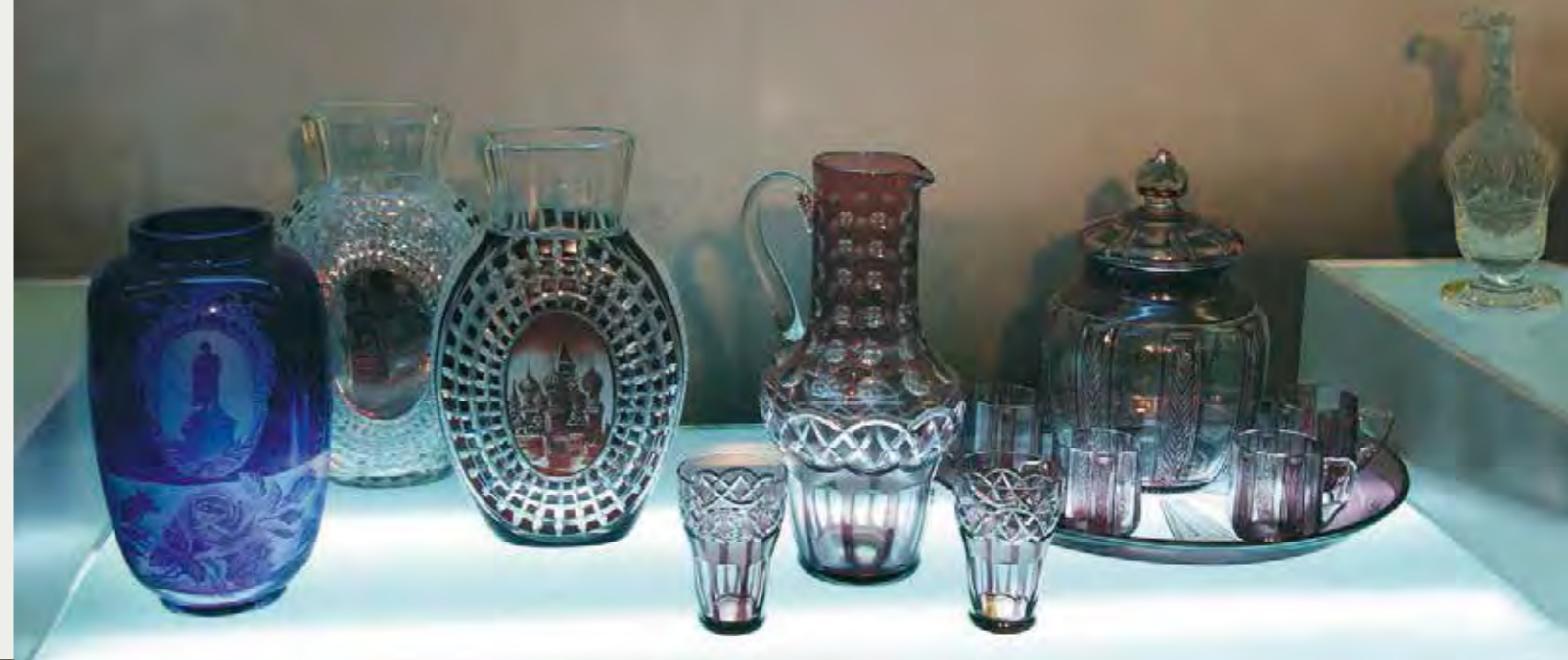
Декоративные вазы. 1947. Приборы для воды и крошона. 1940-е гг.

Музей хрустала – не только экспозиция. «Стекланный звон», «хрустальный звон» – музыка сияния, музыка цвета и формы ассоциируется с музыкальными созвучиями, и потому в стенах собора она слышится постоянно. Прелюдии Скрябина, камерные фортепьянные произведения Глинки и Чайковского, сочинения для арфы русских композиторов XIX века сопровождают гостя во время осмотра экспозиции. Есть в музее и своя концертная площадка, где регулярно проходят музыкальные фестивали «Хрустальная лира».