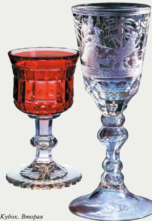
Кубок. Вторая половина XIX века. Хрусталь бесцветный и «золотой рубин», алмазная грань. Кубок со сценой охоты на медведя. 1780-е. Стекло, гранение, гравировка

лиант. Кажется, не рука человека, а волшебный посох Деда Мороза покрывает легким серебристым инеем рюмки, вазы, графины. Некоторые рожденные на гусевском заводе узоры стали эталоном, классикой стеклоделия – «мальцовская грань», «светлое растение».