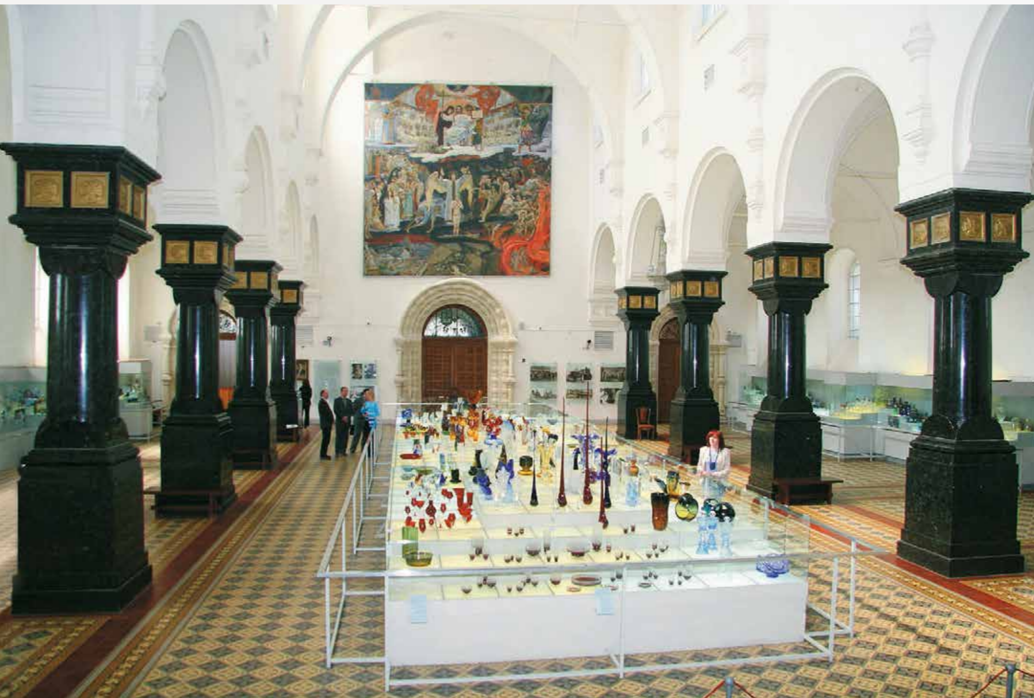
Экспозиция Музея хрустала

ки в двух комнатах заводоуправления. Как уцелели эти ящики во время революции и в более поздние времена, без описи, без регистрации, уложенные ящик на ящик, очень тяжелые, из самых обыкновенных досок, необъяснимо. Об этом складе знали все, но на заводе в советское время большим успехом пользовалась так называемая «образцовая» – выставочный зал лучших изделий современных мастеров, выполнявший функцию заводского музея.