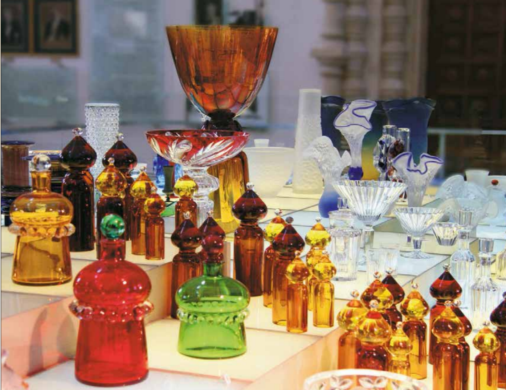
Фрагмент экспозиции центрального подиума

«Золотой рубин» – так называют стекло малиновых оттенков, своим самоцветным мерцанием напоминающее драгоценный камень. Его делали, добавляя в бесцветную стекольную основу золото, растворенное в смеси соляной и азотной кислот – «царской водке». Изобрел способ получения «золотого рубина» немецкий алхимик Иоганн Кункель в XVII веке, тайну его изготовления открыть не захотел, написав перед смертью: «Так как этот секрет стоил мне больших трудов, стараний и забот, то пусть никто не сочтет плохим, что