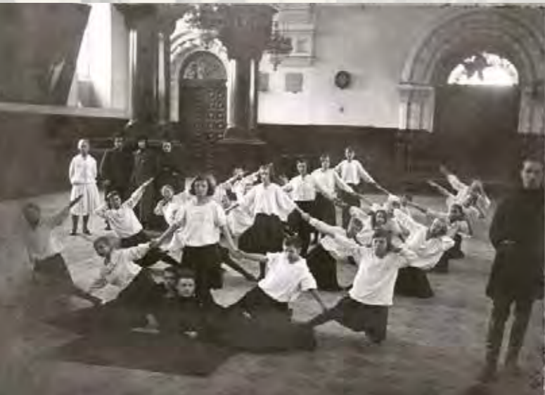
Дворец труда в Георгиевском соборе. 1930

К 1973 году для кинотеатра, библиотеки и музыкальной школы в Гусь-Хрустальном были выстроены новые здания, и они выехали