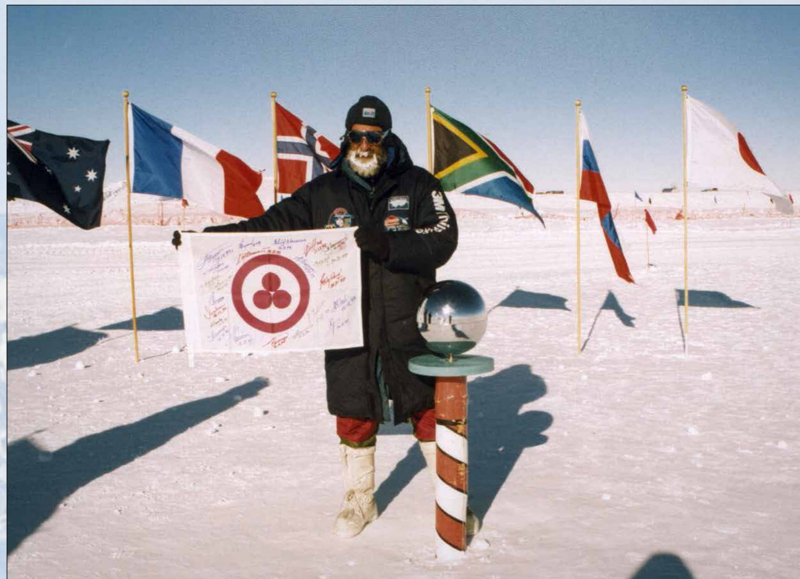
Знамя Мира в точке Южного полюса. 8 января 2000 г.

Затем была поставлена еще более мощная задача — пересечь Северный Ледовитый океан на лыжах через точку Северного полюса, пройти маршрутом «от берега до берега», тоже автономно, нигде не пополняя запасов ни топлива, ни продовольствия. Экспедиция из четырех человек длилась четыре месяца (без двух дней). Это был ошеломляющий по своей сложности автономный лыжный переход. Двинулись в путь 20 февраля 1998 года, а закончили 20 июня на канадском берегу. Это был огромный риск, рассчитывать на чью-либо помощь не приходилось, шли без страховки, целиком полагаясь только на собственные силы. В мировой практике это была первая экспедиция, которой удалось пройти «от берега до берега» без поддержки. Это новое мировое достижение российских путешественников, членов Экспедиционного центра «Арктика», специалисты в области экстремальных путешествий и ми-