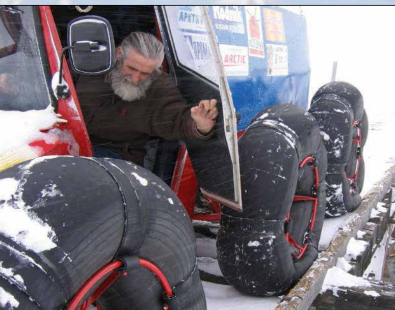
Югорский полуостров. Совсем недавно здесь проходила железная дорога к многочисленным угольным шахтам в окрестностях Хальмер-Ю. Весна 2005 г.

щий этап самый ответственный — хотим пройти по дрейфующим льдам Северного Ледовитого океана через Северный полюс до Канады.