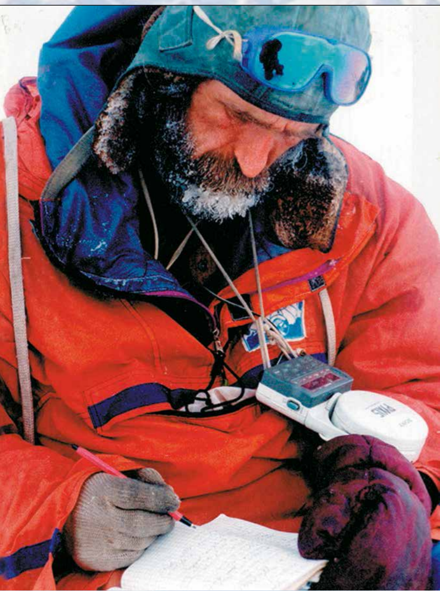
Так рождалась будущая книга о пути экспедиции на Северный полюс. Апрель 1994 г.

В 1989-м мы на лыжах первыми дошли до Северного полюса, в 1990 году повторили это достижение, а в 1994 году командой лыжников в восемь человек мы окончательно утвердили наш приоритет в достижении Северного полюса в абсолютно автономном режиме движения и тем самым закрепили за Россией этот «командный» мировой рекорд.