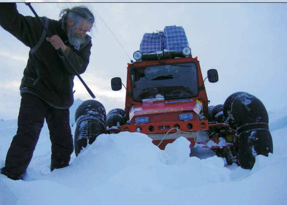
В торогах Карского моря. Весна 2005 г.

В декабре 1999 — январе 2000 г. мы осуществили первую в истории освоения Антарктиды международную неправительственную экспедицию — «Навстречу XXI веку». Установили наивысшие мировые достижения: массовый парашютный десант в Антарктиде в районе Патриот Хиллс, скоростной 10-суточный пробег на вездеходах по маршруту Патриот Хиллс — Южный полюс — Патриот Хиллс. Подняли первый воздушный шар над точкой Южного полюса, установили Знамя Мира — символ защиты