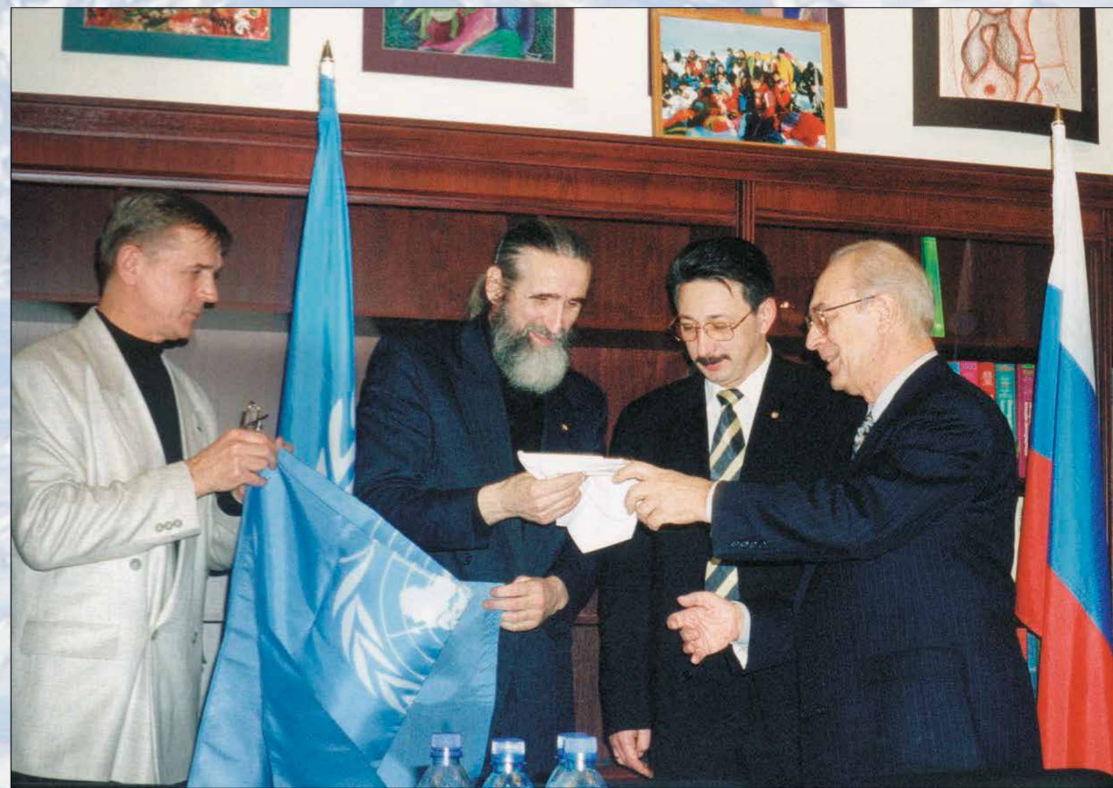
Ю.М. Воронцов вручает флаг ООН Экспедиционному центру «Арктика». Москва, Информационный Центр ООН. Декабрь 2000 г.