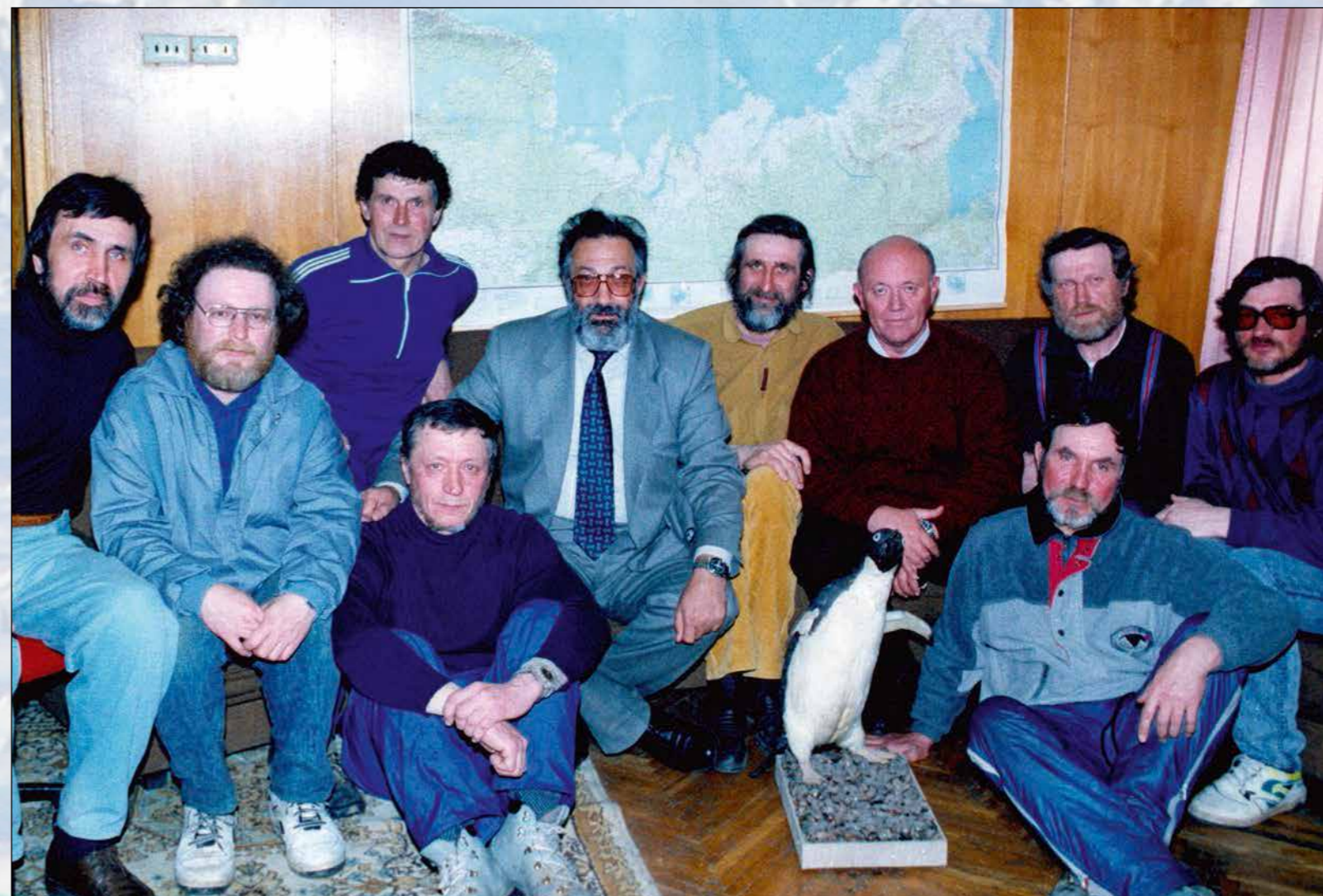
Группа «Арктика» в гостях у Артура Чилингарова и Юрия Сенкевича после первого в мире успешного автономного лыжного перехода к Северному полюсу. Май 1994 г.

— Тяга к путешествиям была у меня с раннего детства. В бытность военным я посвящал путешествиям все свое свободное и отпускное время. Сам я по образованию инженер-танкист, занимался перспективами развития бронетанковой техники. Вечерами и ночами, в выходные дни выкраивал время, чтобы заниматься подготовкой экспедиций, и свои первые два полюсных маршрута совершил во время таких отпусков. Когда Варшавский Договор прекратил свое существование, я ушел из Вооруженных Сил и с 1991 года стал профессиональным путешественником, хотя такой профессии в отличие от других стран у нас не существует.