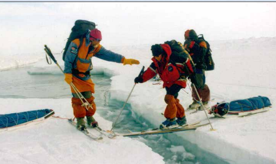
На пути из России в Канаду через Северный полюс. Май 1998 г.

комплексных экспедиций. Сегодня за их плечами — несколько парашютных экспедиций на Северный полюс. Они впервые в истории подняли воздушные шары в точке полюса, организовали полеты на паромоторах, подводные погружения аквалангистов и другие крупномасштабные общественно-спортивные акции.