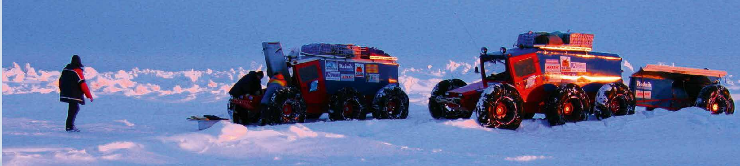
Короткая передышка перед пятибалльными торосами. Весна 2005 г.

ков прошли на четырех вездеходах по маршруту от Ямала (Салехард) до Чукотки (Певек), преодолев путь в 6000 километров. На втором этапе — апрель-май 2004 года — на вездеходах новой модели «Торос» мы прошли четыре с половиной тысячи, дойдя до самой северной точки суши — о. Комсомолец. В 2005 году прошли торосы Карского моря, отрабатывали технику движения по дрейфующим океанским льдам. Сейчас усовершенствуем технику, поднимаем плавучесть вездеходов, так как следую-