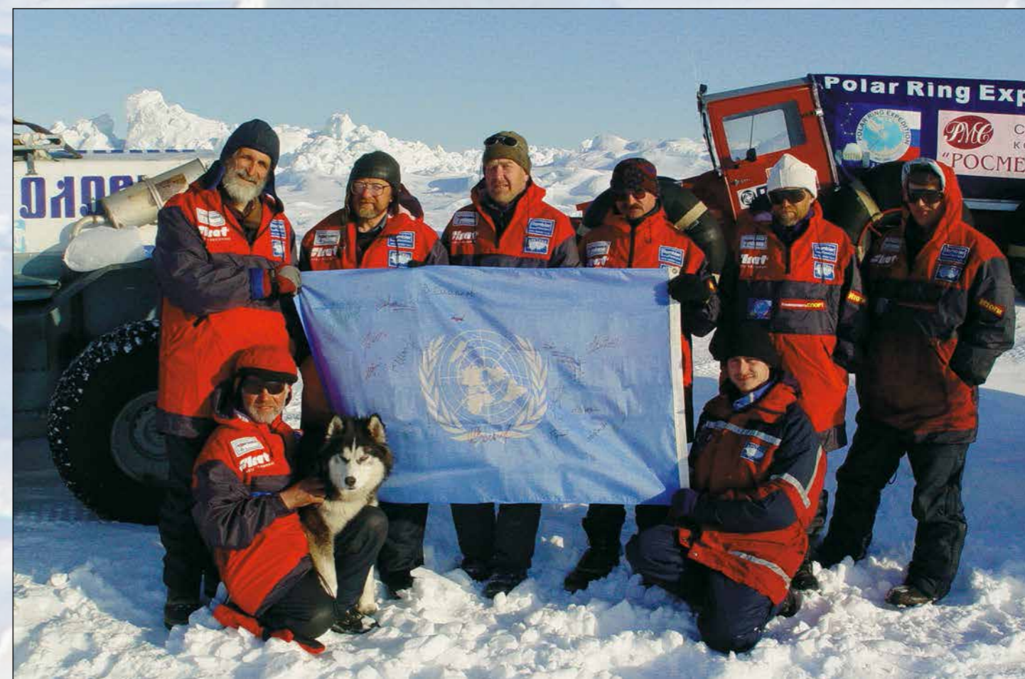
Участники экспедиции «Полярное кольцо» с флагом ООН, поднятым в честь 60-летия Организации Объединенных Наций. Весна 2005 г.

— Что вами движет, когда вы готовите очередную экспедицию? Недостаток острых ощущений, рефлекс исследователя, жажда новых впечатлений, желание испытать свои силы?