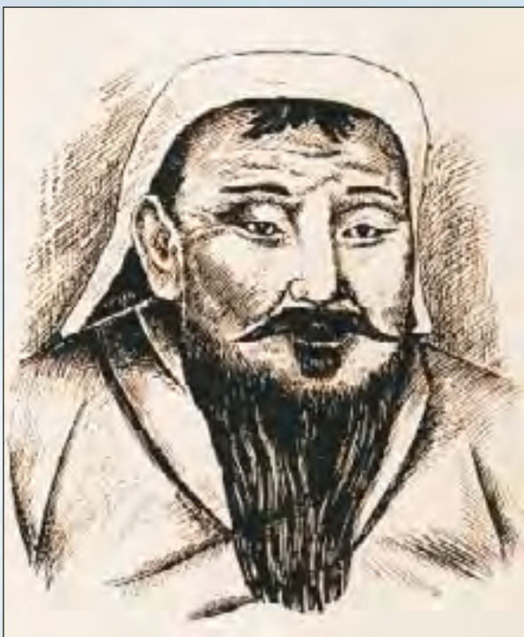
Чингисхан. Китайский портрет. XIII в.

антинациональной монархии, когда и правительство, и образованное общество стремились к тому, чтобы Россия была европейской державой, и всячески стыдились признать естественную связь России с Азией, даже тогда Россия силою вещей принуждена была продолжать историческое дело государственного объединения Евразии — дело Чингисхана: присоединение Крыма, Кавказа, Закаспийского края, Туркестана, закрепление за Россией Восточной Сибири — все это были этапы на том же пути собирания разрознившихся частей евразийского улуса Чингисхановой империи, а колонизация и запашка степи, превращение ее из кочевья в ниву было закреплением перехода евразийской государственности из рук туранцев в руки русских. И несмотря на то, что правительство, стремясь во всем подражать «великим европейским державам», готово было всюду проводить насильственную ассимиляцию и культурно обезличивать вновь присоединенные области (как это делают подлинные европейцы в своих колониях), народная русская стихия, инстинктивно ощущавшая подлинную задачу России, усваивала по отношению к туземному населению тактику братания, охотно заимствовала от покоренных разные черты их быта; в новоприсоединенных областях сами собой вырабатывались особые смешанные бытовые типы, которые со временем могли бы послужить основанием для целой радуги евразийских культур, разновидностей одной, общеевразийской: мешало только стремление русских верхов (как образованного общества, так и