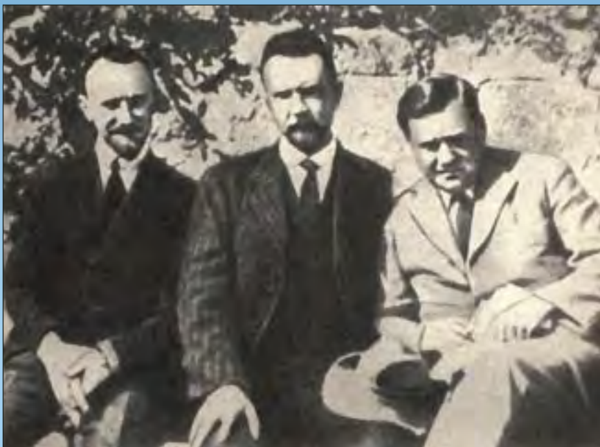
П. Савицкий, Н.С. Трубецкой, П.П. Сувчинский

очень комплиментарное, он уподобляет меня — Трубецкому.