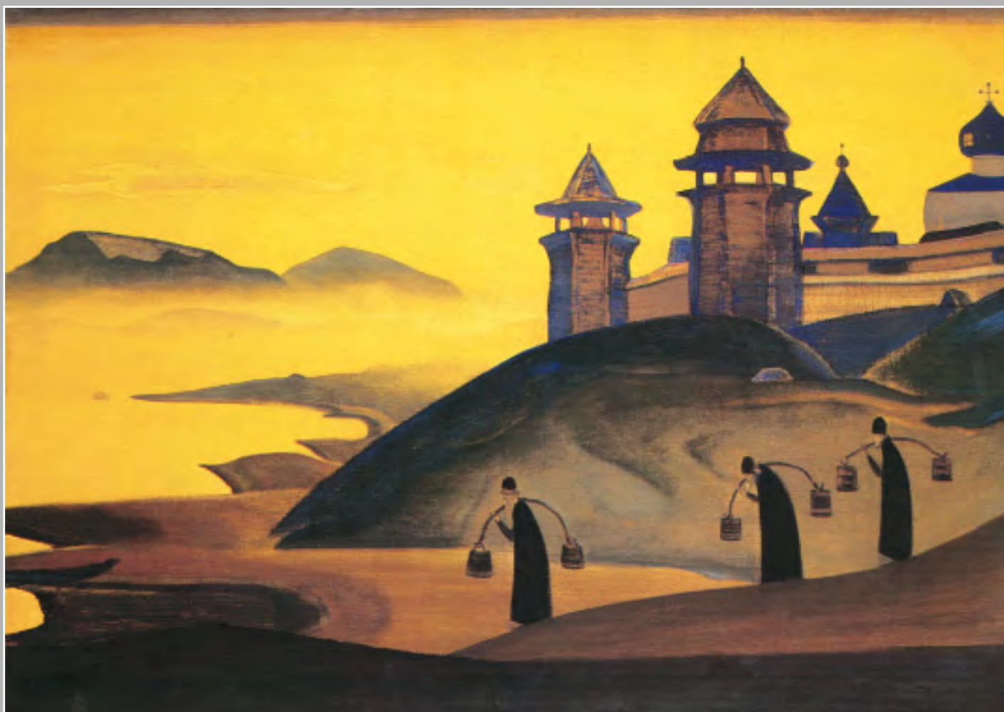
Н.К. Рерих. И Мы трудимся. 1922