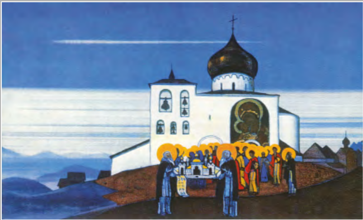
Н.К. Рерих. Звенигород. 1933