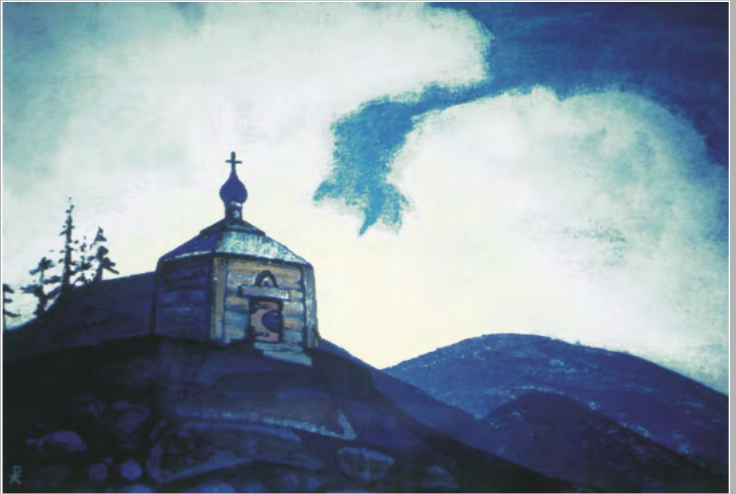
Н.К. Рерих. Часовня Святого Сергия на перепутье. 1931