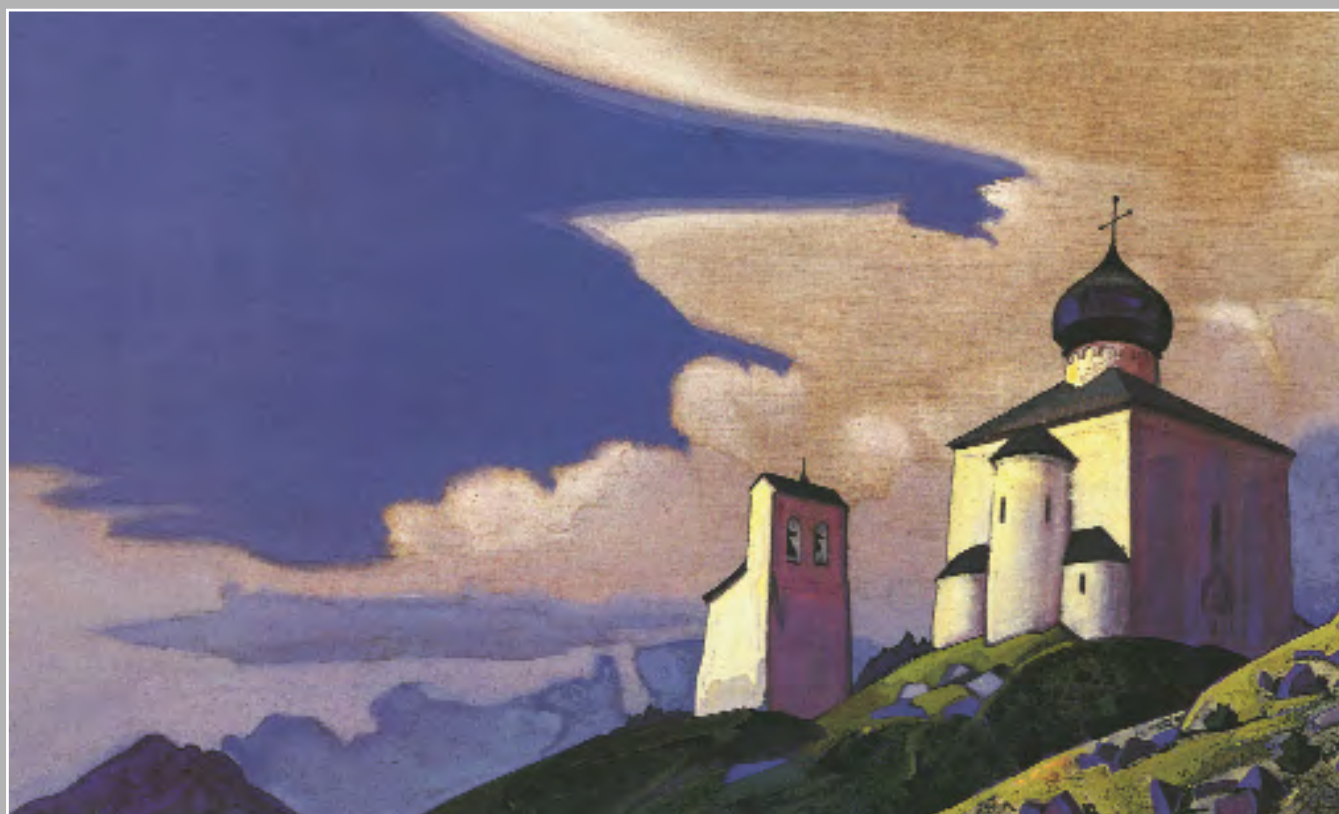
Н.К. Рерих. Сергиева пустынь. 1933