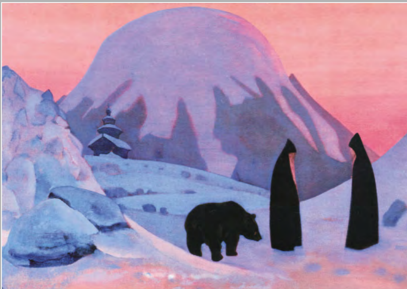
Н.К. Рерих. И Мы не боимся. 1922