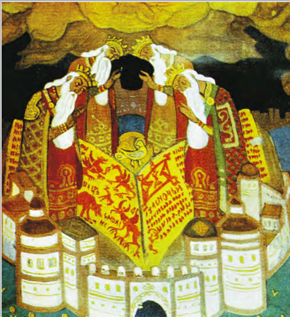
Н.К. Рерих. Голубиная книга. 1911