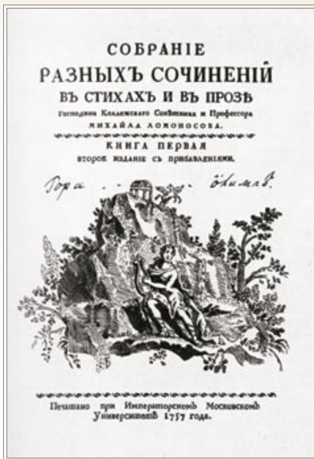
Титульный лист собрания сочинений Ломоносова, изданного Московским университетом. 1757

Несмотря на «лирический беспорядок», вызванный обращением внутреннего взора автора то к картинам битв, то к видам Этно и ада, то к небесным высотам, открывшим земле лики Героев, ода оказывается единой в композиционном отношении. В начальной части – «приступе» поэт повествует о замысле воспеть великое для Российской империи событие, свершившееся в стране, «где всходит день по темной ночи». Далее, в «изложении», он рассказывает о кровопролитной битве и сообщает о победе русских войск. В «заключении» поэт говорит о цели, с какой была начата война, – это была единственная возможность прекратить набеги орд татар и турок. Построение оды следует структуре силлогизма («посылка», «доказательство», «вывод»). Таким образом, поэтическое произведение для Ломоносова оказывается полем деятельности логически мыслящего разума. Но поэт в оде выступает в роли Хранителя высшей, беспристрастной, объективной, вечной Истины, которую он способен провидеть в момент вдохновения. Следовательно, поэт-творец руководится не рассудочным умом , а одухотво-