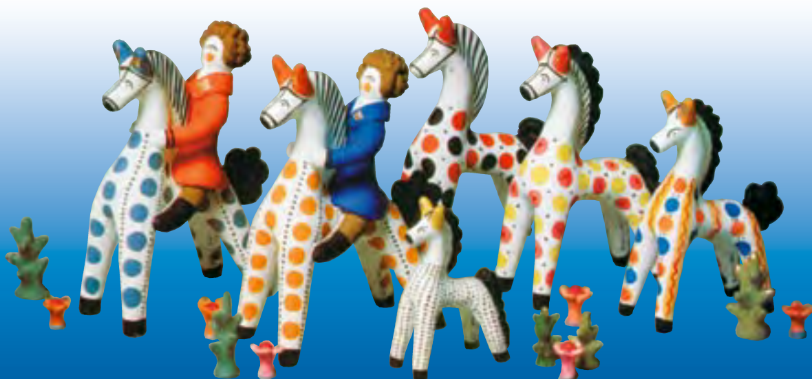
Е.В. Смирнова. Композиция «В ночном». 1979