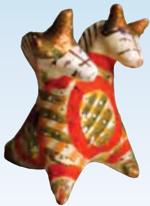
Конек-свистулька. Начало XX века

лодочным катаниям. Когда мужчины зимой уезжали на заработки, женщины, тоскуя по своим мужьям, думая о них, лепили всадников. Глину брали тут же, на огороде, обжигали игрушку в русских печах, белили мелом, смешанным со снятым молоком, расписывали красителями, изготовленными на яйцах. Все семьи, что жили в слободе, занимались лепкой игрушек, мастерство передавалось из поколения в поколение. Но у каждой мастерицы была своя рука, свой неповторимый узнаваемый почерк. Работали в полутемных избах, жизнь была трудной и тяжелой, вот в игрушках и проявлялась вся мечта о радости, свете – в ярких красках, легших по белому фону, и сусальном золоте, рассыпанном искрами неземного света и блеска.