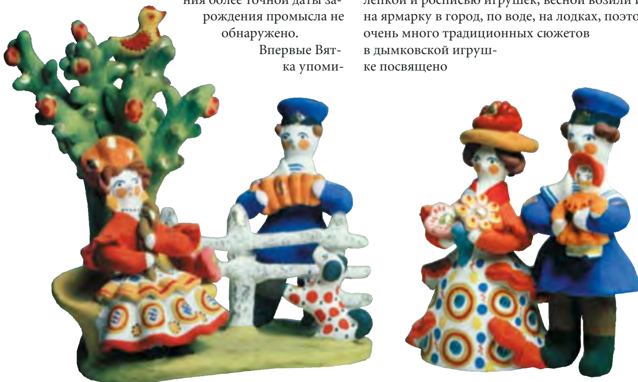
Г.И. Баранова. Свидание с моряком под яблоней. Семья моряка. 1979

Каждую весну, когда разливалась река Вятка, все Дымково затопляло водой. У каждого дома была своя лодка, на ней – и в город, и за дровами, и по делам. Множество семей, живших в заречной Дымковской слободе, с давних времен занималось лепкой и росписью игрушек, весной возили их на ярмарку в город, по воде, на лодках, поэтому очень много традиционных сюжетов в дымковской игрушке посвящено