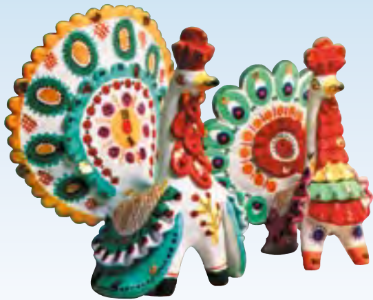
В.П. Племянникова. Индюки. 1978–1979

представить, ибо в музеях дымковских игрушек подобного рода не сохранилось. Например, «телега с седоком», «пролетка с седоком», «самовар с чайным прибором», «колодец». В 1896 году глиняные дымковские игрушки вновь экспонируются на Всероссийской промышленной и художественной выставке в Нижнем Новгороде.