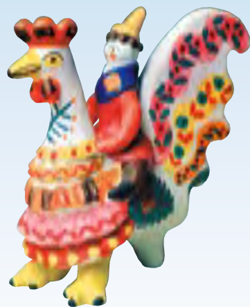
Е.П. Косс-Деньшина. Мальчик на петухе. 1963

Дымковскую игрушку, которая несет в себе сотни лет доброты, красоты, радости, любят и взрослые, и дети.