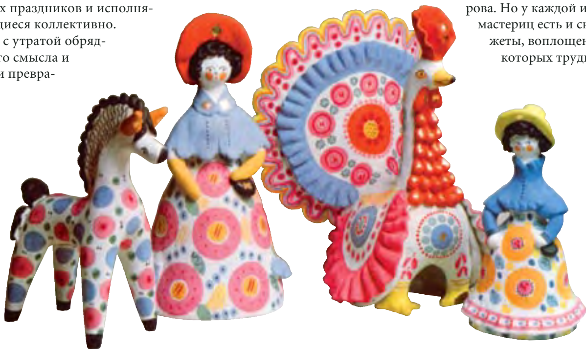
А.С. Фалалеева. Композиция «Нежность». 1979