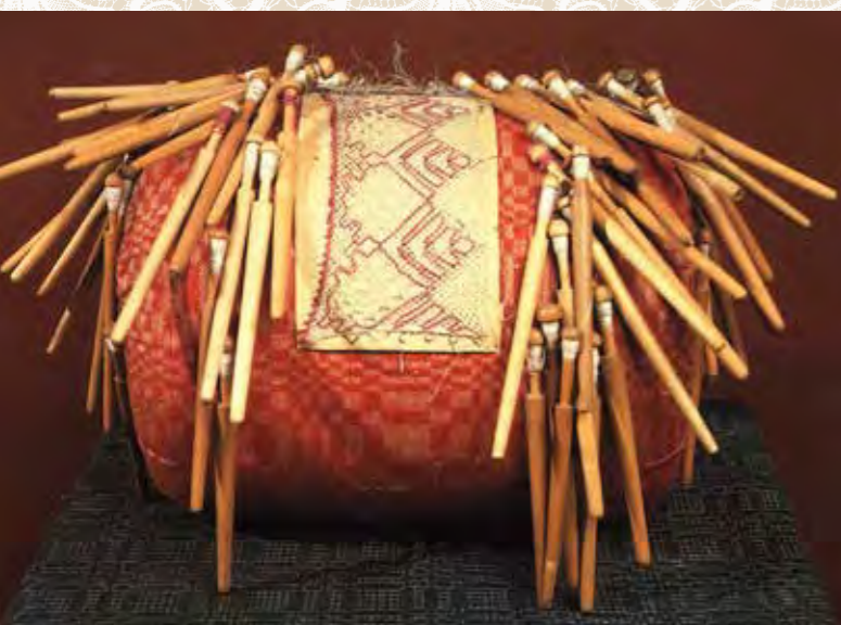
Подушка с коклюшками, сколом и начатым кружевом

ние, давно забытые воспоминания... Цветущая поляна, восход Солнца, искренняя молитва Землице-матушке, чтобы послала богатый урожай и защитила от врагов, языческое капище, костер на празднике Купалы... Образы эти оживают в душе