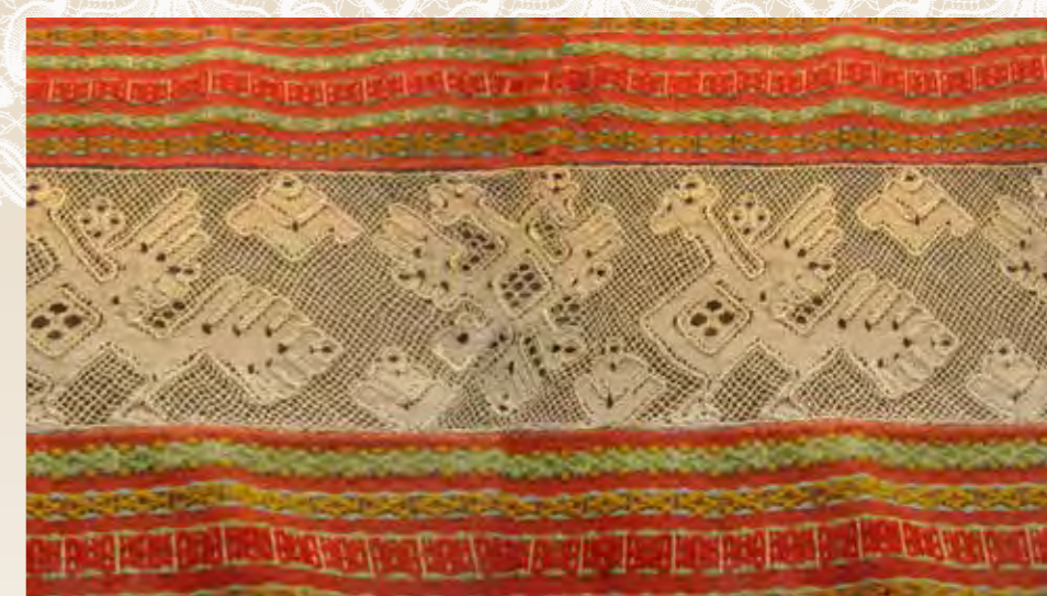
Край. Слобода Кукарка. Яранский уезд, Вятская губерния, Конец XIX – начало XX века

Рассматривая замысловатые цветные кружевные узоры мастериц прошлого, я частенько вспоминаю бабушку: бывало, посмотрит в окошко, увидит кусочек небесной лазури и добавит в кружево синюю ниточку, заметит, как скользит по дощатому полу лучик солнца, и оранжевую ниточку в тонкую вязь кружева вплетает. Дорогая моя старушка была родом из небольшой, прилегающей к городу Михайлову деревеньки, и всю жизнь занима-