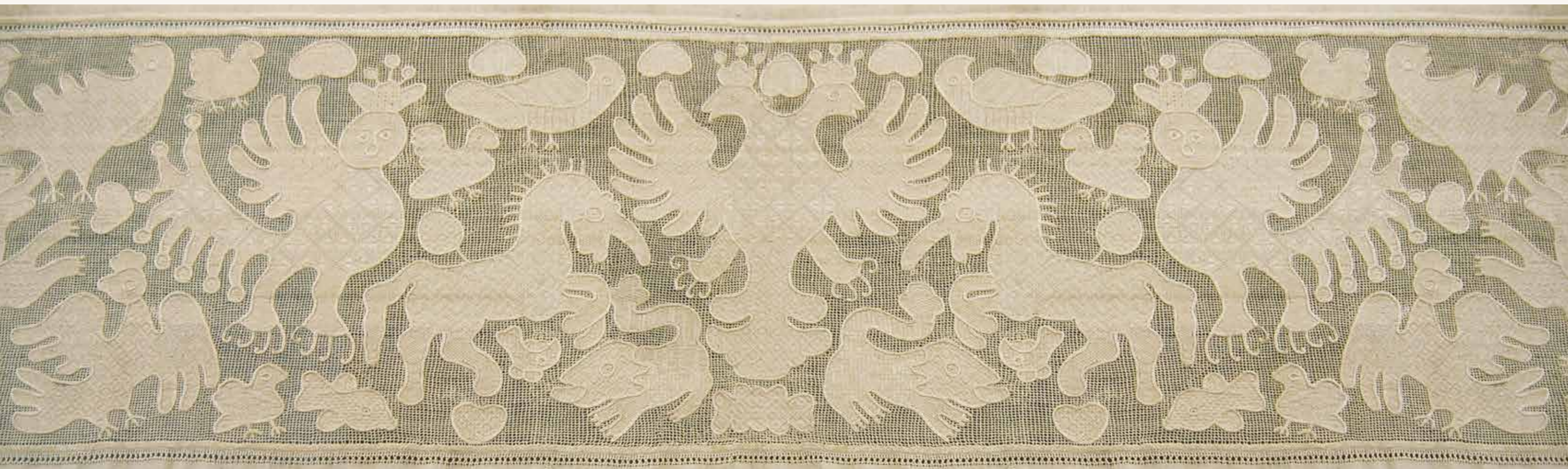
Край. Место исполнения неизвестно. Середина XIX века.

лась сцепным кружевоплетением. Однако плетут на Руси не только сцепное, но и парное (или многопарное), и численное, и парносцепное кружево, пользуясь для этого коклюшками, – деревянными палочками с выемкой, на которые наматываются нити. Сам же процесс плетения заключается в