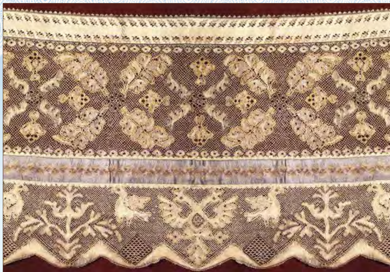
Край назеркального полотенца. Галич, Костромская губерния. Конец XVIII века

и тонкие кружевные изделия), о таком его назначении мало кто задумывался, потому что было оно привозным и использовалось не для превращения человека земного в человека духовного, а для украшения парадной одежды царских особ, знати, дворян и крупного купечества. Иными словами – для создания облика человека богатого, привыкшего купаться в роскоши.