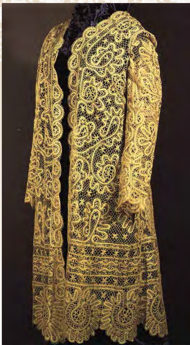
Пальто. Вологодская губерния. 1913

доброй ведуньей, владеющей секретами ворожбы. Вспоминаю, как порой по несколько часов кряду сидела рядом с любимой моей кружевницей на небольшой деревянной скамеечке и следила за тем, как она ворожит... Созерцание диковинных кружевных образов захватывало необыкновенно, тем более что бабушка скучать мне не давала, убажывая детский слух старинными русскими сказками. Слушая ее неторопливую плавную речь, я грезилась наяву, видя растущий на Море-Океане, на Острове Буяне дуб зеленый, в кронах которого поют птицы небывалые, разговаривая с чешуйчатой красавицей-русалкой или внимая завораживающему пению Птицы-Сирини. А потом, вернувшись из сказочной страны в реальный земной мир, видела любимых героев на бабушкиных кружевах, и душу мою переполняла невиданная радость... Восхищение волшебным бабушкиным ремеслом сохранилось во мне навсегда, превратившись с годами в неистребимую любовь к кру-