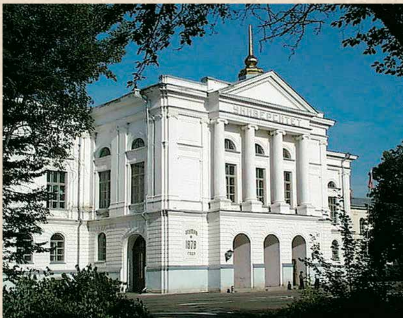
Томский государственный университет

В контексте современных идей и исследований авторы сборника рассматривают идеи русских философов, которые легли в основу нового космического мышления, – учение о пневмосфере П.А. Флоренского 11 , учение о ноосфере В.И. Вернадского 12 , устремленность в космическое пространство Н.Ф. Федорова 13 , и научные концепции К.Э. Циолковского и А.Л. Чижевского 14 . Особое место в философии космизма занимает наследие Е.И. Рерих. В материале Л.С. Решетниковой «Е.И. Рерих о роли традиционных учений Востока в формировании мировоззрения космизма» показано, что эта выдающаяся женщина вслед Е.П. Блаватской открыла Западу новые горизонты сокровенных учений Востока, в которых «изложены основные законы Мироздания, история эволюции Земли и человечества, указан путь и перспективы его развития» 15 . Один из авторов Живой Этики, она давала подробные комментарии к этому философскому учению, впитавшему в себя древнюю мудрость Востока, его сокровенной традиции.