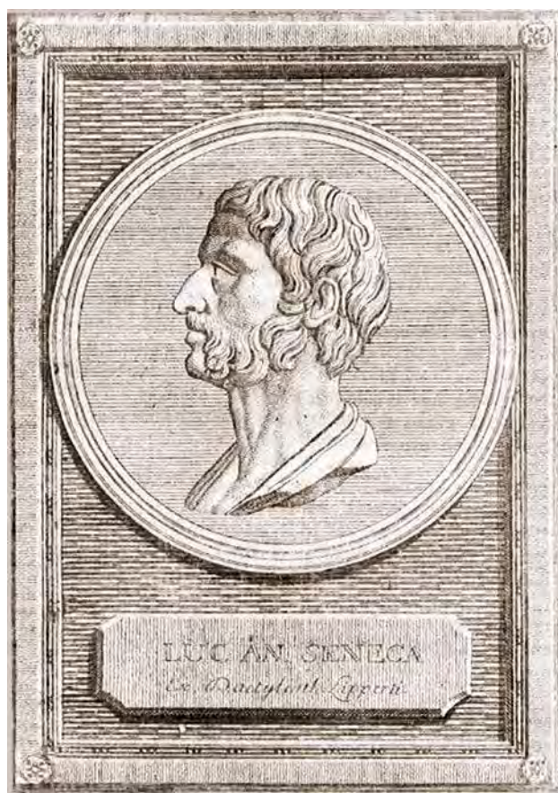
Неизвестный художник. Сенека. 1801

Пока что человек умудрился создать себе тирана из Времени, не для того предназначенного. И если не преобразится человек, он так и будет попадать в собственную ловушку, выстроенную им