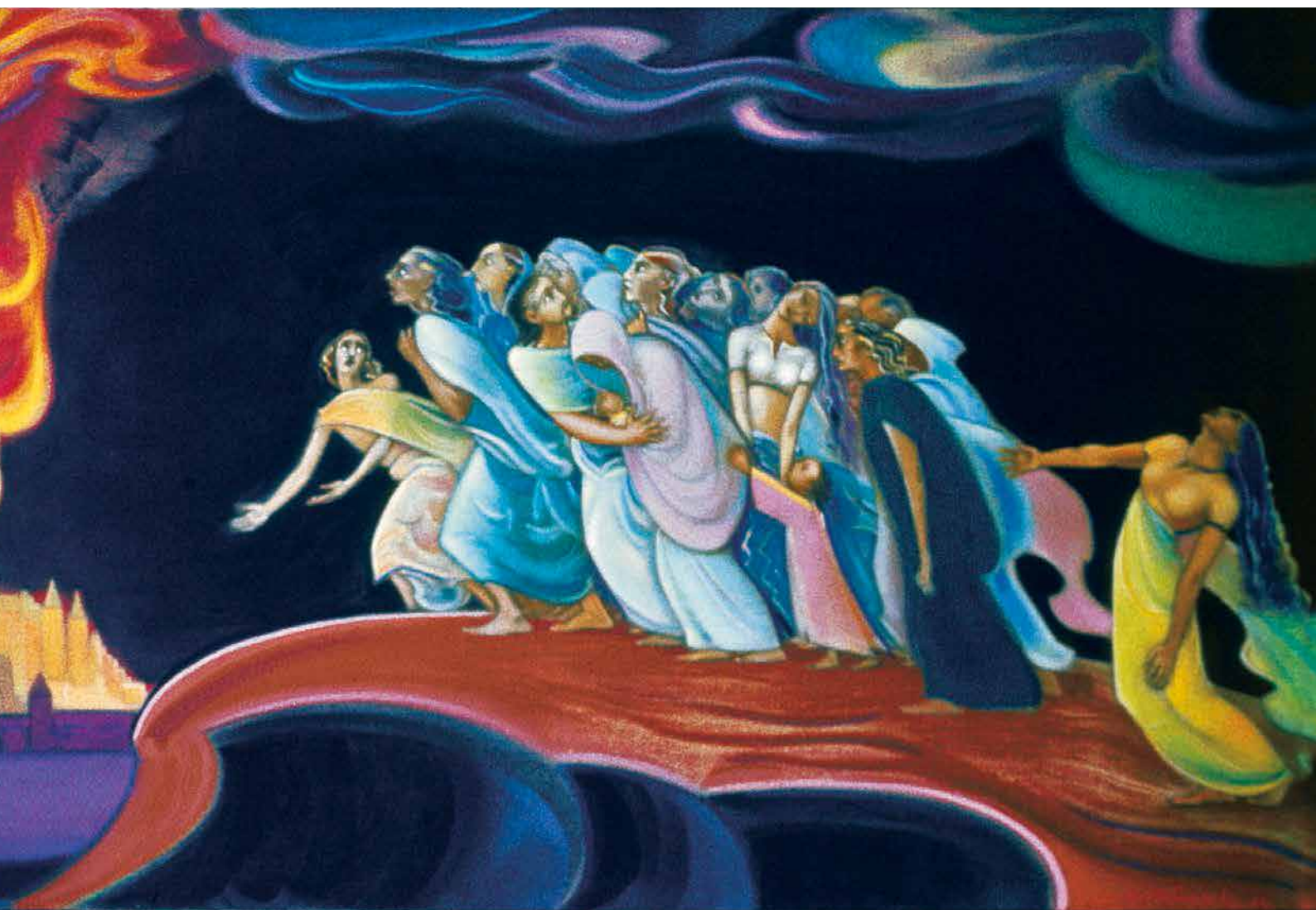
С.Н. Рерих. Возври, человечество. 1962

ное тело в общем устройстве мира, и неизбежно отторгается Бытием. Т.е. антропоцентризм, стремление существовать за счет другого приводит к утрате человеком самого себя; всякая односторонность рано или поздно превращается в свою противоположность.