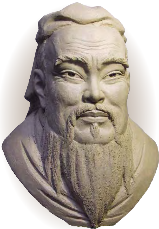
А.Д. Леонов. Конфуций. 2006

Недаром Бердяеву были близки немецкие мистики: «У Беме поразительно мистическое сближение неба и земли, Бога и человека, Христа и Адама. “Бог должен стать человеком, человек – Богом, небо должно стать единым с землей, земля должна стать небом”» 34 . Русский философ, персоналист, представления не имел о словах дзэнского мастера Японии XVII века Такуан Сохо: «Истинное Я существовало еще до того, как отделились Небо и Земля, и до того, как родились отец и мать. И это Я существует во мне, и во всех птицах и зверях, в траве и деревьях, во всем. Это и называется природой Будды... Человек, который увидел свое Я, заглянул в собственную природу и стал Буддой» 35 .