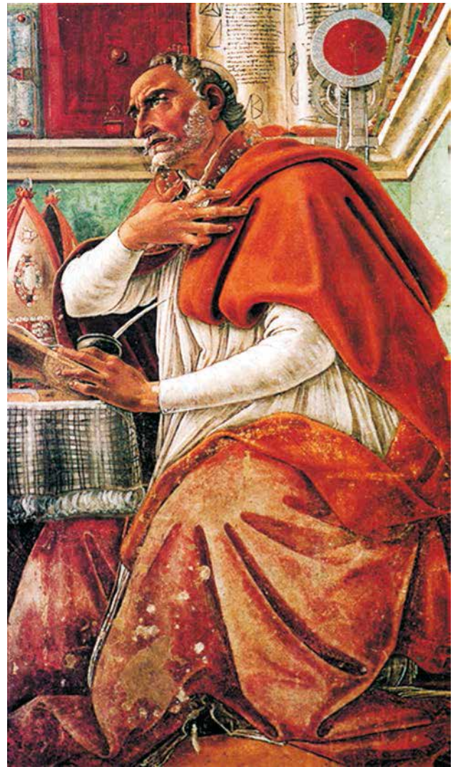
Сандро Боттичелли. Блаженный Августин в келье. 1480

Глашатаи контркультуры недаром искали ответы в восточных учениях. Существует закон самоотрицания части, значит, может восстановиться целостное мироощущение. «Все состоящее из частей подвержено распаду», – сказал Будда в последней Сутре о великой Нирване. А буддийский мастер Дао-шэн назовет Будду – Дао, вселенским Законом, изначальной Природой сущего. Если так, если этот Закон всеобщ, предвечен, то не могла не возникнуть потребность вернуться к Основе, не зависящей от человека,