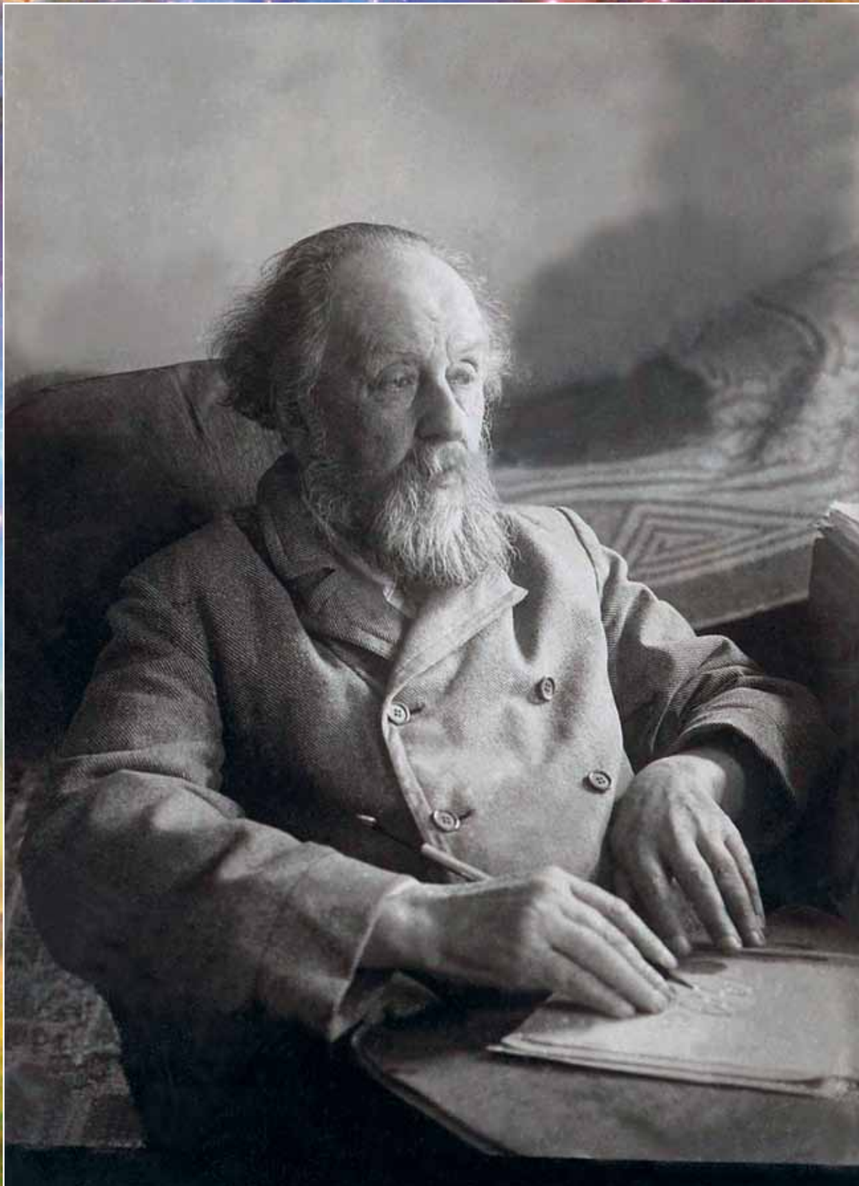
К.Э. Циолковский. 1928