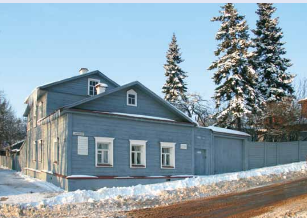
Дом К.Э. Циолковского в Калуге

ственное устройство. Отправной точкой стала статья 1916 г. «Горе и гений». В 1917–1918 гг. были написаны статьи «Идеальный строй жизни», «Общественный строй», «Устройство людей на Земле», «Какой тип школы желателен?», «Свобода воли», «Миражи будущего общественного устройства», «Гений среди людей», аннотация к циклу статей «Мысли о лучшем общественном устройстве человечества».