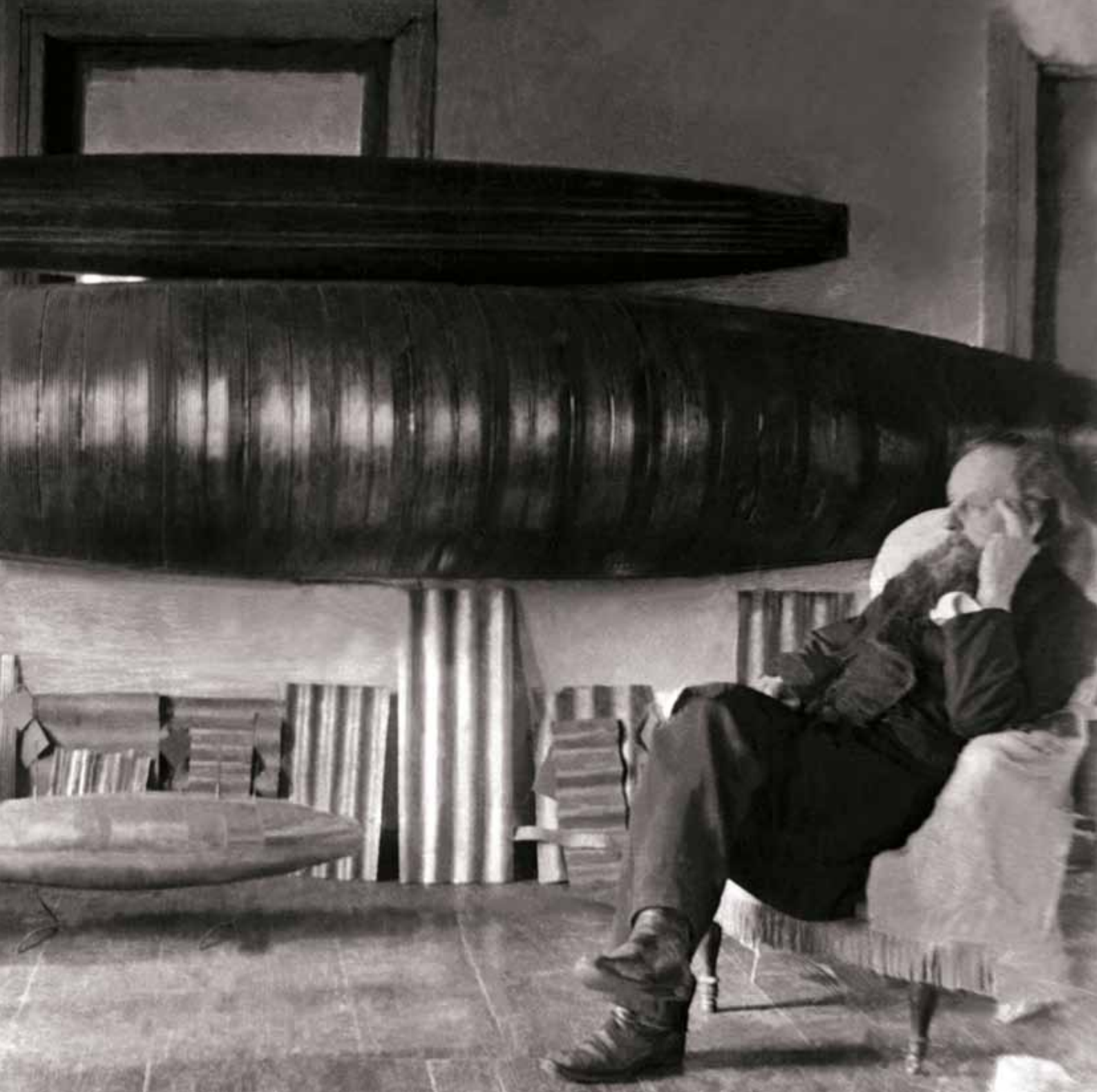
К.Э. Циолковский на веранде. 1924

ществе Циолковского существуют индивидуалисты-анархисты, не желающие присоединиться ни к одному из обществ и не подчиняющиеся законам; основная масса людей, составляющих первичные коммуны по интересам; выдающиеся люди и гении, входящие с помощью выборной системы в высшие разряды. Поскольку существуют связи между обществами пяти-шести разрядов (связь осуществляется через избранных), возможна и преемственность всех видов власти, и одновременно добровольное ей подчинение.