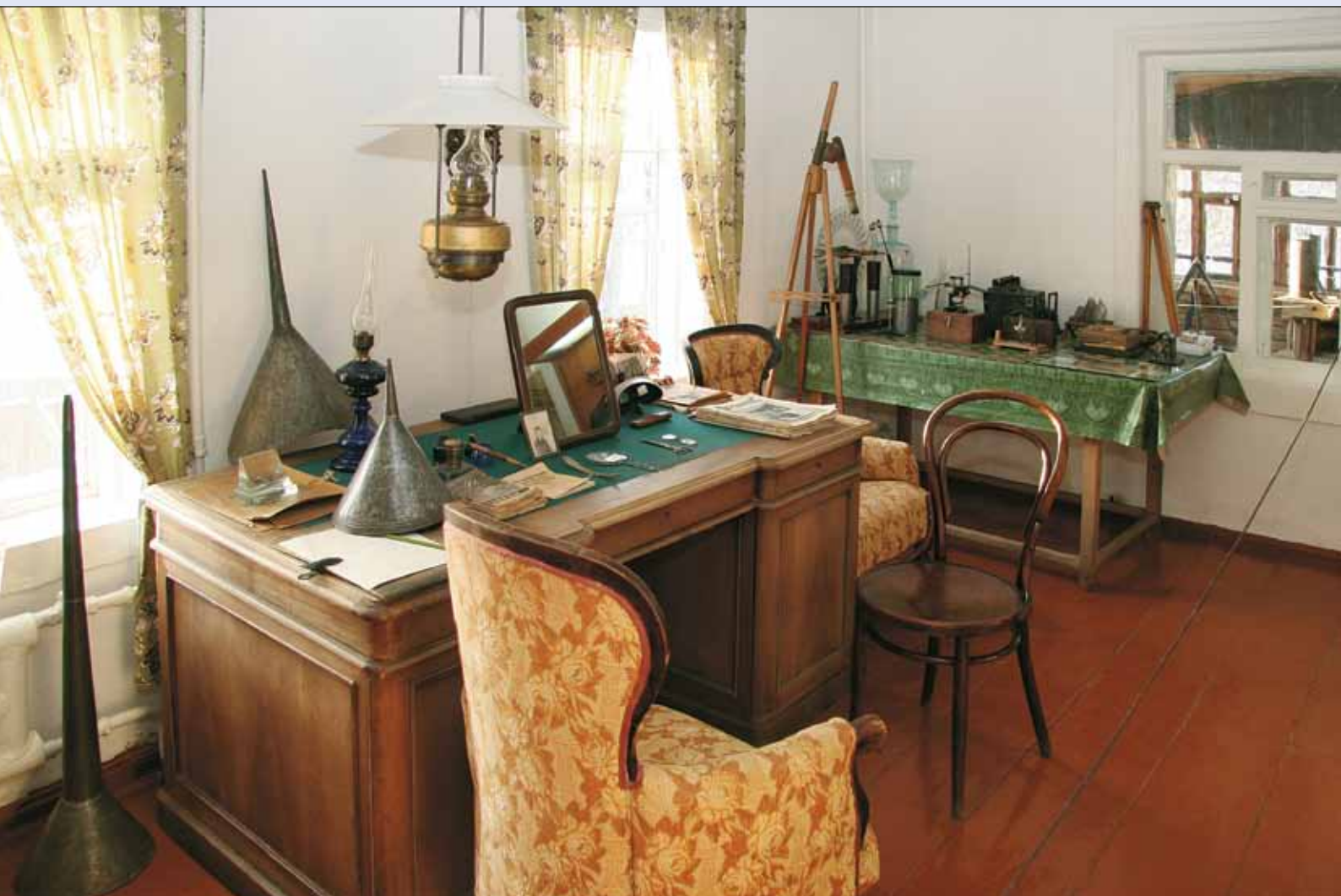
Кабинет К.Э. Циолковского

Вся проблематика социума рассматривается Циолковским сквозь призму дихотомии «совершенное – несовершенное». Несовершенство общества выступает в его представлениях как непроявленность потенциальных возможностей общественного развития. Став на позицию ученого, можно назвать современное ему общество протообществом, в котором еще не