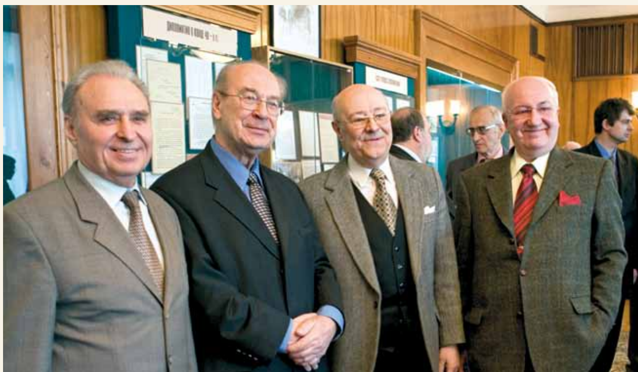
Послы СССР и России А.М. Дрюков, Ю.М. Воронцов, А.С. Чернышев, А.М. Кадакин

Открывая выставку, заместитель министра иностранных дел РФ А.П. Лосюков отметил, что эти взаимодействия всегда были важными и приоритетными для нашей страны. Год от года все более развивались политические отношения двух стран, налаживалось научно-техническое сотрудничество, в том числе в космической области. Помощь российской стороны содействовала становлению экономики и обороны Индии; были открыты месторождения газа и нефти, построены перерабатывающие заводы, развита инфраструктура. Отношения между нашими государствами никогда не омрачались какими-то конфликтами или противоречиями – это их важная специфика. Даже в драматические периоды в истории России они оставались на должном уровне, а в настоящее время отличаются особой доверительностью и взаимопониманием. Заместители министра выразили глубокую уверенность в том, что уважение и взаимный интерес двух стран сохранятся и в будущем, и это принесет пользу и России, и Индии.