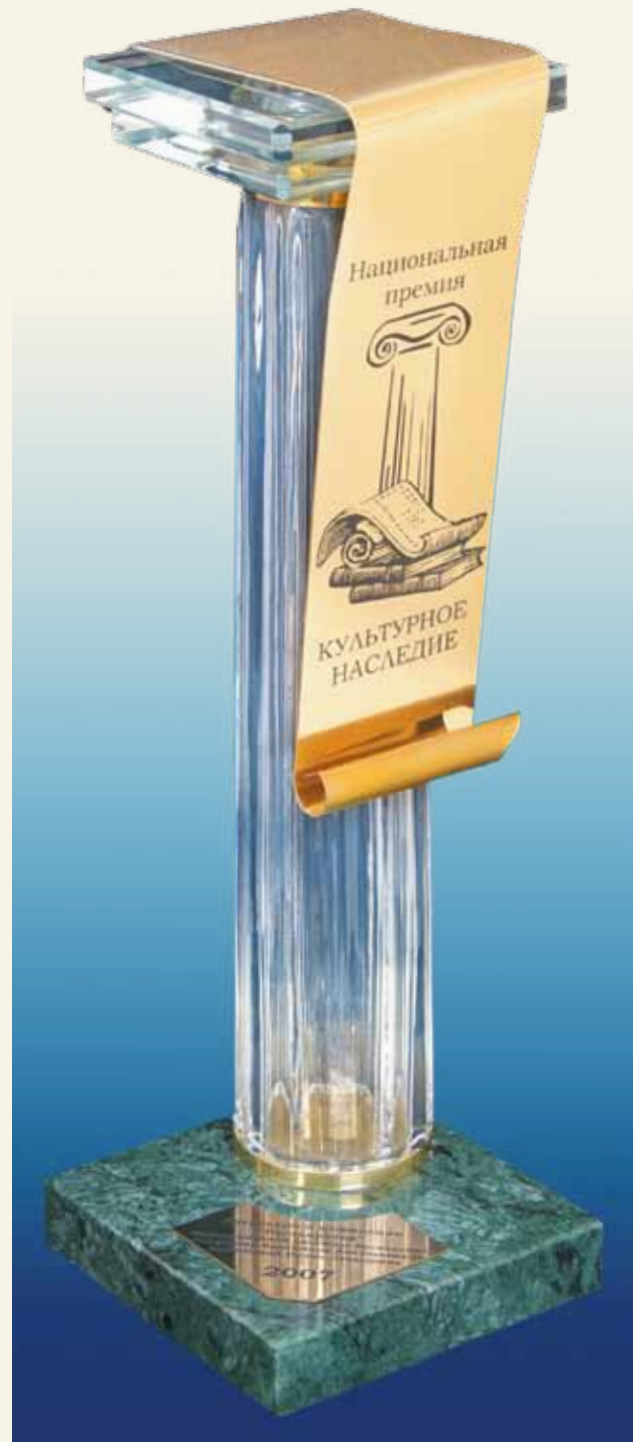
Приз Национальной премии «Культурное наследие»

Особо следует отметить высокий научный уровень реставрации, которая проводилась строго в соответствии с основными методологическими принципами и правилами, на основании археологических, архивных и натуральных исследований, научного анализа, с соблюдением реставрационных технологий. В настоящее время в стенах Усадьбы