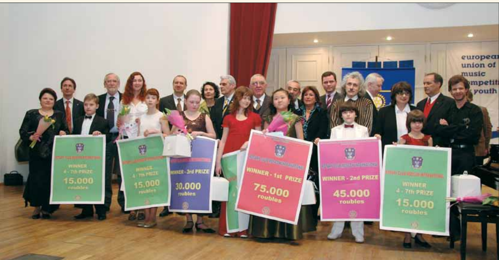
Организаторы конкурса, стипендиаты и их родители