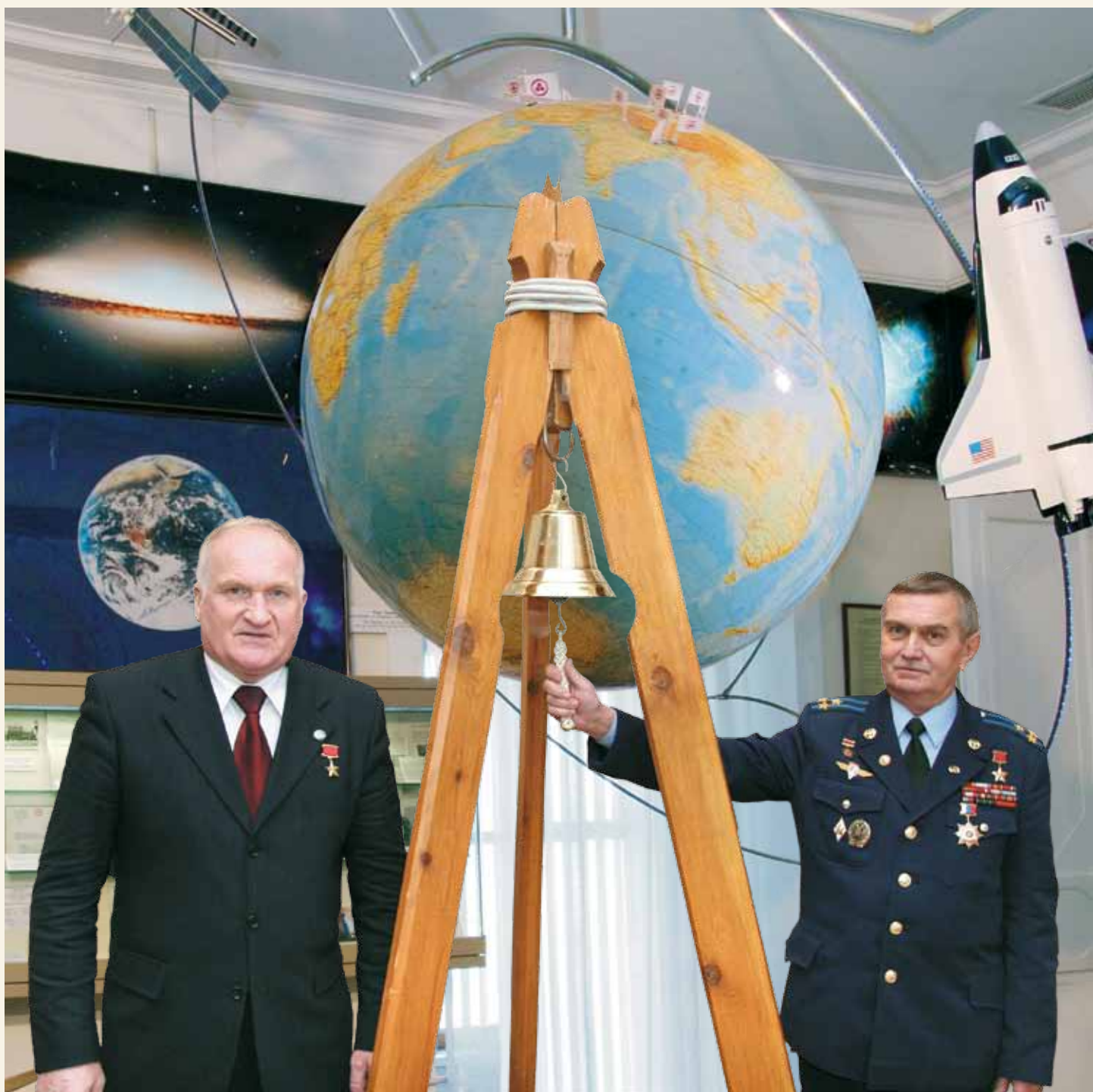
Первый удар Колокола Мира. Летчики-космонавты В.М. Афанасьев и А.Н. Березовой