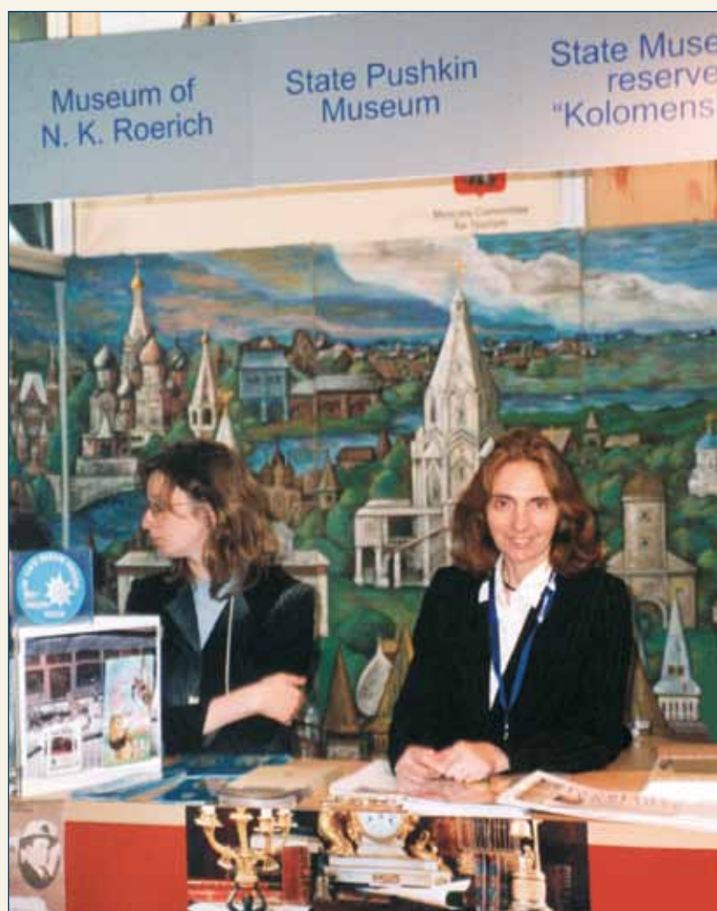
Музей имени Н.К. Рериха представлен на стенде «Музеи Москвы». Мадрид

Встречи и беседы активно использовались для ознакомления иностранцев с творчеством семьи Рерихов, ее вкладом в искусство, науку и философию. С интересом воспринималась, например, ин-