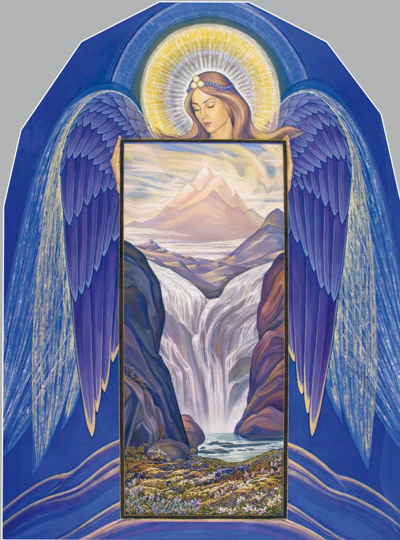
Г. Соколовская. Сокровенное. Центральная часть триптиха

силу его характера, но и весь тот юмор, всю искренность и доброжелательность, которые излучает этот человек, несмотря на сложности, через которые он проходит. Вот эти окружающие розу голубые цветочки поддерживают моего знакомого на его жизненном пути, а этот терновый белый венец – олицетворение чистоты его помыслов».