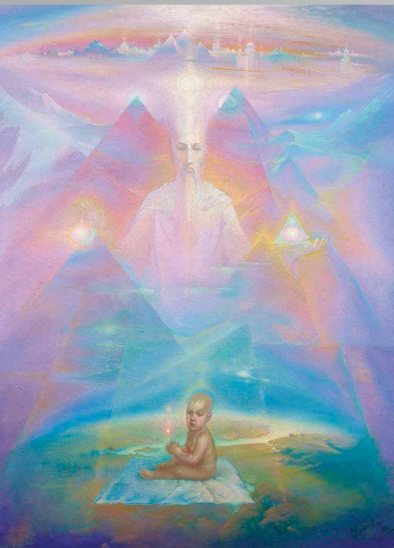
С. Кузнецов. Дар. Из цикла «Врата времени»

Названия пейзажей Сергея Кузнецова – «К единению в красоте призывающие», «Царство непоз-