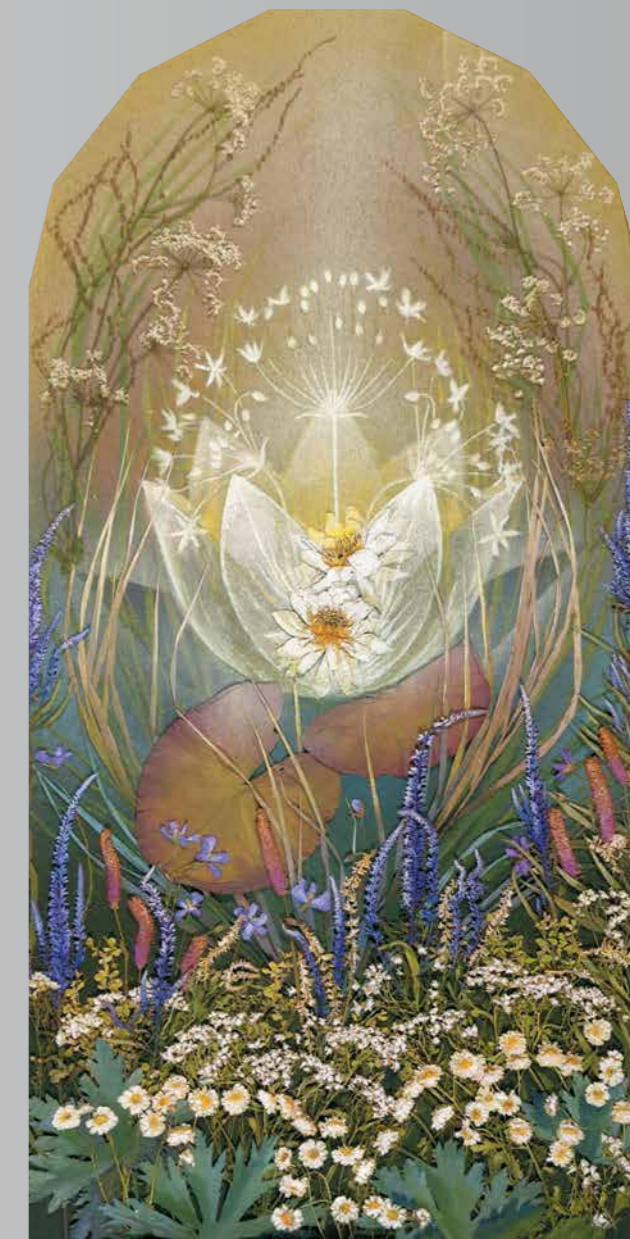
Г. Соколовская. Таинство брака

Несгибаемую волю человека, преодолевающего трудности, славит Соколовская в картине «Мужество». «Эту работу, – говорит она, – я посвятила своему знакомому, у олицетворяющей его розы удивительно прямой стержень – символ мощи его духа. В этой картине я хотела передать не только