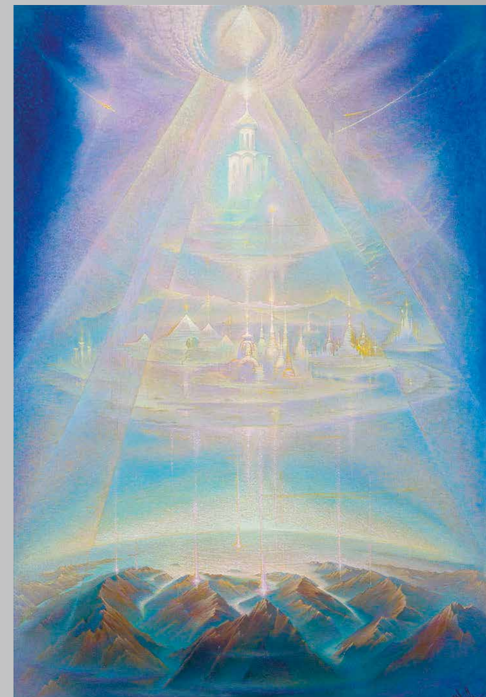
С. Кузнецов. Видение Мира. Из цикла «Небесная Россия»

Они будут вновь создавать сияющие картины, рисовать тонким пером прозрачные монохромные миры и писать стихи, в которых светятся Душа, Красота, Мир, и все это – с большой буквы.