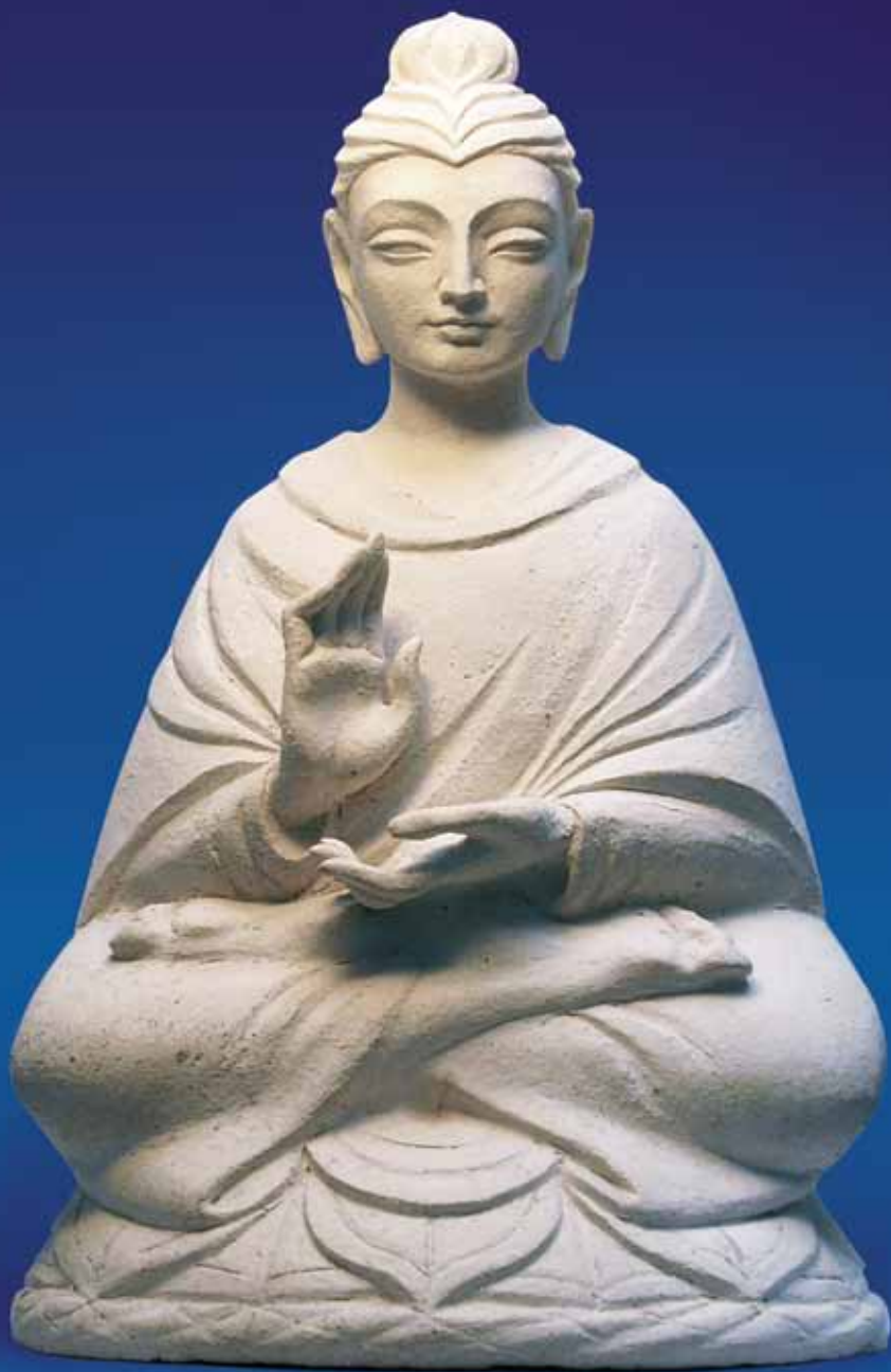
Будда благославляющий. 2003

Архангел со щитом и копием; он же, воздев лучезарный щит победителя, огненным мечом разрушает бастион тьмы; в облике всадника поражает змея – здесь его образ смыкается с образом Георгия Победоносца; далее он летит на коне, воздев над головой огненный меч.