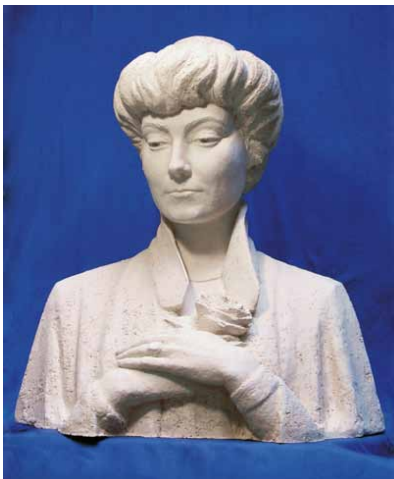
Е.И. Рерих. 2006

Он умеет вдохнуть жизнь в скульптурные образы, по определению статичные и жесткие, созданные из однотонного материала (ведь в скульптуре нет цвета – важной составляющей эмоционального воздействия на зрителя в изоб-