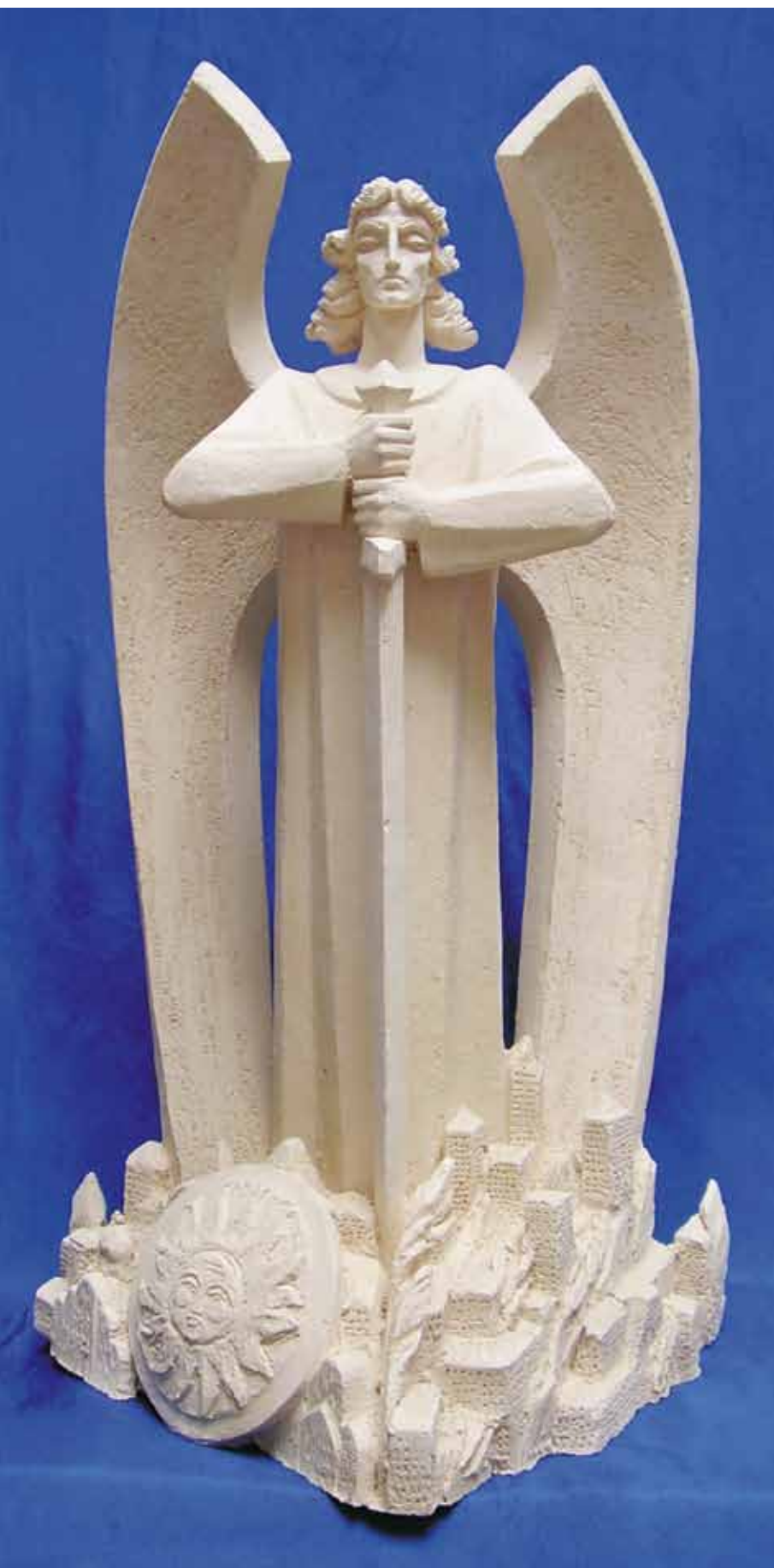
Судный День. Очищение. 2005

все выше, – так, как поднимают свечу, освещающую путь, чтобы свет ее рассеивал мрак дальше и дальше.