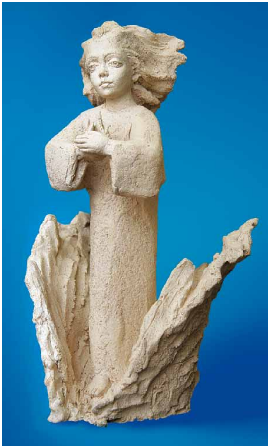
И свет приходит в Мир. 2006

На ладони Святого Сергия, поднятой к небу, – маленькая церковка, очертаниями напоминающая храм Покрова-на-Нерли. Он поднимает ее