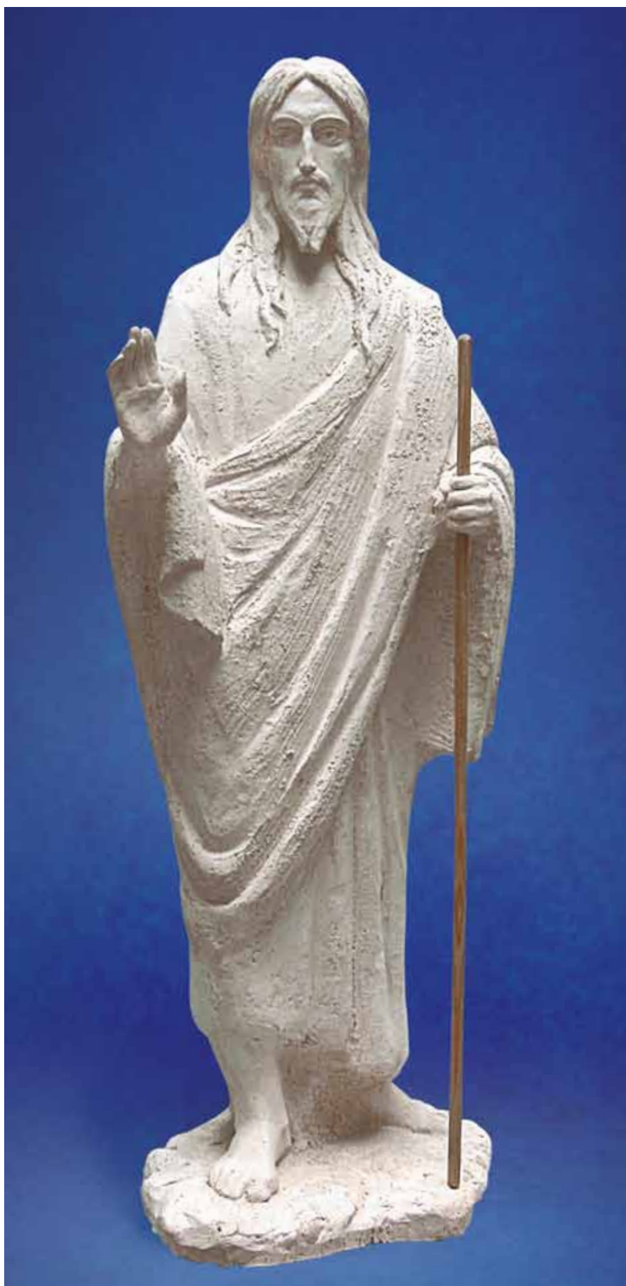
Великий Путник. 2004

Защитник Отечества воплощен в образе архистратига Михаила. Он – строгий