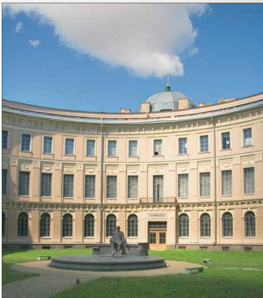
Внутренний Круглый двор здания Академии художеств с памятником И.И. Шувалову. Скульптор – президент РАХ З.К. Церетели

Последняя международная конференция «Академия художеств: вчера, сегодня, завтра», прошедшая в апреле 2006 года, была посвящена интереснейшим проблемам: истории, специфике преподавания и обзору нынешнего состояния высших художественных учебных заведений России, США, Италии, Франции. На коллоквиум прибыли специалисты из академии Св. Луки (Рим), Национальной Академии Дизайна из Нью-Йорка, из парижской Школы изящных искусств, Реймского