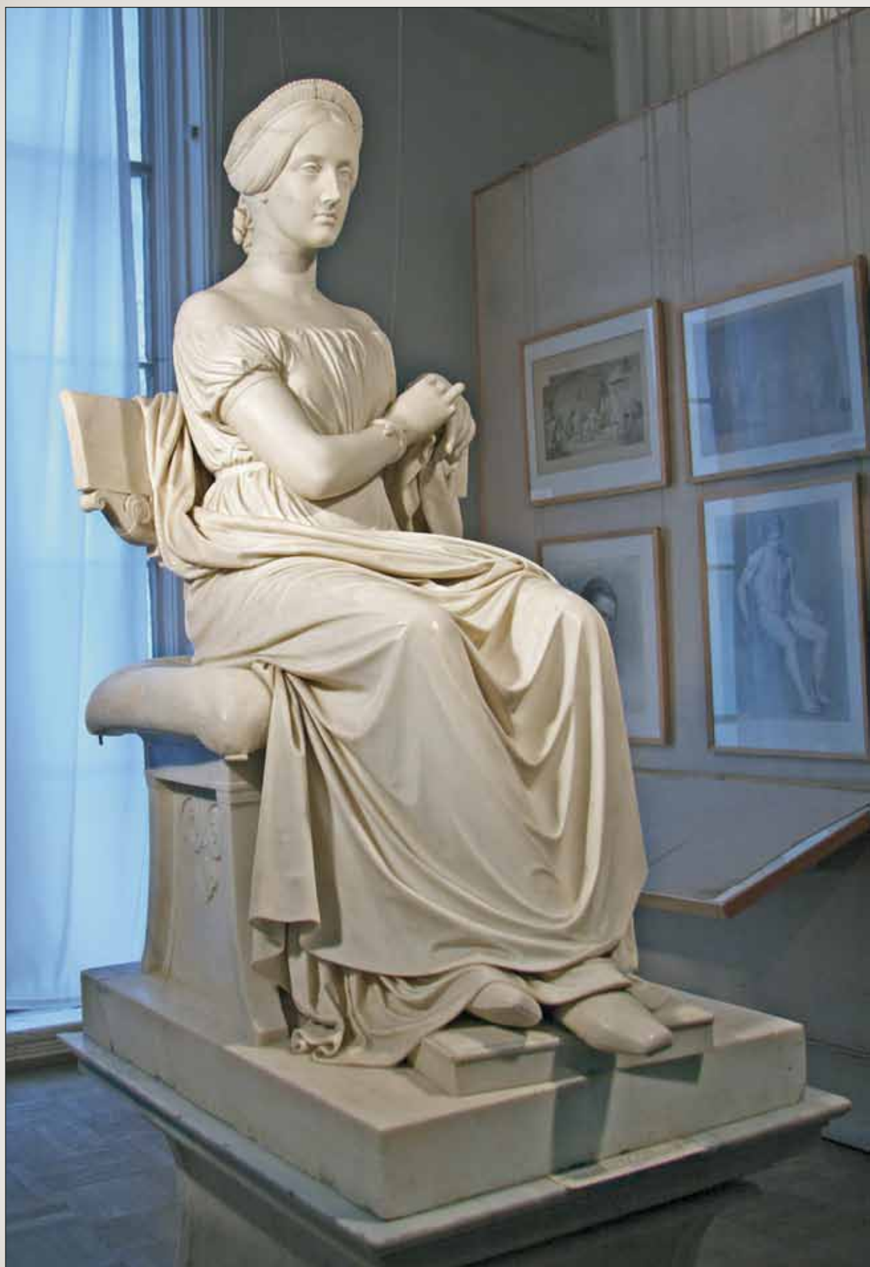
П. Тенерани. Великая княгиня Мария Николаевна. 1850