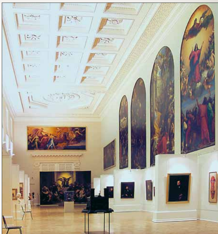
Тициановский зал. Современный вид

выпускниками во время усовершенствования за границей (так называемые «пенсионерские» работы). Исключительно интересны и листы, связанные с советской архитектурной школой.