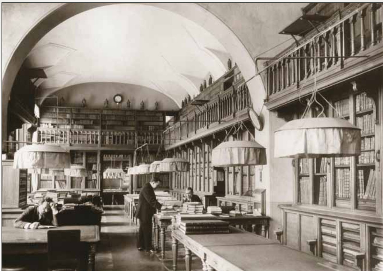
Библиотека Императорской Академии художеств. 1910.

куств Академия» была отделением Московского университета). Оригинал устава, выполненный на пергаменте и собственноручно подписанный монархиней, в настоящее время хранится в фондах. Он создавался группой художников и мастеров по эскизам и под руководством живописца Г.И. Козлова и является интереснейшим образцом искусства того времени. Текст Привилегии был оглашен на инаугурации Академии 7 июля 1765 года ее конференц-секретарем А.М. Салтыковым. Сама церемония посвящения с закладкой будущего каменного здания и освящение церкви происходили еще в старом деревянном строении, приспособленном под занятия учеников (три дома, располагавшиеся на набережной Невы между 3-й и 4-й линиями Васильевского острова, были объединены общим фасадом).