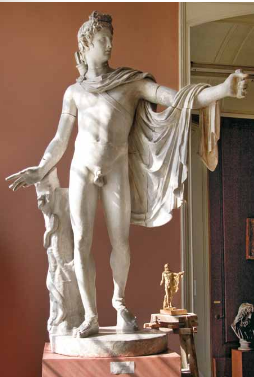
Леохар. Аполлон Бельведерский. IV в. до н. э. С мрамора. Гипс

Основание Музею скульптуры было положено поступлением античных образцов и слепков, приобретенных И.И. Шуваловым по распоряжению Екатерины II в Греции и Италии специально для Академии. Вместе с произведениями ваятелей Э.-М. Фальконэ, А.-М. Колло и даром автора «Медного всадника», включавшего копии с произведений европейской скульптуры XVII–XVIII столетий, они составили ядро коллекции. Вскоре Академия стала