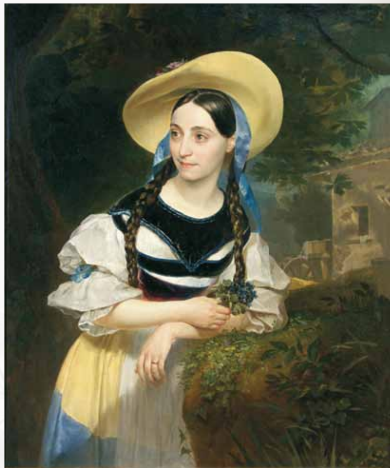
К.П. Брюллов. Портрет итальянской певицы Фанни Перезани. 1834

Для Музея Академии художеств тесная связь с учебным заведением и общее с ним руководство оказались губительны. Так как необходимость изучения наследия мастеров прошлого полностью от-