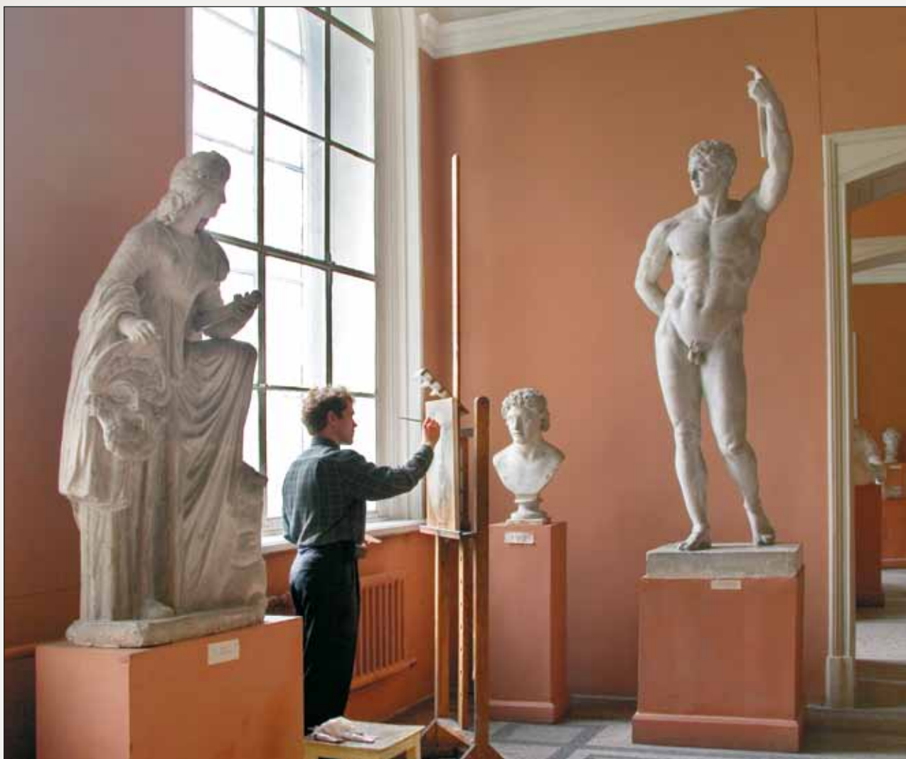
Отдел слепков с античной и западноевропейской скульптуры

дра III», «Академия художеств: история в фотографиях», «Путь к мастерству: европейское и русское искусство XV – начала XX вв.» призваны знакомить зрителей с разнообразием художественного собрания музея.