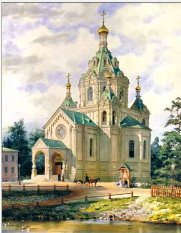
А.Н. Бенуа. Вид церкви Св. Николая Чудотворца на Выборгской стороне в Санкт-Петербурге (по проекту А.И. Кракау). 1881