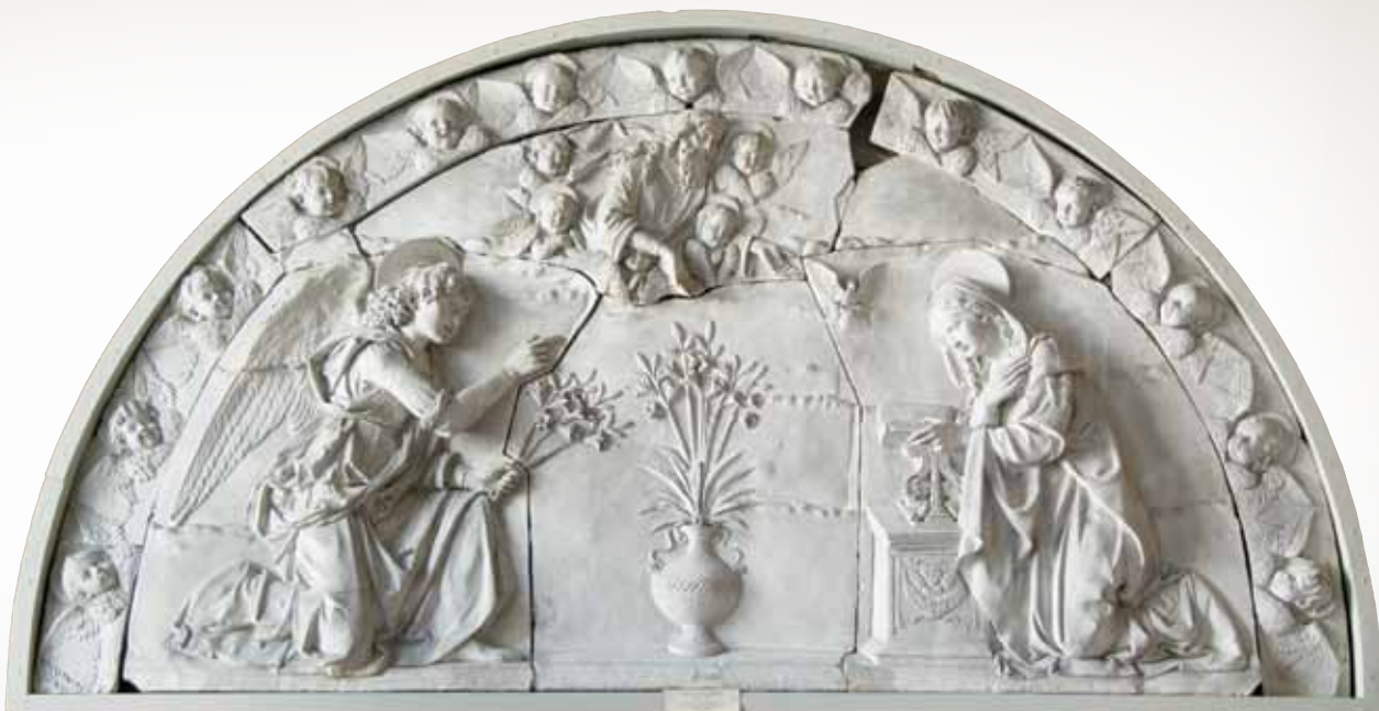
Андреа дела Роббиа. Благовещение. Рельеф церкви дельи Инноченцы во Флоренции. С майолики. Гипс