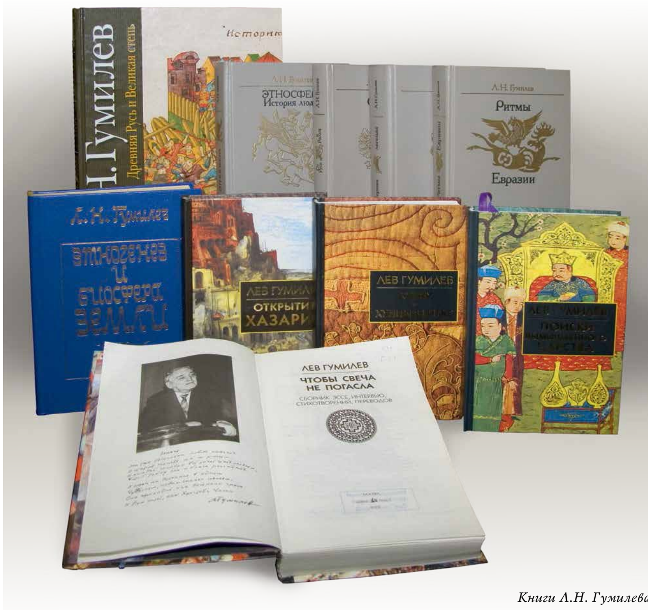
Книги Л.Н. Гумилева

торов. Исходным моментом такой концепции, ее первичным постулатом стало преодоление понимания исторического как надприродного. Иными словами, речь идет о создании практически новой философии истории . Можно с полным основанием утверждать, что Л.Н. Гумилев – прежде всего философ в самом высоком смысле, философ, поднявшийся на высшую ступень абстрактных обобщений богатейшего материала, накопленного конкретными гуманитарными науками – историей, этнологией, географией. Энциклопедические знания в различных областях, умение построить диалектическую систему, структурировать ее многочисленные элементы – это один из важнейших признаков творческого мышления великого ученого. Ко всему этому Лев Николаевич обладал незаурядным гражданским мужеством: далеко не каждый в те годы решился бы дополнить, изменить, а уж тем более выдвинуть альтернативу