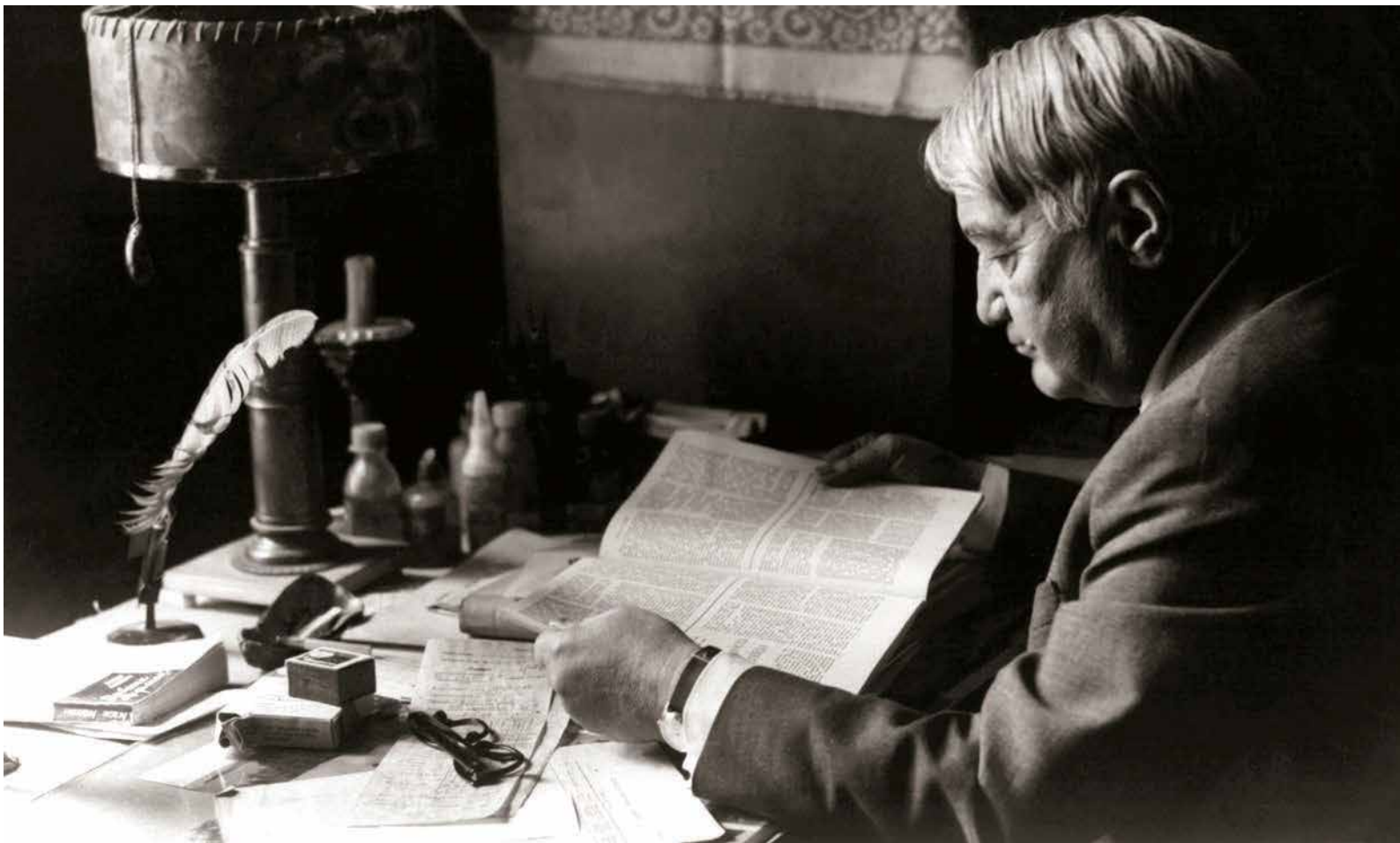
Л.Н. Гумилев за работой (Большая Московская улица). Конец 1970-х гг.

ментальное произведение, не приведено ни одного сколь-нибудь аргументированного возражения ни против теории этногенеза, ни против концепции пассионарности. Главное «обвинение»: Гумилев – евразиец, а потому недолюбливает Запад, не поддерживает версию официальной историографии о татаро-монгольском иге и т.п. Упоминания о славянской Руси вызывают у Янова приступы ненависти, особенно сильные, когда Гумилев ведет речь о том, что российский этнос находится в стадии подъема и за ним – будущее. По Янову, Гумилева можно назвать антисемитом за его исследования (?) Хазарии и фашистом за его приверженность евразийству. Почему Янов, сделавший блестящую академическую карьеру в США, преуспевший в критике своей страны и своего народа, не может (не хочет?) понять Гумилева или хотя бы соблюсти видимость объективности в отношении наследия Гумилева, в общем-то понятно. Думается, в отличие от Льва Николаевича Гумилева, считавшего себя счастливым человеком,