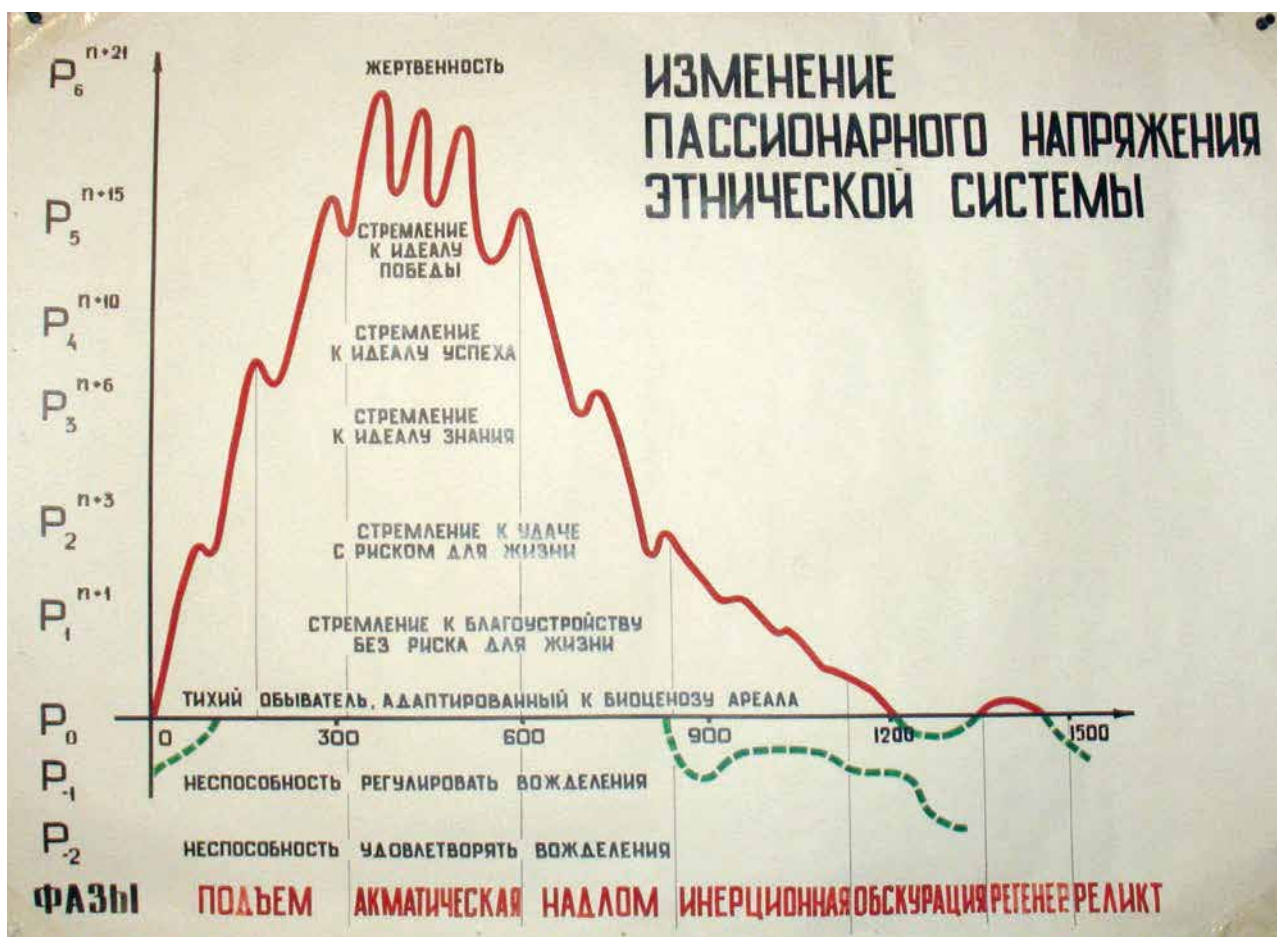
График, объясняющий суть пассионарной теории Л.Н. Гумилева, который он использовал для наглядности во время своих лекций и докладов

торой надо жертвовать собой, не может иметь в своем основании своекорыстия — как в чисто эгоистическом значении, так и в значении рациональном — эгоизма и своекорыстия семьи, ближайшего окружения.