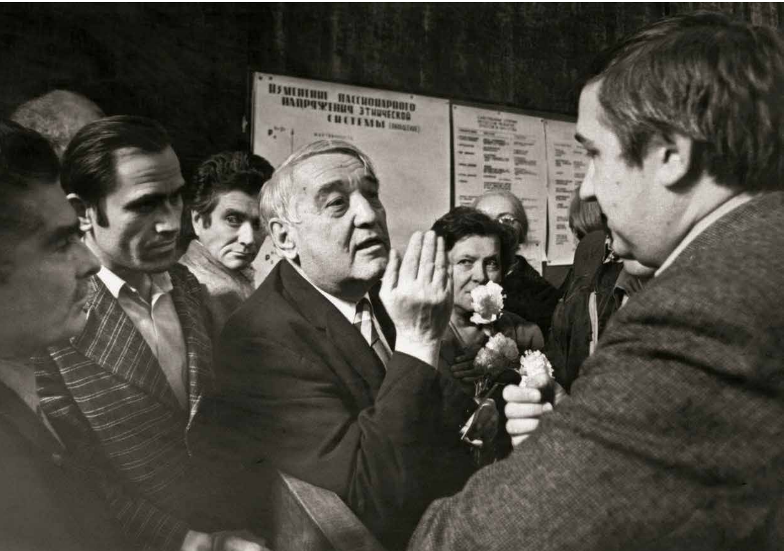
Живое общение после доклада. Конец 1970-х гг.