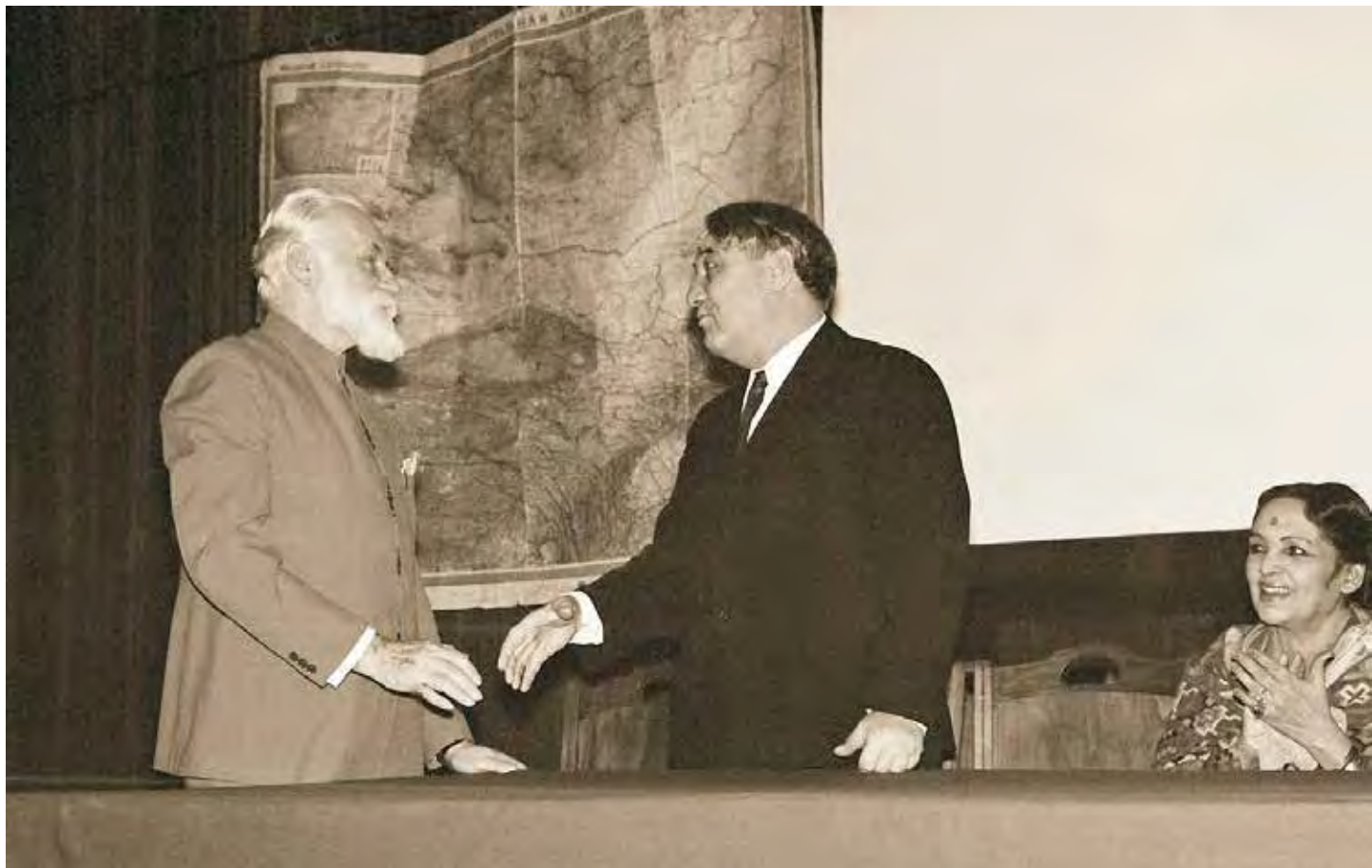
С.Н. Рерих, Л.Н. Гумилев, Девика Рани-Рерих. Всесоюзное Географическое общество. Ленинград, 21 января 1975 г.

это прежде всего социальный однолинейный процесс, стержнем которого является материальное производство и поэтапное восхождение от одной общественно-экономической формации к другой.