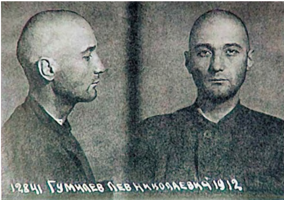
Арестованный Лев Гумилев. 1938

трибуналу потребовалось пятьдесят минут, чтобы вынести приговор: 10 лет лагерей и 4 года поражения в правах с конфискацией имущества. Союзная прокуратура опротестовала уголовное дело Льва Николаевича: приговор был «за мягкостью» отменен, дело было направлено на переследствие. По воспоминаниям самого Гумилева, в силу царившей тогда всеобщей неразберихи и бе-