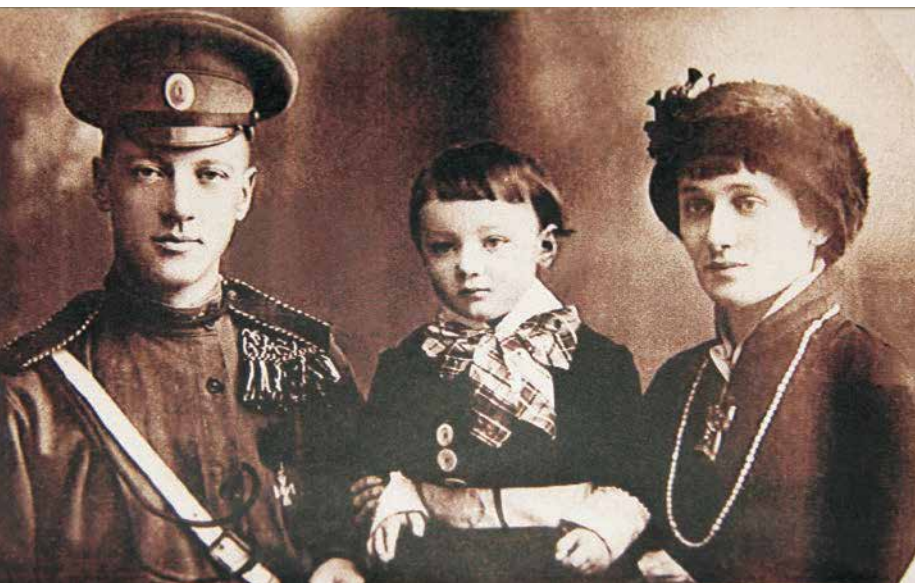
Н.С. Гумилев и А.А. Ахматова с сыном Левой. 1914–1915

поступить на курсы немецкого языка, готовившие в Герценовский институт, но из-за дворянского происхождения принят не был. С этого времени начались его полуголодные мытарства без работы и практически без жилья (Пунин, тогдашний морганатический муж Анны Андреевны, требовал, чтобы Лева уехал обратно в Бежецк, «где было делать нечего и учиться нечему и работать негде», и ему пришлось переехать к знакомым). Проработав полгода в трамвайном депо, он обратился на биржу труда, где ему предложили место младшего коллектора в геологоразведочном институте. Геология была наукой не его профиля, но зато он получил возможность поехать в Сибирь, на Байкал, где участвовал в экспедиции. Много позже Л.Н. Гумилев напишет: «...месяцы эти, которые я там провел, были для меня очень счастливыми, и я увлекся полевой работой» 4 . Потом его устроили в гельминтологическую экспедицию в Таджикистан, откуда он был выгнан за то, что «пощадил жабу... и