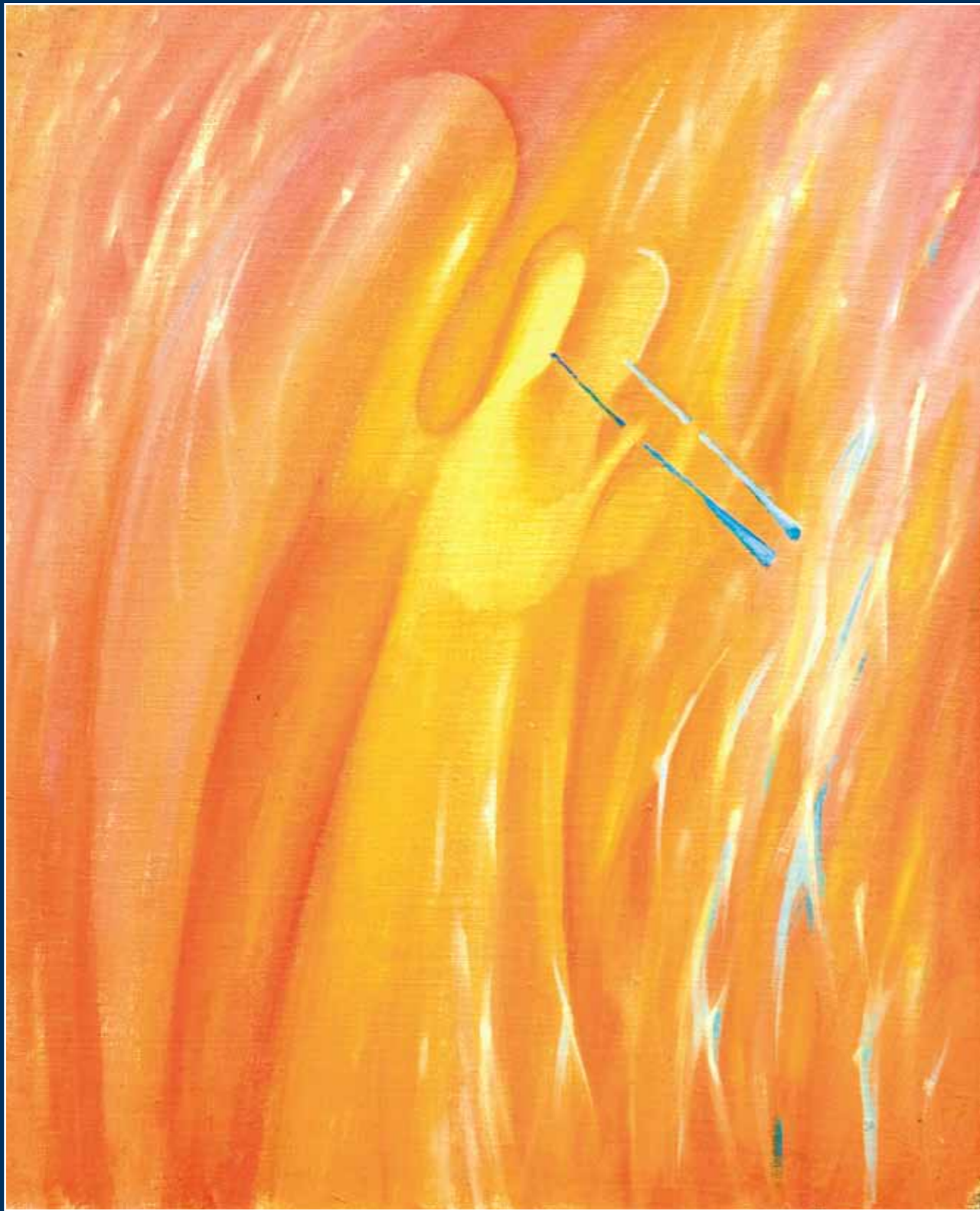
Музыка, рождающая новые миры. 2006