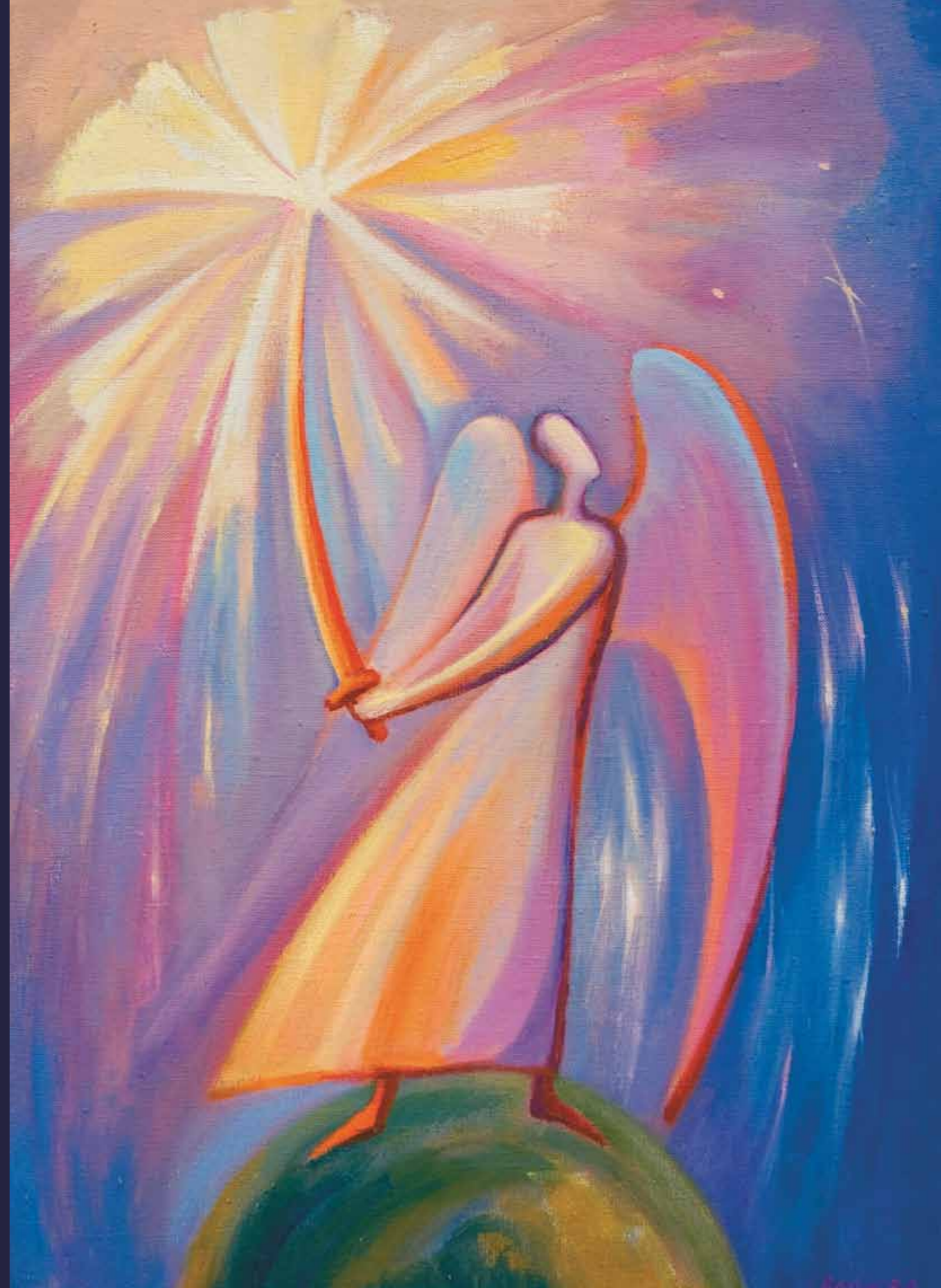
Ангел с мечом, рассекающий тьму. 2006 ▶