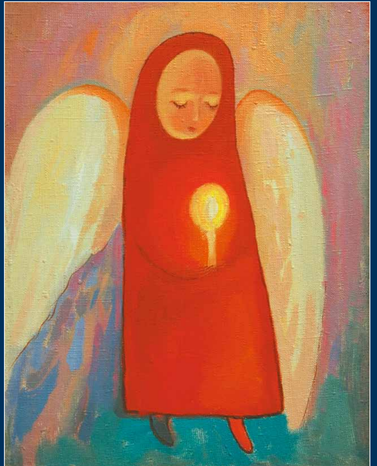
Несущая свет. 2006