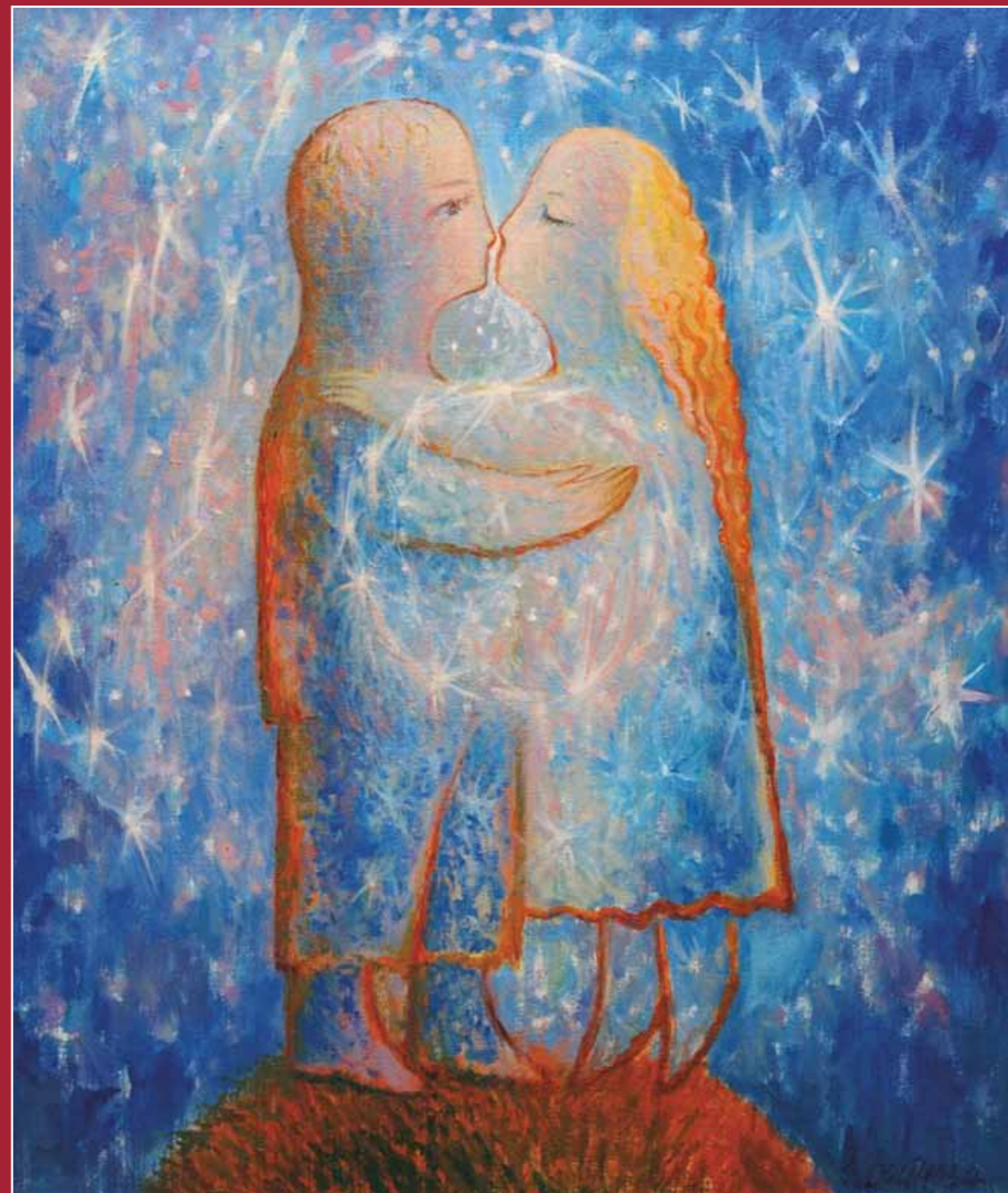
Танец со звездами. 2005