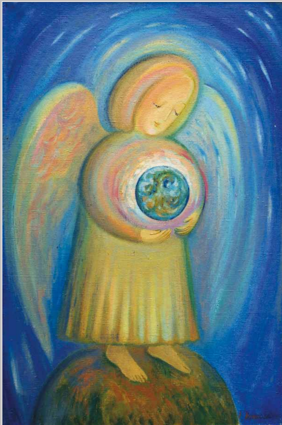
Хранитель планеты. Ангел любит Землю. 2006