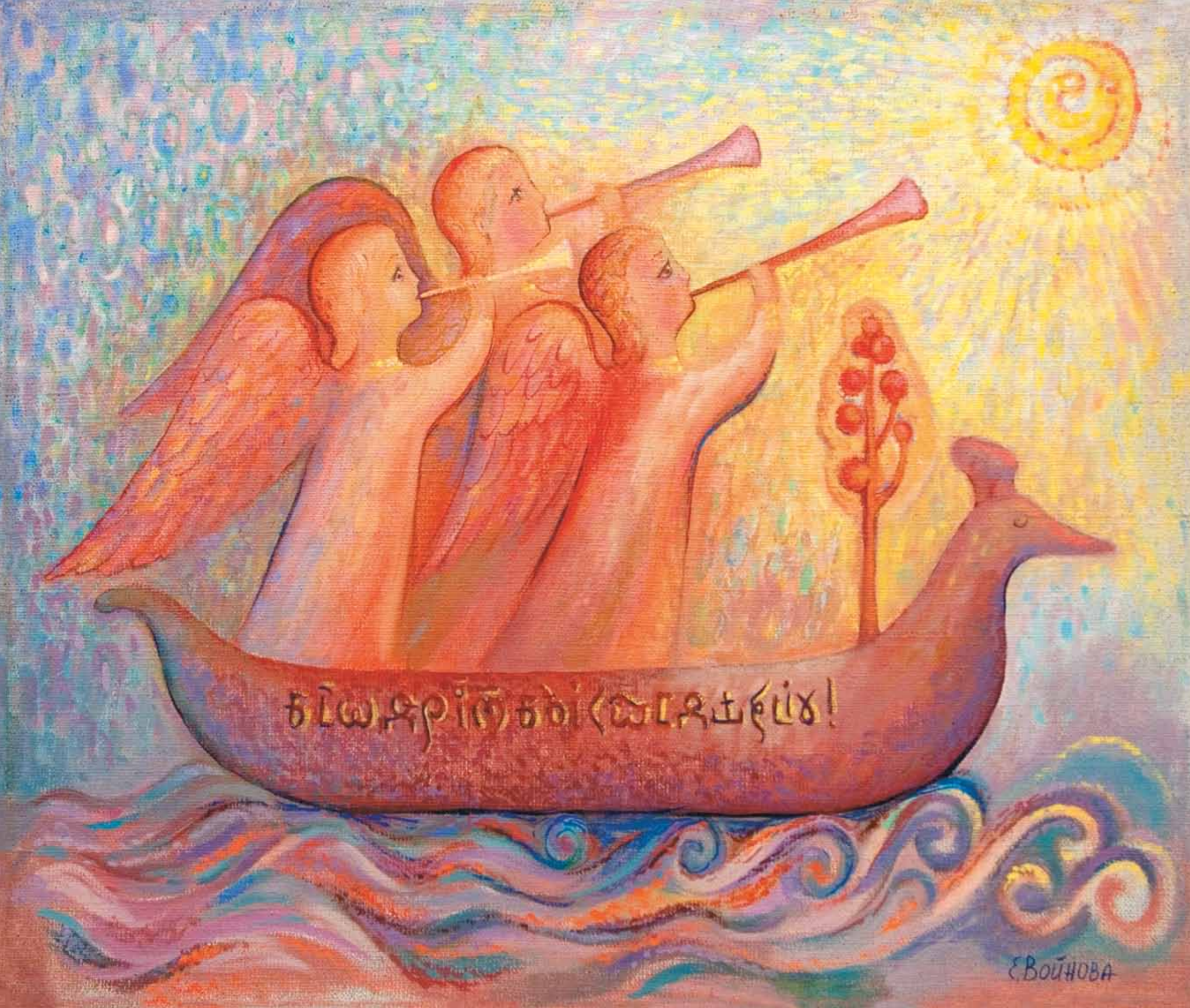
Ангелы трубят. 2004