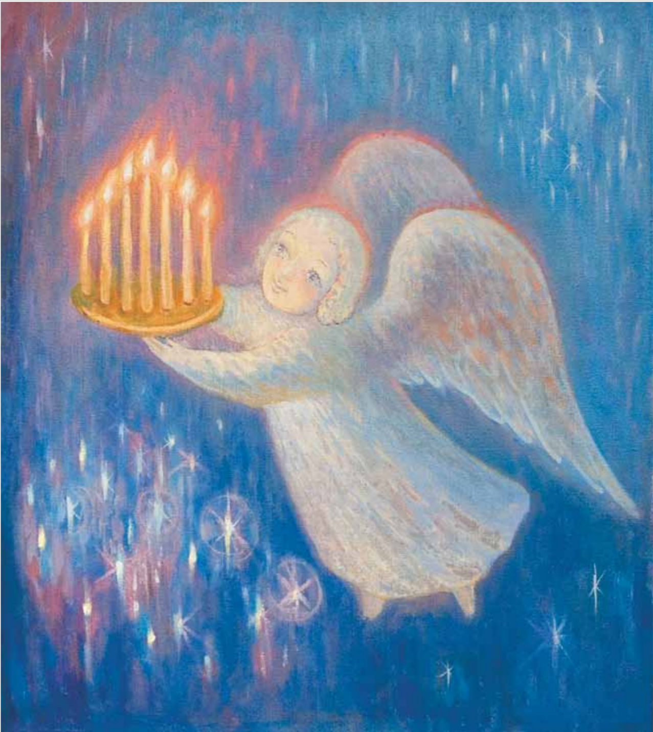
Несущий свет. 2005