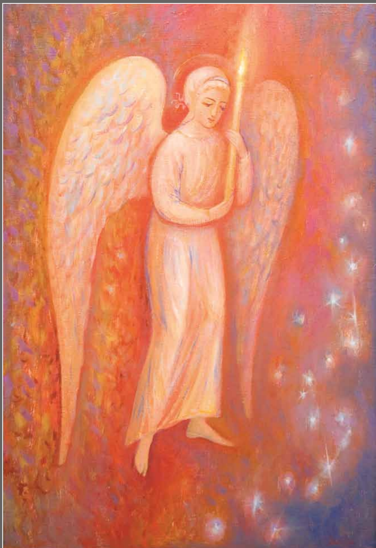
Ангел, несущий свечу. Полтава. 2006