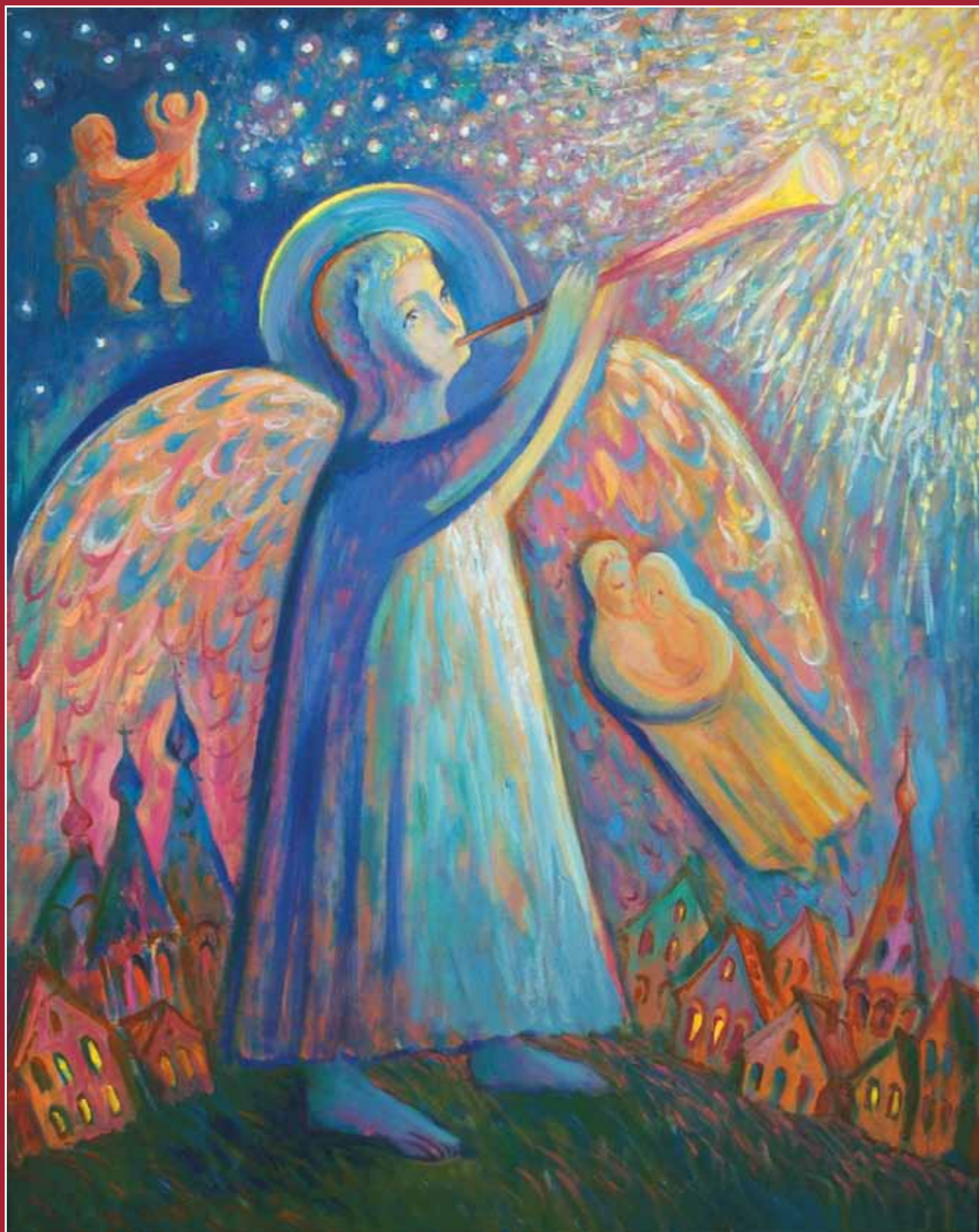
Ангел над городом. 2005