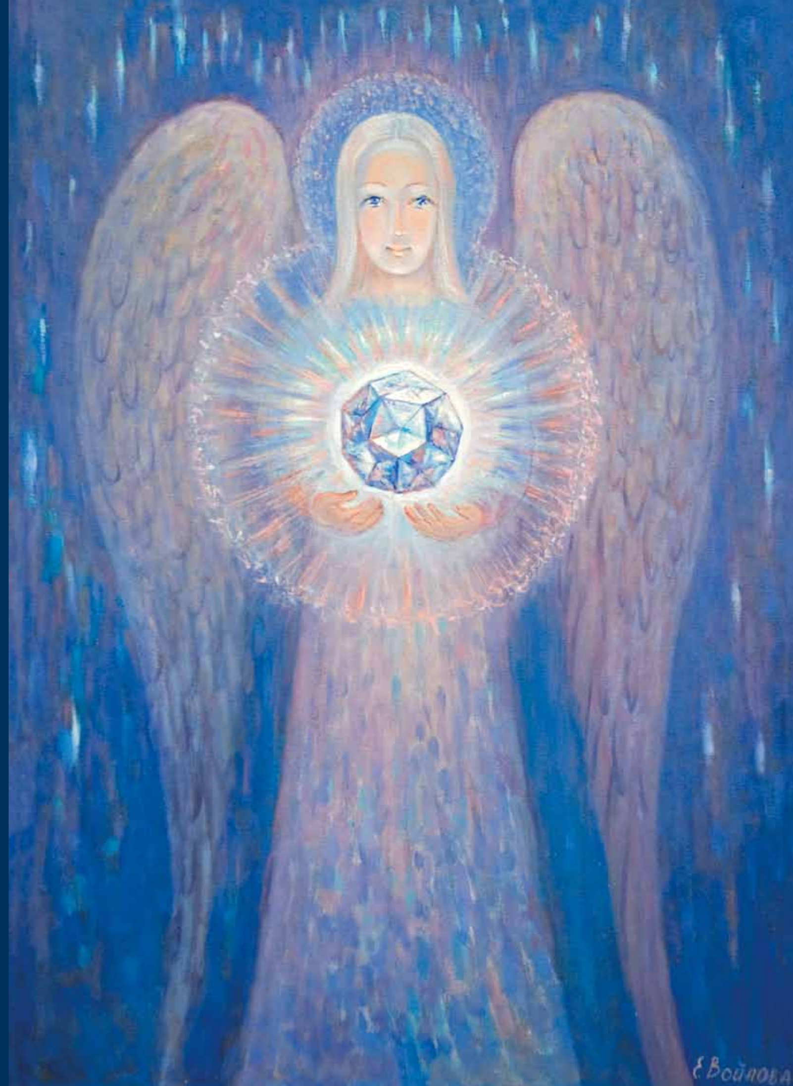
Ангел с кристаллом. 2004 ▶