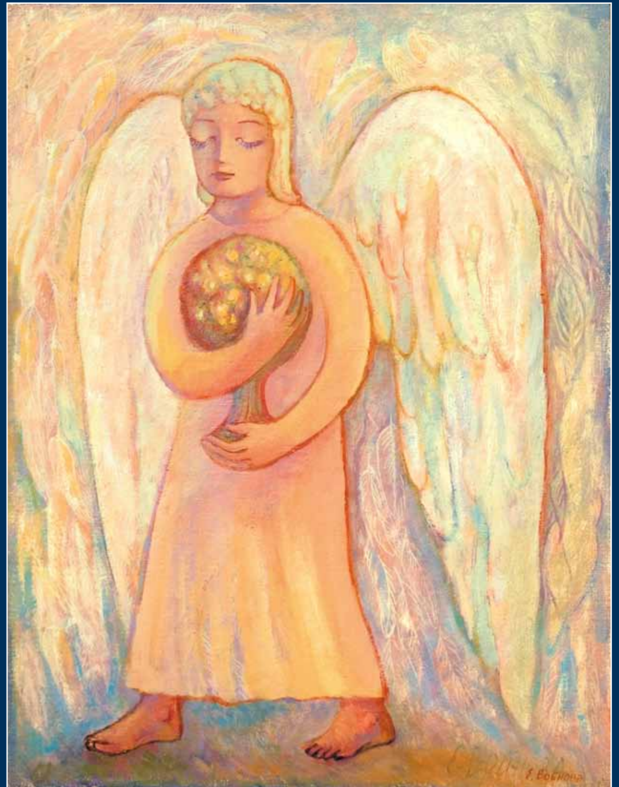
Несущий древо. 2006