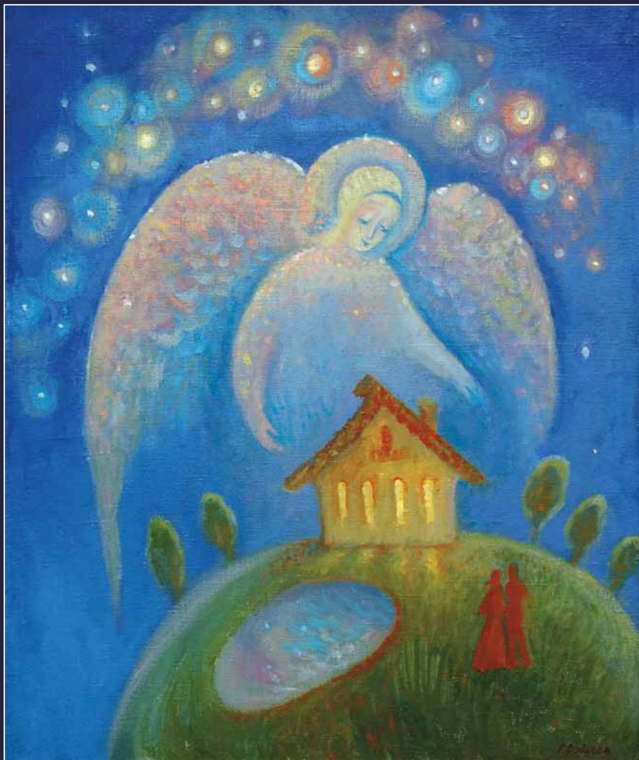
Ангел-хранитель. Карабиха, 2006