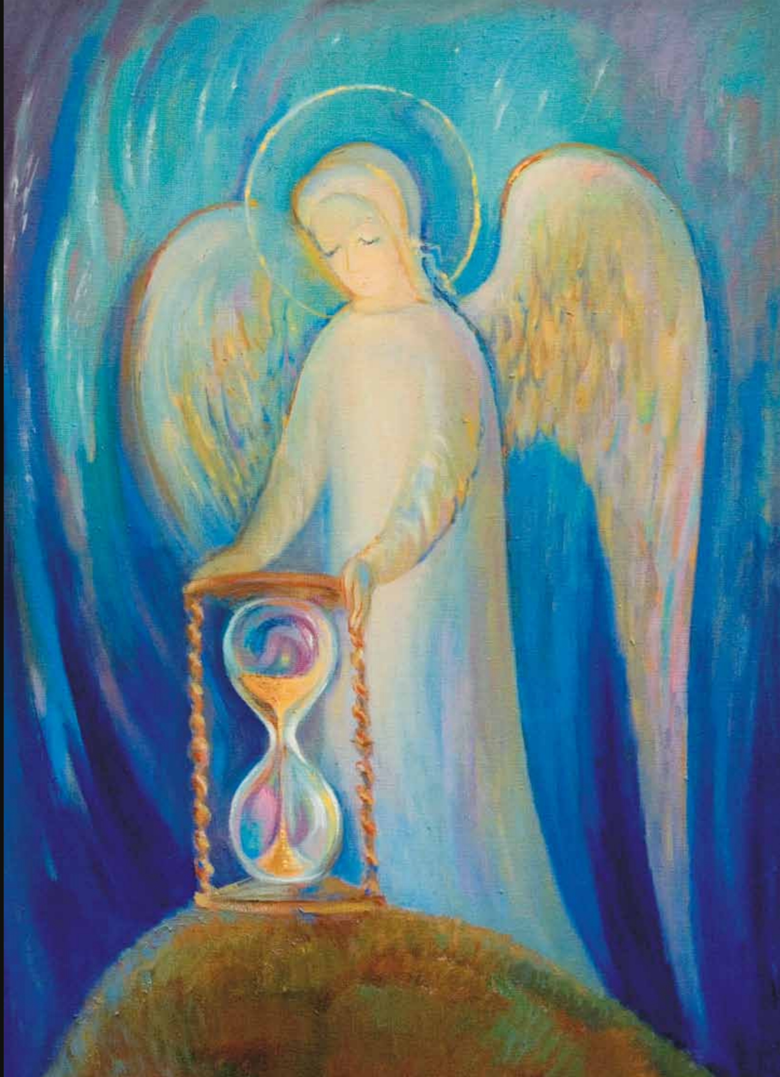
Время ангелов. 2004 ▶