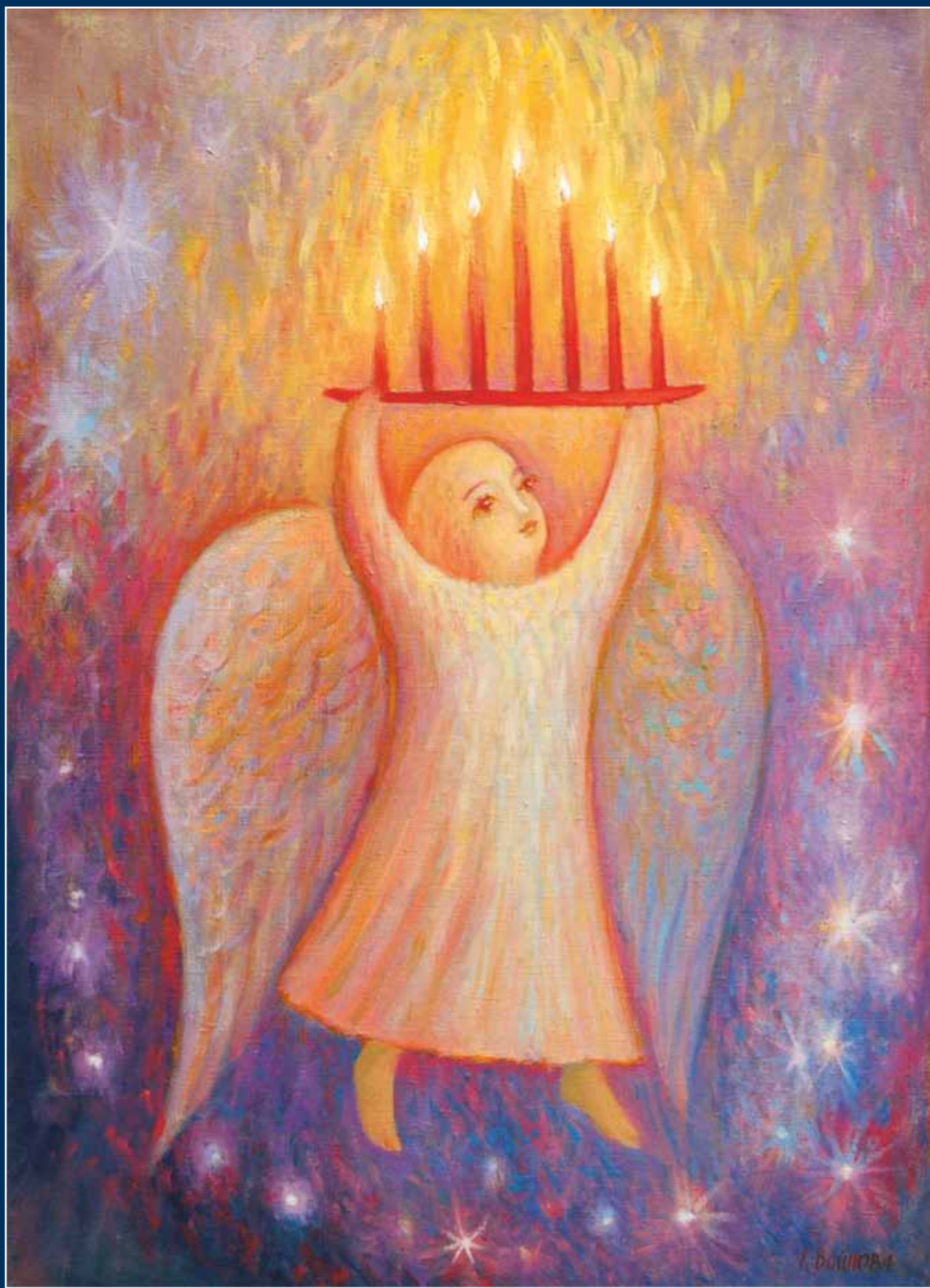
Ангел с семисвечником. 2007