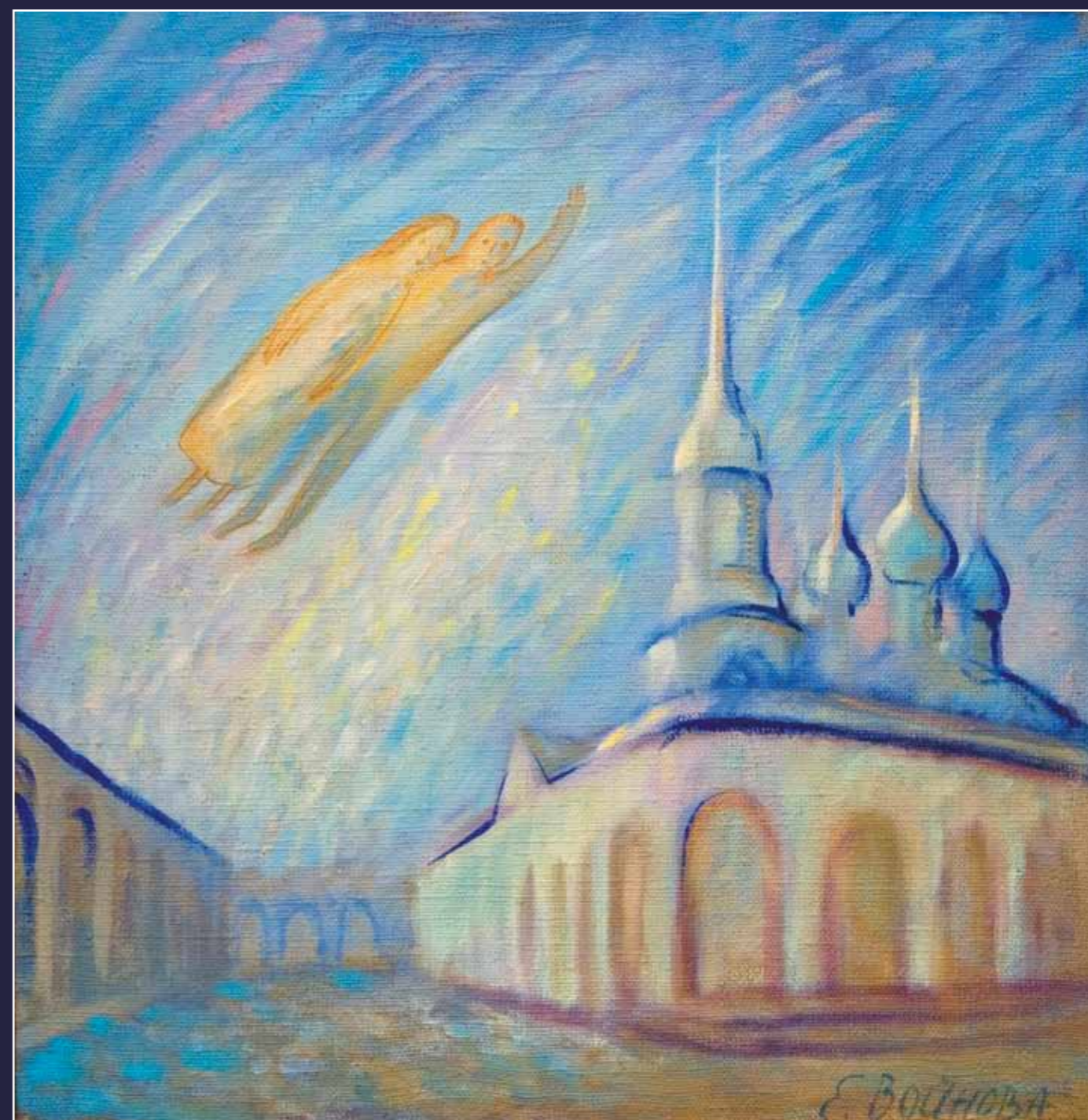
Над Костромой. 2003