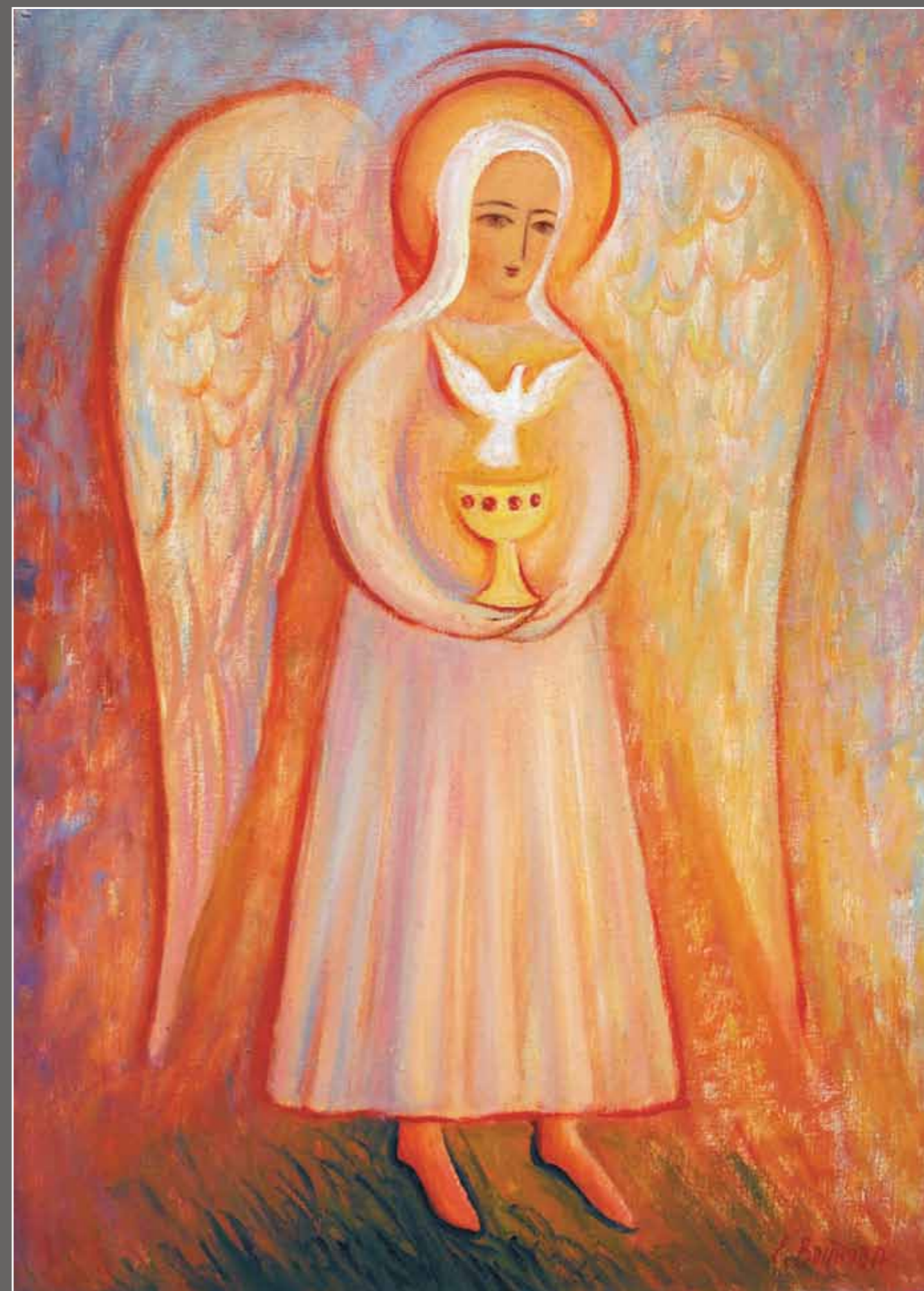
Дары дарящая. 2006