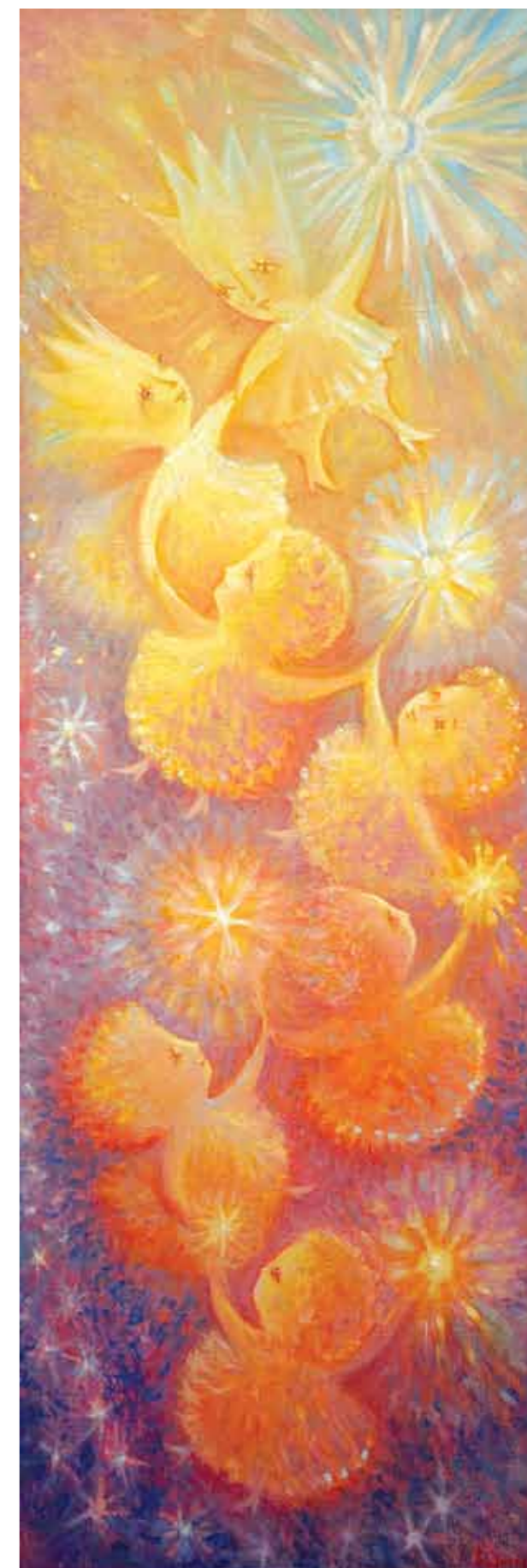
Звезды. Возвращение домой. 2007