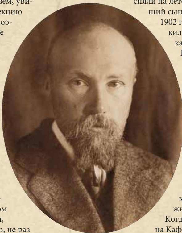
Н.К. Рерих. 1916

В очерке «Березки» описано еще одно место Тверского края, связанное с именем Рерихов. Се-