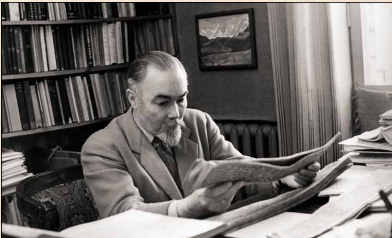
Ю.Н. Рерих в своем рабочем кабинете. Москва, конец 1950-х гг.

английского ученого А. Стейна и японского ученого К. Отани – каждый из них внес свой вклад в исследование памятников Восточного Туркестана.