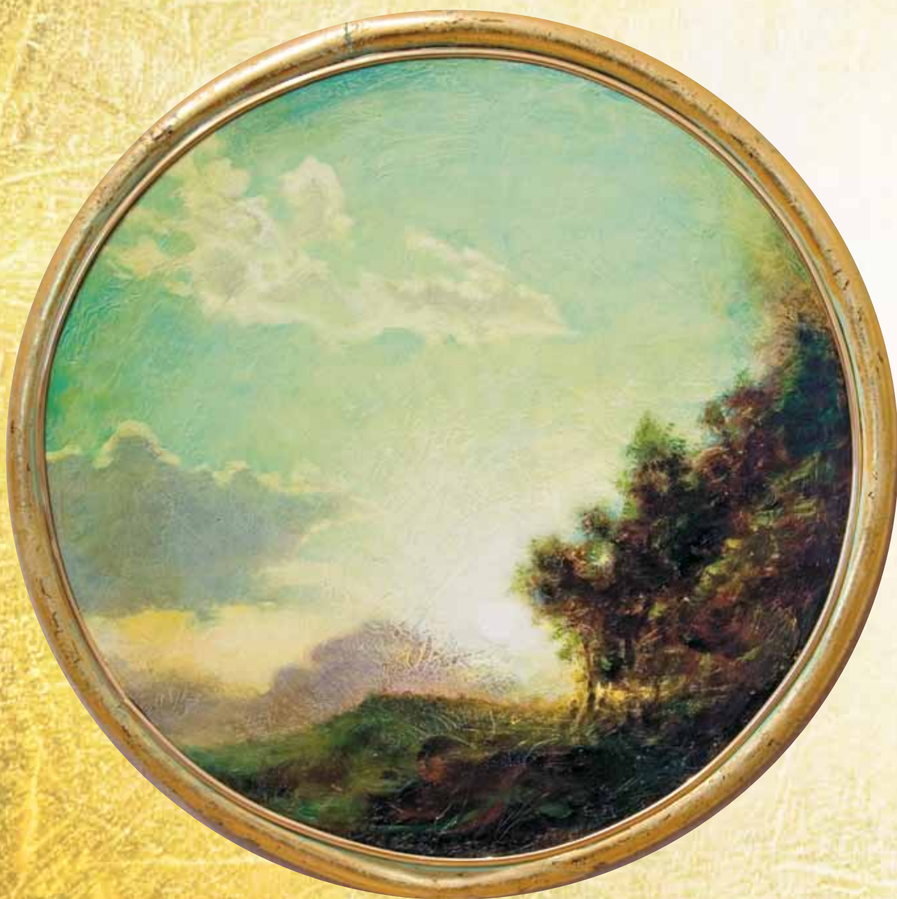
Из серии «Море и горы». 2006

к традиционному пейзажу, и тогда, в сравнении, сияющая вспышка в центре полотна обретает еще большую внутреннюю выразительность, притягательную для зрительского взгляда. Такая композиционная динамика придает изображению стереоскопическую объемность – оно то устремляется внутрь, то выплескивается с холста наружу. Его тоновая палитра эстетически беспроектна, и все вместе поставлено на службу идейной концепции художника: энергия света – главная, формообразующая компонента Пространства. Прозрачность воздуха и обрывки утреннего тумана, хрустальная плотность воды и твердыня горного склона – все возникает из белого чистого огня, все четыре стихии сосуществуют на полотне, пронизанные пятой – вселенским эфиром, вдыхающим в здешнее