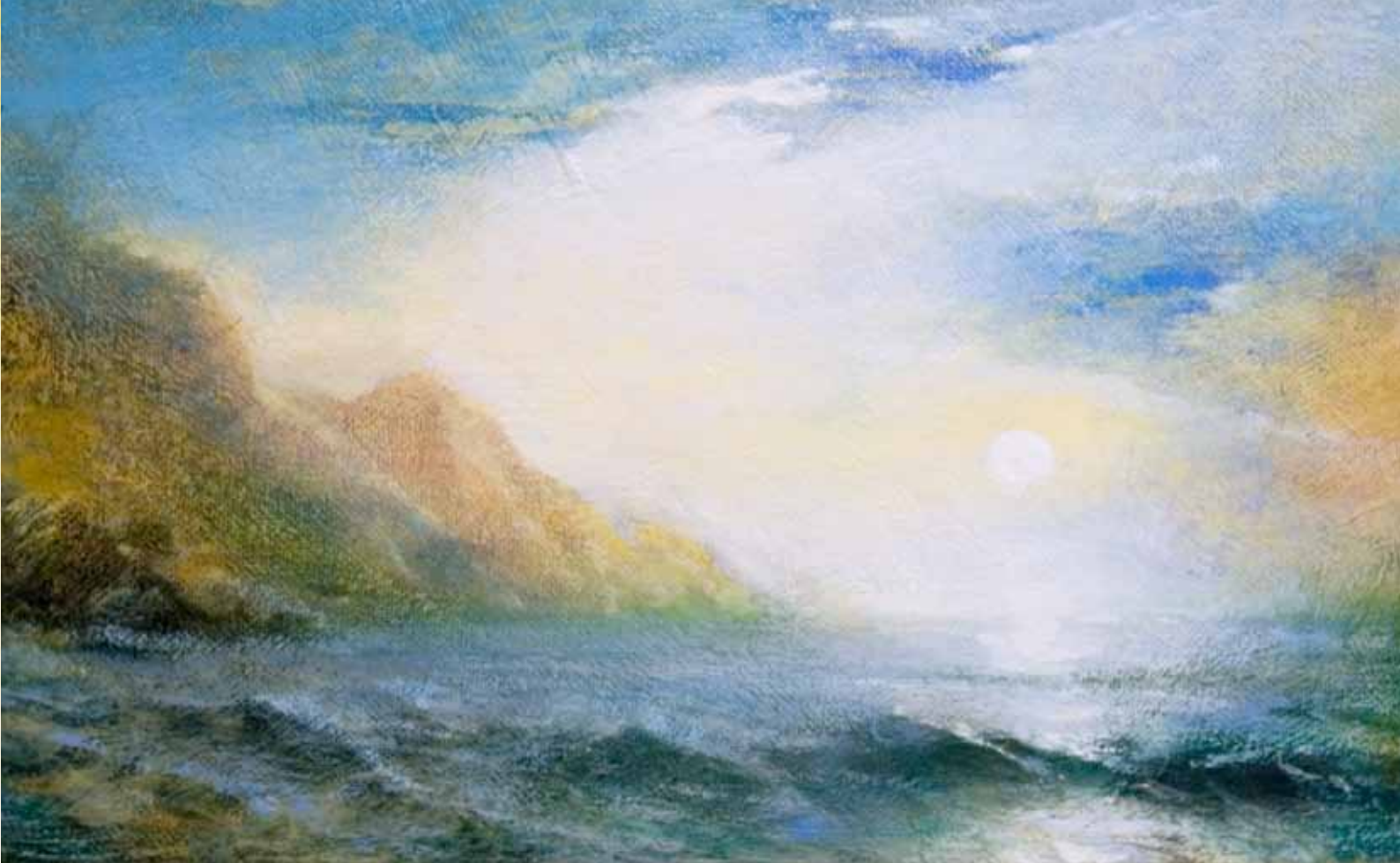
Восход. Из серии «Море и горы». 2006

бытие Божественную энергию жизни. В созерцательный процесс включаются все пять чувств: к зрительному впечатлению добавляется запах утреннего моря, влажность воздуха, жар светила, который Лак Буни однажды написал в красках, – он так и назвал картину – «Восход».