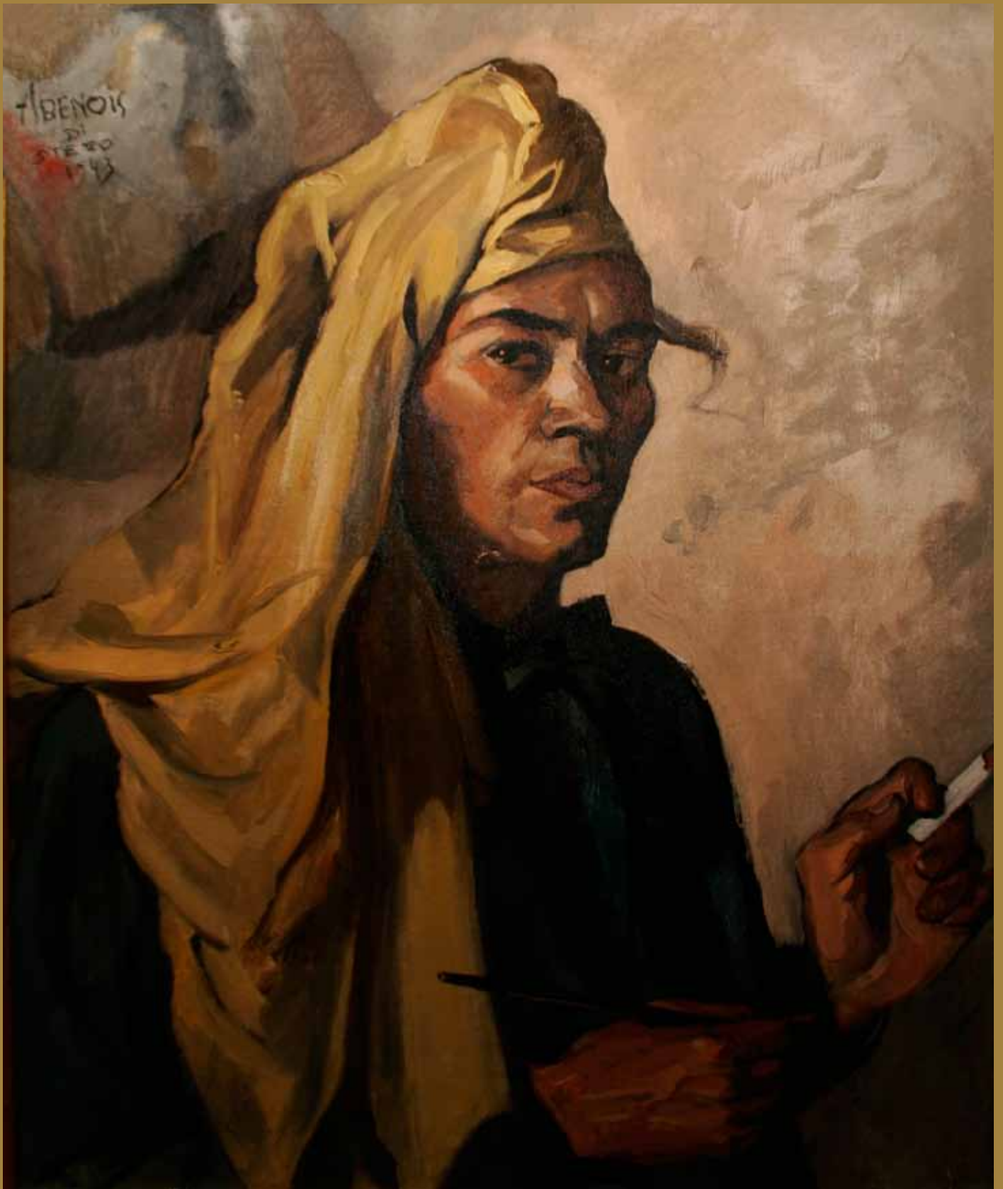
Александр Бенуа ди Стетто. Автопортрет. 1943