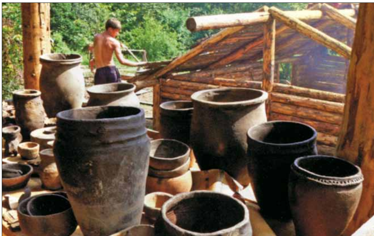
Гончарная мастерская для проведения занятий с детьми. Государственный мемориальный и природный заповедник «Музей-усадьба А.Н. Толстого “Ясная Поляна”»