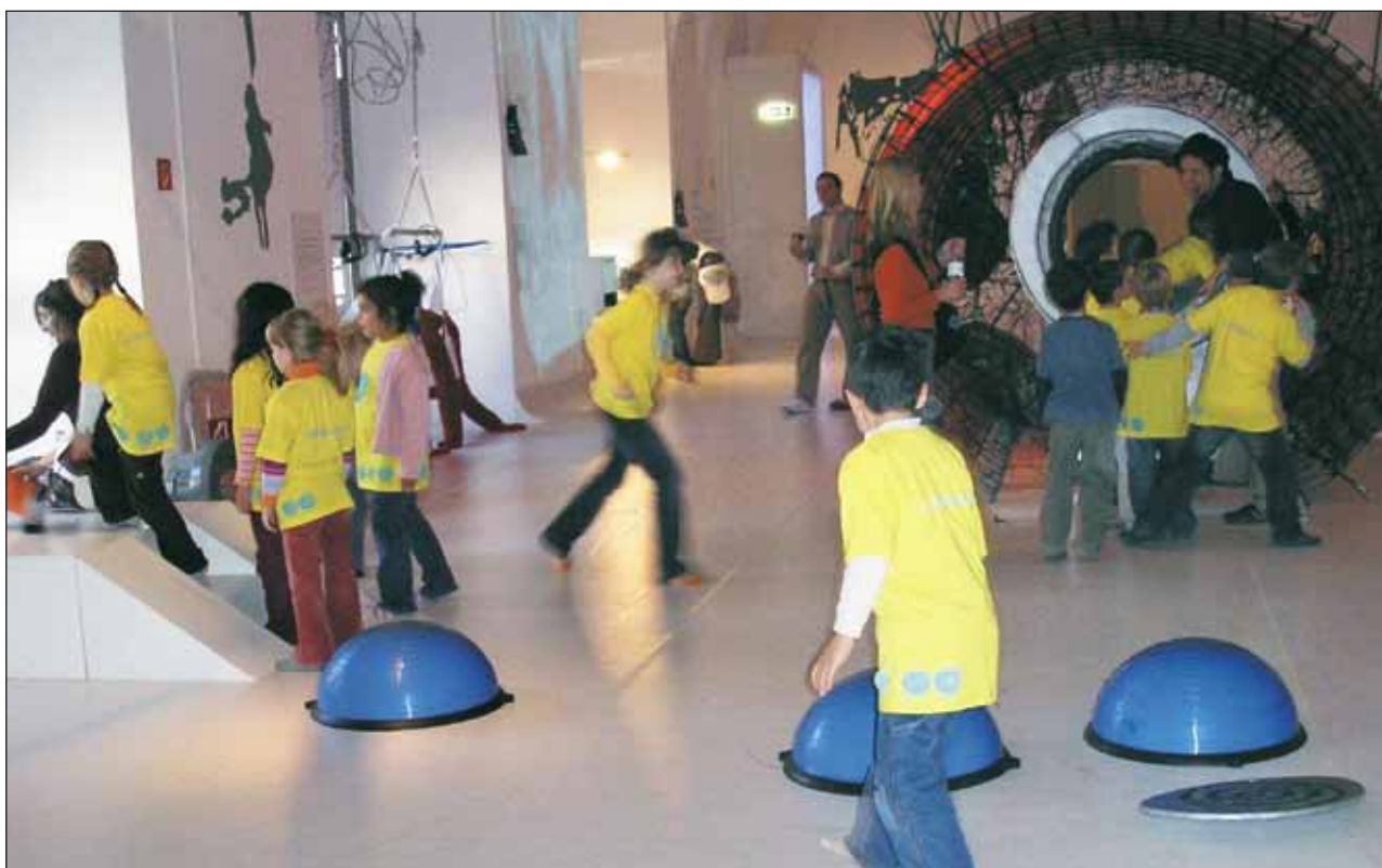
Интерактивная выставка, посвященная космосу в детском музее. Вена, Австрия

турно-образовательный, художественно-образовательный и др. В Мюнхене создан музейно-педагогический центр, который работает для всех школ города, а в Карелии – республиканский детский музейный центр (РДМЦ), аккумулирующий всю культурно-образовательную работу со школами республики 23 .