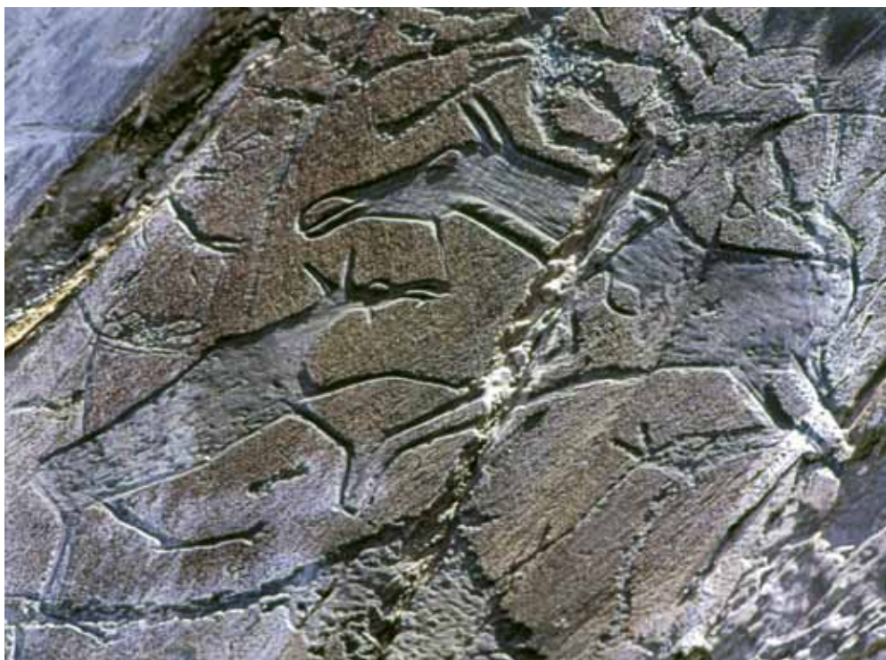
Древнее святилище, памятник неолитического искусства. Государственный историко-культурный и природный музей-заповедник «Томская писаница»