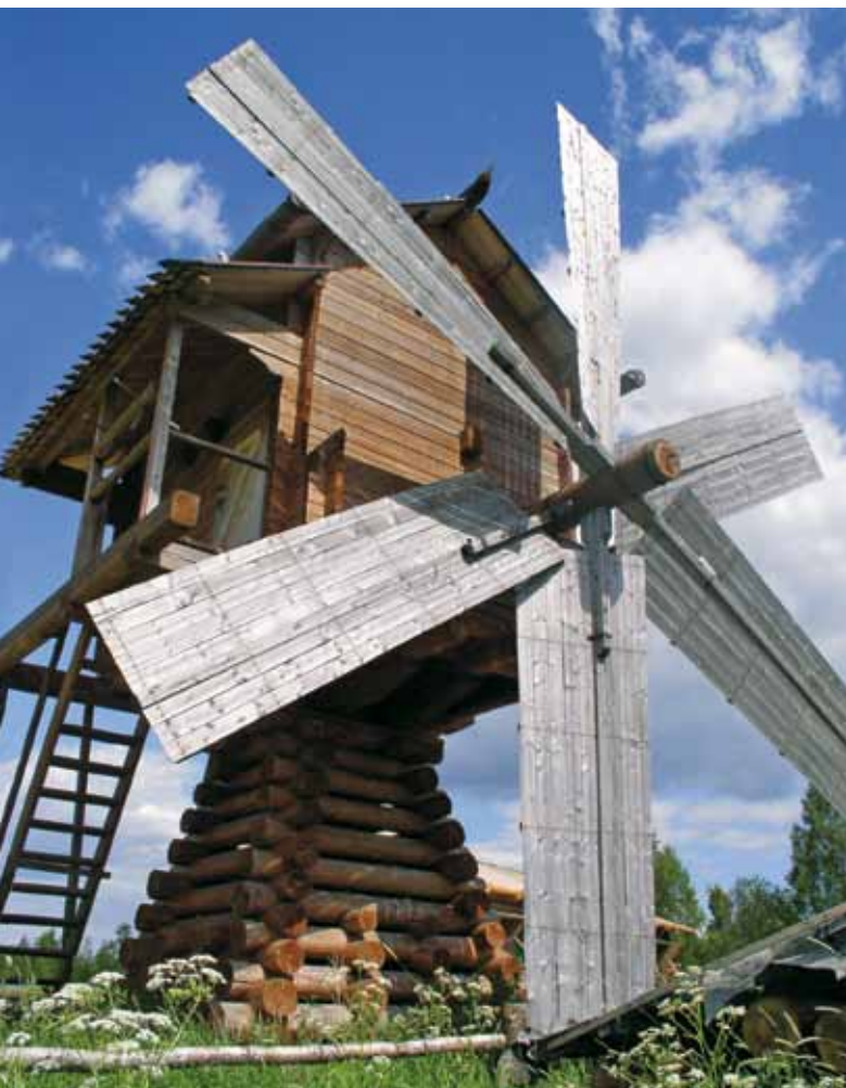
Мельница (XIX в.) – памятник северорусского деревянного зодчества

планы ООН 1 . На конференции был принят план действий: в разработанных ею документах определены главные направления культурной политики, которая проецируется на отдельные страны, – поддержка творчества и различных форм участия в культурной жизни, сохранение культурного наследия, развитие культурного и языкового плюрализма, рост финансирования на развитие культуры. Таким образом, на конференции был рассмотрен спектр вопросов, определяющих главные задачи развития культуры в XXI веке. И все эти направления культуры находят воплощение в музейной деятельности.