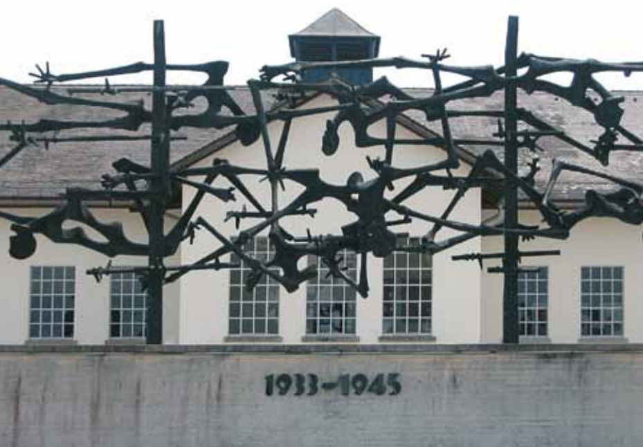
Один из первых музеев в память жертв государственных преступлений. Дахау, Германия

евед Ж. Ривьер. В настоящее время существуют разные модификации экомузеев в Японии, Канаде, Великобритания, Франции. В России они создаются в Красноярском крае, Кемеровской области, на территории проживания хантов и ненцев. Обращая взгляд в прошлое, видим, что Минусинский краеведческий музей (Красноярский край), открытый почти 130 лет назад замечательным музейным деятелем Н.М. Мартьяновым, именем которого он назван, по существу, был первым экомузеем не толь-