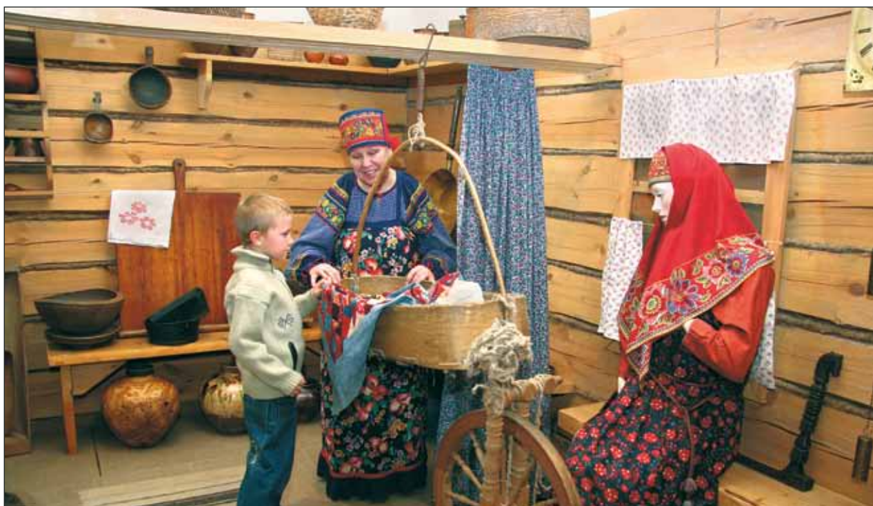
Детский музейный центр. Государственный Владимиро-Суздальский историко-архитектурный музей-заповедник