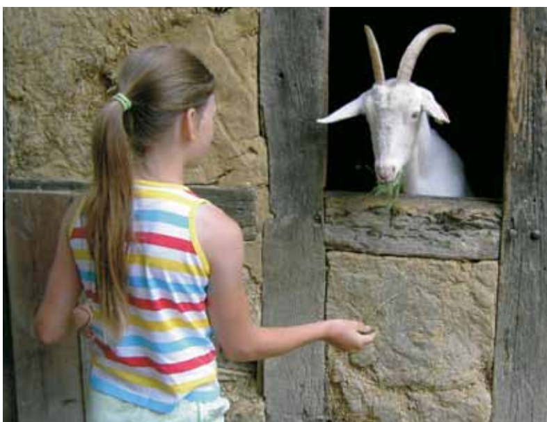
Живая коза – тоже экспонат. Экомузей. Эльзас, Франция

Интерактивная методика – одна из определяющих в деятельности детского музея. Несмотря на ряд проблем в организации отечественных детских музеев (например, не определен их юридический статус, стандарты), их количество в России увеличивается. В развитии детского музейного движения России отмечены разные модификации – детские центры, отделы, выставки и реже – детские музеи.