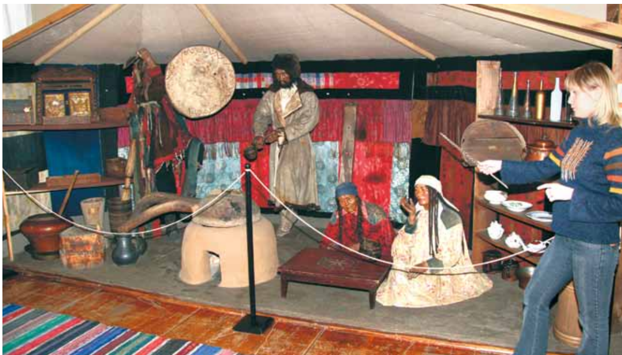
Минусинский региональный краеведческий музей имени Н.М. Мартьянова. Красноярский край

Ж. Ривьер полагает, что экомузей – это зеркало, в котором люди видят себя, своих предков, близких, свою территорию; лаборатория, изучающая прошлое и настоящее местного населения; заповедник, охраняющий и изучающий местную природу и культурное своеобразие края; школа, вовлекающая местных жителей в деятельность по изучению, охране, популяризации культур-