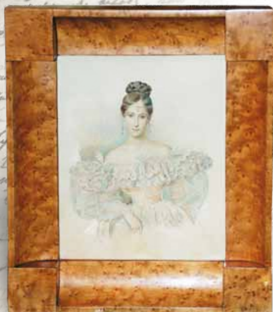
А.П. Брюллов. Н.Н. Пушкина. Акварель. 1831–1832 гг. Копия выполнена П.Д. Коринным

ездки на Кавказ – «Путешествие в Арзрум во время похода 1829 года». Начинается последний период его короткой жизни, время, которое обозначают словами «поздний Пушкин». Уголок, посвященный арзрумскому периоду, невелик, но ве-