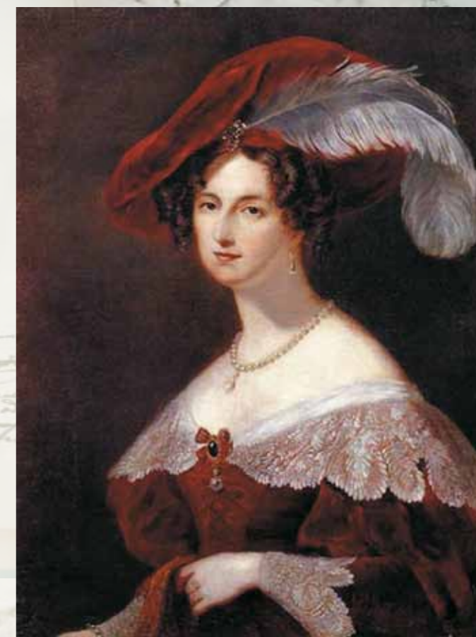
Дж. Хейтер. Портрет графини Е.К. Воронцовой. Масло. 1832