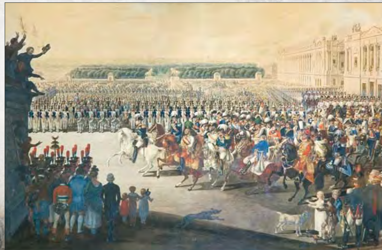
А. Малек. Вступление союзных войск в Париж. Акварель. 1815

Первый музейный зал, «Пролог», посвящен XVIII веку. Несмотря на то что Пушкин прожил в XVIII столетии всего 19 месяцев, он «так знал, так чувствовал время отцов и дедов, – справедливо замечает Натан Эйдельман, – что может считаться их «почетным современником», незримым председателем» 10 . На стенах – портреты российских самодержцев, государственных деятелей, философов, поэтов, полководцев екатерининского времени.