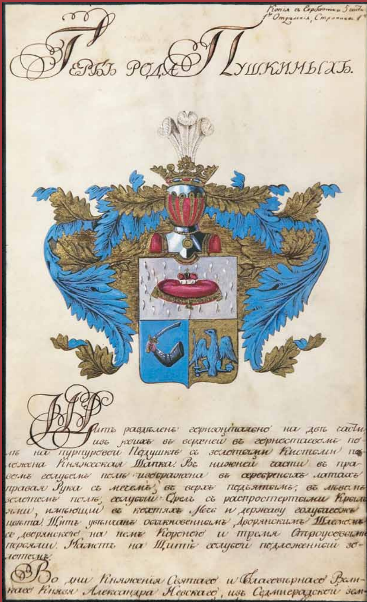
Герб рода Пушкиных. Воспроизводится по изданию: Общій гербовик дворянских родов Всероссийской империи. СПб, 1800