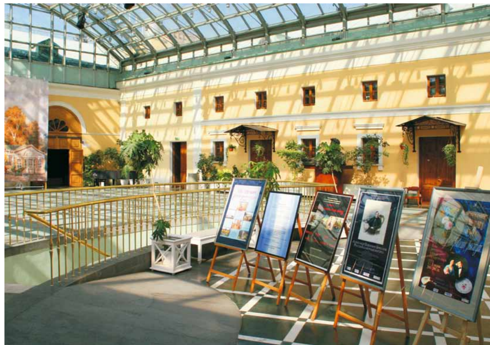
Атриум Музея ▶