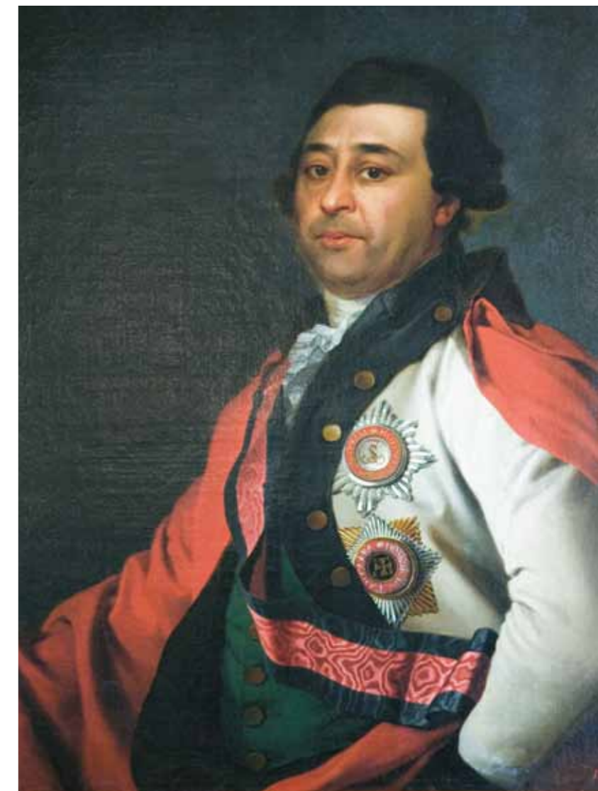
Неизвестный художник школы Д.Г. Левицкого. Портрет И.А. Ганнибала. Масло. Конец XVIII в.

Вот портреты родителей – Сергея Львовича и Надежды Осиповны Пушкиных. Привлекает внимание портрет смуглого черноволосого мужчины в адмиральской форме. Это двоюродный дед Пушкина Иван Абрамович Ганнибал, участник Наварринского морского сражения с турками 1770 года. Его имя наравне с именами других славных сынов Отечества было выбито на колонне в Царском Селе. Маленький Саша восхищался его подвигами – о них напоминает модель корабля «Гром», с борта которого Ганнибал когда-то руководил сражением при Чесме. В соседней комнате на столе карельской березы – любимые книги Пушкина-ребенка: сочинение Плутарха «Жизнеописания великих людей», «Илиада» и «Одиссея» Гомера. Здесь же первый жизненный портрет двухлетнего будущего поэта. Следующий зал – что-то вроде уютной маленькой гостиной, похожей на ту, где просвещенные гости Сергея Львовича беседовали о литературе и политике, слушали музыку, курили дорогой табак. Приходил к Пушкиным и поэт, мемуарист, государственный деятель И.И. Дмитриев. Юный Пушкин восхвалял его в своем первом печатном стихотворении «К другу стихотворцу» (1814): «...Дмитриев, Державин, Ломоносов, / Певцы бессмертные, и честь, и слава россов».