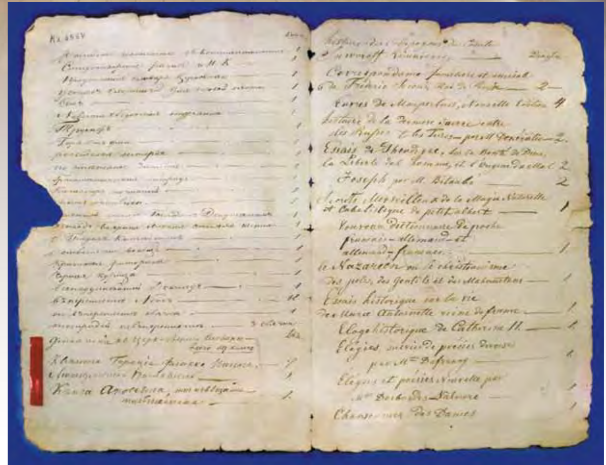
Автограф А.С. Пушкина на «Реестре книг у г[осподина] А.С. Пушкина». 1834

Из зала «Эпоха Пушкина» переходим в комнаты на антресолях, посвященные детству поэта. Они воссоздают атмосферу московского дома Пушкиных. В шкафах – книги, журналы, альманахи, повторяющие те, что были в библиотеке отца