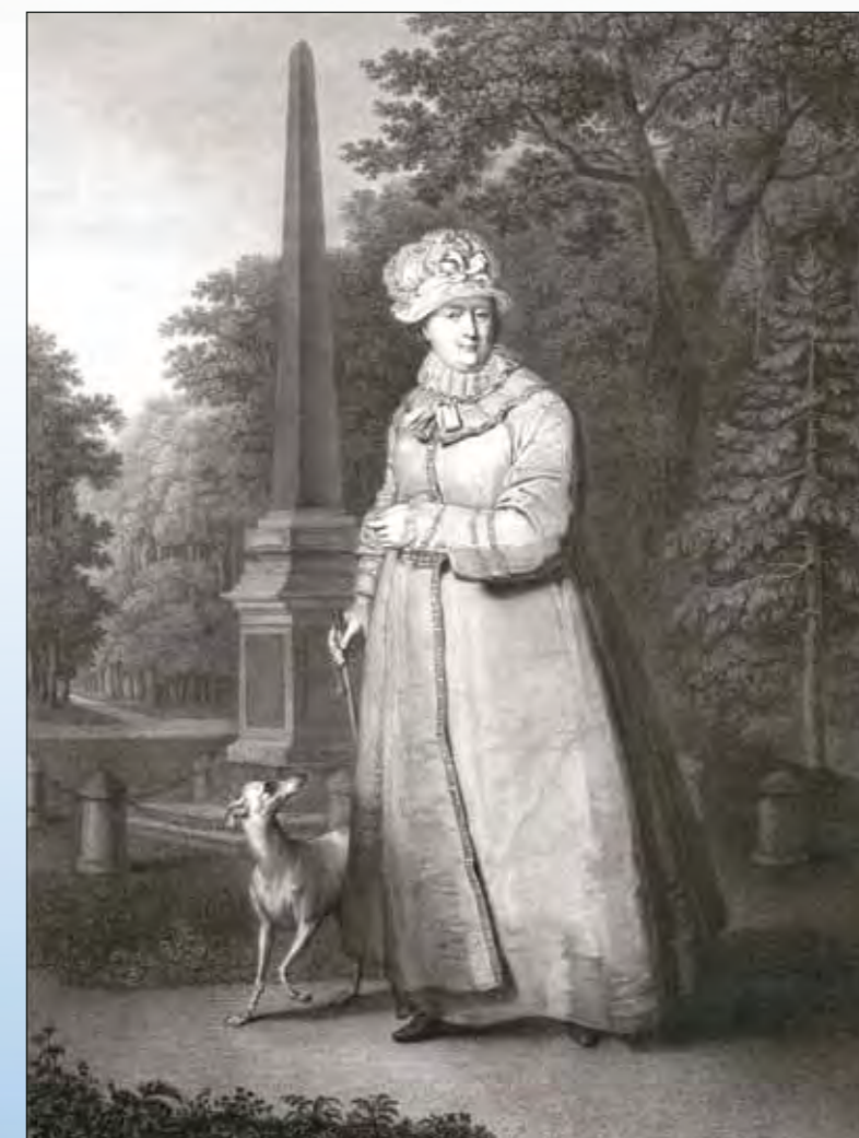
Н.И. Уткин с оригинала В.А. Боровиковского. Императрица Екатерина II. Гравюра. 1827

питанская дочка», где русские национальные типы выведены контурно и живо и где за переплетением земных коллизий, романтической и исторической, ясно видится иная, более серьезная вечная русская тема: взаимодействие высшего идеала, общества и личности. В неглубокой нише: два портрета и шпага середины XVIII века – символ дворянской чести, которую Гриневу удалось сохранить незапятнанной. Сле-