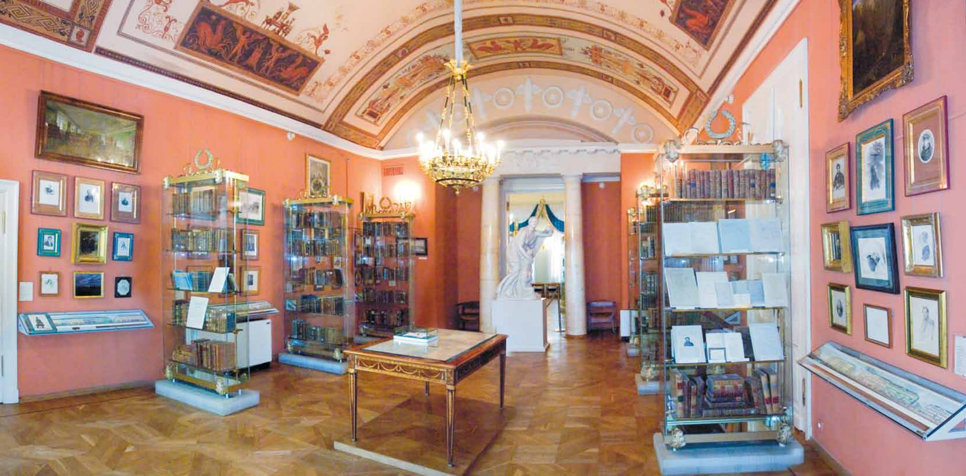
Зал «Последние годы». На столе – перо, принадлежавшее А.С. Пушкину

ва и справа – два противоборствующих лагеря: сцены пугачевского бунта, портрет главного бунтовщика, с которого была сделана иллюстрация к первому изданию «Истории Пугачева», а по другую сторону – принимавшие участие в подавлении бунта военные и императрица Екатерина II (гравюра Н.И. Уткина с картины В.Л. Боровиковского), гуляющая с собачкой по Царскосельскому парку, какой ее изобразил Пушкин в «Капитанской дочке».