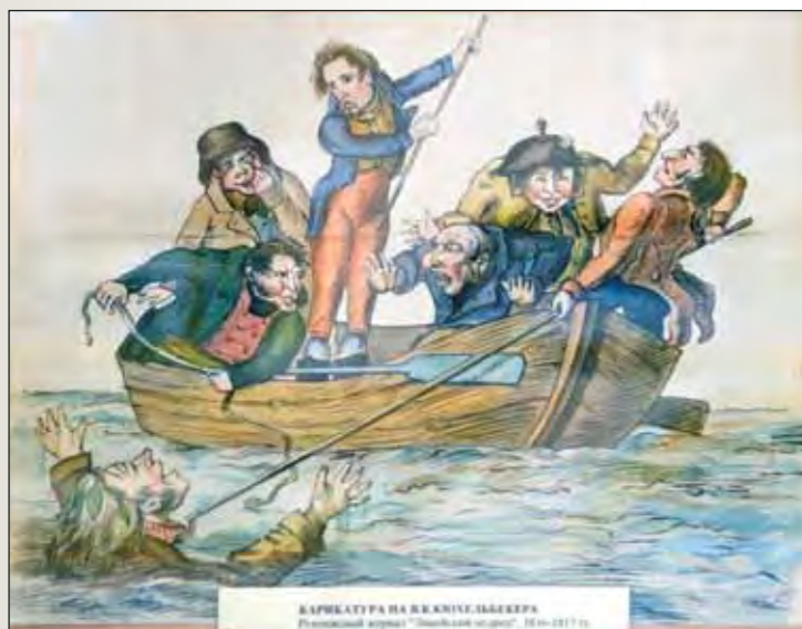
Карикатура на В.К. Кюхельбекера. Рукописный журнал «Лицейский мудрец». 1816–1817

щую к прихожей огромную танцевальную залу. Высокие зеркала, яркое сияние хрустальных люстр и светильников, начищенный до блеска паркет... Бальные платья, военная форма и изысканные фраки воспроизведены по модным картинкам журналов XIX века. Так одевались друзья и знакомые Пушкина, так одевался и он сам, направляясь на светский бал или званый вечер.