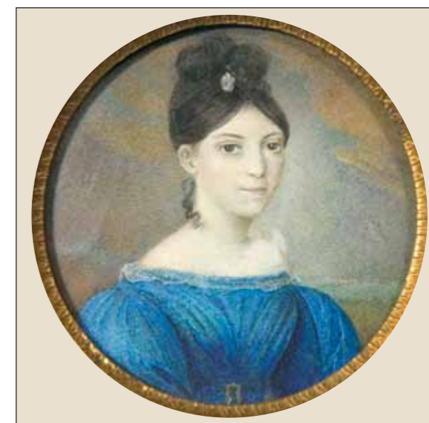
Неизвестный художник. Портрет девушки на фоне пейзажа. Кость, акварель, гуашь. Вторая половина 1820-х гг.