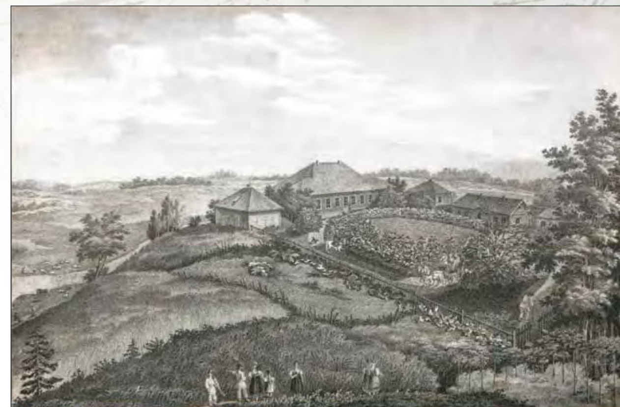
П.А. Александров. Сельцо Михайловское. Литография. 1838