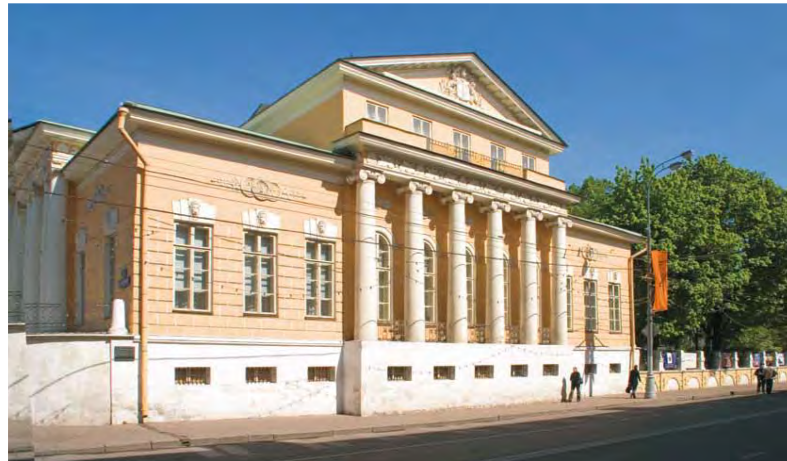
Фасад особняка Хрущевых-Селезневых со стороны Пречистенки