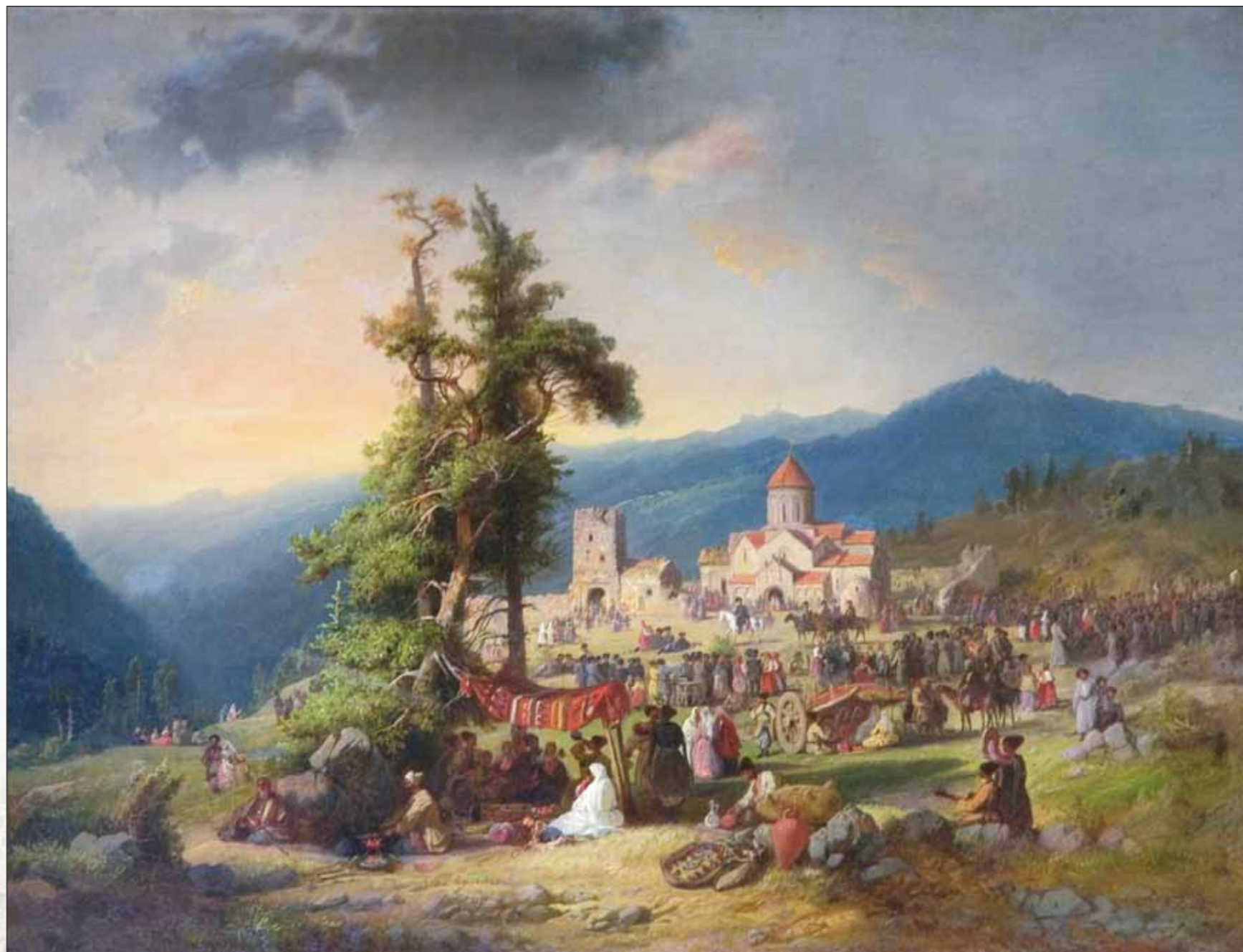
К.Н. Филиппов. Грузия. Пейзаж. Холст, масло. 1858