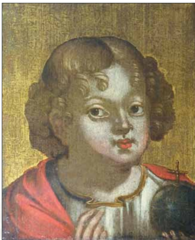
Неизвестный художник. Царевич Петр Алексеевич. Дерево, масло, темпера. 1670-е гг.

После реконструкции в музее появилось огромное дополнительное пространство – все помещения объединил крытый стеклянный атриум (раньше в усадьбе был внутренний дворик с палисадником). Теперь здесь устраиваются новогодние, лицейские, выпускные балы в духе