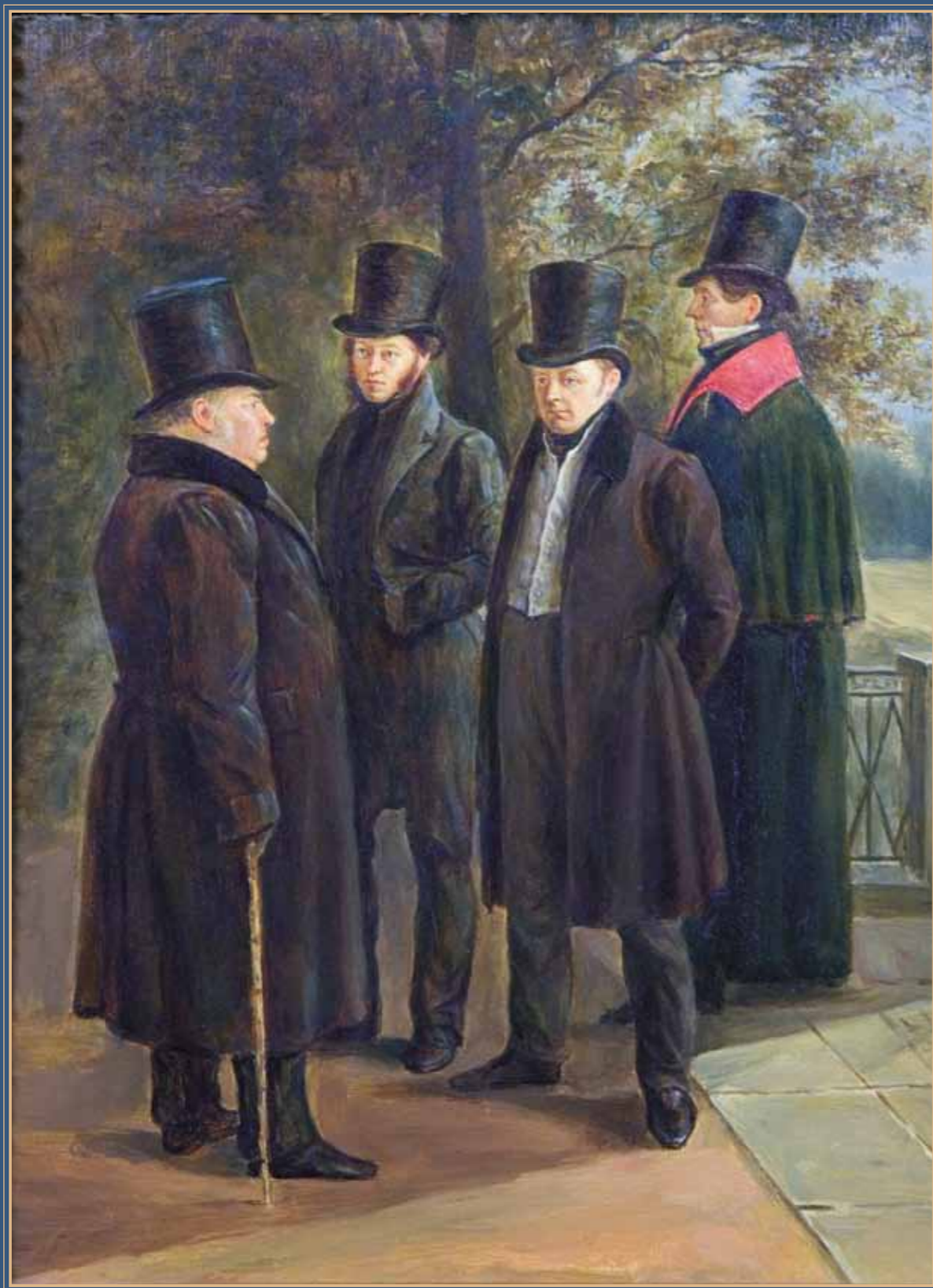
Г.Г. Чернецов. Пушкин, Крылов, Жуковский и Гнедич в Летнем саду. Картон, масло. 1832