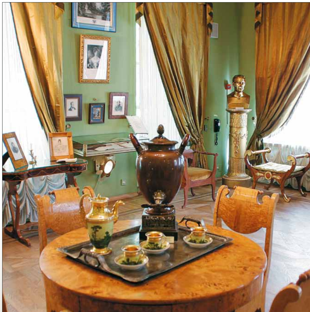
Фрагмент интерьера угловой гостиной. В центре стола самовар, находившийся в семье Олениных