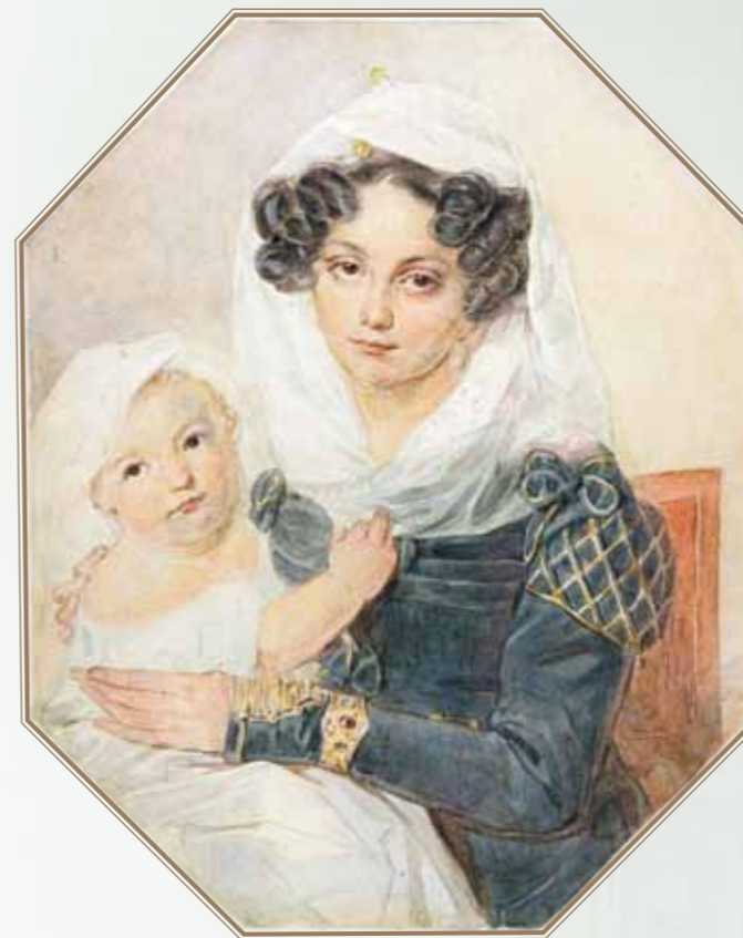
П.Ф. Соколов. Княгиня М.Н. Волконская с сыном. Акварель. 1826