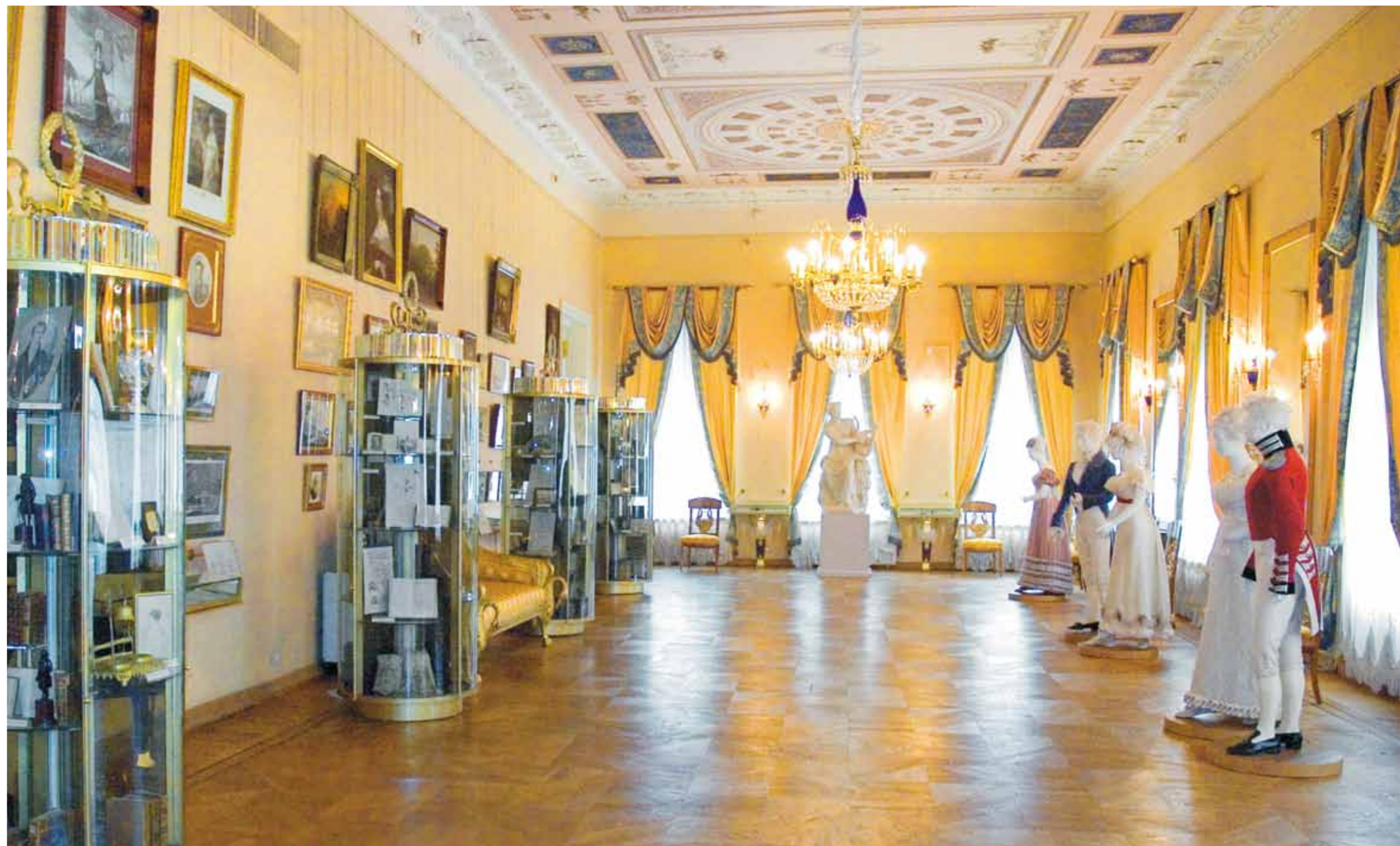
Бальный зал Государственного музея А.С. Пушкина

Внимание гостей музея неизменно привлекает экспозиция, посвященная Царскосельскому лицейу. Лицей был создан для воспитания юношества, «особо предназначенного к важным частям службы государственной». Одиннадцатилетнего Александра отвез туда его дядя Василий Львович Пушкин. Под сенью царскосельских садов, сохраненных для потомков на постелях Ж.Б. Траверса и литографиях А.Е. Мартынова, раскрашенных акварелью, Пушкин-ли-