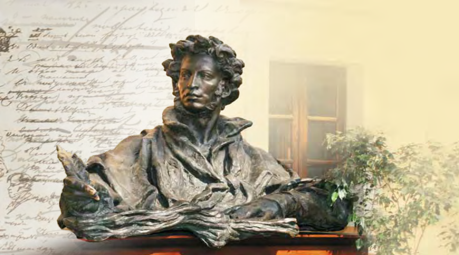
Портрет А.С. Пушкина скульптора Е.Ф. Белашовой. Бронза. Отлив 1999 года по модели 1954 года

сии в московском Музее А.С. Пушкина», для которой российские музеи представили ценнейшие реликвии из своих фондов.