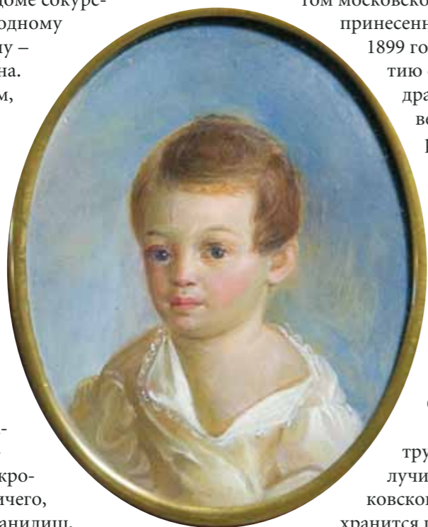
Ксавье де Местр. Пушкин-ребенок. Металлическая пластина, масло. 1801–1802

Традиция живого, полнокровного общения и взаимодействия с гостями музея – основа, на которой Дом Пушкина строит свою работу. После проведенной в 1996–1999 годах реконструкции у музея появилось много новых возможностей. Когда-то экспозиция занимала восемь залов, теперь их пятнадцать; отреставрировано главное здание усадьбы, восстановлены флигели, отремонтированы мезонин и цокольный этаж – там проводятся сменные выстав-