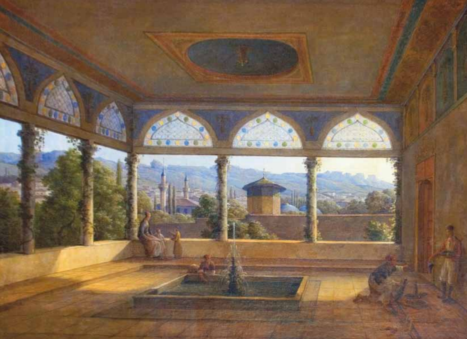
Н.Г. Чернецов. Вид Бахчисарайского дворца. Холст, масло. 1837

В собрании музея – первое издание поэмы «Руслан и Людмила», рукописные варианты написанных в 1820-е годы стихотворений. Рукописи поэта хранятся в Петербурге, в Пушкинском Доме, а в московском музее экспонируются копии, но их почти невозможно отличить от оригинала, поскольку они выполнены на бумаге пушкинского времени: «...во времена Пушкина писали на тряпичной бумаге, отличающейся шершавостью, имеющей различные оттенки <...> Изготовить такую бумагу в наше время, да еще в необходимом <...> количестве, практически невозможно. Старинная бумага выискивалась в государственных архивах, и для музея в виде исключения из хранимых дел изымали чистые листы» 13 .