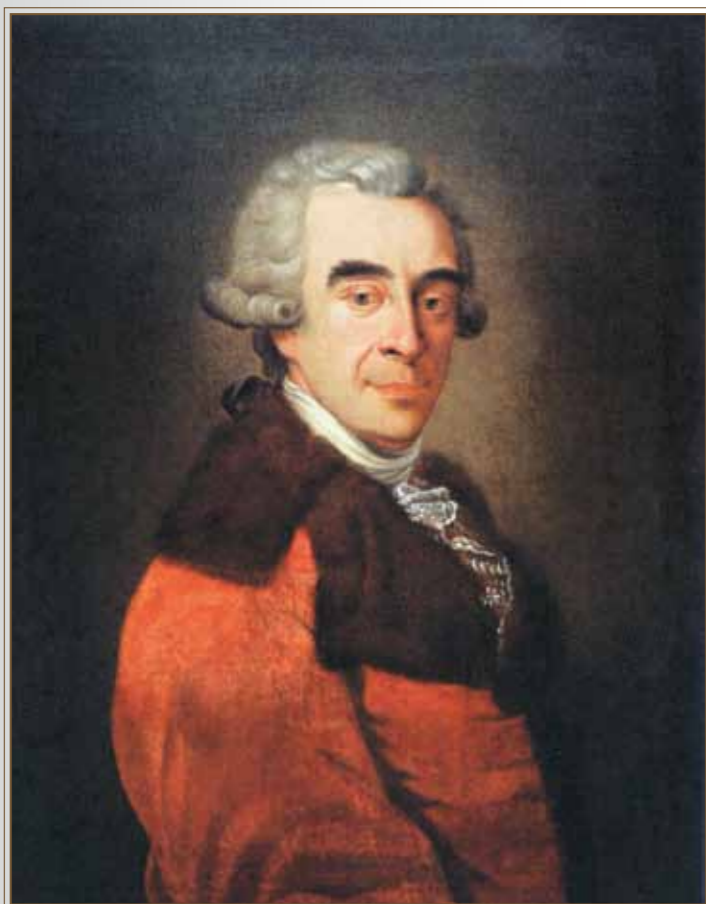
Неизвестный художник. Портрет князя Н.С. Волконского. Начало XIX в.

родились их пятеро детей: четыре сына, Николай, Сергей, Дмитрий, Лев, и дочь Мария.