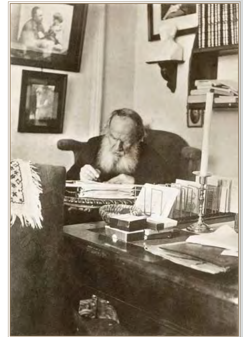
Л.Н. Толстой за работой. 3 ноября 1909 г.

он доволен и будет принимать участие в семейном обеде; если в сторону спальни – все придется переделывать, значит, пойдет в конюшню, запряжет лошадь и поедет общаться с природой.