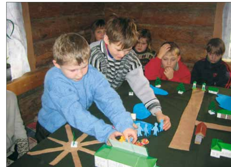
«Мы строим усадьбу» — занятие для детей проводят сотрудники отдела музейной педагогики

Деятельность яснополянцев широка и многообразна, потому что опирается на мощь и широту наследия великого писателя. Музей реализует самые разные проектные инициативы — от курсов русского языка для иностранцев до международного фестиваля Крапивы в уездном городе и съезда потомков Толстого; от семинаров для текстологов и переводчиков Толстого до фестиваля лоскутного шитья и ежегодных писательских встреч под Веймутовой сосной перед Домом писателя... Праправнук Толстого унаследовал семейную склонность к «поэзии порядка». Выстраивать, восстанавливать естественную усадебную инфраструктуру Ясной Поляны приходится постепенно, преодолевая знакомые многим музеям ограничения, связанные с официальными представлениями о целевой и «нецелевой» музейной работе.