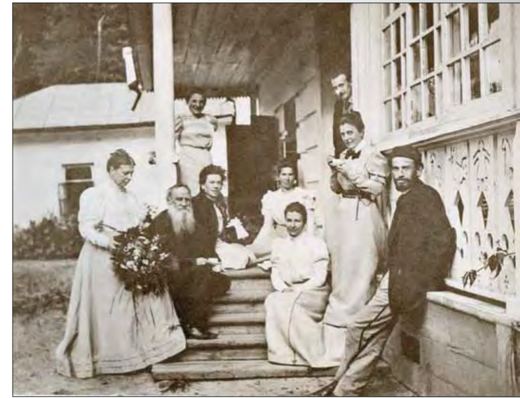
День рождения жены писателя. 22 августа 1898 г.

В библиотечной комнате дома собраны книги на разных языках, которые Лев Николаевич Толстой собирал на протяжении жизни. Домашнюю библиотеку в Ясной Поляне начал собирать еще его дед, за ним – мать Льва Николаевича Мария Николаевна. Но сын превзошел их всех. К концу жизни в Ясной Поля-