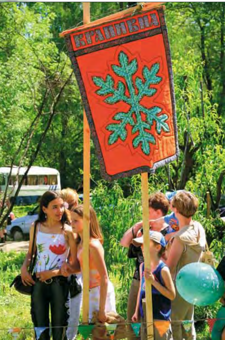
Фестиваль Крапивы в г. Крапивна Щекинского района Тульской области. 2007