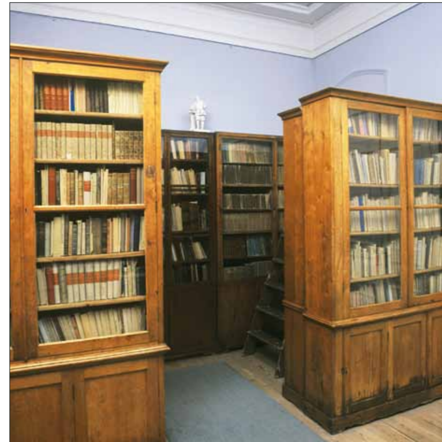
«Верхняя библиотечная» в яснополяском доме Л.Н. Толстого

не было собрано двадцать три тысячи «нужных» книг, которые размещались в двадцати восьми шкафах. В библиотечной представлены только девять из них – с книгами, имеющими пометки Льва Николаевича на полях.