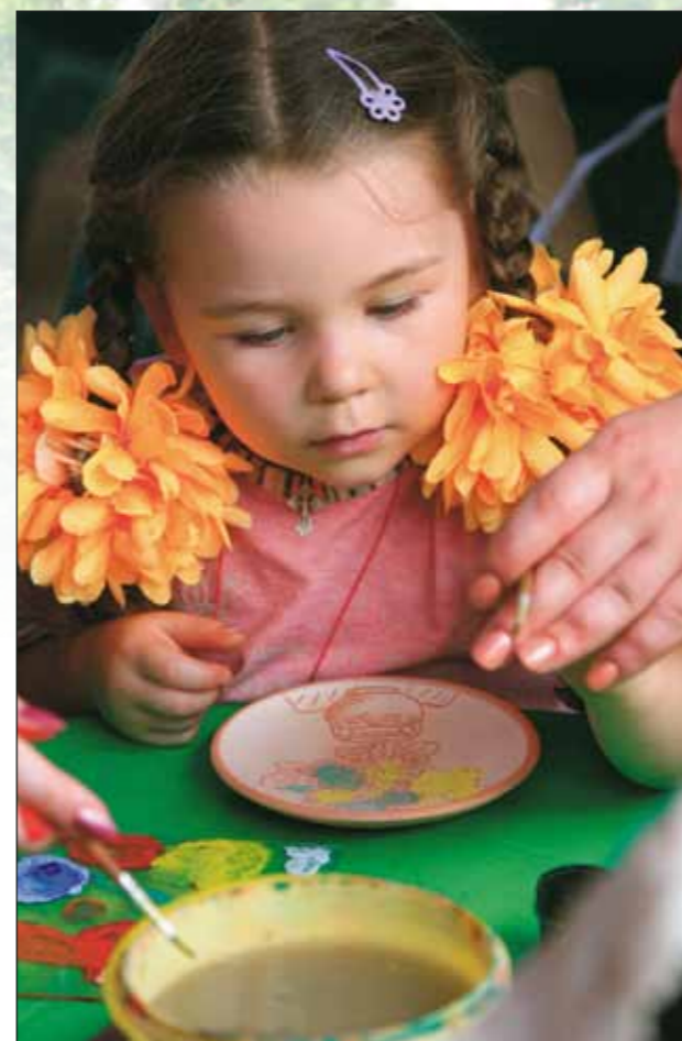
Занятие для детей в отделе народного творчества музея-усадьбы А.Н. Толстого

Вот уже семь лет музей «Ясная Поляна» продвигает на местном, российском и международном уровне идею возрождения уездного города Льва Толстого как города-музея под открытым небом, способного стать в перспективе крупным культурным, образовательным и туристическим центром. Главная забота музея и его партнеров — сохранить целостный культурный ландшафт Крапивны, скромное обаяние русского провинциального городка второй половины XIX столетия, узнаваемого по рассказам Успенского, Чехова и Салтыкова-Щедрина. Как ни парадоксально, Крапивна уникальна сво-