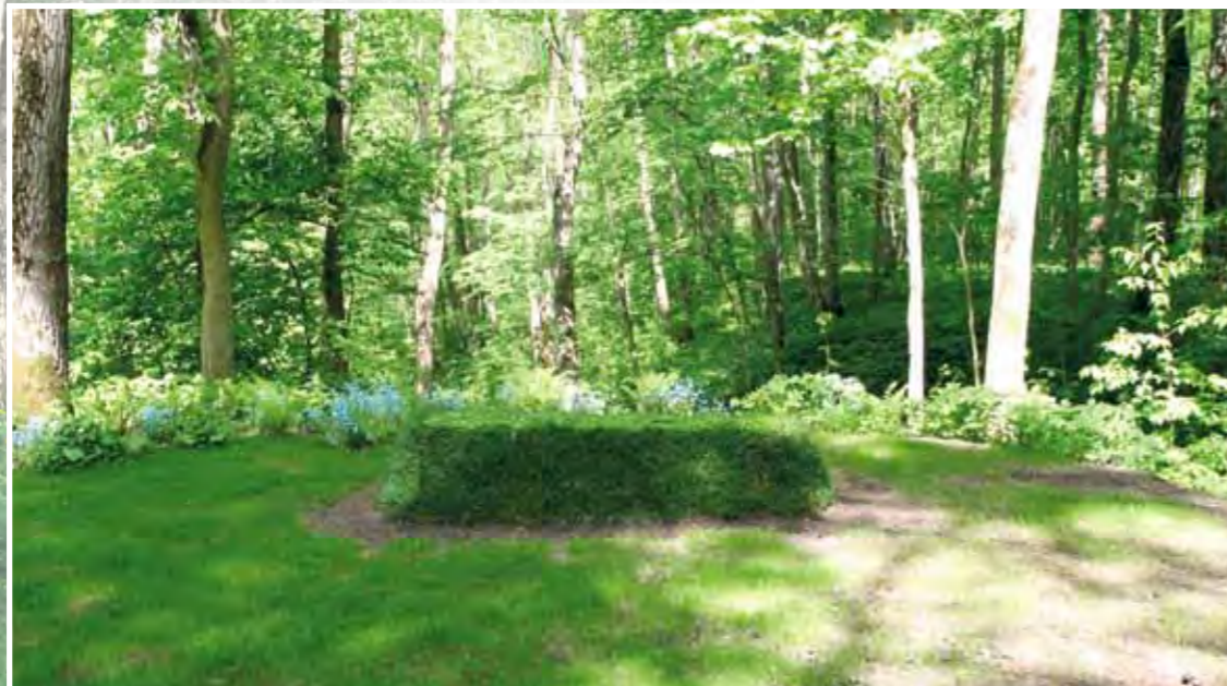
Могила Л.Н. Толстого

Прешпект и действительно как будто оказываются в другой реальности... Это очень важно».