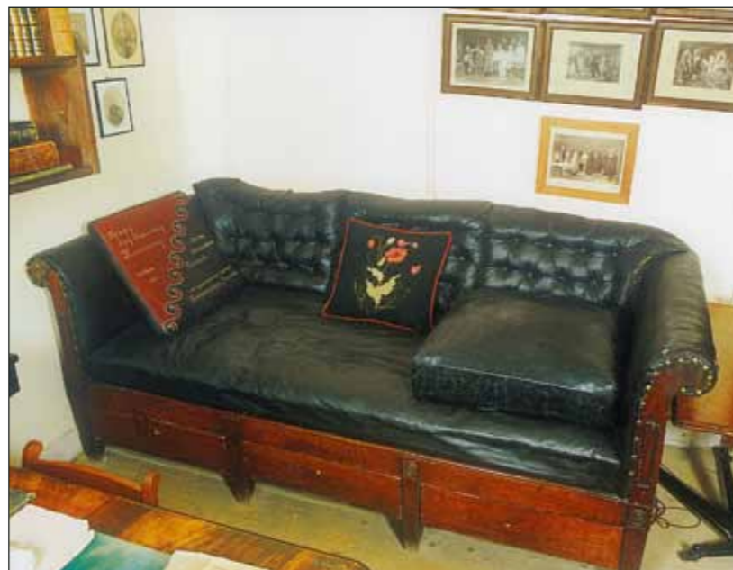
Диван, на котором родился А.Н. Толстой

Комната отражает метаморфозу, произошедшую с Толстым. В молодые годы граф Лев Николаевич одевался у лучших московских портных, о человеке он мог отозваться пренебрежительно лишь потому, что тот не носил белых перчаток и не говорил по-французски. Со временем у него в дневнике появилась запись: «Одна из ошибок людей заключается в том, что человек неправильно распределяет свое жизненное время. И в тот момент, когда