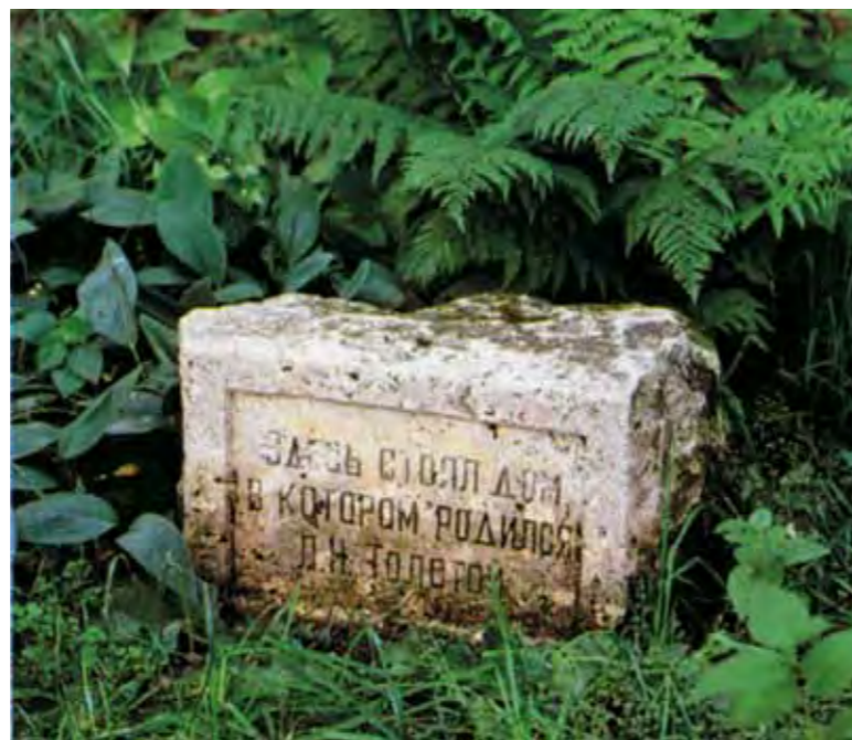
Камень на месте дома, в котором родился Л.Н. Толстой

лета. «Ласковый, милый, старый» дом – таким предстает он на страницах трилогии «Детство», «Отрочество», «Юность».