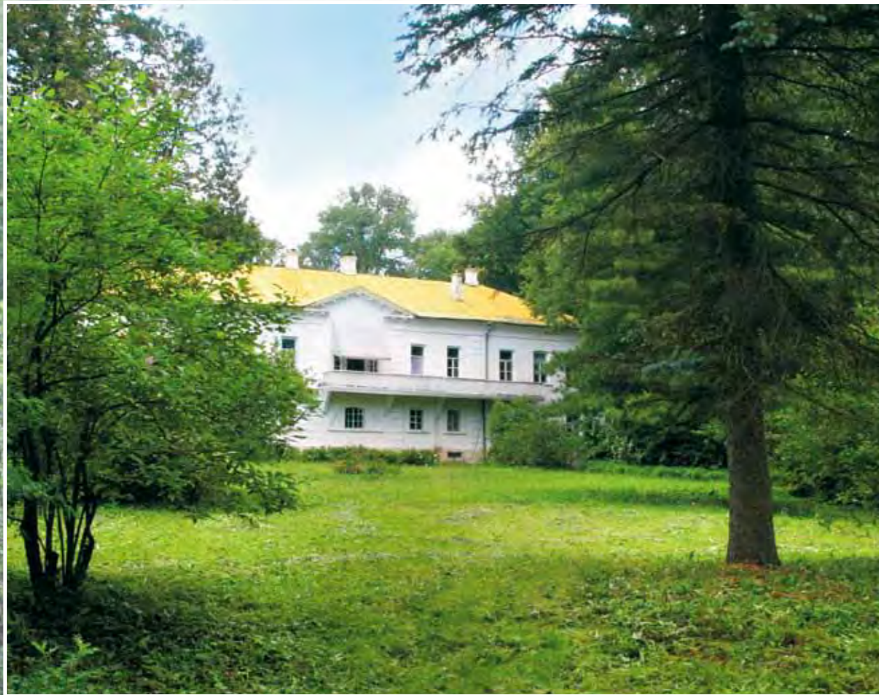
Вид на дом Толстого со стороны южного фасада

дены в доме Л.Н. Толстого сохранять какие-то веревочки, стеклянные колпаки, хотя свели систему ограничений к минимуму. Это необходимо просто потому, что очень много предметов – и мелких предметов – у нас находится в открытой экспозиции. Мы вынуждены их оберегать».