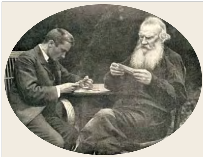
А.Н. Толстой со своим секретарем В.Ф. Булгаковым. Кочеты, 1910.