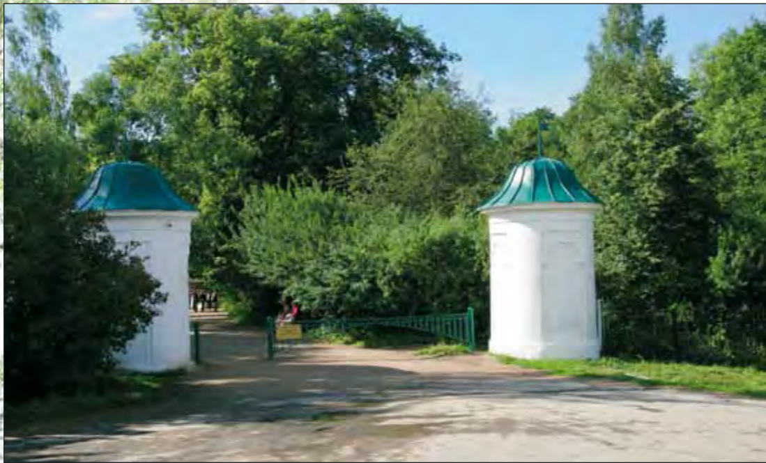
Башни при въезде в усадьбу Л.Н. Толстого