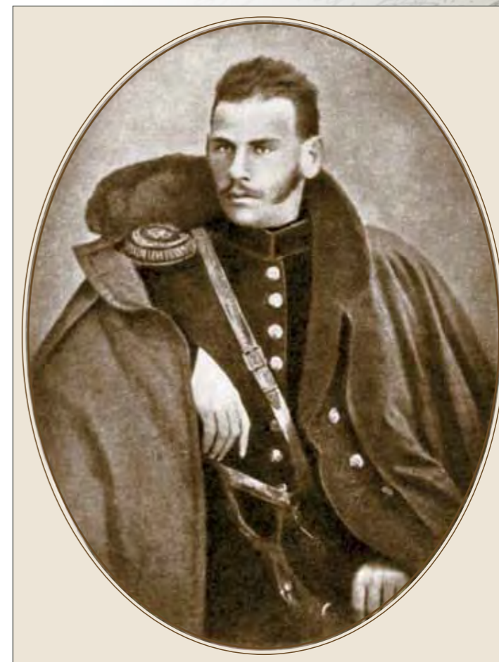
А.Н. Толстой – прапорщик. Москва, 1854. Фото с дагерротипа

Все предметы в экспозиции «извлечены» из художественных произведений, дневников, писем Льва Николаевича. На выставке нет того, что напрямую не связано с Толстым. Представленные