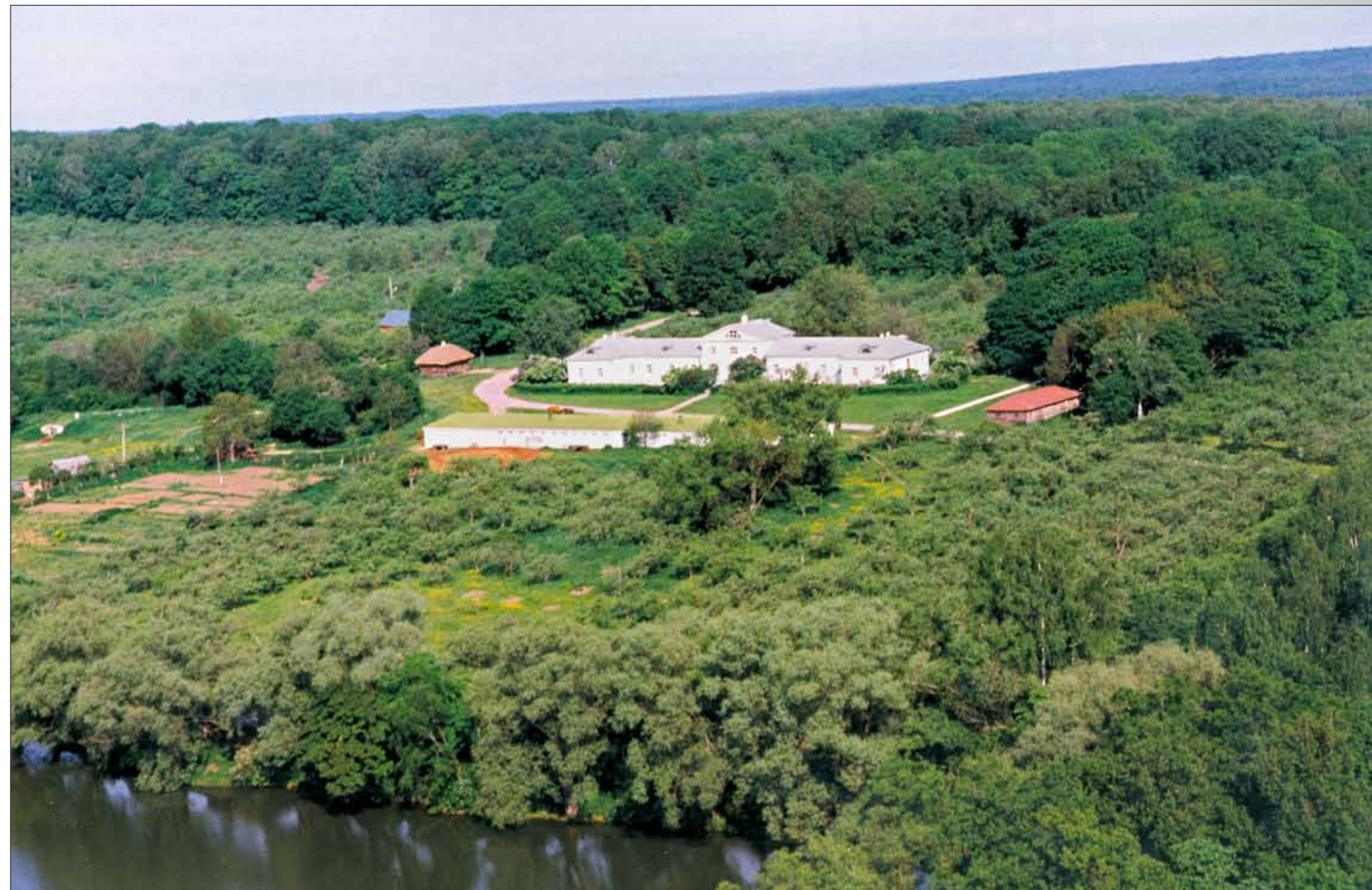
Панорама усадьбы (аэрофотосъемка) ▶