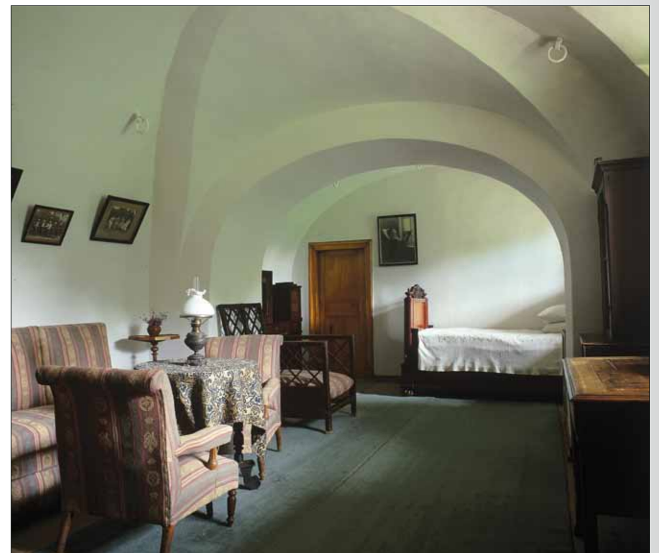
Комната «под сводами»