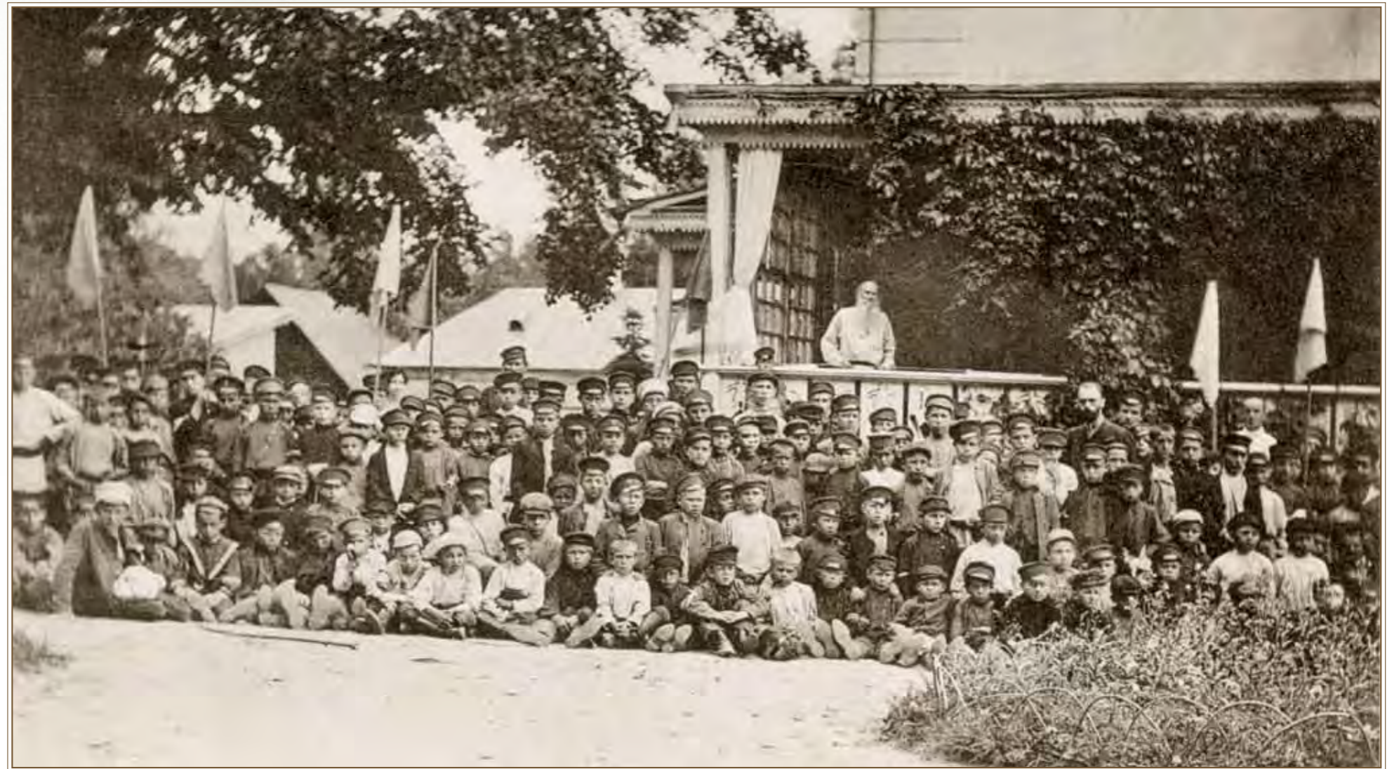
Тулские школьники в гостях у Толстого. 26 июня 1907 г.

Такие места, как Ясная Поляна, не должны меняться, подражать, подстраиваться под время, а сохранять и восстанавливать культуру прежних отношений. Хотя бы для того, чтобы люди, вырывающиеся из тисков большого города и приезжающие сюда на пару часов, «почувствовали разницу». Они минуют башни въезда, выходят на