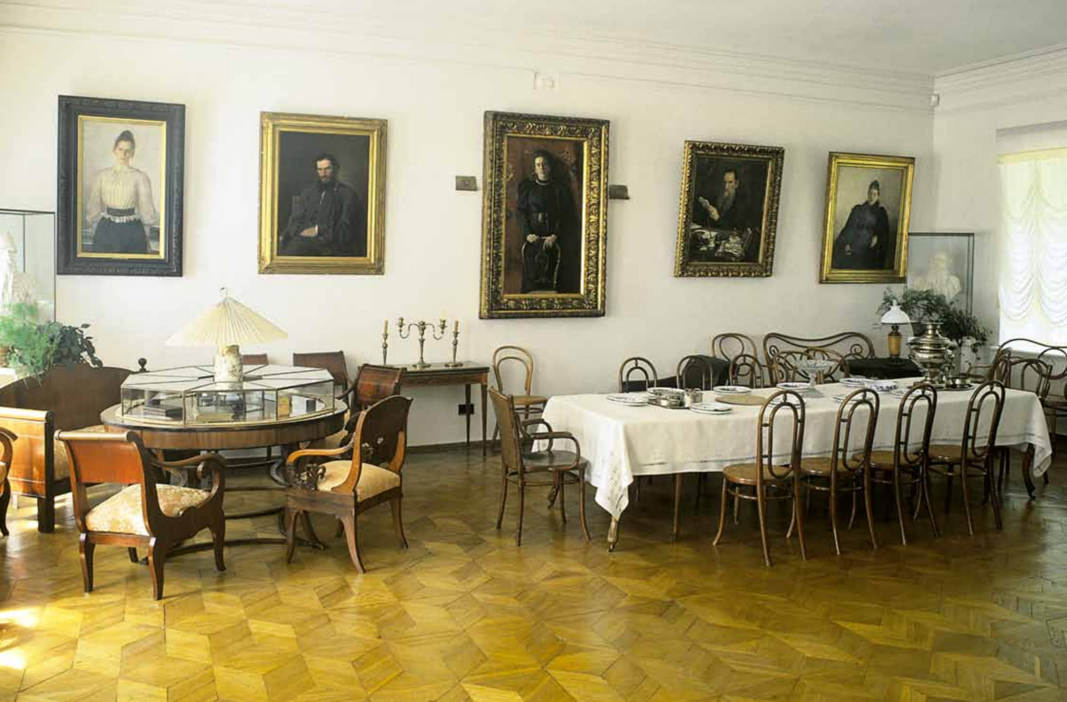
Зал «Уголок серьезных разговоров»

Из дневника 1889 года: «Надо все дело жизни сосредоточить на любовном воздействии на Соню».