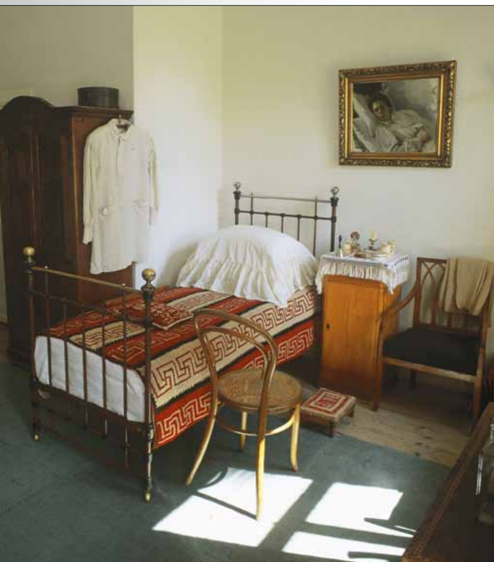
Спальня А.Н. Толстого