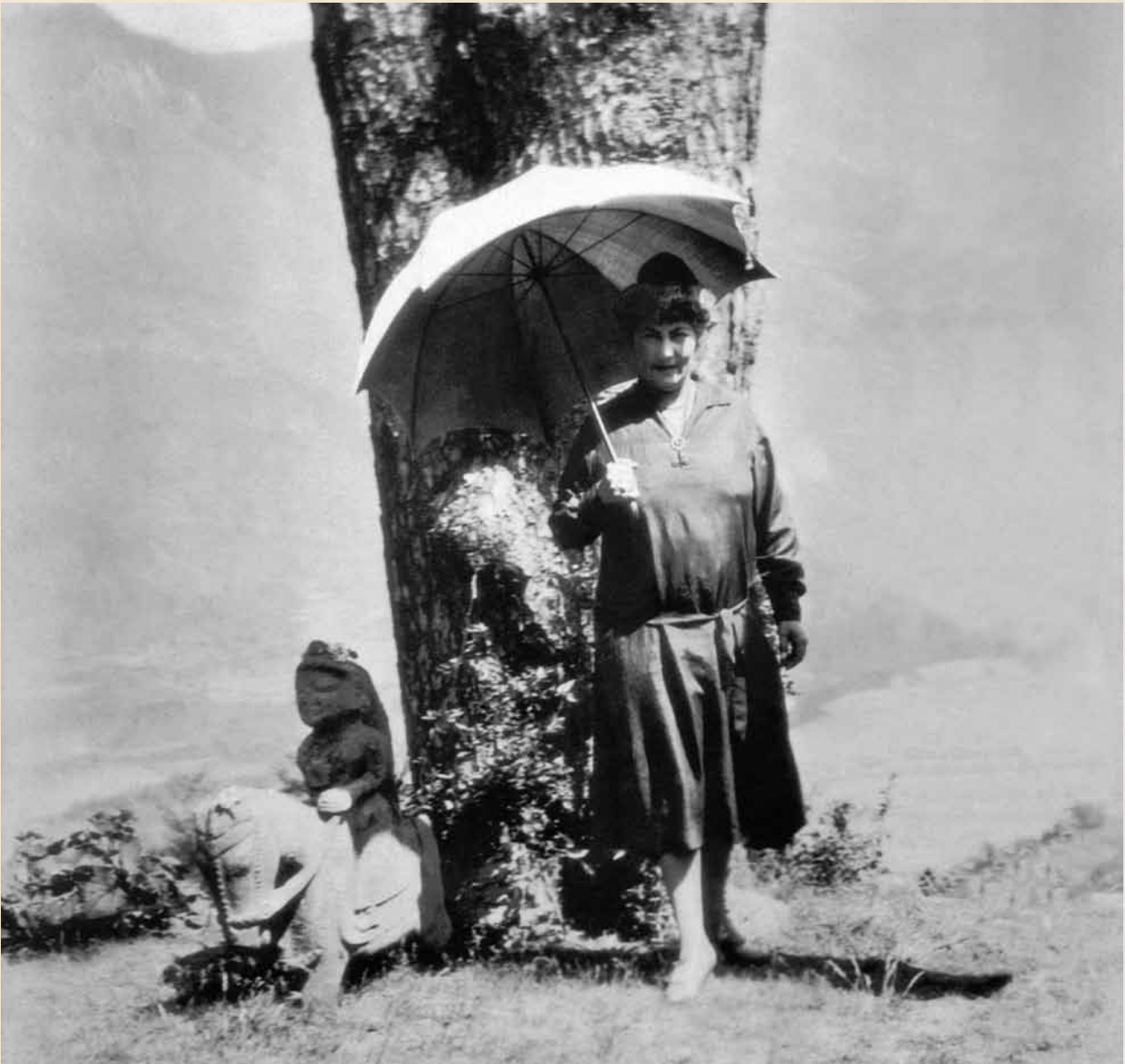
Елена Ивановна Рерих в Кулу. [1929–1931]

Христианская православная так называемая «умная молитва», или «умное делание», не есть ли это повторение Имени Гуру или непрестанное памятование о Гуру, Учителе? Каждая эпоха имеет свое выражение любви и преданности, но кто может сказать, которое выше? Ведь сила, мощь и красота выражения измеряются мерами Надземными, и каждый может вылить свой восторг только в форме, наиболее отвечающей его сознанию. Меры Надземные так разнятся от наших земных!