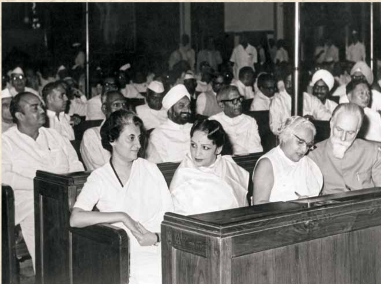
Церемония открытия портрета Дж. Неру кисти С.Н. Рериха в центральном зале Парламента Индии. Слева направо: Индира Ганди, Девика Рани Рерих, Виджайя Пандит, Святослав Николаевич Рерих. Дели, 5 мая 1966 г.

Затем весь день работаем в области культуры: выполняем заказы на статьи мужа, посылаем извещения в индийские журналы и за границу, посещаем собрания и художественные школы, где ждут совета от мужа, и одновременно происходит