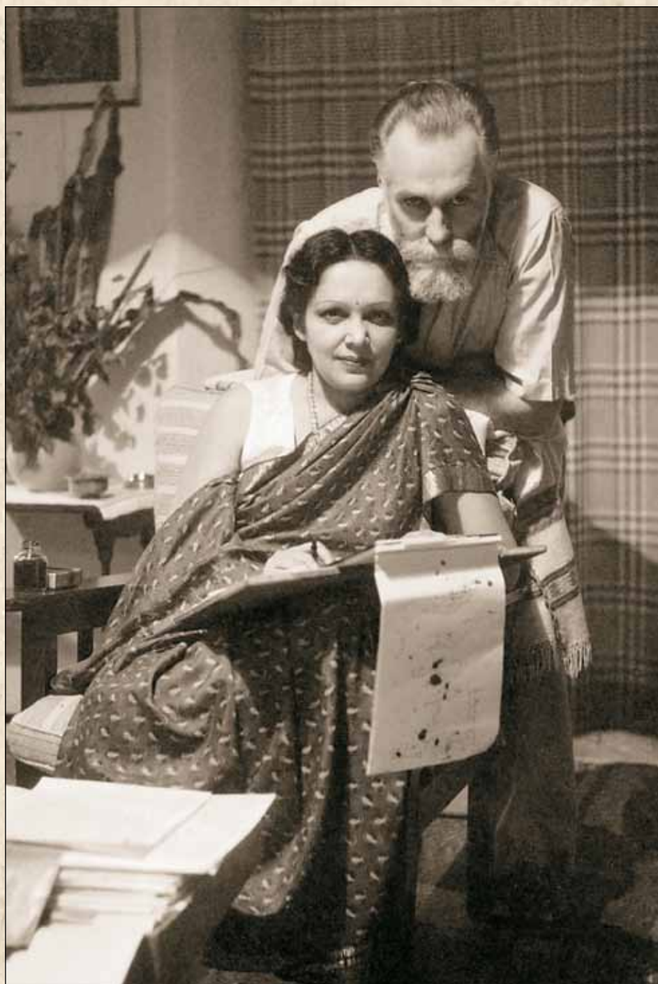
Девика Рани и Святослав Рерих. ▶ Начало 1960-х гг.

Другой случай. Когда на съемке артист по сценарию должен броситься с какой-то высоты, внизу его ловят в натянутую сеть. Девика Рани бросилась со скалы, а рабочих внизу не оказалось. Она разбилась, но выжила.