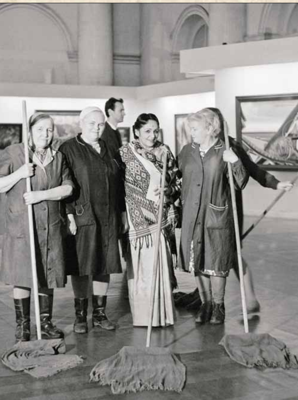
Накануне открытия персональной выставки С.Н. Рериха. Эрмитаж, 15 января 1975 г.

Простая, ласковая и доброжелательная ко всем, она умела незаметно, без всякого нажима защитить не только других, но и С.Н. Рериха.