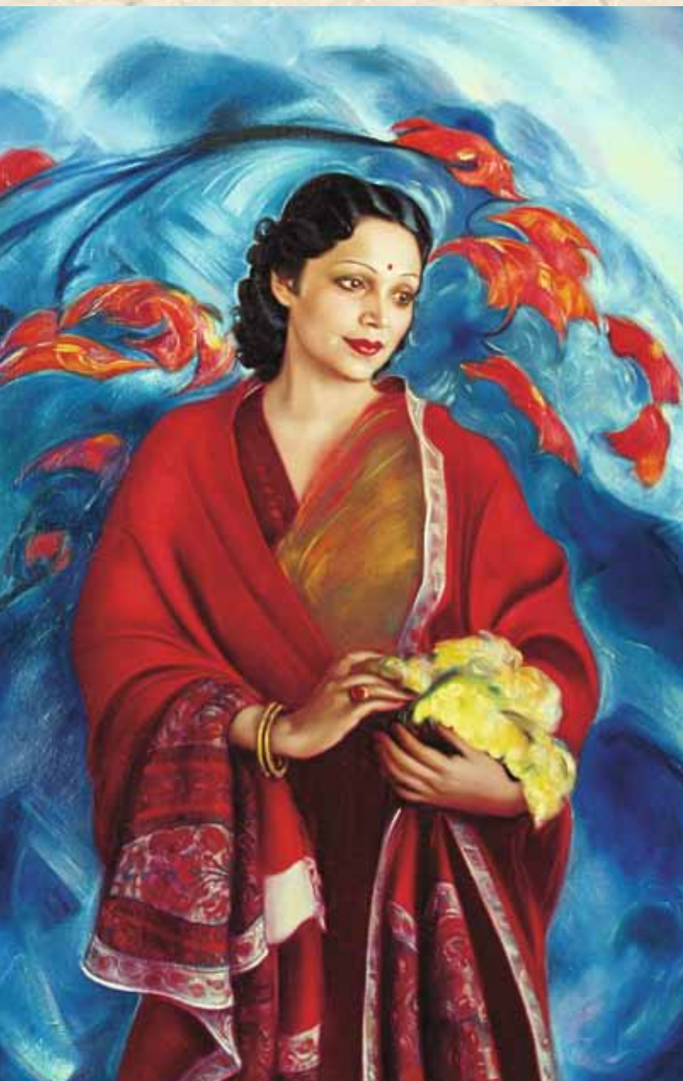
Святослав Рерих. Портрет Девики Рани. 1951

Это была очень красивая, небольшого роста, с большими темными внимательными глазами, удивительно яркая женщина. Поведение ее и поступки тоже всегда были красивыми и благородными. Ничего театрального или искусственного, никогда никакой суеты.