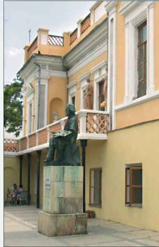
Картинная галерея имени И.К. Айвазовского. Феодосия

Вообще в Феодосии хорошо, особенно в июне и ранней осенью, когда народу немного. Приезжайте и увидите сами!