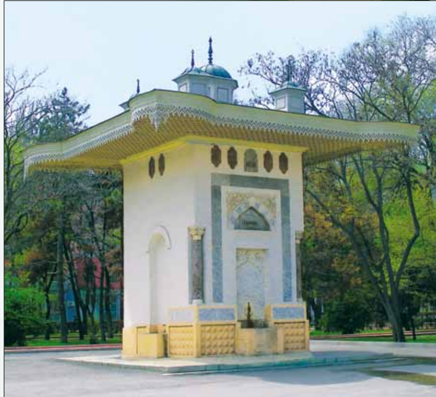
Старый фонтан И.К. Айвазовского. Феодосия, Крым