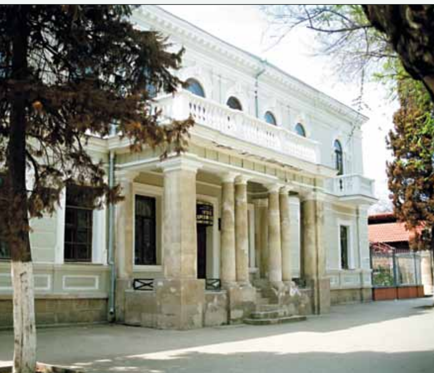
Краеведческий музей. Феодосия

Задача 10 (трудная). Ночью, когда продавцы и покупатели уходят домой, игрушки оживают. Они устраивают балы, аттракционы, снимают кино игрушечной кинокамерой, ставят спектакли в игрушечных театрах, устраивают гонки.